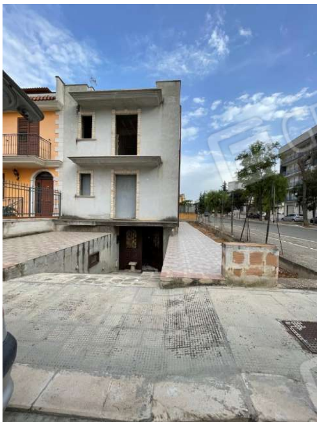
Figura 3. LOTTO UNICO: Fabbricato unifamiliare in cui si trovano gli immobili pignorati al F. 8, P.IIa 3929, Sub. 1 e 2 ubicati in San Ferdinando di Puglia (BT) alla Via V. Bachelet n. 2 e 4 (facciata prospiciente la Via V. Bachelet).