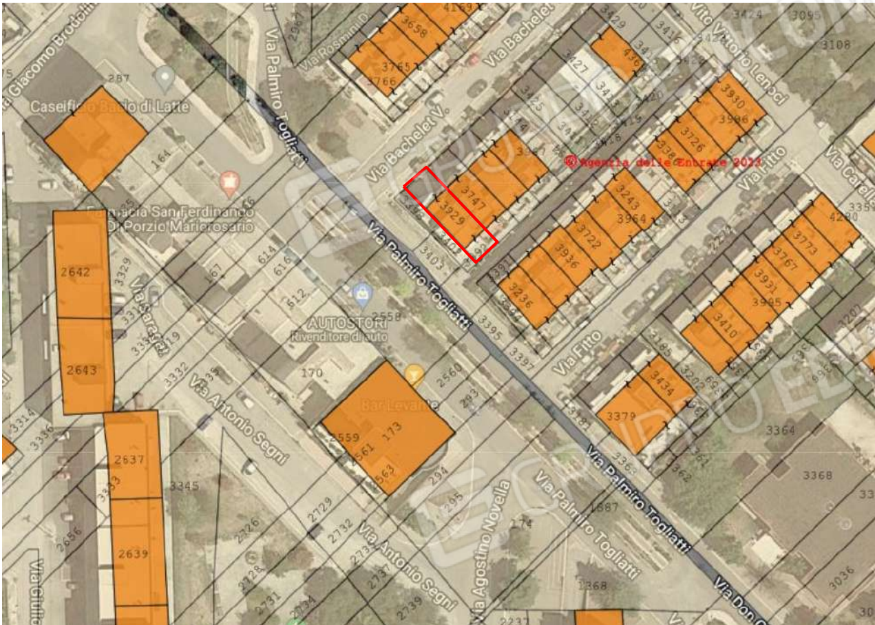
Figura 1. LOTTO UNICO: Ortofoto catastale degli immobili pignorati al F. 8, P.Illa 3929, Sub. 1 e 2 ubicati in San Ferdinando di Puglia (BT) alla Via V. Bachelet n. 2 e 4.