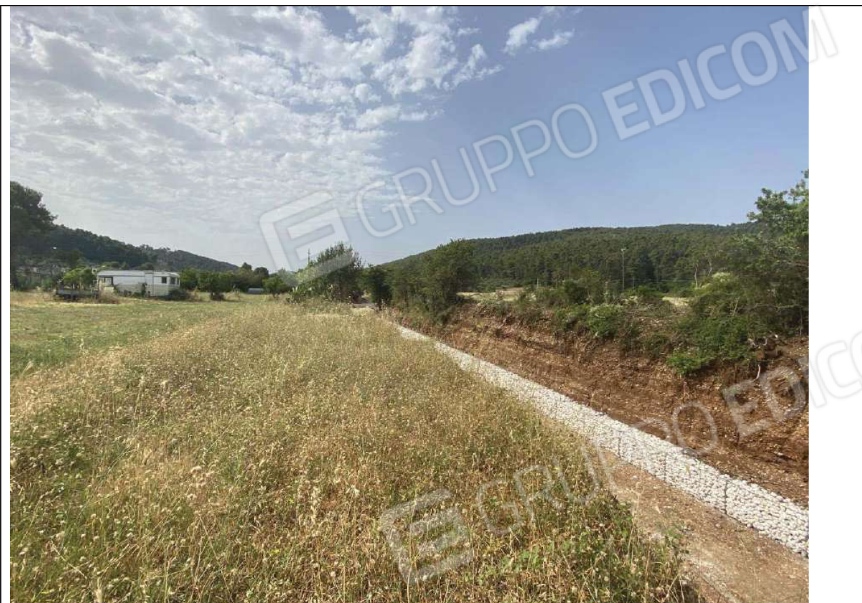
Foto 12) – Vista terreno p.lla 72 ( IMMOBILE B ) lungo confine con Fosso del Lampia