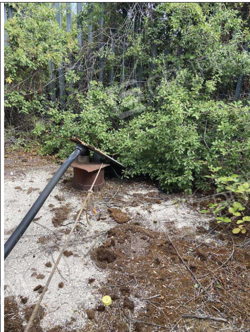
Foto 14) – Vista dettaglio pompa sollevamento su particella confinante priva di recinzione