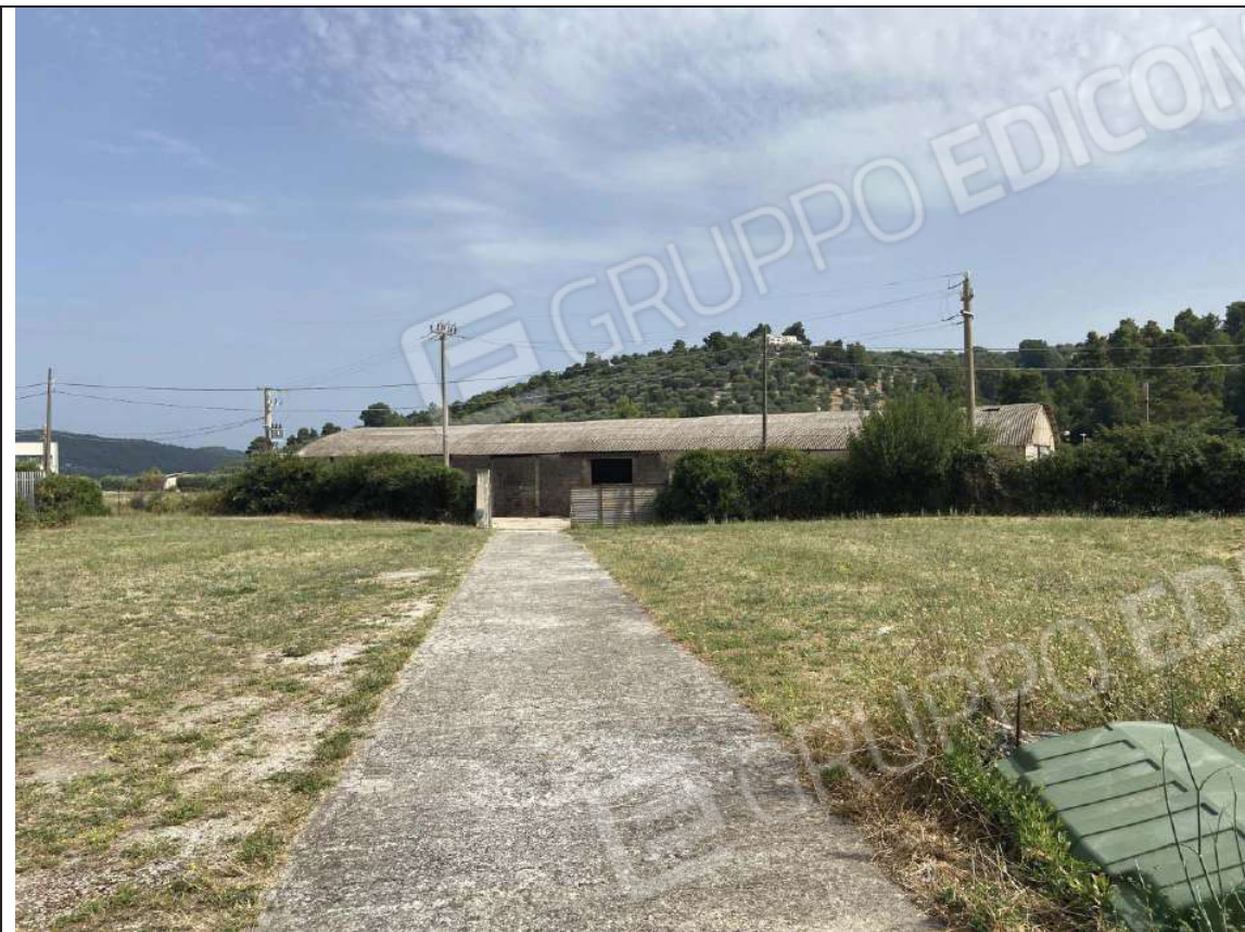
Foto 6) – Vista percorso in cemento di collegamento con IMMOBILE A attraverso IMMOBILE B