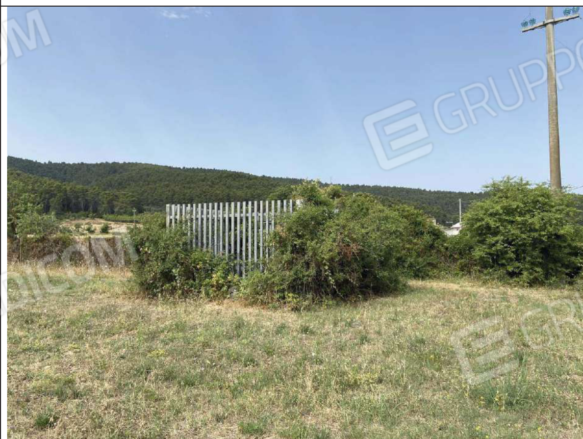
Foto 13) – Vista terreno p.lla 72 ( IMMOBILE B ) su p.lla 71 confinante priva di recinzione