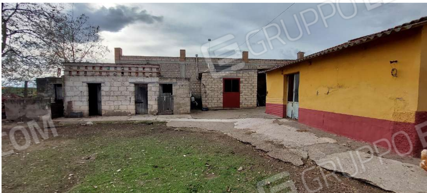
Cantina e pollai