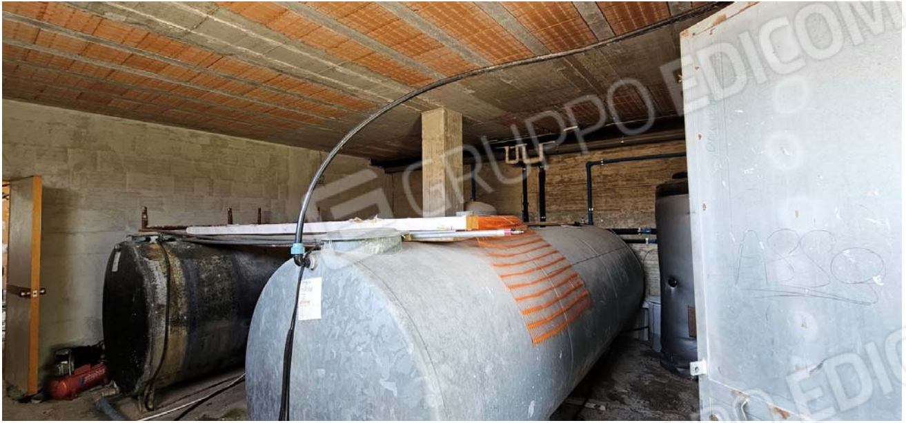
Vano difforme: deposito per riserve idriche, piano terra