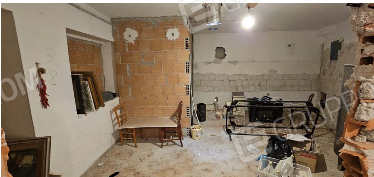
Vano difforme: magazzino piano primo