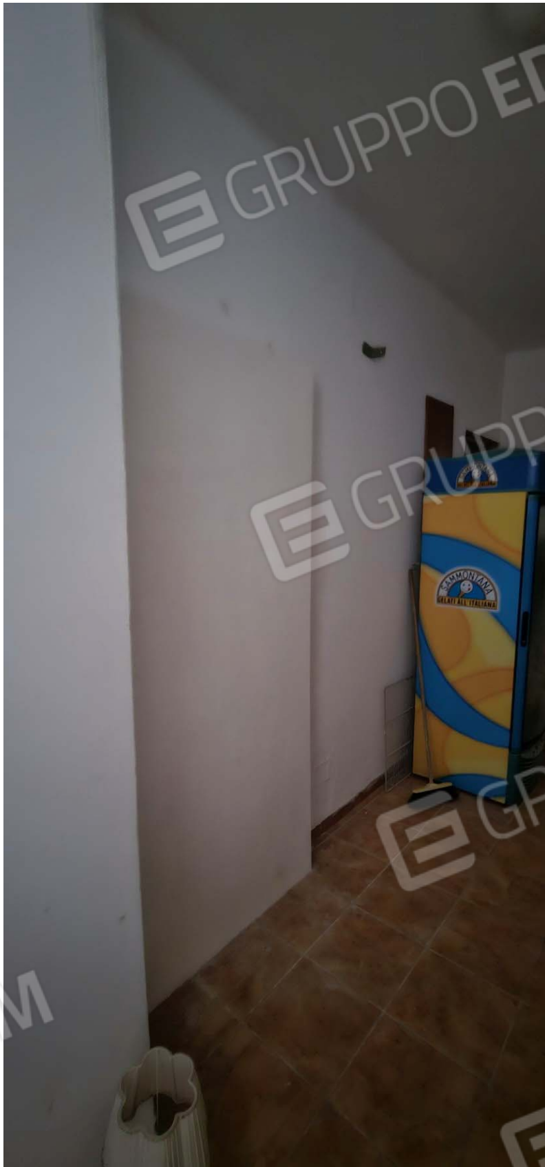
Vano difforme: magazzino piano primo