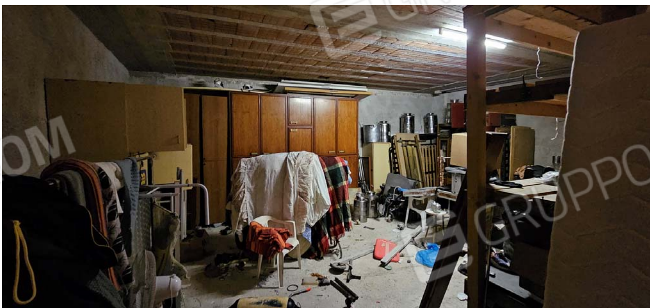
Vano difforme: deposito piano terra