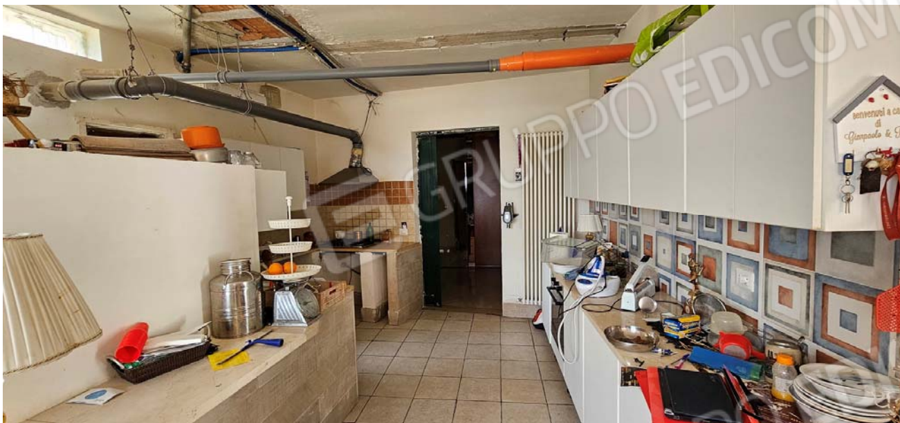
Vano difforme: alloggio, piano terra