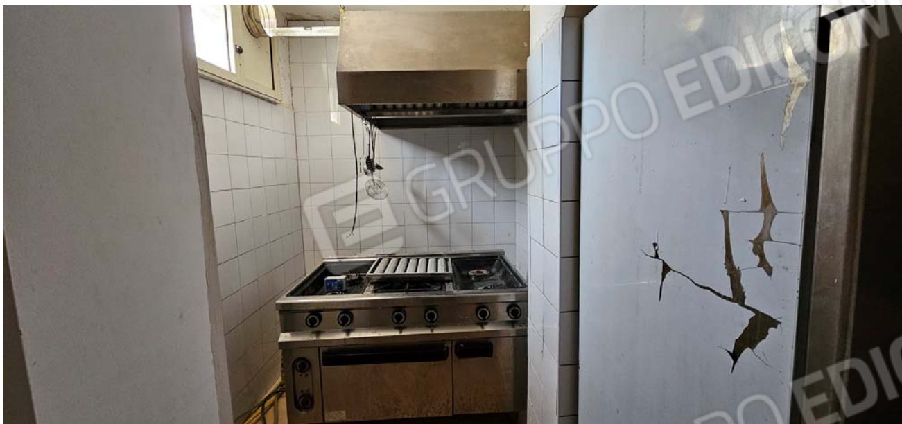
Vano difforme: cucina piano primo