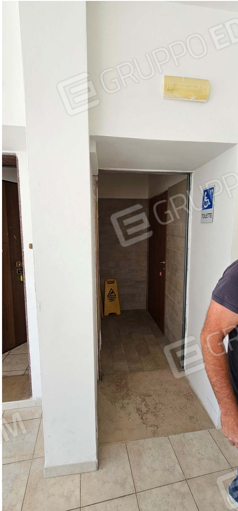
Vano difforme: bagni piano terra