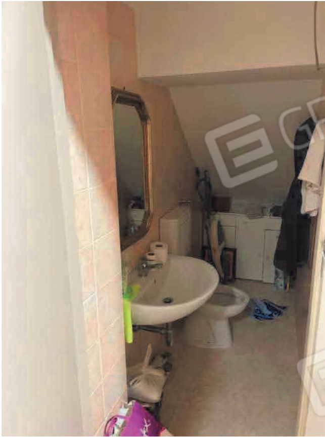
Figura 5. LOTTO UNO: Immobile pignorato al F. 31, P.Illa 3348, Sub. 4 ubicato in San Severo alla Via Francesco De Ambrosio n. 6 e 8 (bagno).