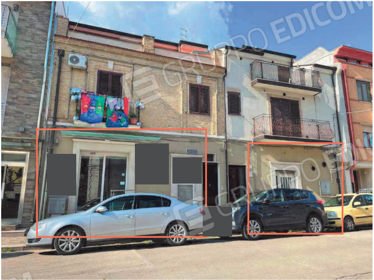
Figura 3. LOTTO UNO: Fabbricati in cui si trovano gli immobili pignorati al F. 31, P.Illa 3348, Sub. 4 e P.Illa 3349, Sub. 5 ubicati in San Severo alla Via Francesco De Ambrosio n. 6, 8 e 14.