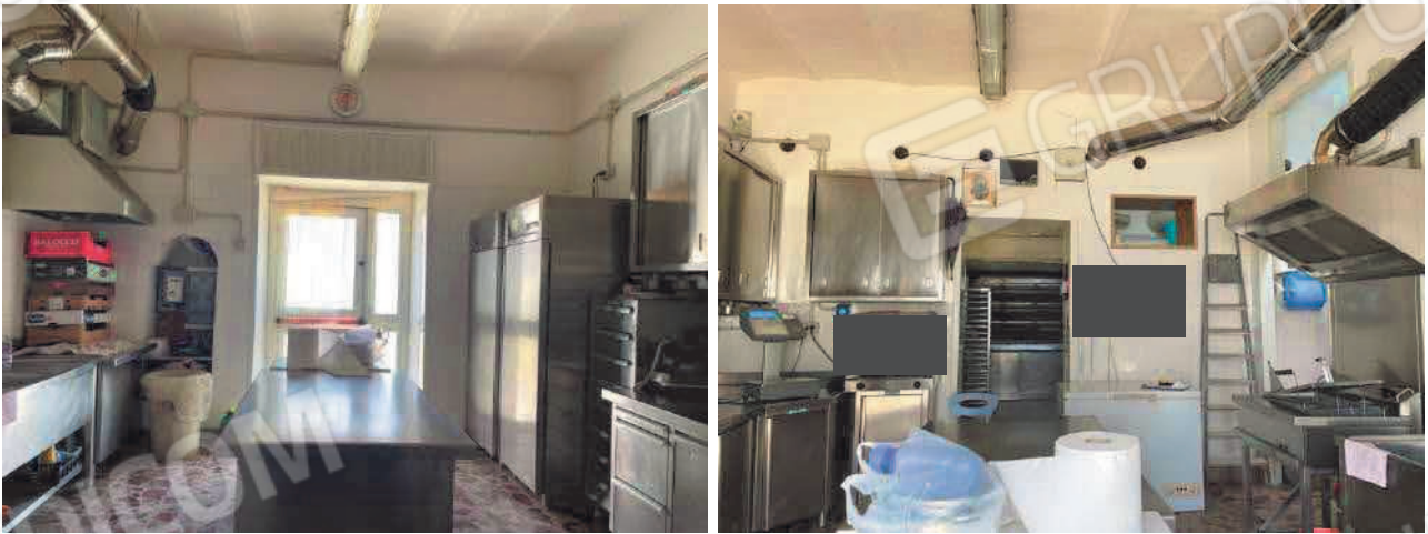
Figura 6. LOTTO UNO: Immobile pignorato al F. 31, P.Illa 3349, Sub. 5 ubicato in San Severo alla Via Francesco De Ambrosio n. 14 (laboratorio artigianale).