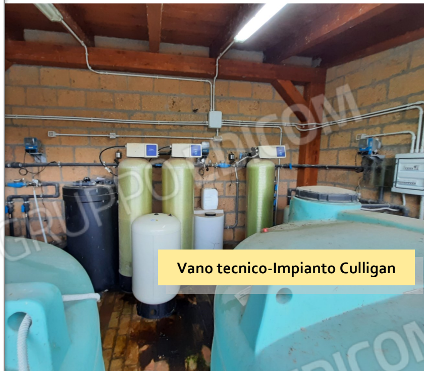
Vano tecnico-Impianto Culligan