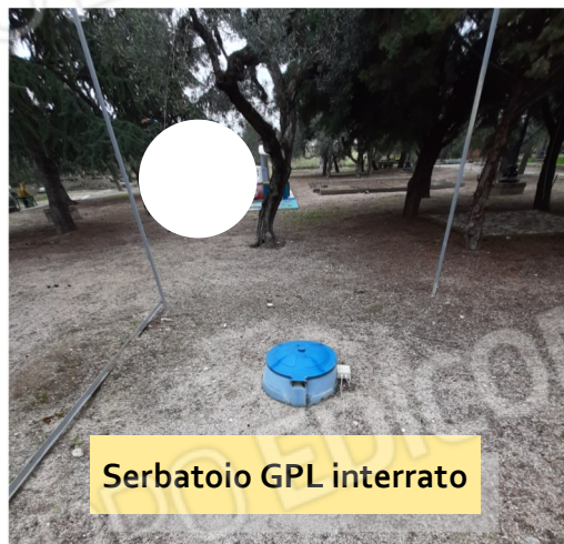
Serbatoio GPL interrato