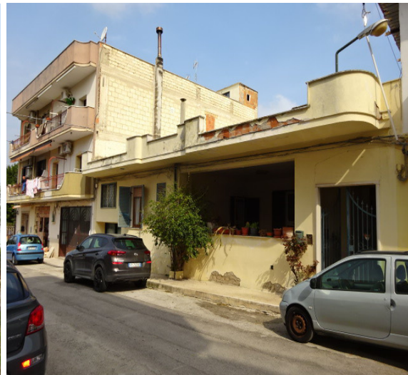
LOTTO 2 – CERIGNOLA (FG)