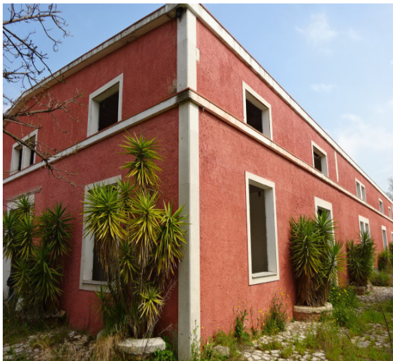
LOTTO 1 – STORNARA (FG) -