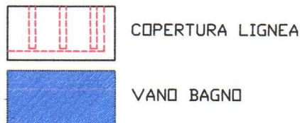
PLANIMETRIA STATO DI FATTO SCALA 1:100