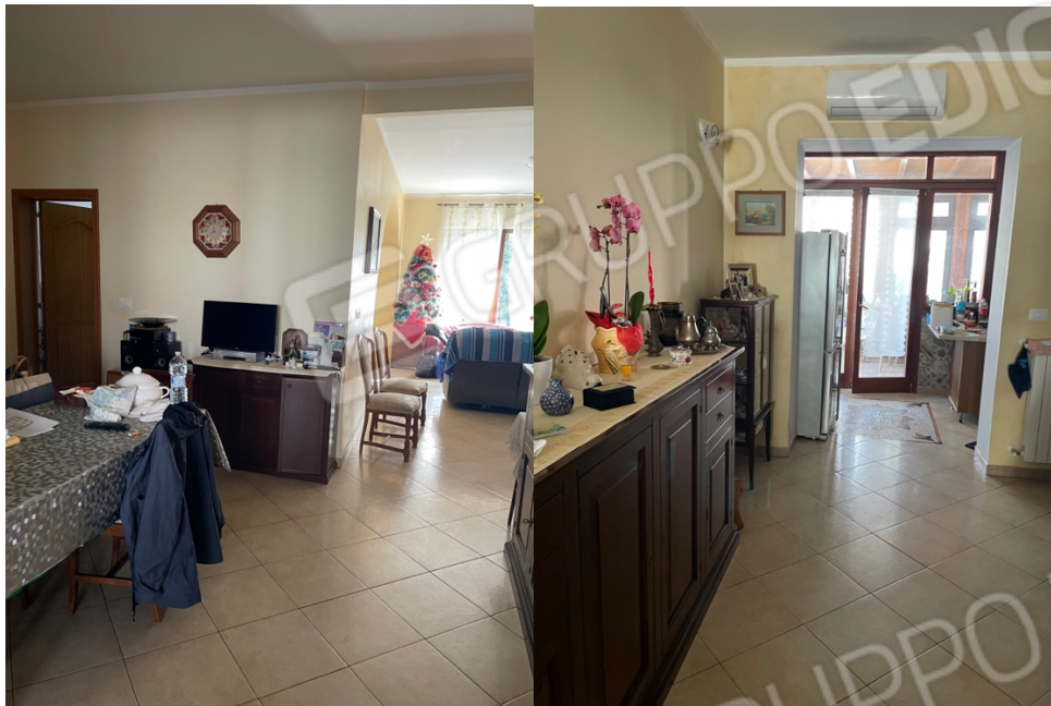
Figura 9: Lotto 1 - Piano Terra sala da pranzo