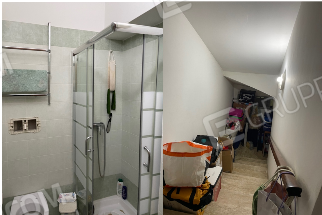
Figura 10: Lotto 1 - Piano Terra bagno e sottoscala cieco adiacenti a sala da pranzo