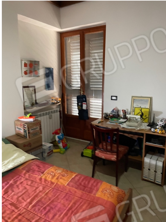
Figura 5: Lotto 1 - Piano Terra Prima camera da Letto su lato sinistro guardando il fronte immobile