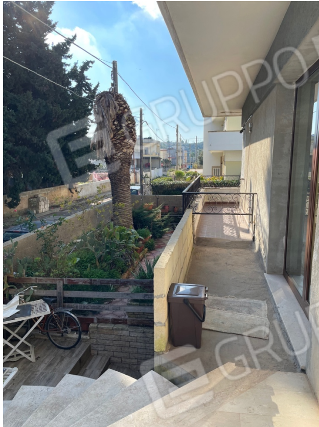
Figura 26: Lotto 1 - Piano Terra dettaglio fronte con evidenza dell'accesso con scivolo alla seconda porzione di seminterrato