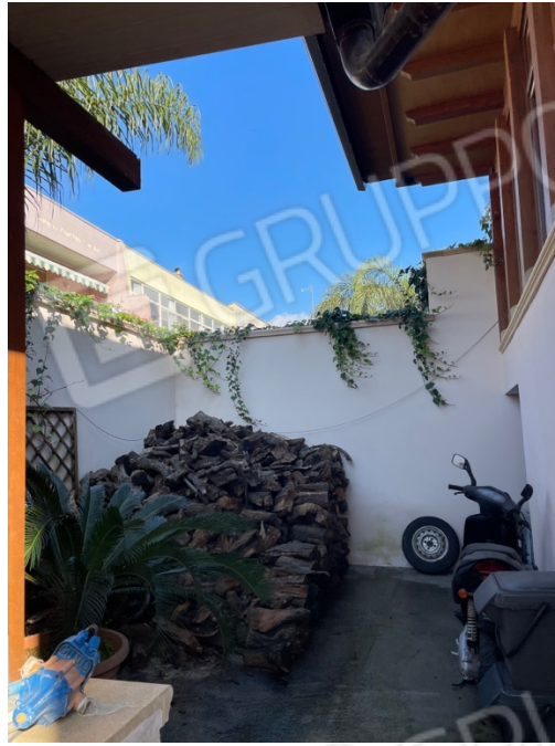
Figura 13: Lotto 1 - Piano Terra spazio aperto retrostante dal quale è possibile accedere ad una parte dei vani al piano seminterrato (vano porta sulla destra della foto)