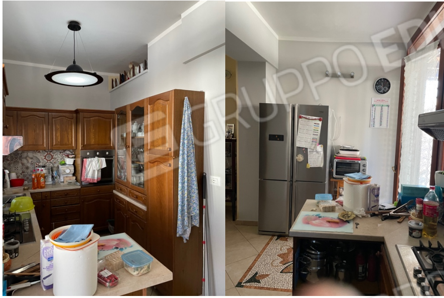
Figura 11: Lotto 1 - Piano Terra -Cucina