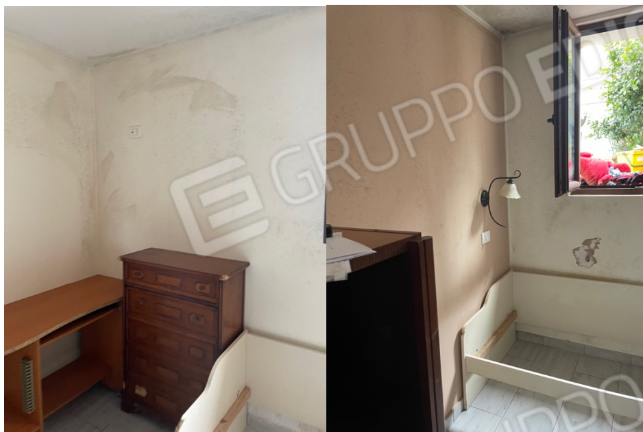
Figura 32: Lotto 1 - Piano Seminterrato sul fronte particolari seconda camera da letto