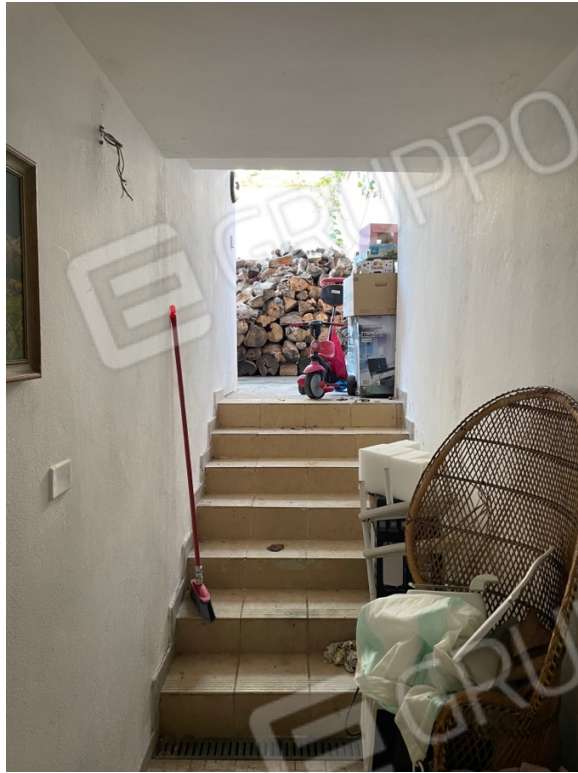
Figura 15: Lotto 1 - Piano Terra locali vano scala per accesso nel seminterrato dal quale si accede dal retro del piano terra