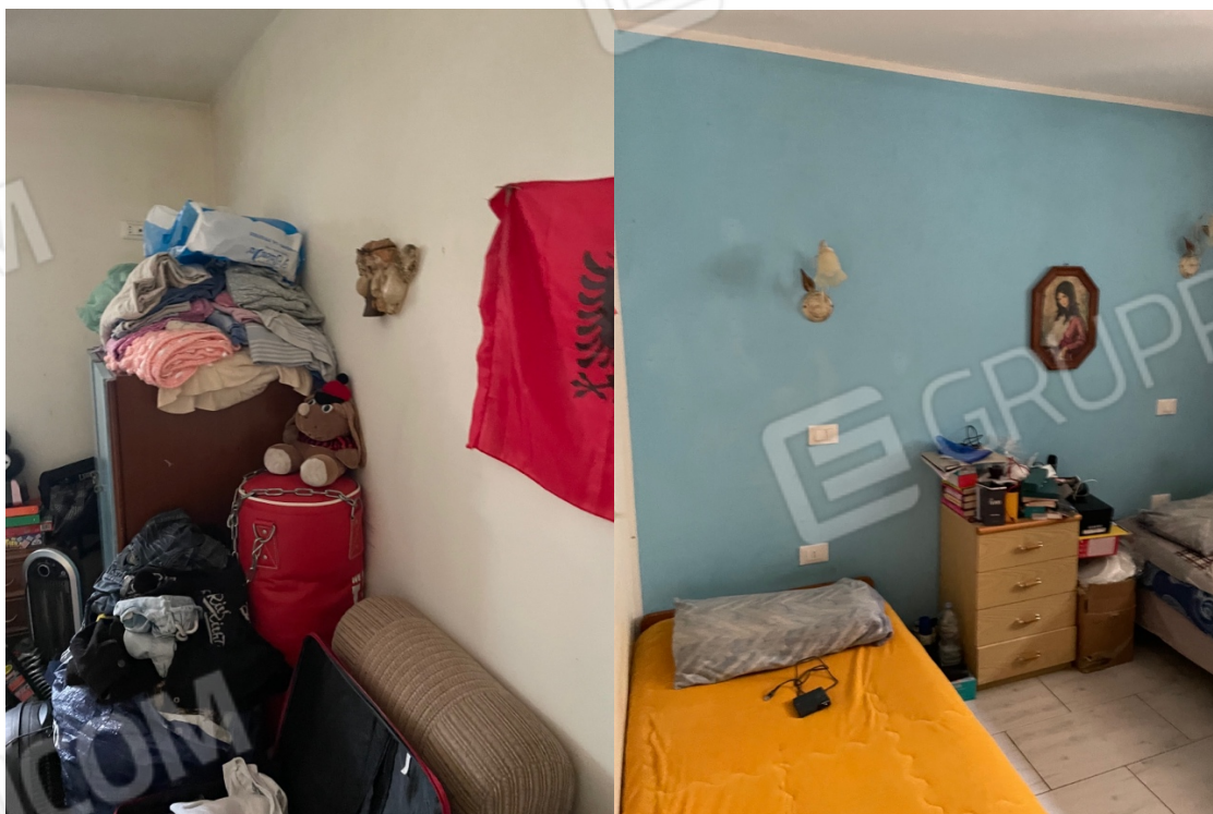
Figura 33: Lotto 1 - Piano Seminterrato sul fronte particolari terza camera da letto