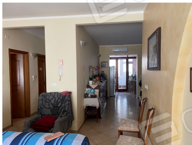
Figura 5: Lotto 1 - Piano Terra disimpegno verso zona notte e cucina