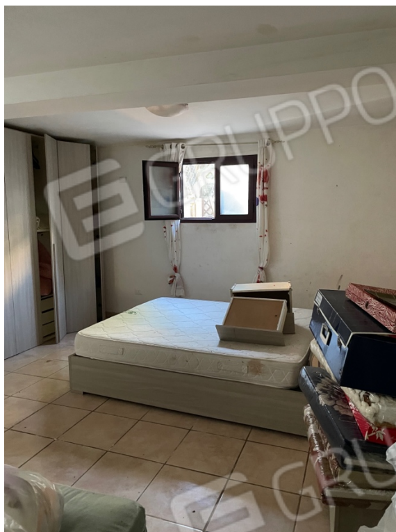
Figura 17: Lotto 1 - Seminterrato dal quale si accede dal retro del piano terra camera da letto