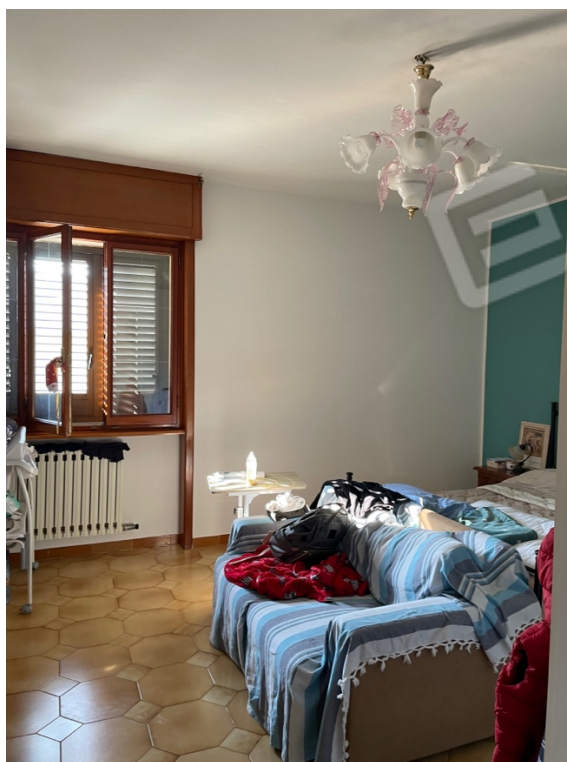
Figura 24: Lotto 1 - Primo Piano prima camera da letto