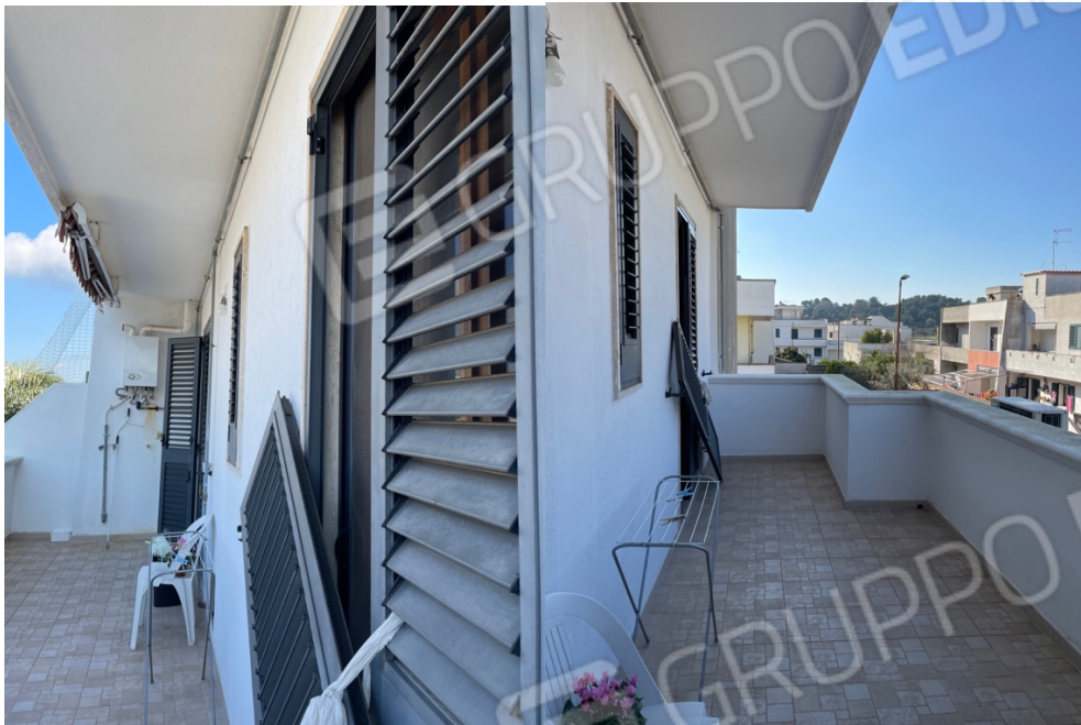
Figura 21: Lotto 1 - Primo Piano terrazzini perimetrale