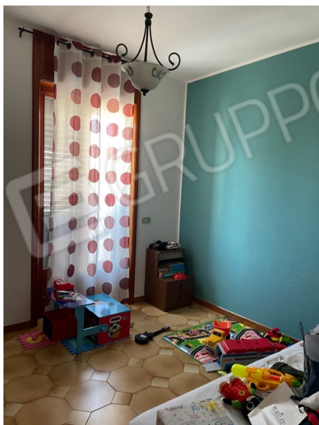
Figura 25: Lotto 1 - Primo Piano seconda camera da letto