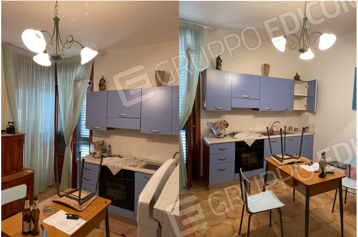
Figura 25: Lotto 1 - Primo Piano seconda cucina