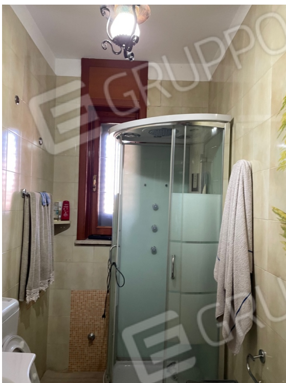
Figura 23: Lotto 1 - Primo Piano primi servizi igienici