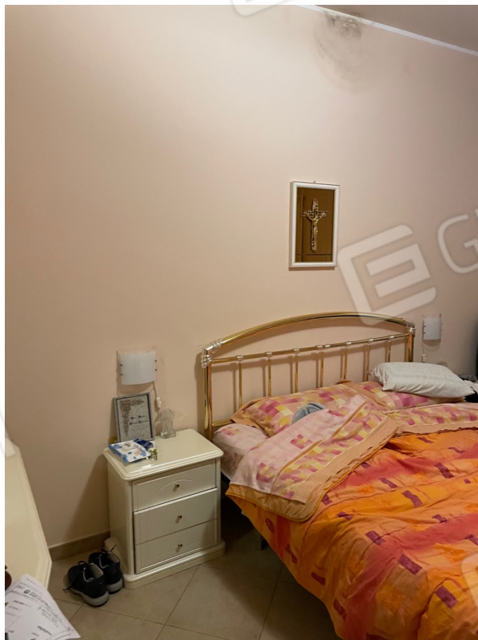
Figura 6: Lotto 1 - Piano Terra Seconda camera da Letto su lato sinistro guardando il fronte