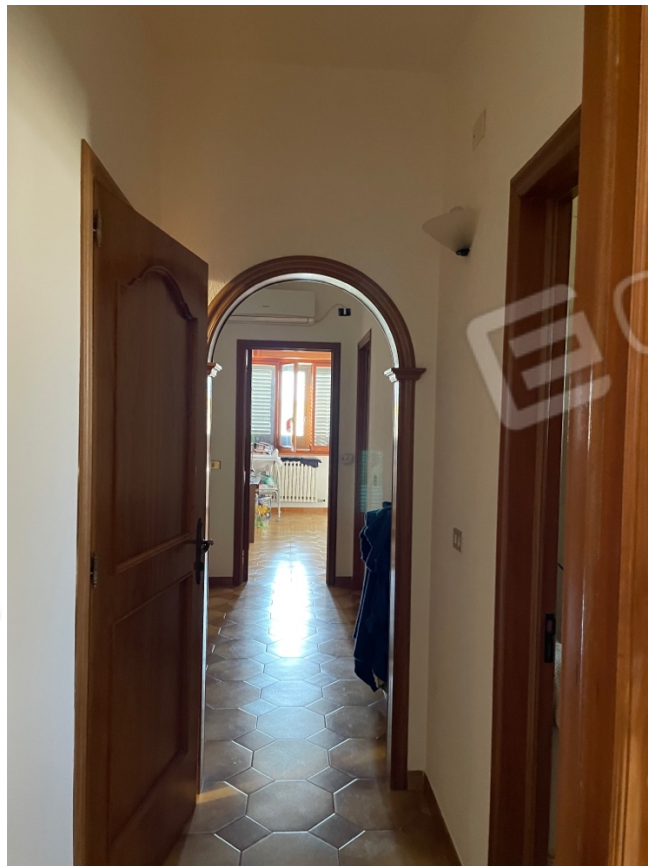
Figura 22: Lotto 1 - Primo Piano corridoio di disimpegno