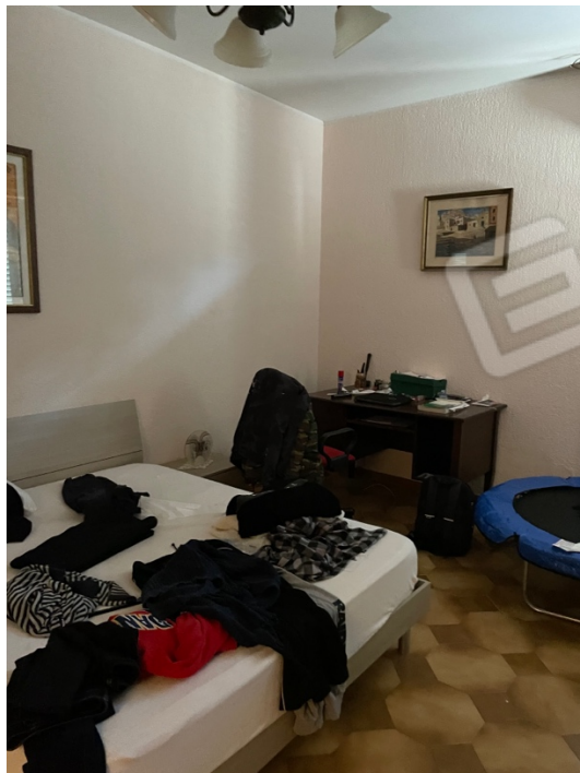
Figura 25: Lotto 1 - Primo Piano terza camera da letto