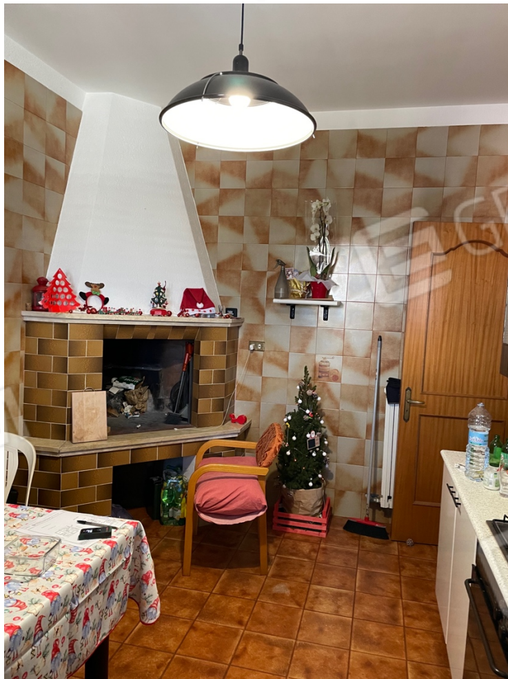
Figura 20: Lotto 1 - Primo Piano, prima cucina