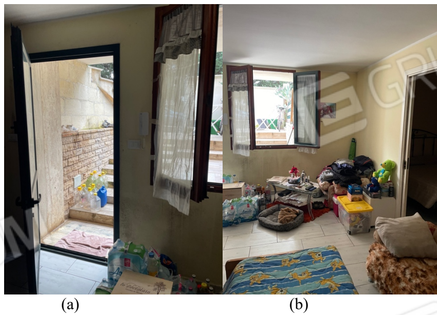
Figura 29: Lotto 1 - Piano Seminterrato sul fronte - ingresso (a) visto dall'interno e finestra angolo giorno (b)