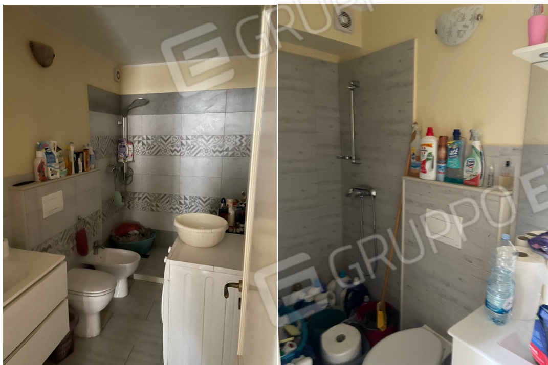
Figura 34: Lotto 1- Piano Seminterrato sul fronte servizi igienici