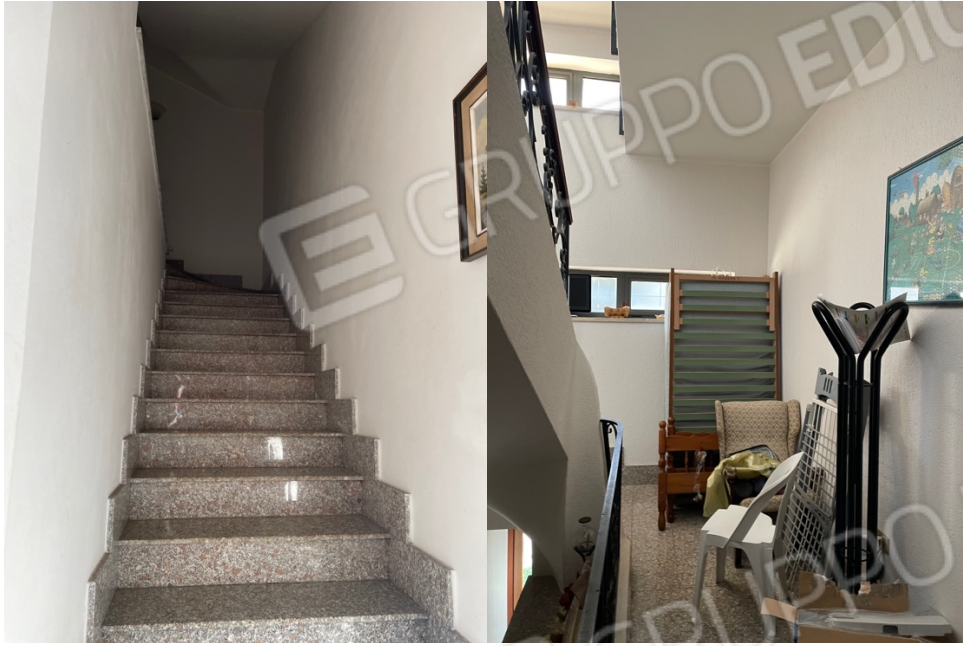
(a) (b) Figura 19: Lotto 1 - Scala accesso (a) Primo Piano e pianerottolo (b)