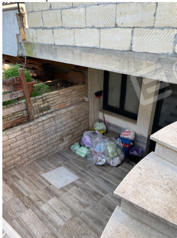
Figura 27: Lotto 1 - Piano Terra dettaglio dell'accesso con scivolo alla seconda porzione di seminterrato