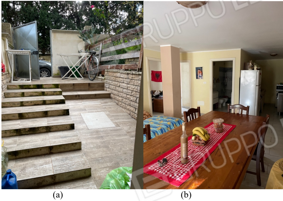
Figura 28: Lotto 1 - Piano Seminterrato porzione alla quale sia accede dal fronte edificio (a) e ingresso/cucina/angolo pranzo (b)