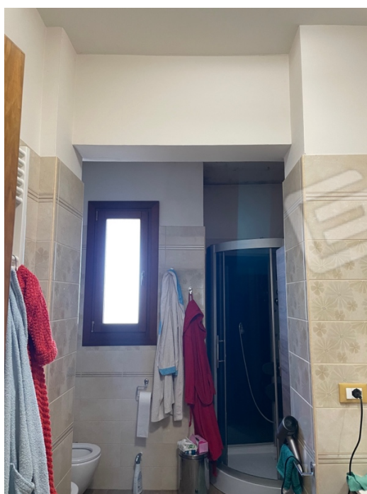
Figura 8: Lotto 1 - Piano Terra Bagno con affaccio su retro