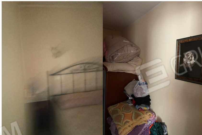
Figura 31: Lotto 1 - Piano Seminterrato sul fronte particolari prima camera da letto