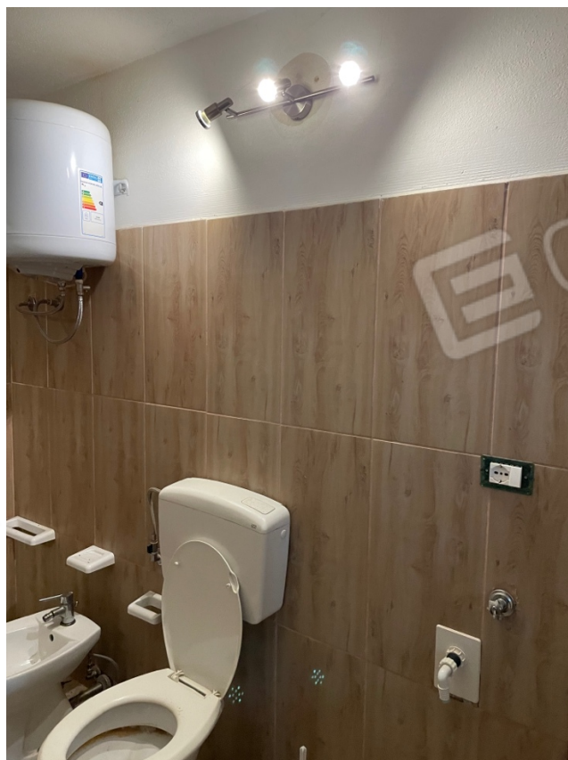
Figura 18: Lotto 1 - Seminterrato dal quale si accede dal retro del piano terra camera servizi igienici