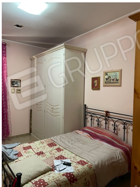
Figura 7: Lotto 1 - Piano Terra Terza camera da Letto su lato sinistro guardando il fronte