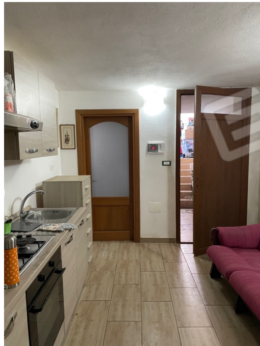
Figura 16: Lotto 1 - Seminterrato dal quale si accede dal retro del piano terra cucina