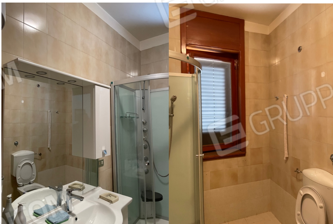
Figura 24: Lotto 1 - Primo Piano secondi servizi igienici