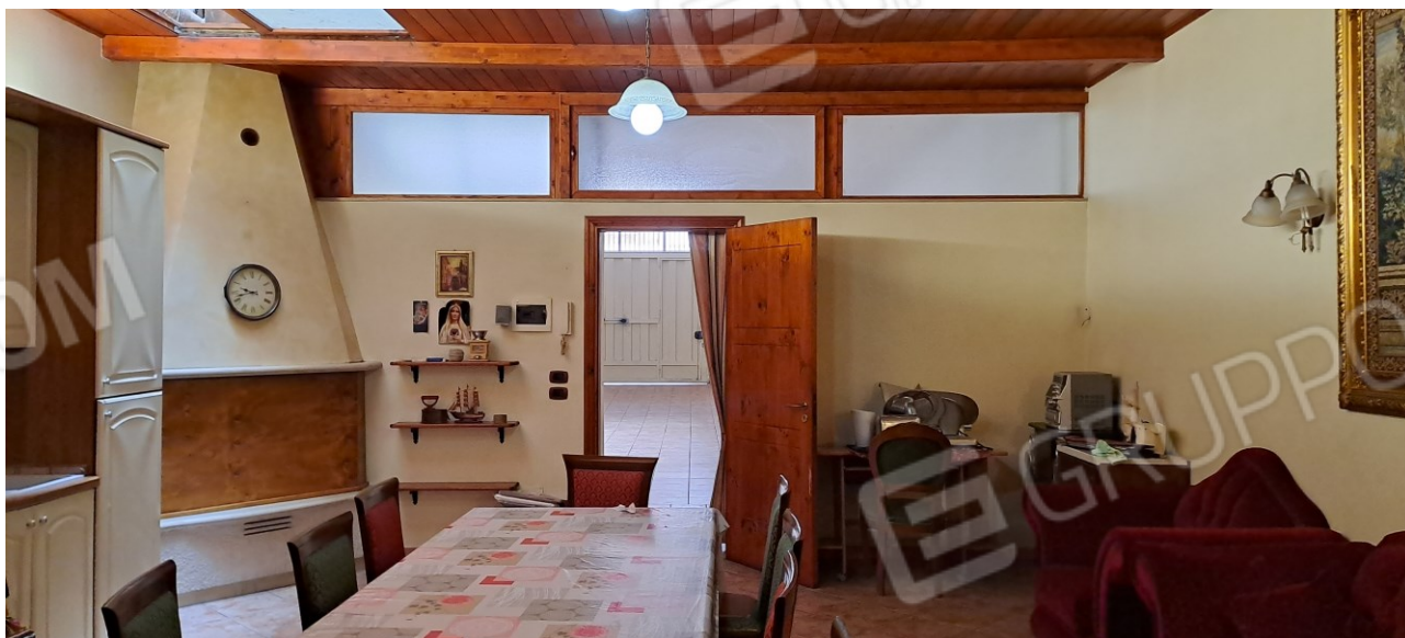
Figura 17 - deposito a p.t.