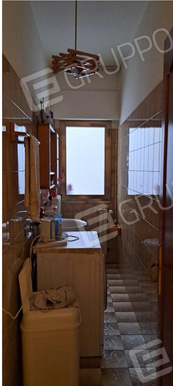
Figura 10 - bagno (adiacente al vano pranzo)