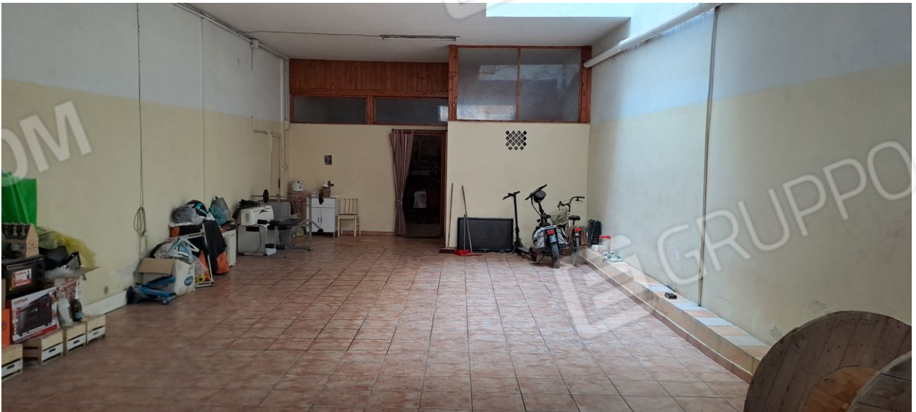
Figura 21 - area ad autorimessa a p.t.