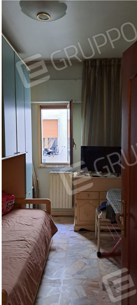
Figura 12 - camera letto singola