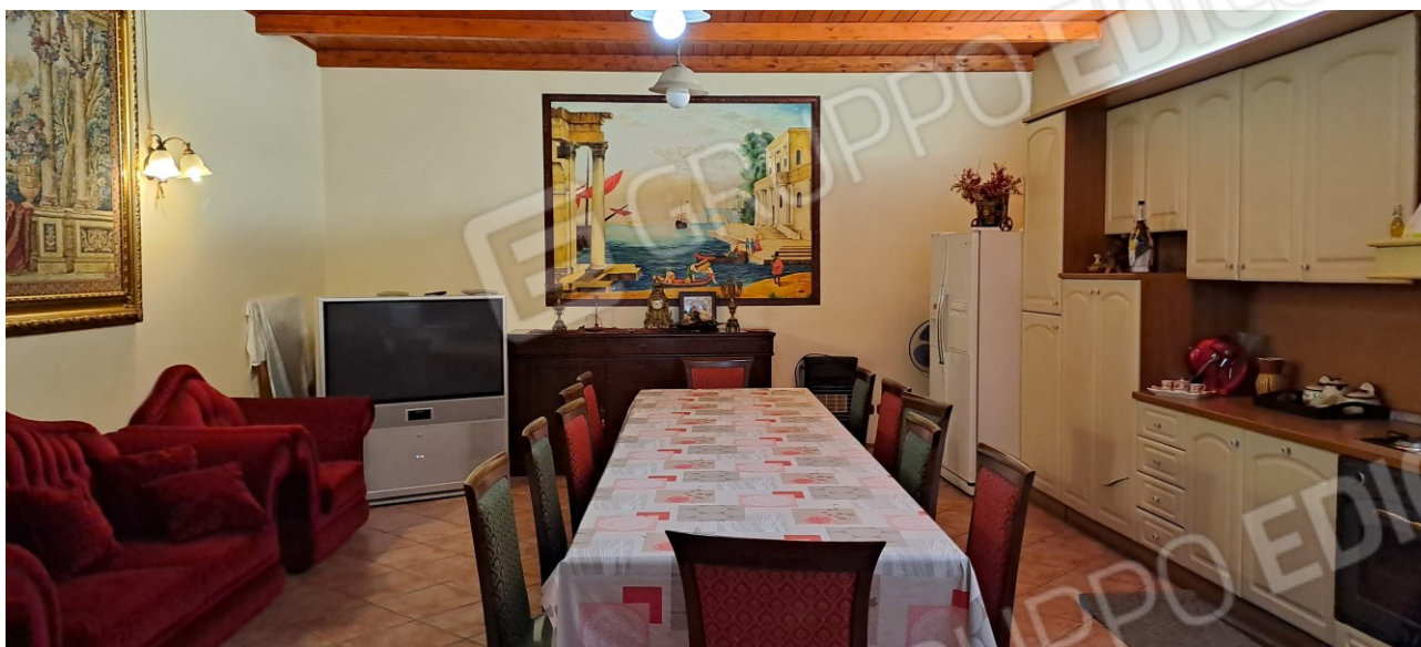
Figura 16 - deposito a piano terra