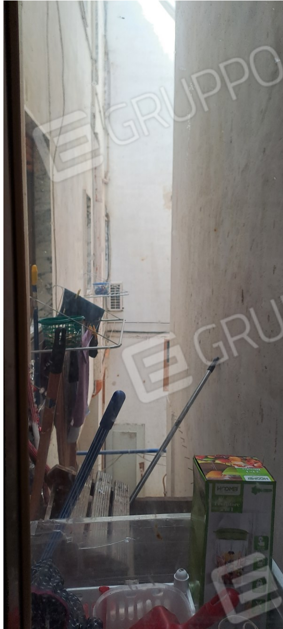
Figura 9 - vista del cortile dal cucinino