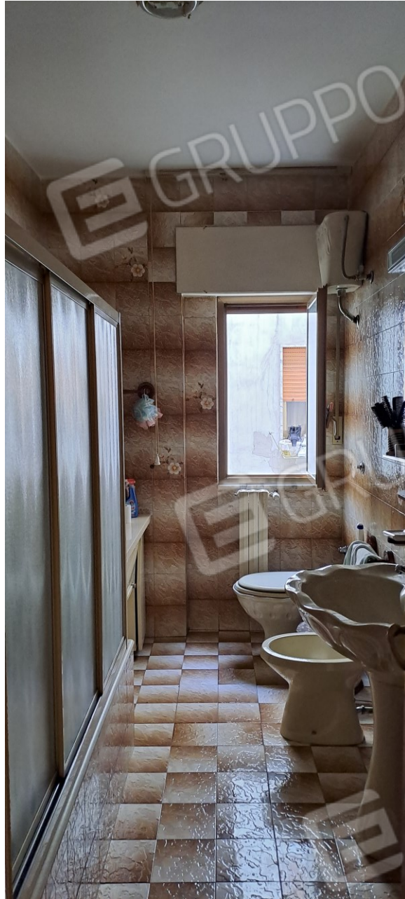
Figura 13 - bagno (adiacente alla camera letto matrimoniale)