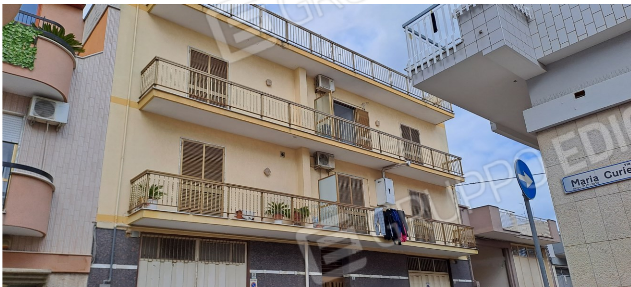
Figura 2 - vista del primo piano dell'edificio da via G. Natta