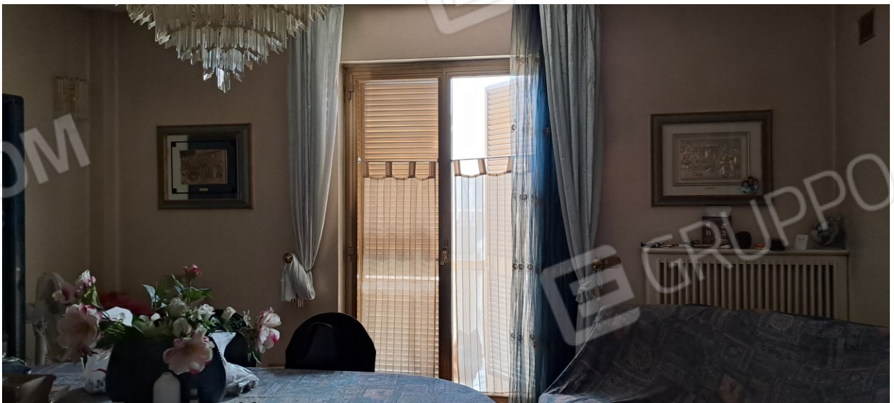
Figura 6 - soggiorno