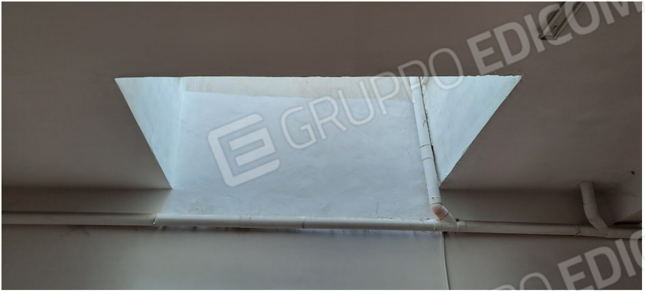
Figura 22 - lucernaio a soffitto