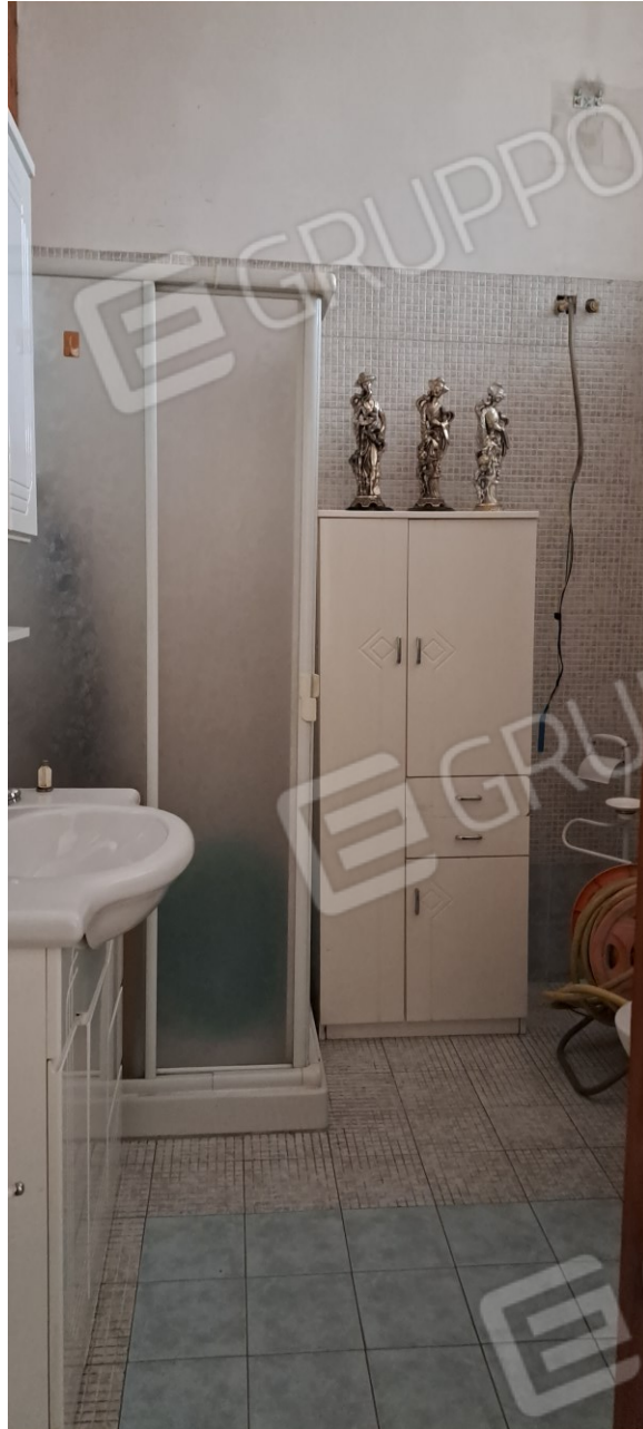
Figura 19 - bagno a p.t.