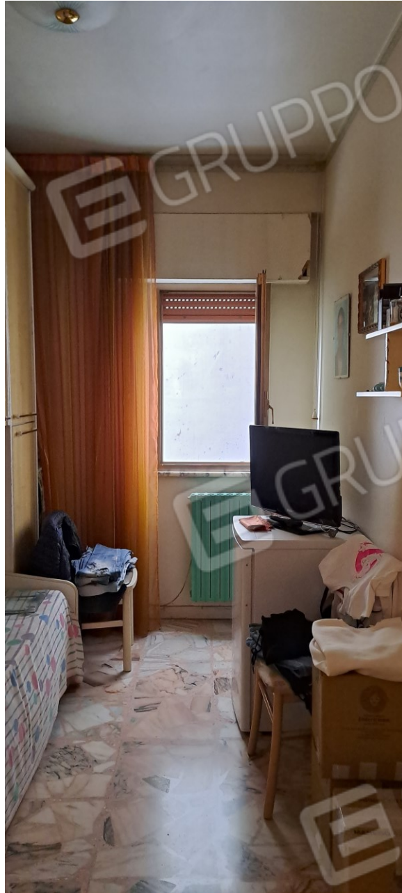
Figura 11 - camera letto singola