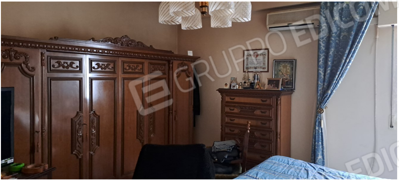
Figura 14 - camera letto matrimoniale