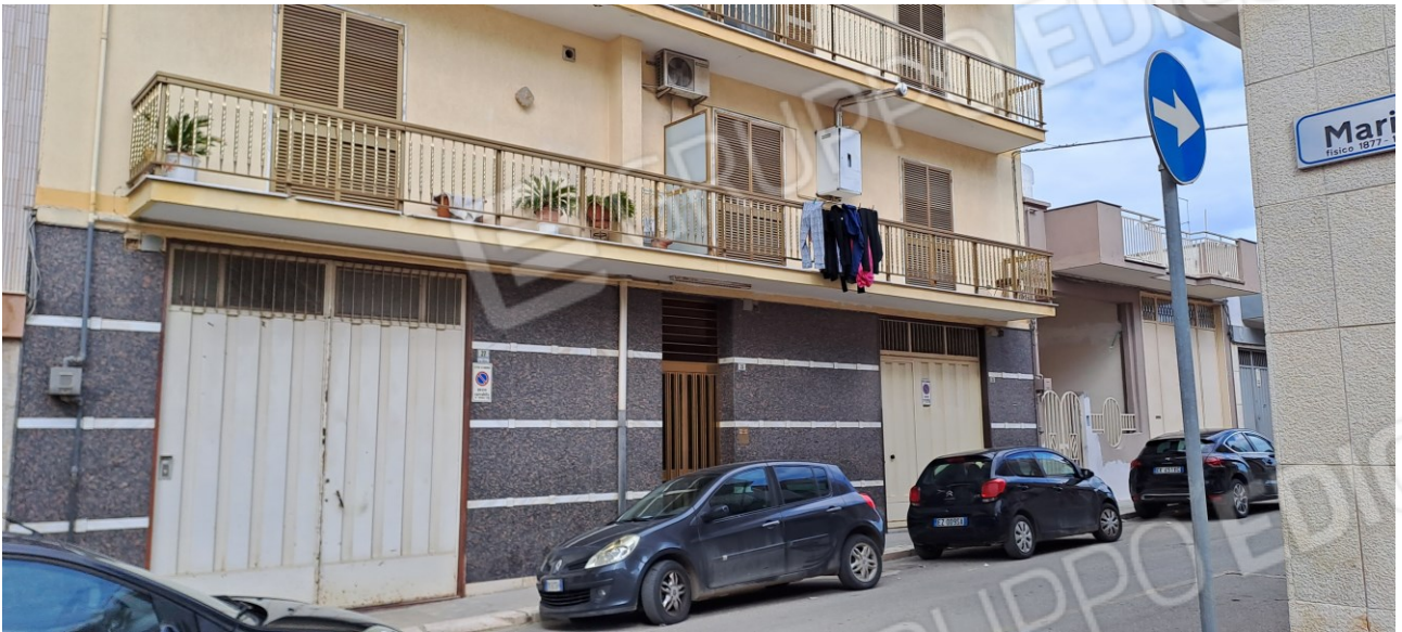
Figura 20 - vista del piano terra dell'edificio da via G. Natta e del portone al civico 23