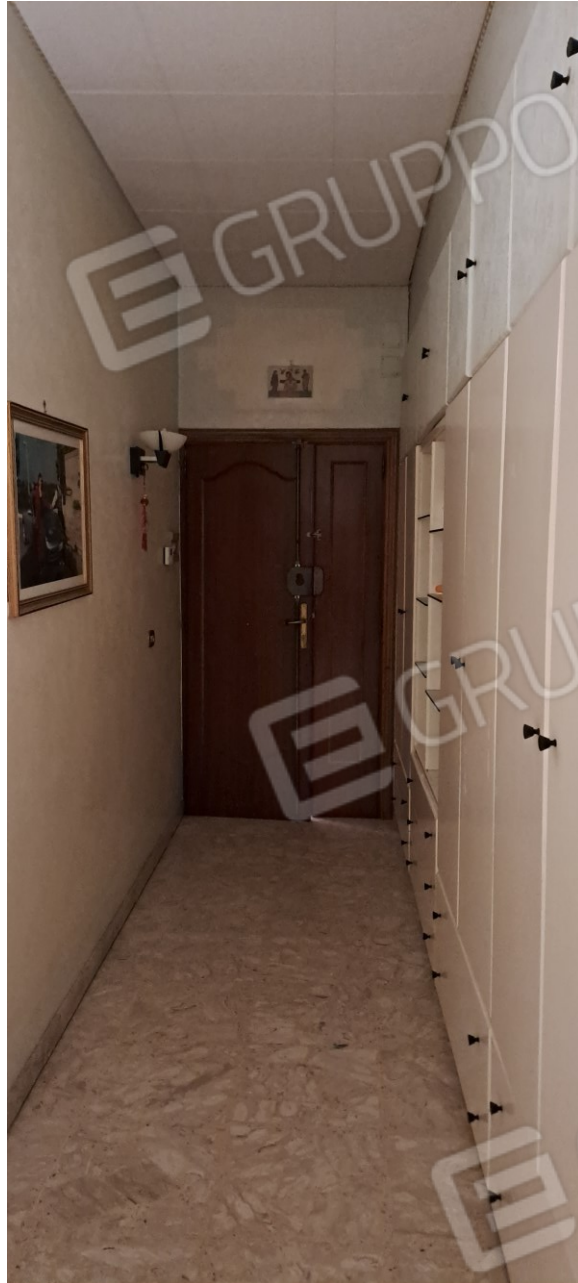
Figura 3 - porta di ingresso all'abitazione