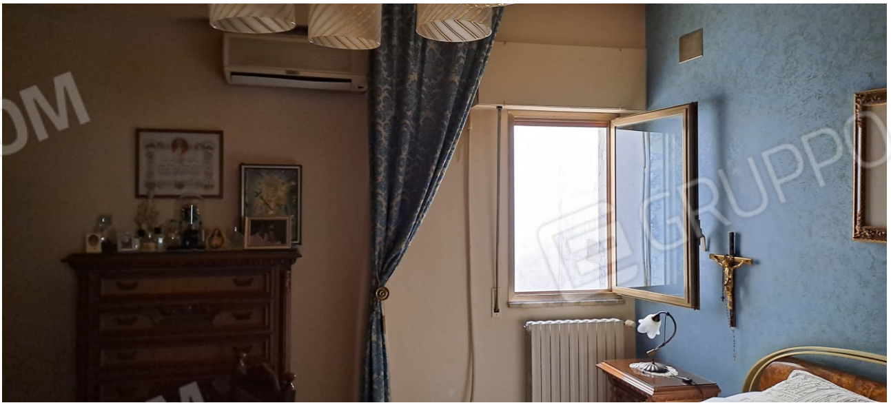
Figura 15 - camera letto matrimoniale