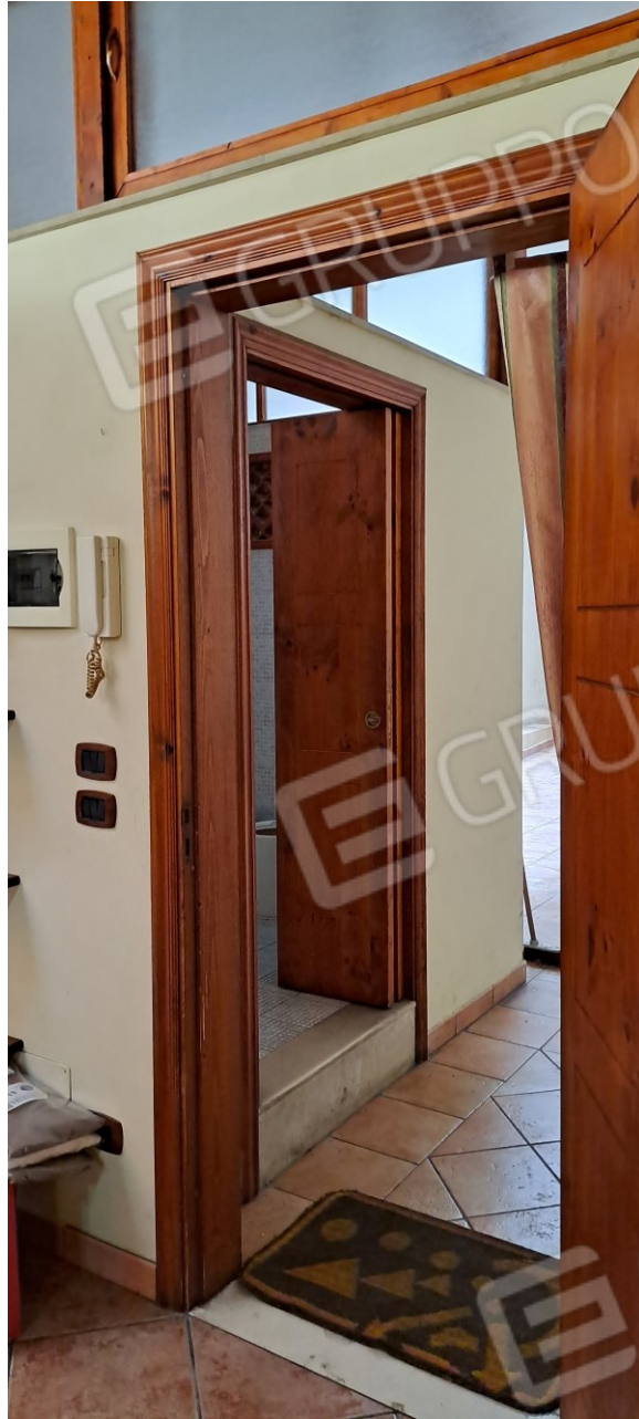
Figura 18 - porta di accesso al bagno