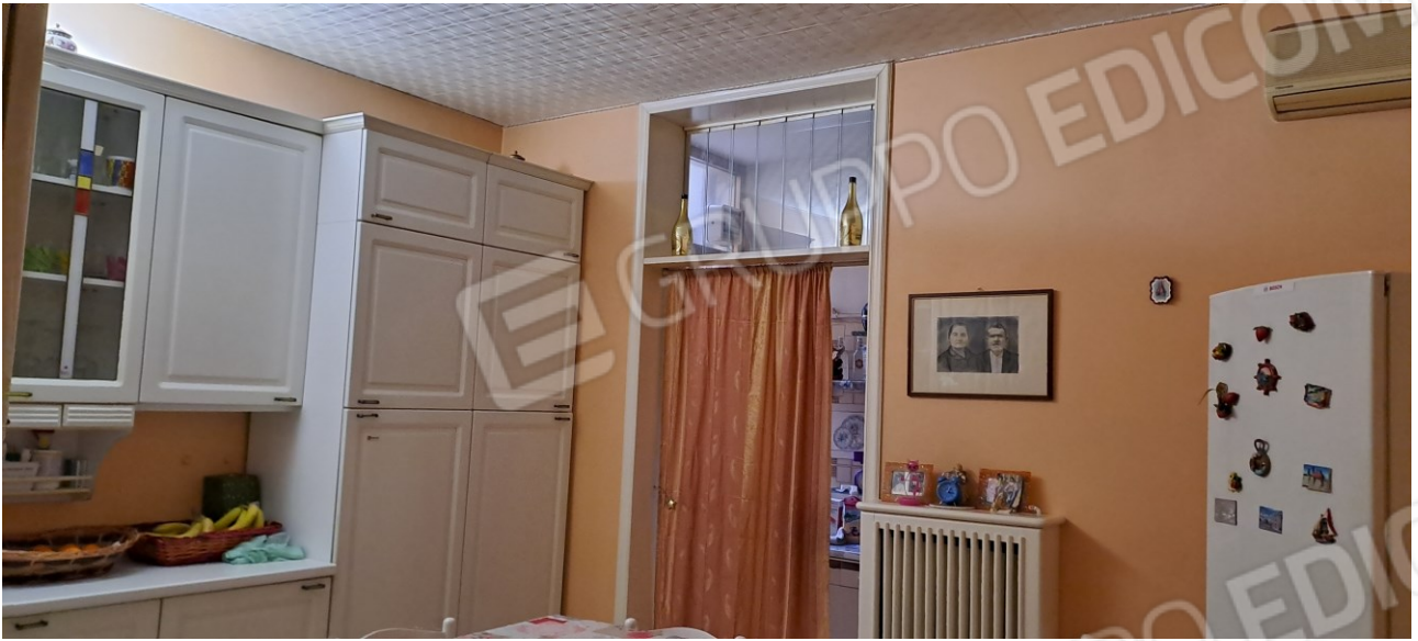
Figura 7 - pranzo