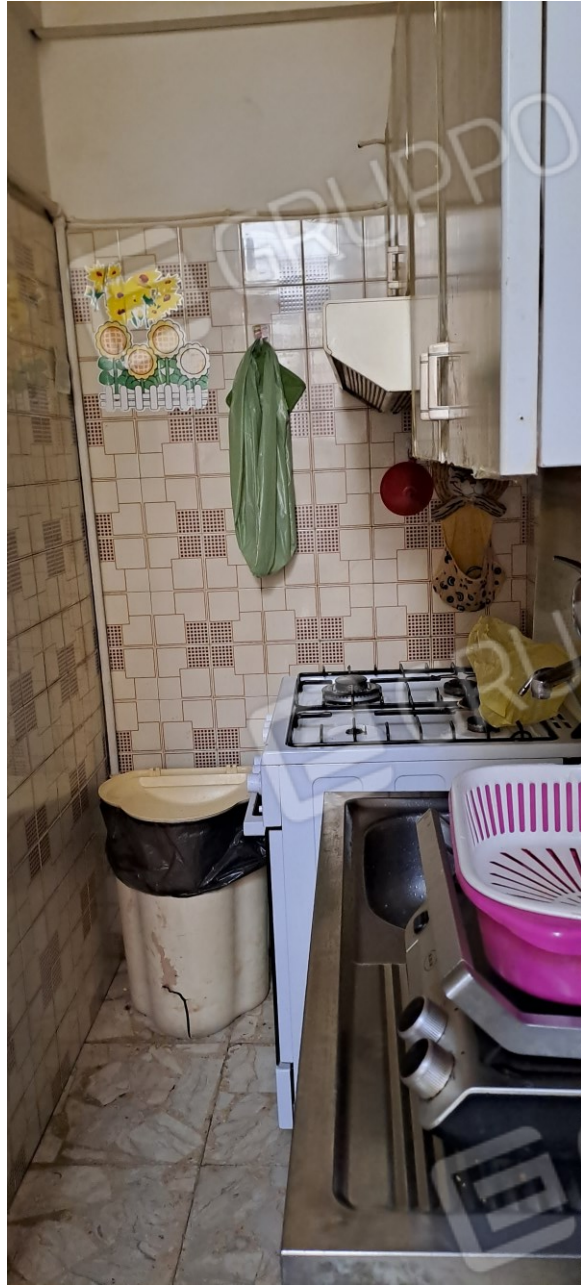
Figura 8 - cucinino