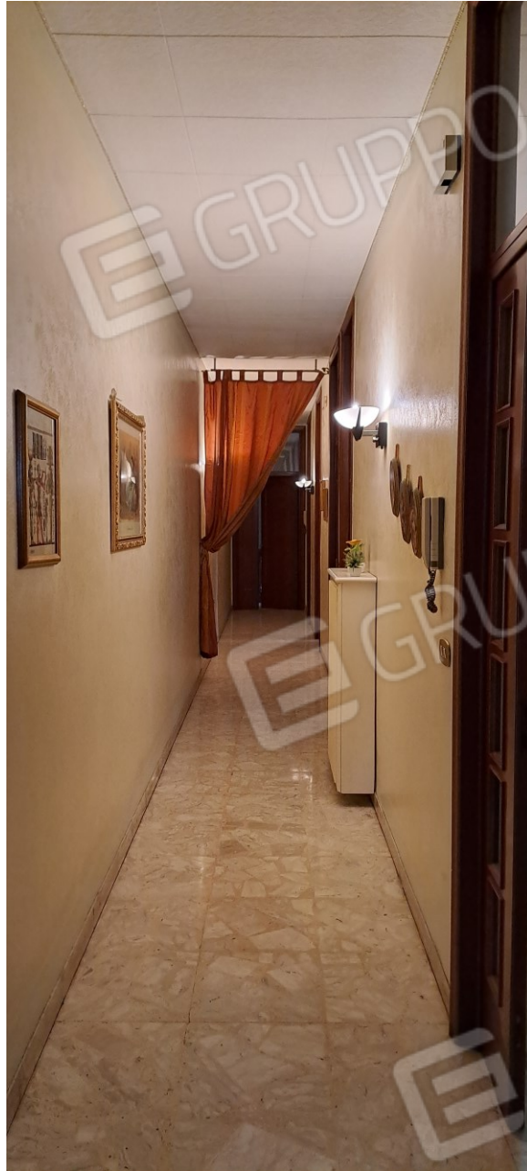
Figura 4 - disimpegno visto dall'ingresso