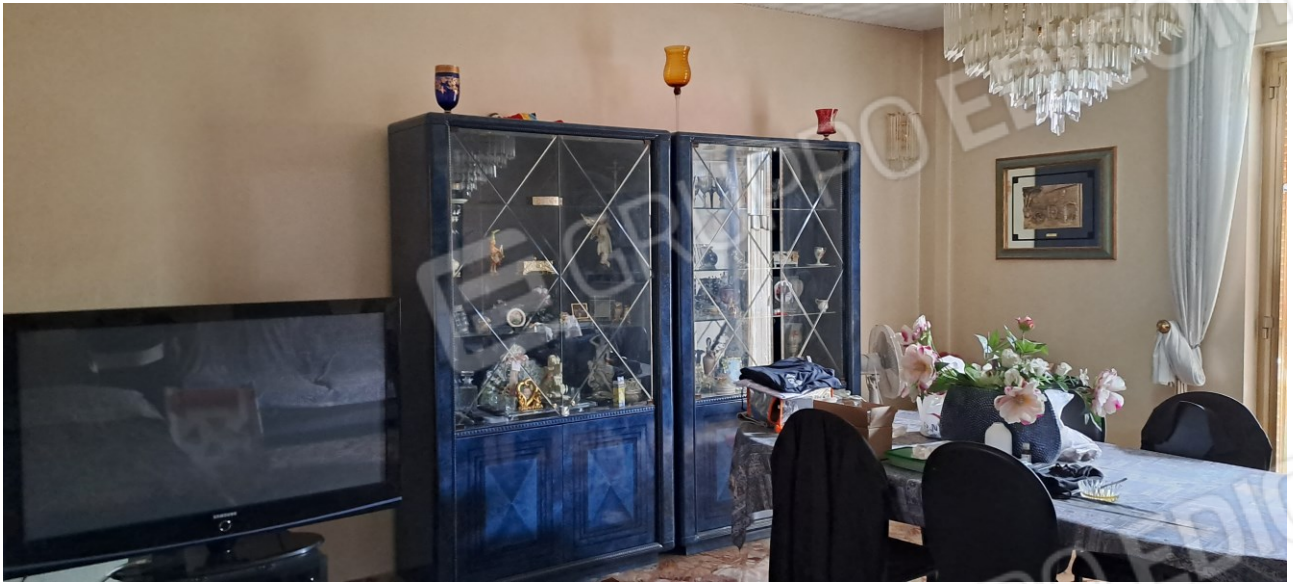
Figura 5 – soggiorno