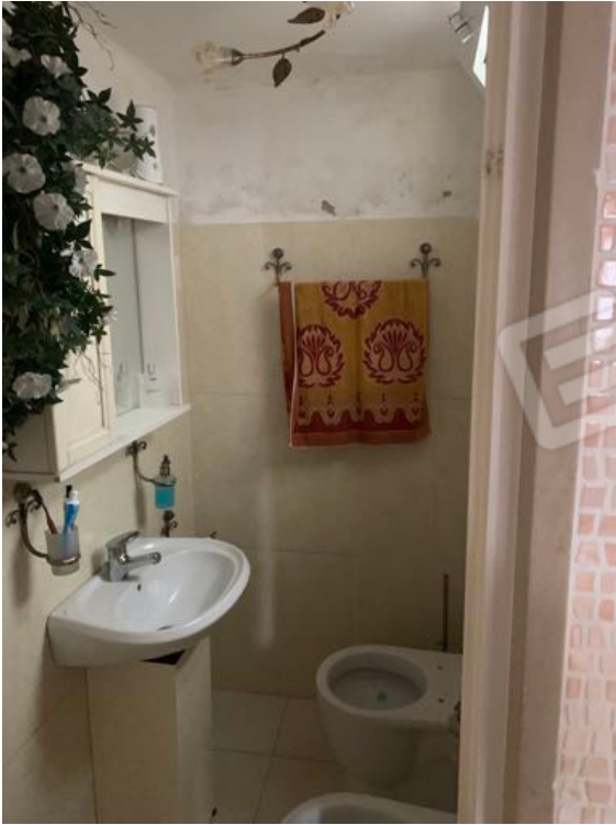
Vista n. 9 Piano Terra - Bagno 1