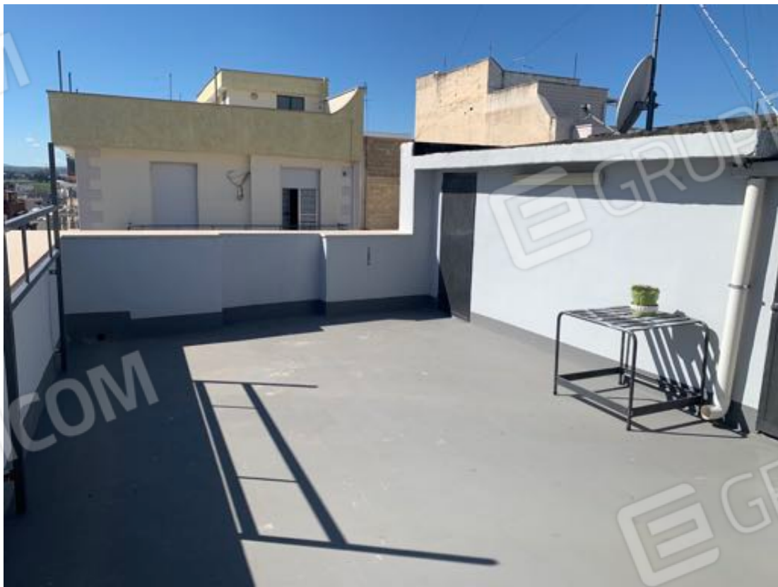
Vista n. 18 Lastrico solare