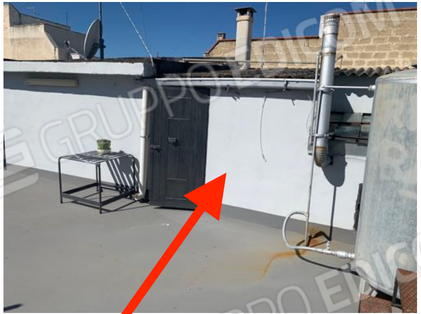
Vista n. 20 Particolare Opere abusive senza titolo abilitativo.