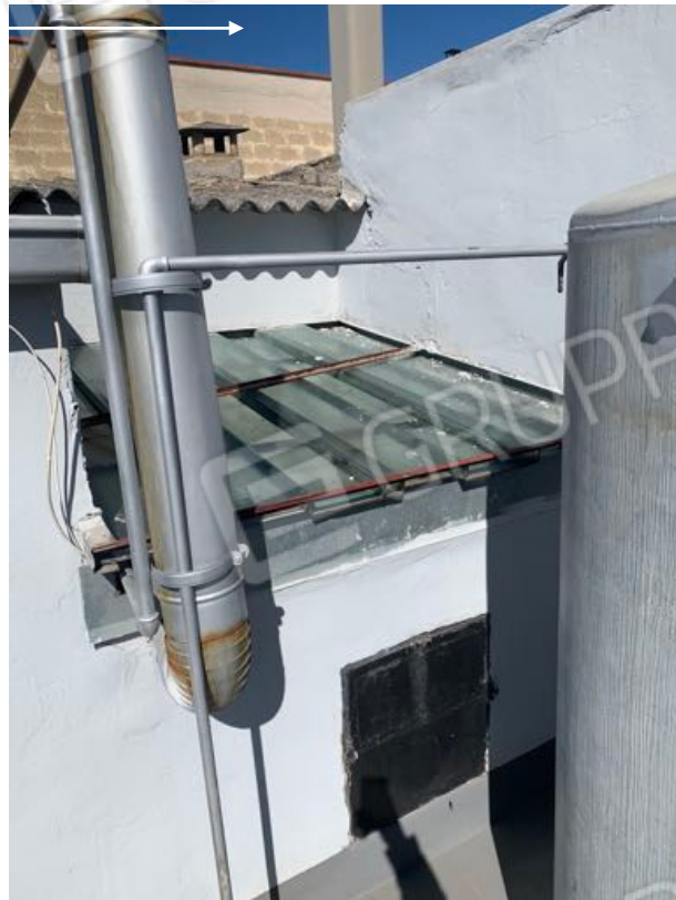
Vista n. 22 Lastrico solare - Cavedio.

1) Si precisa che da Progetto Approvato in Comune risulta un cavedio in prossimità dei due ambienti.