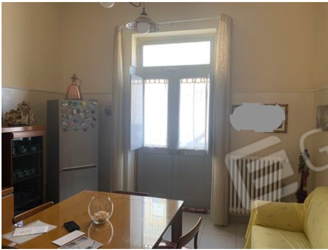
Vista n. 6 Piano Terra - Camera da Pranzo