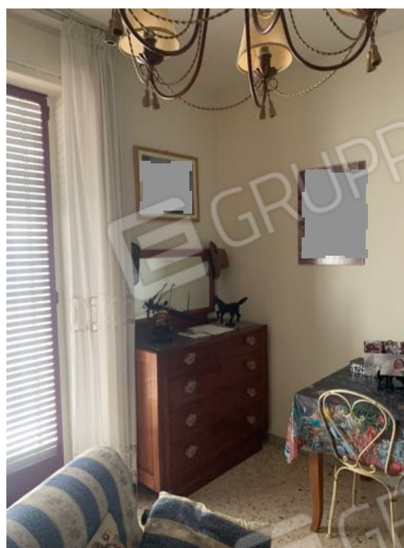
Vista n. 16 Piano Primo - Stanzetta