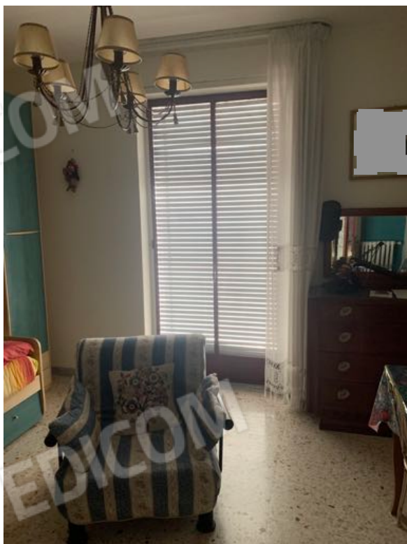
Vista n. 15 Piano Primo - Stanzetta