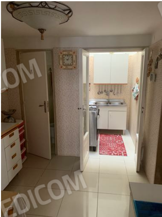
Vista n. 7 Piano Terra - Disimpegno 1