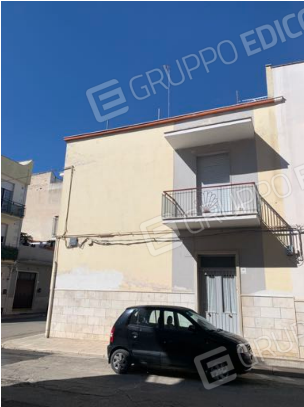
Vista n. 2 Esterna all'immobile con accesso da via Francesco Redi n. 23.