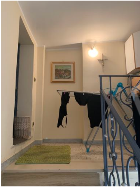
Vista n. 19 Lastrico solare - Pianerottolo