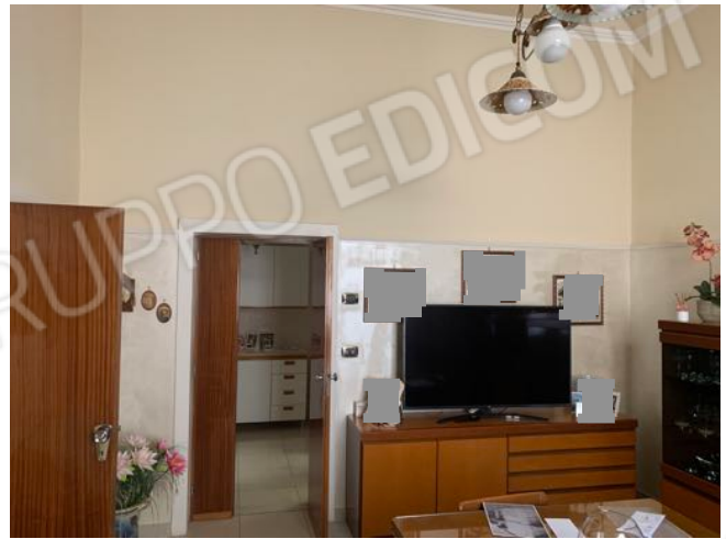
Vista n. 7 Piano Terra - Camera da Pranzo