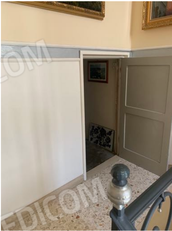
Vista n. 11 Piano Ammezzato