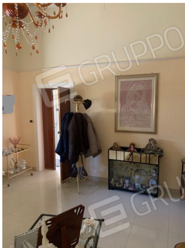
Vista n. 5 Piano terra - Interna Soggiorno