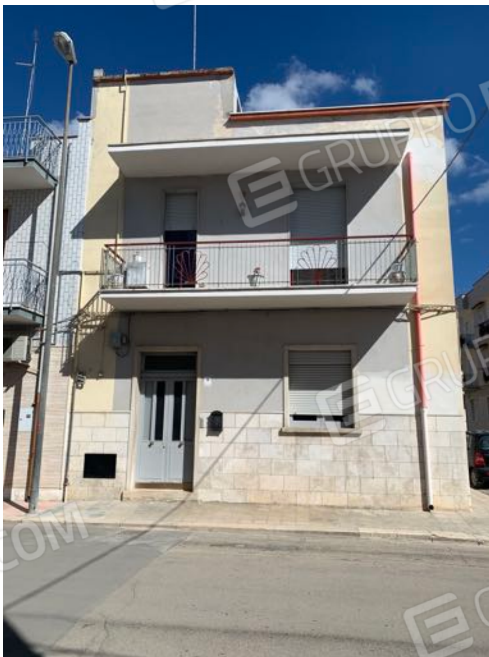
Vista n. 1 Esterna all'immobile con accesso da via Claudio Galeno n. 29.