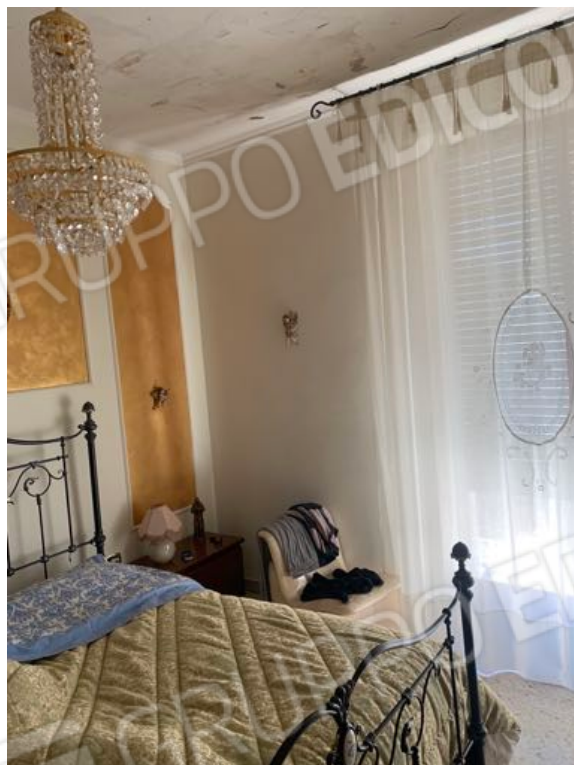
Vista n. 14 Piano Primo - Camera da Letto