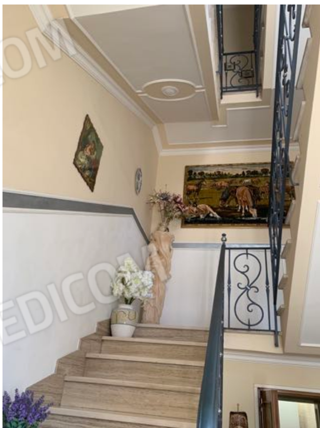
Vista n. 5 Piano Terra - Interna particolare scala