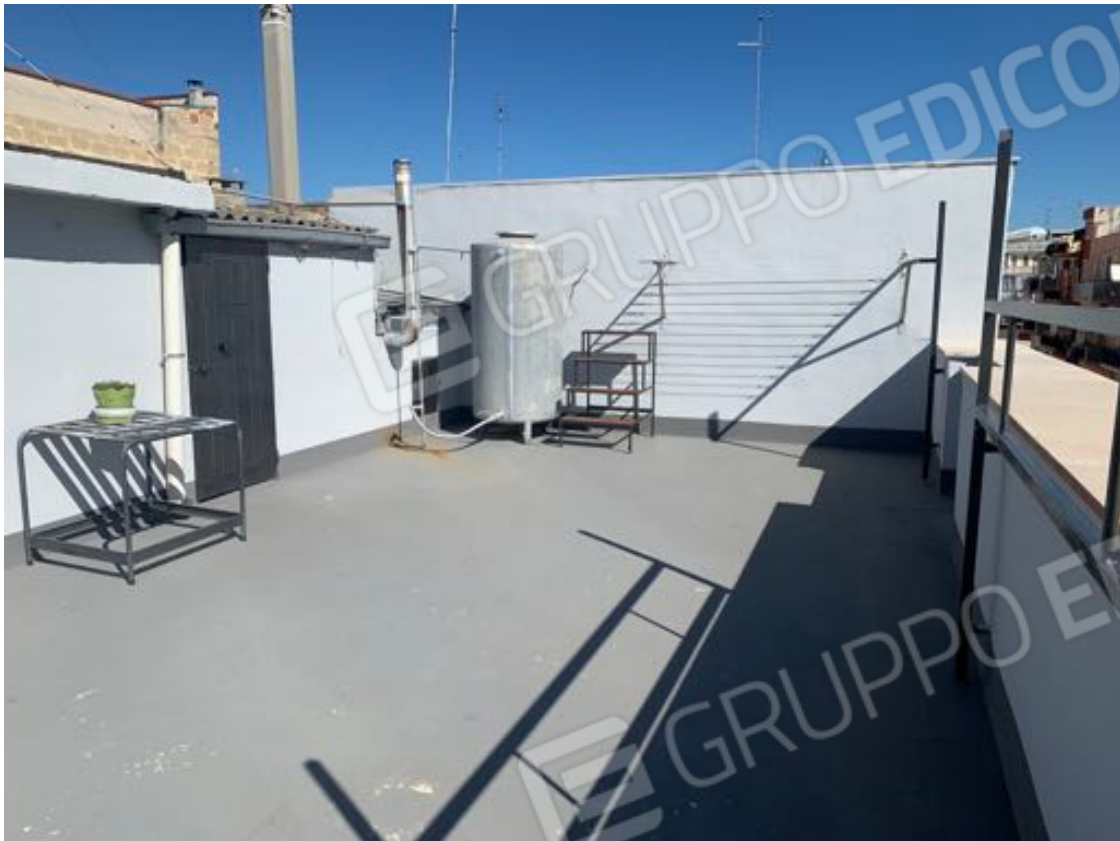
Vista n. 17 Lastrico solare - Particolare Opere abusive