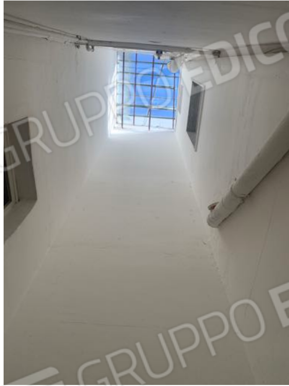
Vista n. 10 Cavedio