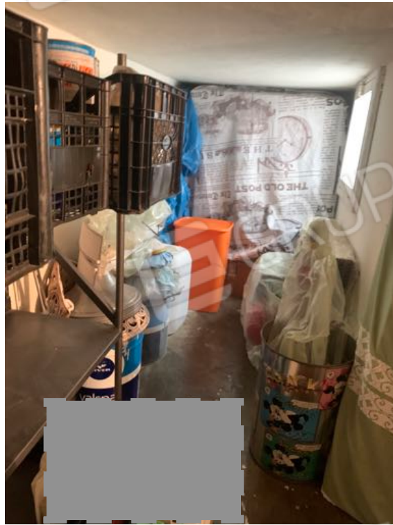
Vista n. 12 Interna Piano Ammezzato (Ripostiglio)