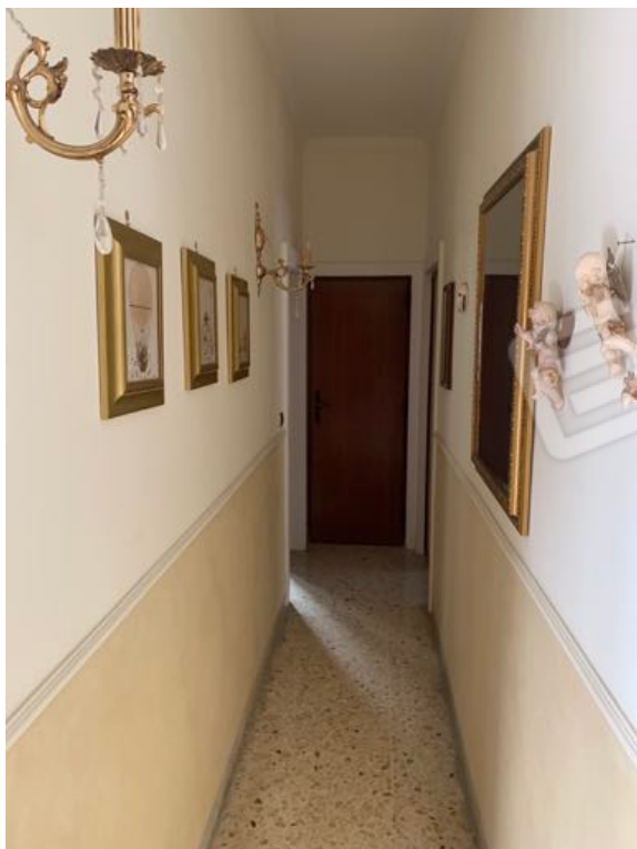
Vista n. 13 Piano Primo - Corridoio