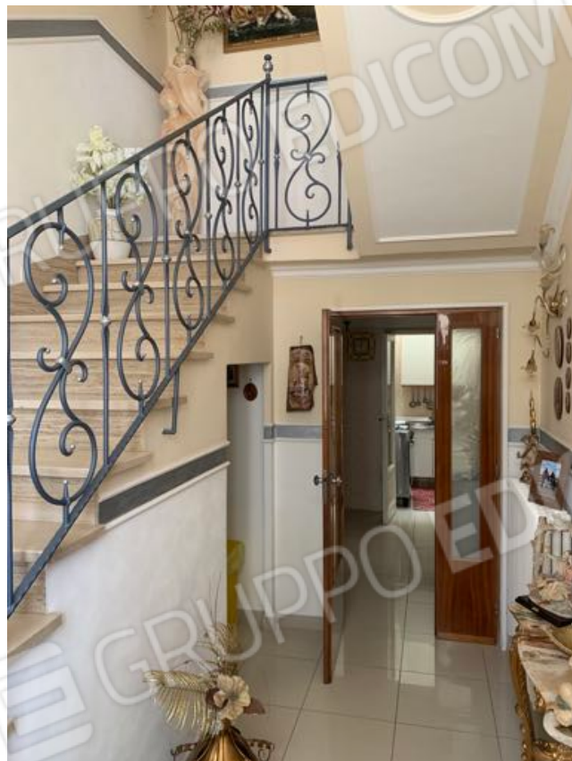
Vista n. 4 Piano Terra - Interna zona ingresso con scala