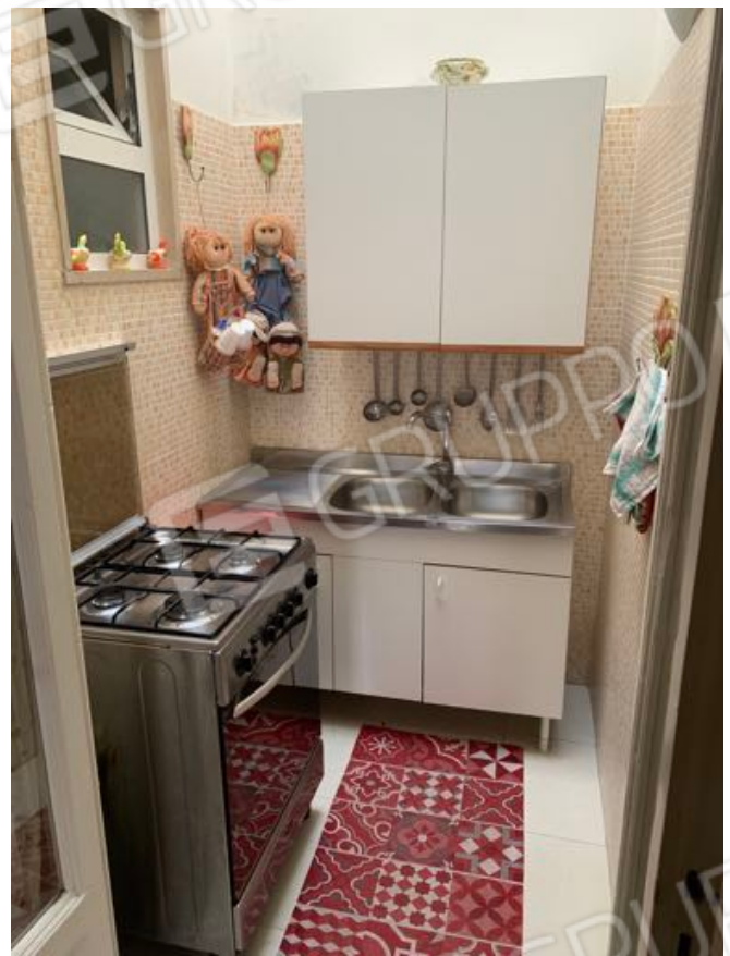
Vista n. 8 Piano Terra - Cucina 1