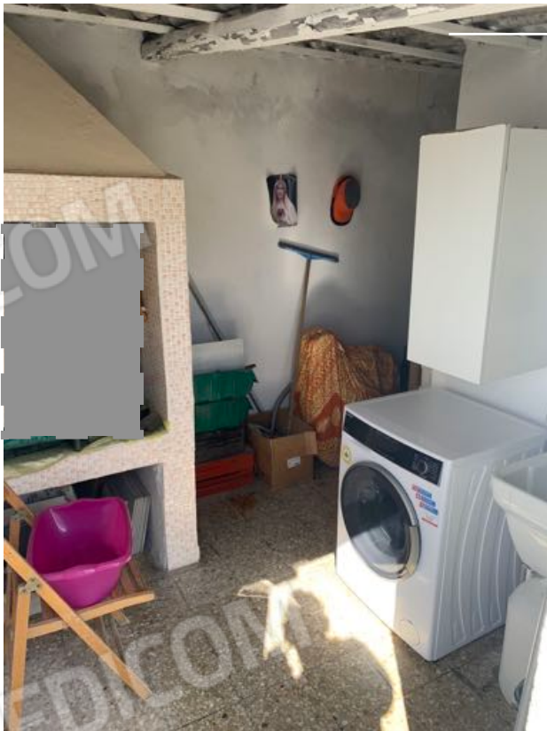
Vista n. 21 Lastrico solare - Ripostiglio