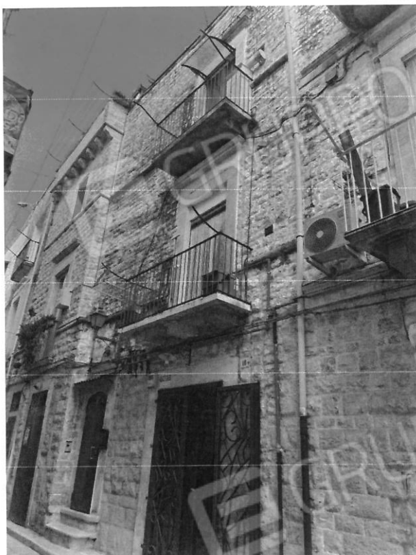
Vista esterna dell'edificio