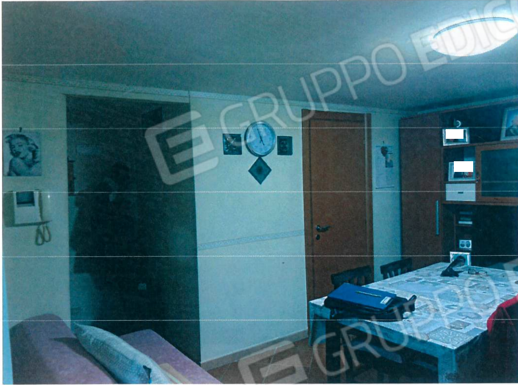
Cucina – Sala Pranzo – Piano Primo