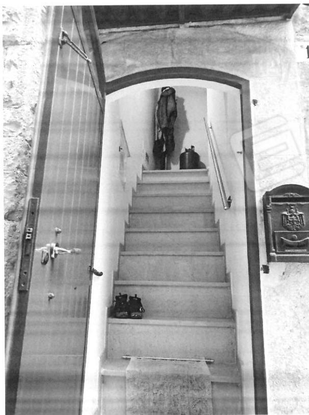
Portone e scala di accesso