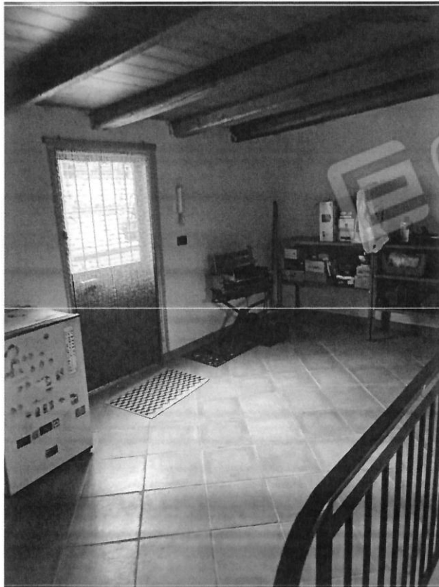
Soffitta – Terzo Piano