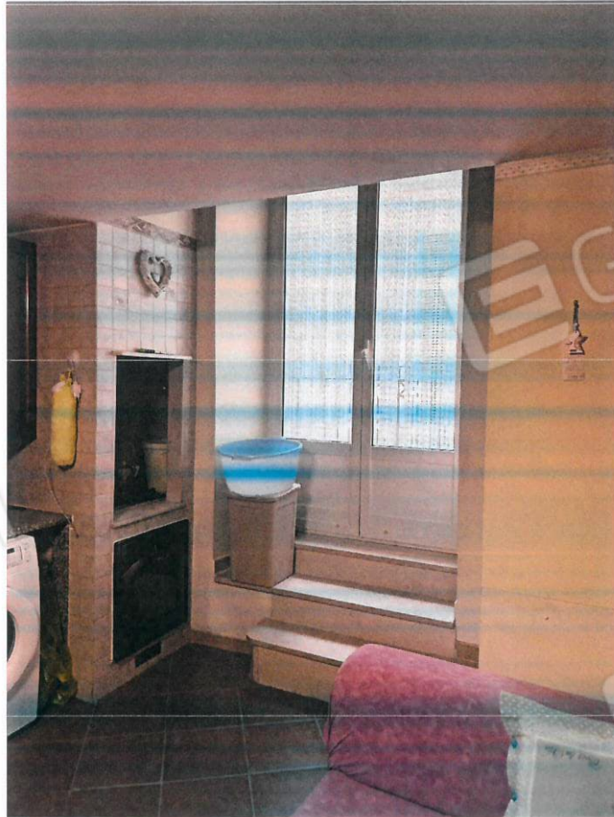
Cucina – Piano Primo