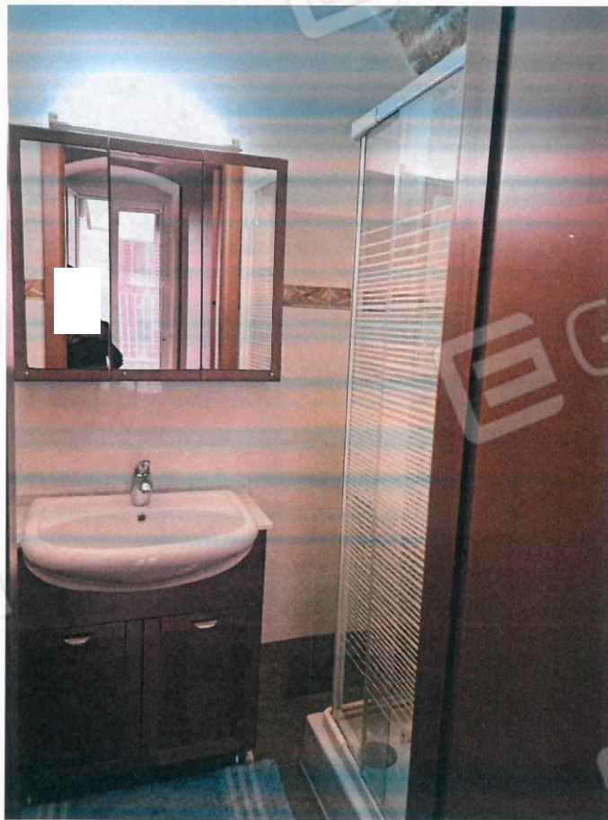
Bagno Piano primo