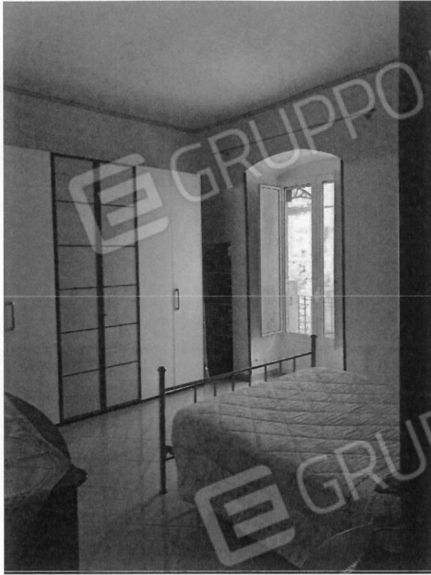
Camera da letto Piano secondo