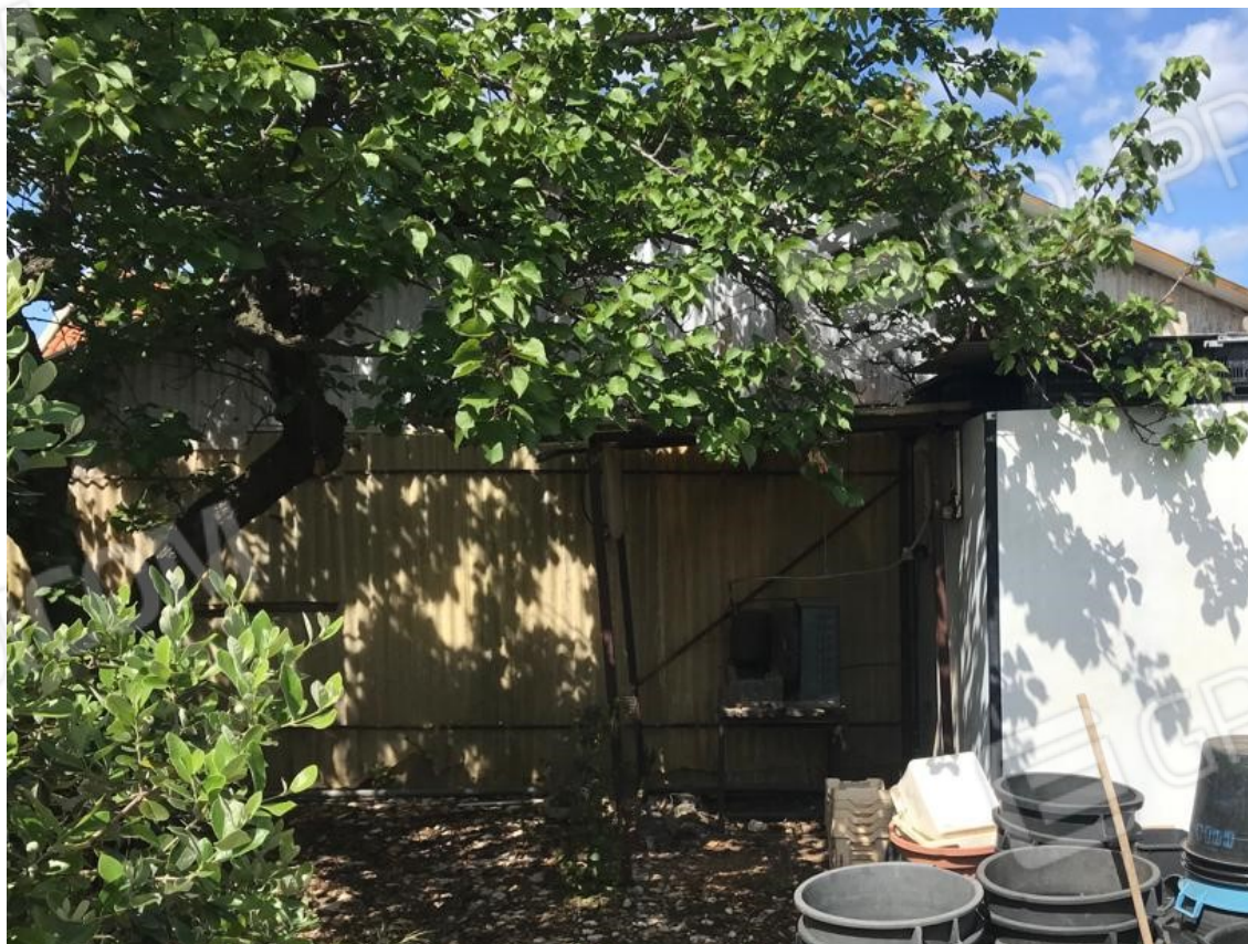
18. Lotto 001. Vista esterna del giardino, in adiacenza al deposito