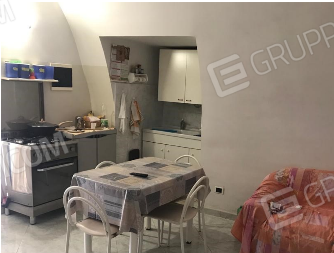
6. Lotto 001. Vista interna dell'appartamento. Ambiente di ingresso Pranzo/Soggiorno.