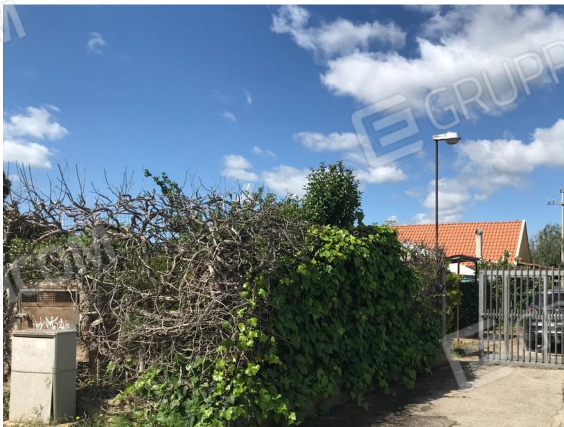
20. Lotto 001. Vista esterna accesso al compendio da Strada Fondo Rotondo.