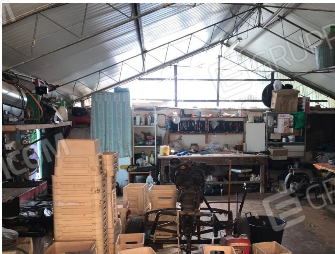
16. Lotto 001. Vista interna del deposito pertinenziale