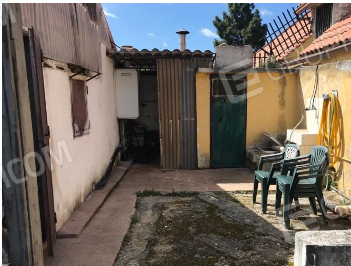
14. Lotto 001. Vista esterna. Spazio pertinenziale pavimentato a est della casa