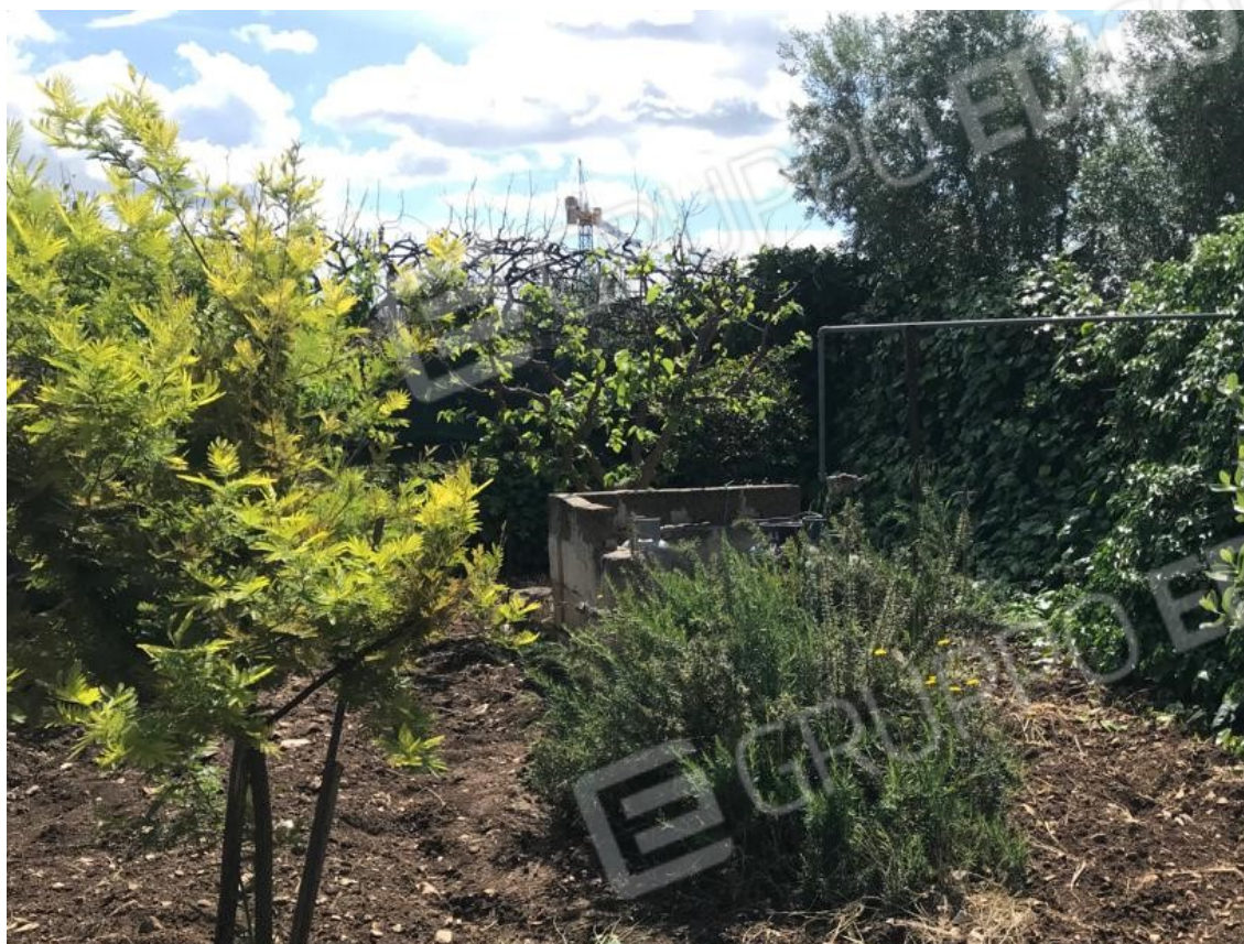
19. Lotto 001. Vista esterna del giardino.