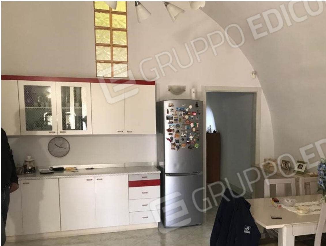
5. Lotto 001. Vista interna dell'appartamento. Ambiente di ingresso Pranzo/Soggiorno.