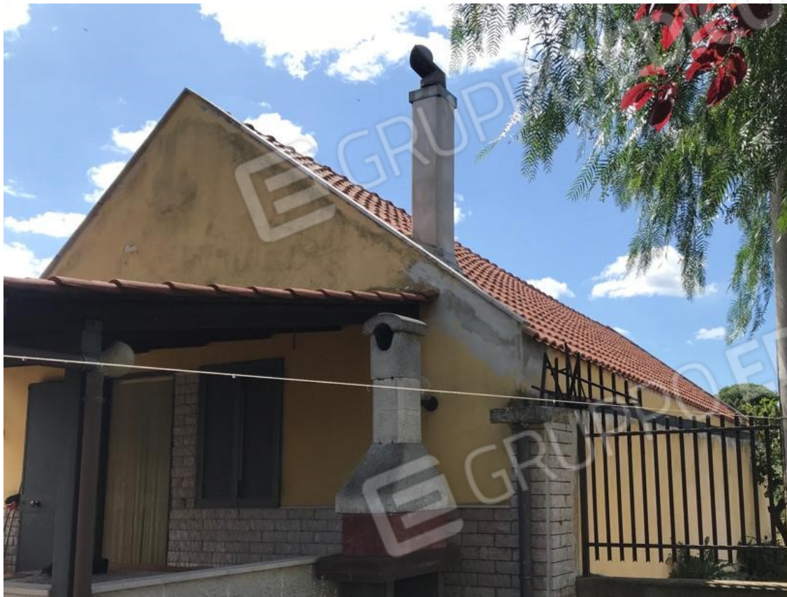
3. Lotto 001. Vista esterna della casa unifamiliare.