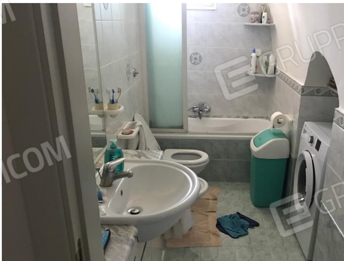
8. Lotto 001. Vista interna dell'appartamento. WC.