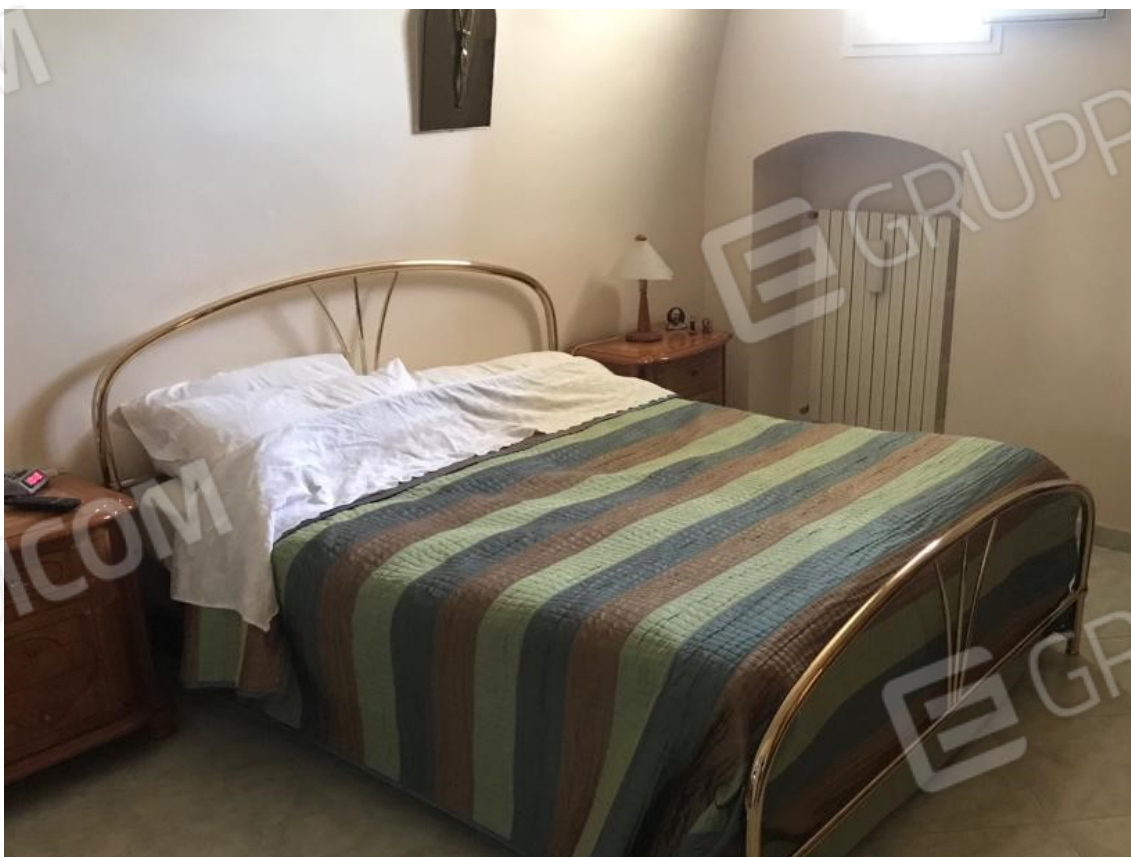
10. Lotto 001. Vista esterna dell'appartamento. Camera da letto matrimoniale