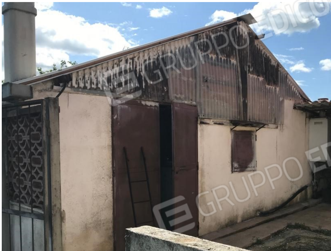
13. Lotto 001. Spazio pertinenziale pavimentato a est della casa. Accesso al deposito esterno