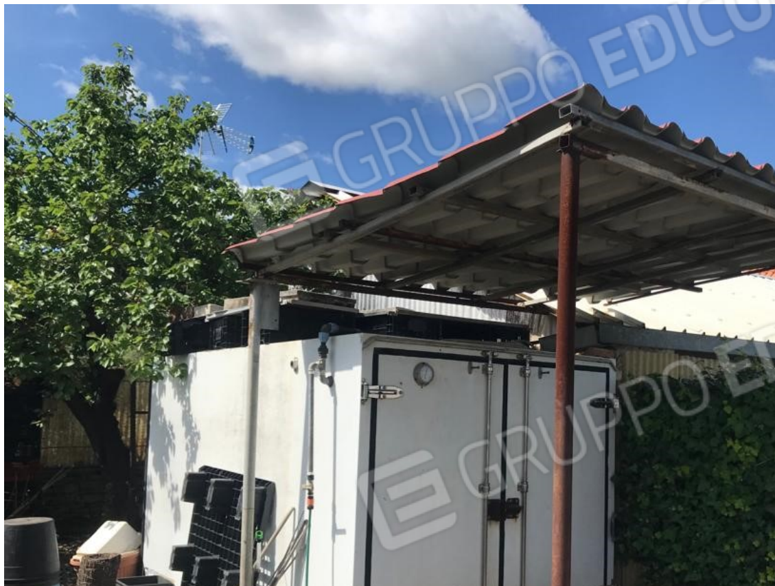
17. Lotto 001. Vista interna del deposito pertinenziale. Cella frigorifera