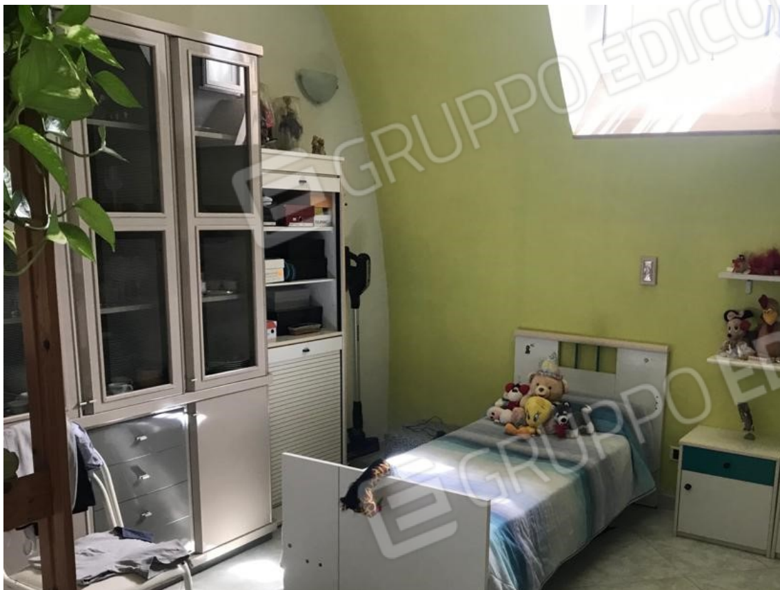
9. Lotto 001. Vista interna dell'appartamento. Camera da letto.