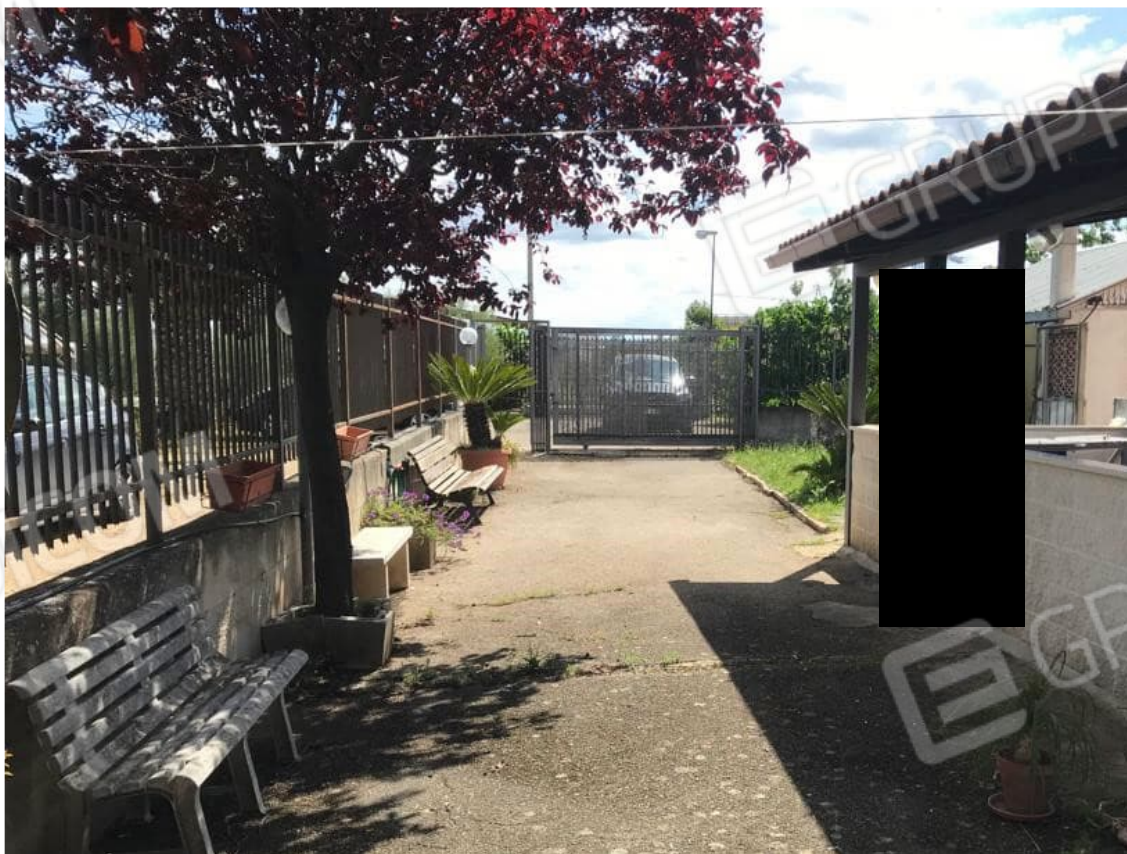
4. Lotto 001. Vista esterna della casa unifamiliare. Zona di ingresso e viale di accesso.