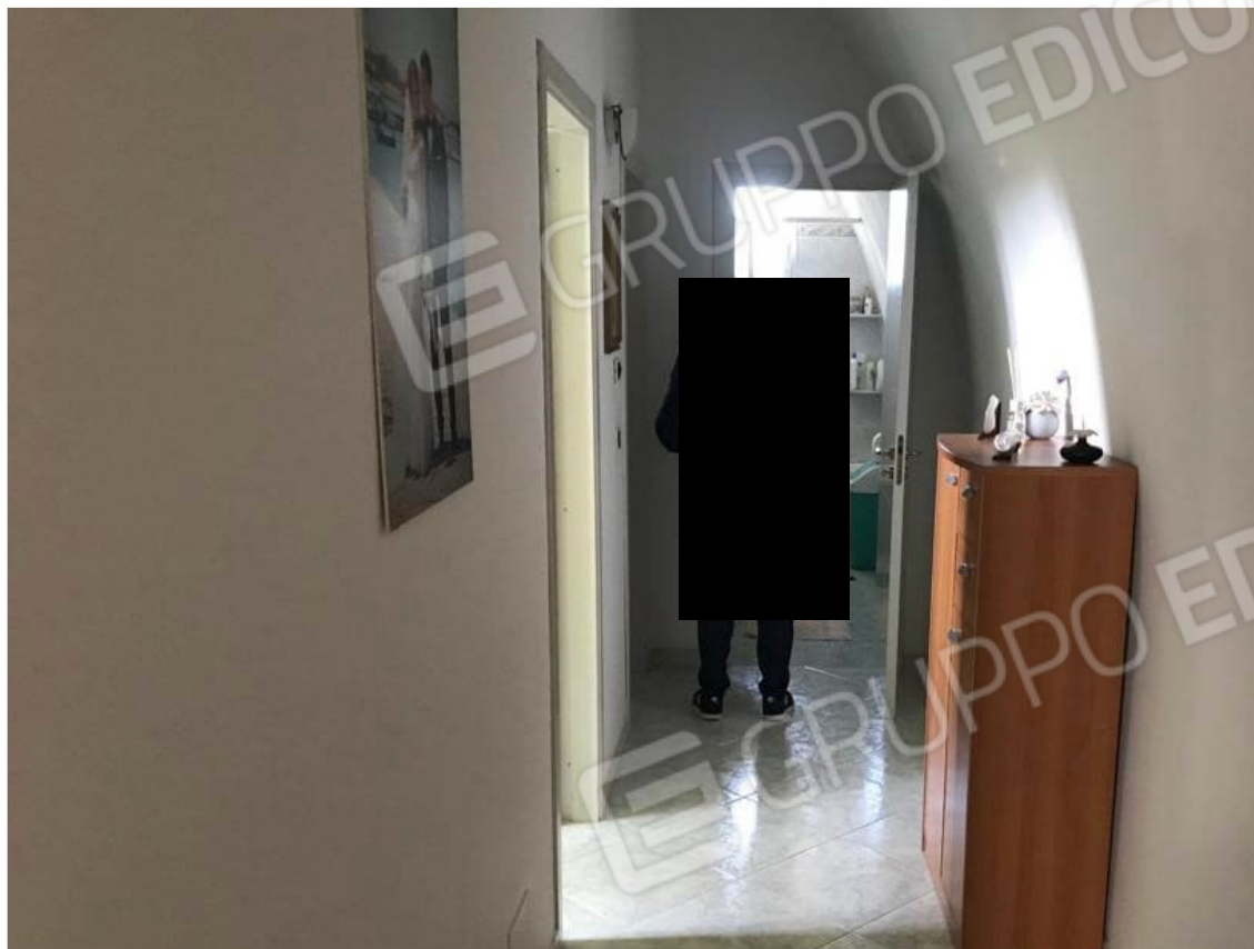
7. Lotto 001. Vista interna dell'appartamento. Corridoio.