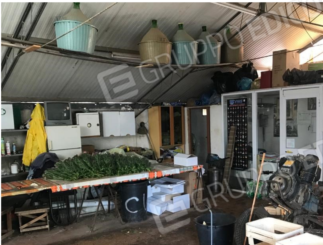
15. Lotto 001. Vista interna del deposito pertinenziale.