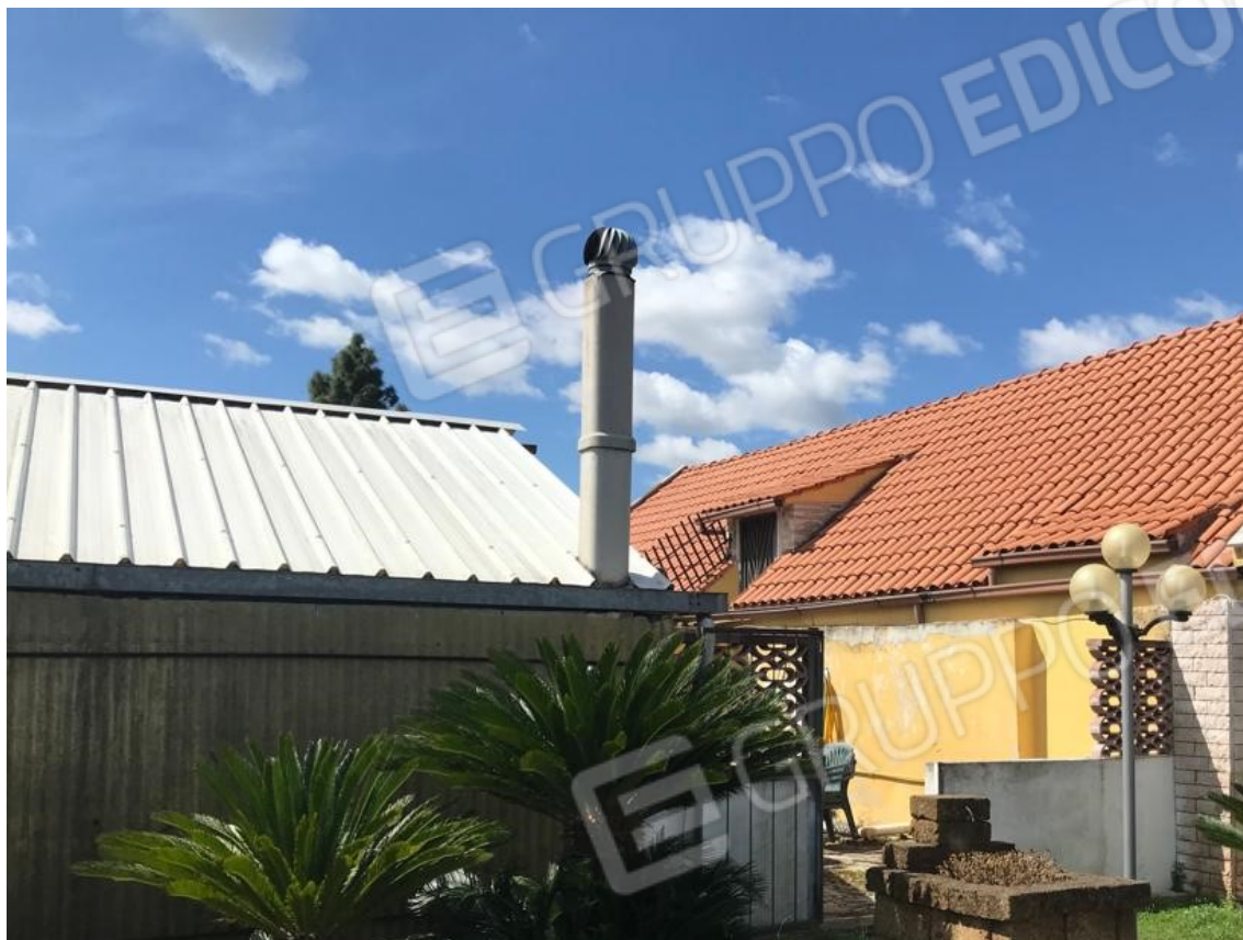
11. Lotto 001. Vista esterna spazio pertinenziale.