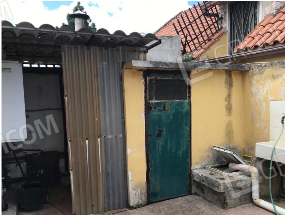
12. Lotto 001. Vista esterna. Spazio pertinenziale pavimentato a est della casa.