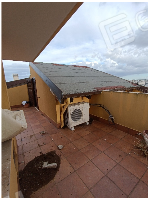
Vista del lastrico solare