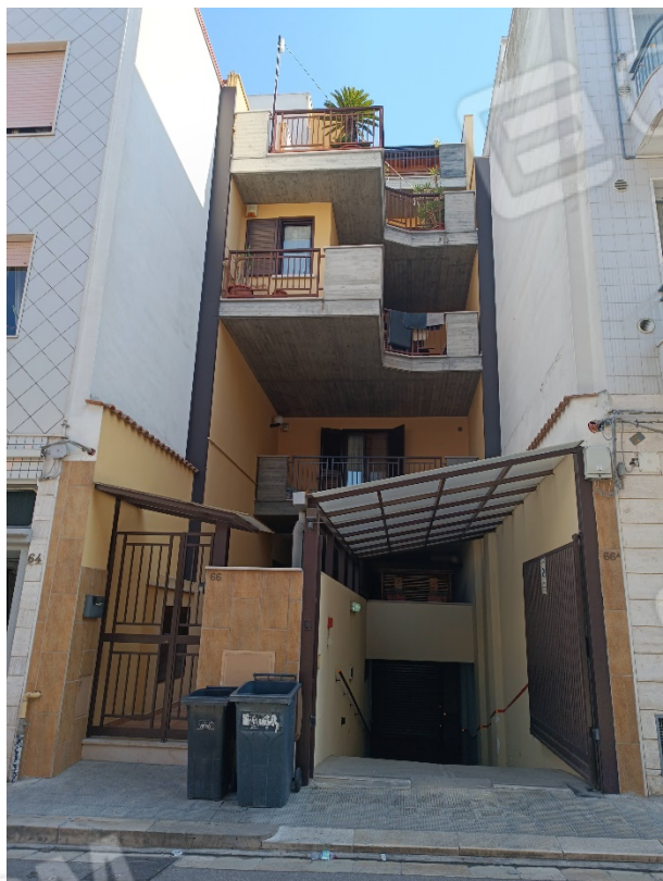
Vista ingresso del fabbricato