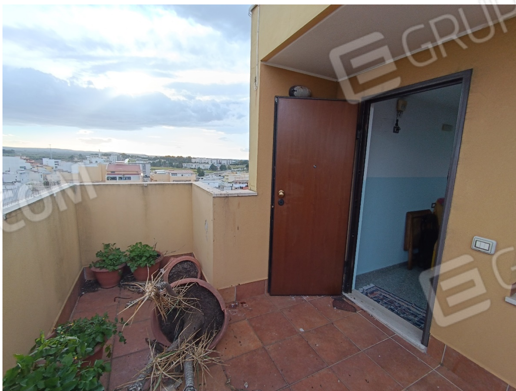
Vista accesso del lastrico solare