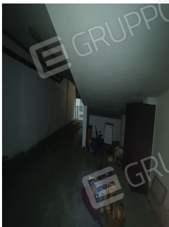
Vista della zona posteriore del box