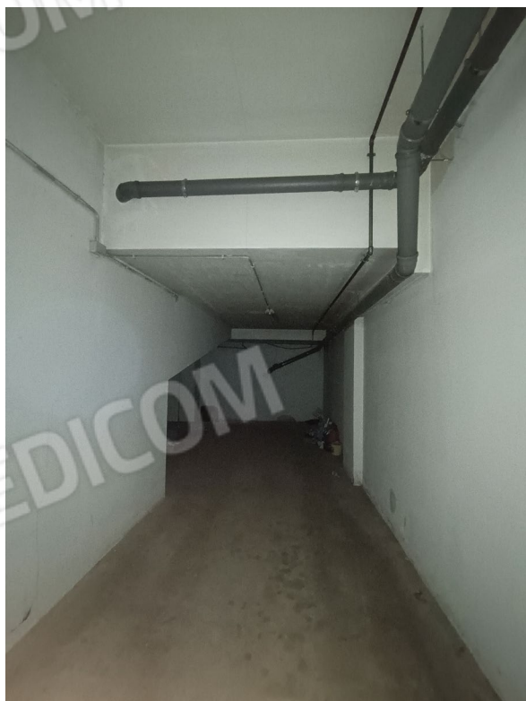
Vista della zona anteriore del box