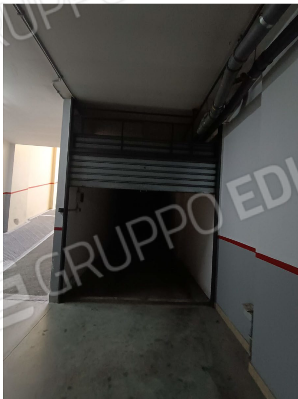
Vista accesso al box int.07