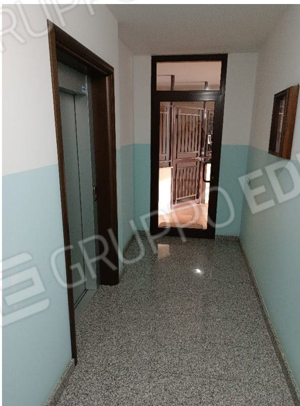
Vista dell'androne vano scala