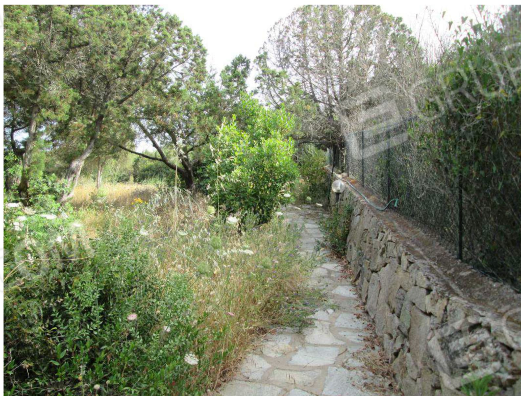
20 – Vista sul terreno foglio 3 mappale 180 –