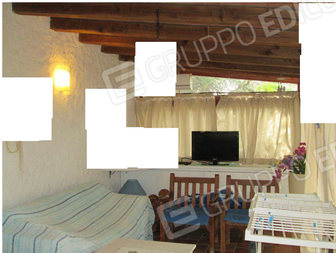
13 – Vista sulla veranda chiusa con infissi –