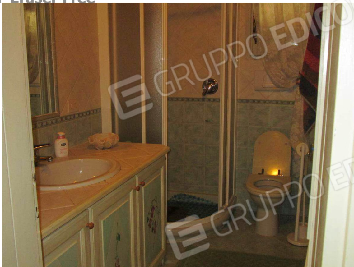
11 – Vista sul bagno –