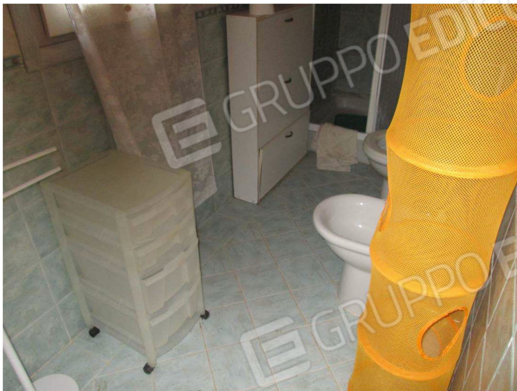
17 – Vista sul bagno dependance –