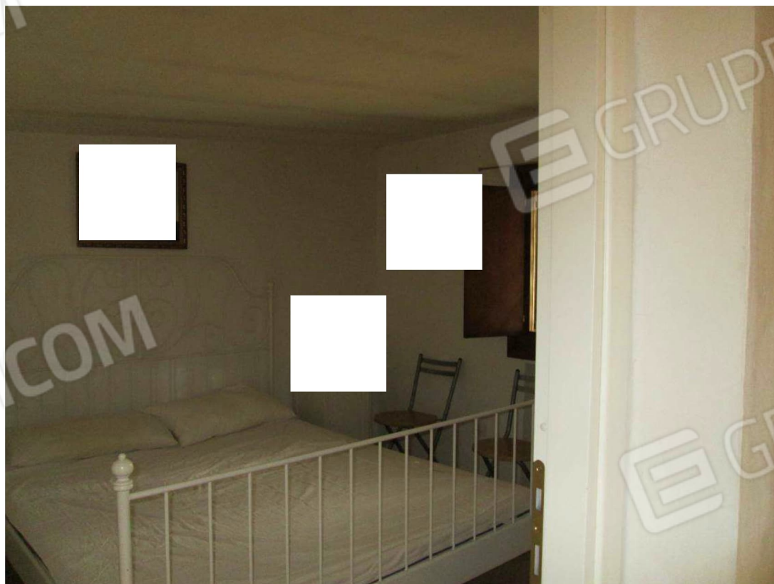
18 – Vista sul bagno dependance –