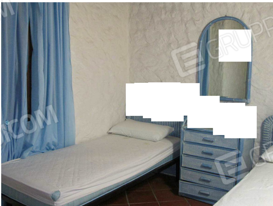
12 – Vista sulla camera –