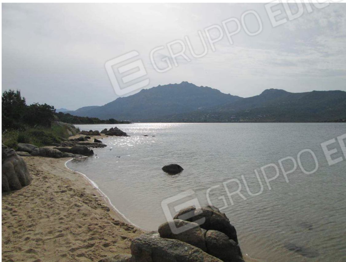
21 – Vista sul mare Golfo di Cugnana –