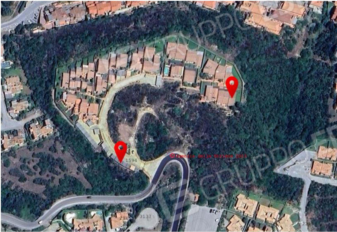
Foto del Contesto