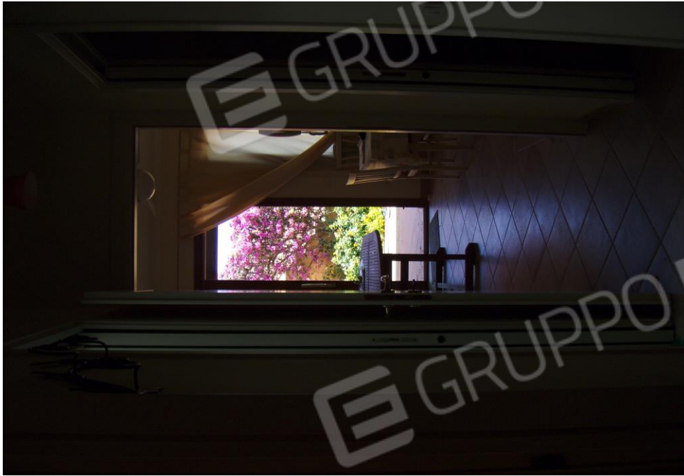
Foto Interne - Ripostiglio