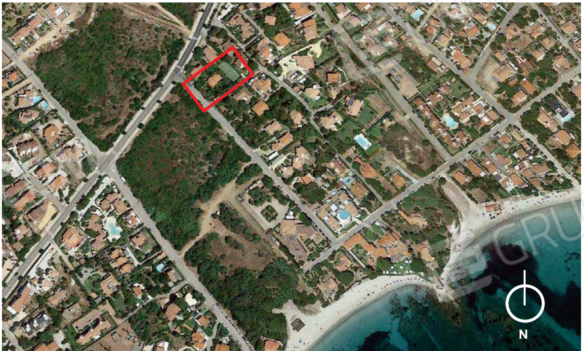
Aerofoto con individuazione dell'immobile oggetto di perizia.