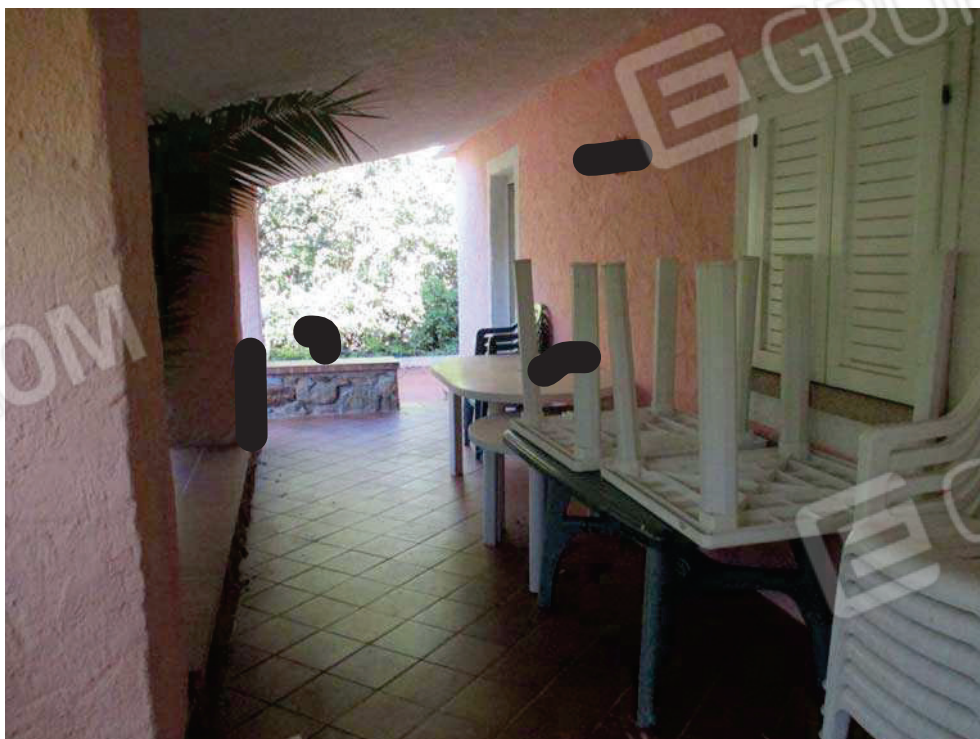
Vista veranda di ingresso.