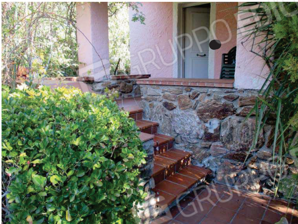
Vista scalinata di accesso all'immobile.