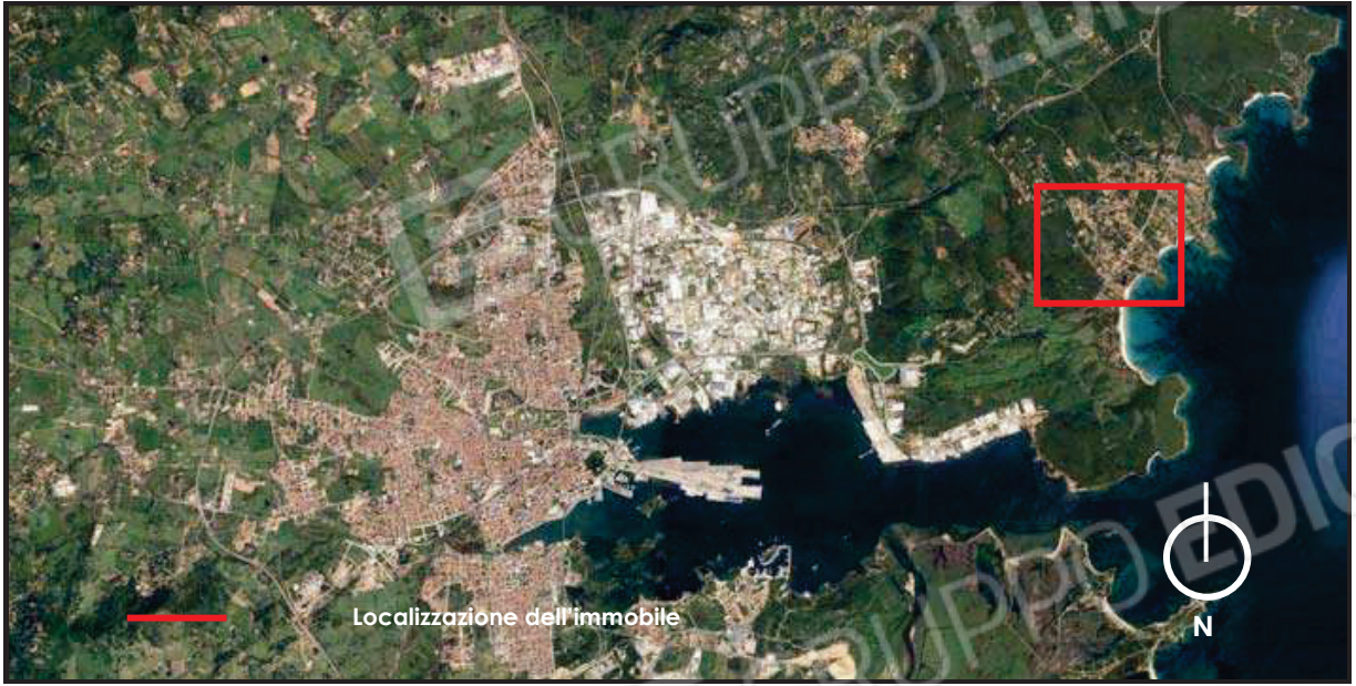
Aerofoto di Olbia con ubicazione della zona su cui sorge l'immobile.