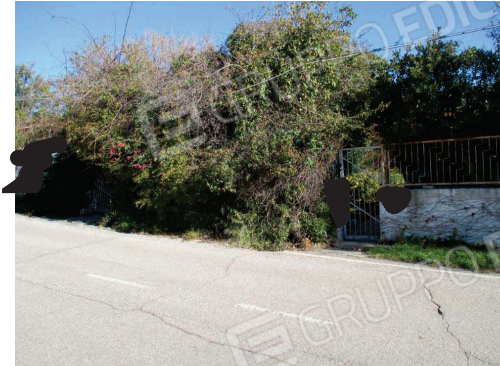
Vista da via Mar Adriatico.