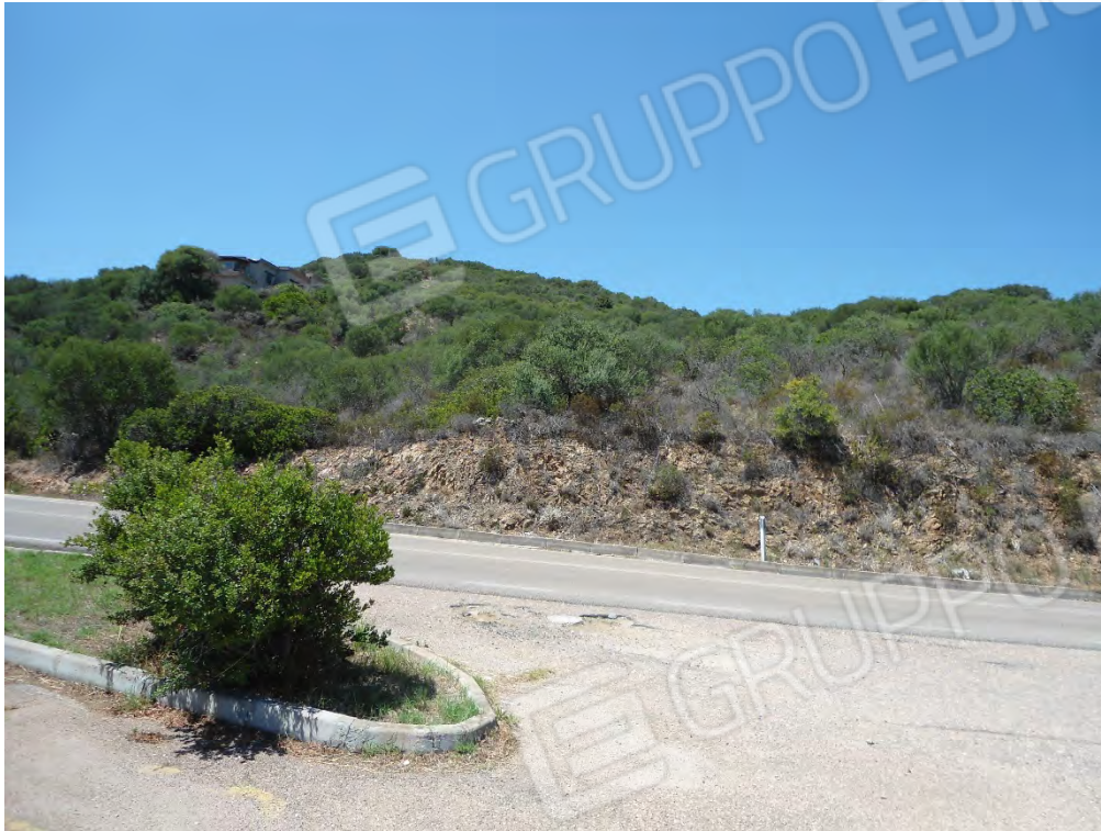
Foto n.29 – Scorcio dalla S.P. 73 del terreno di cui al foglio 18 particella 287