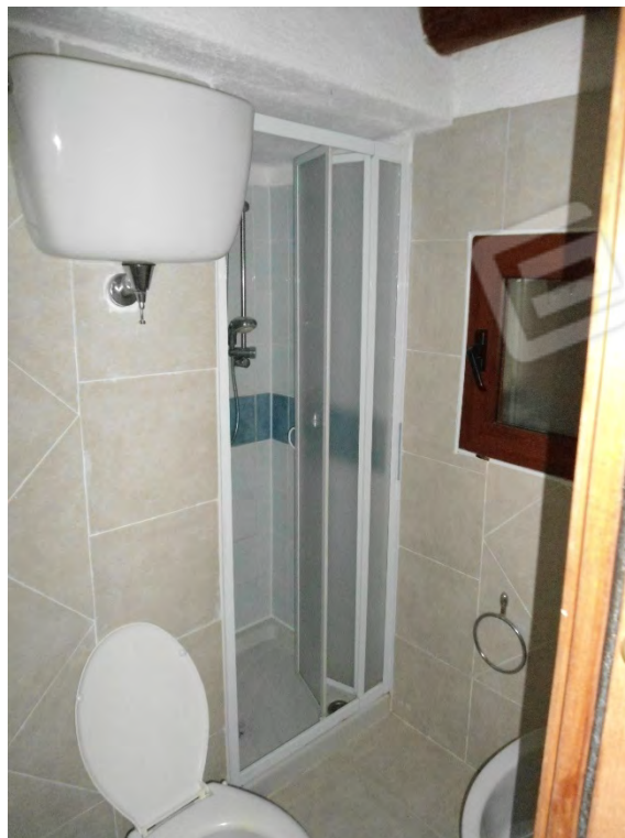
Foto n.16 – Bagno con doccia di pertinenza della camera al piano Primo