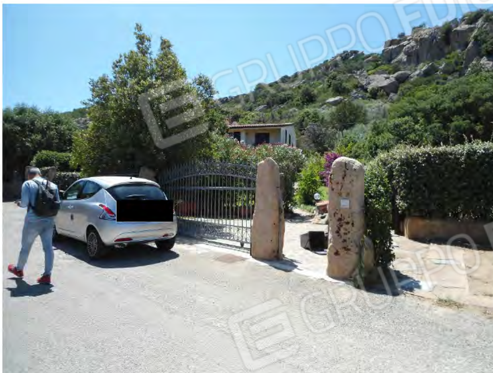
Foto n.1 – Ingresso all'interno n. 4 del corpo di fabbrica C1 (Lu Cumitoni)