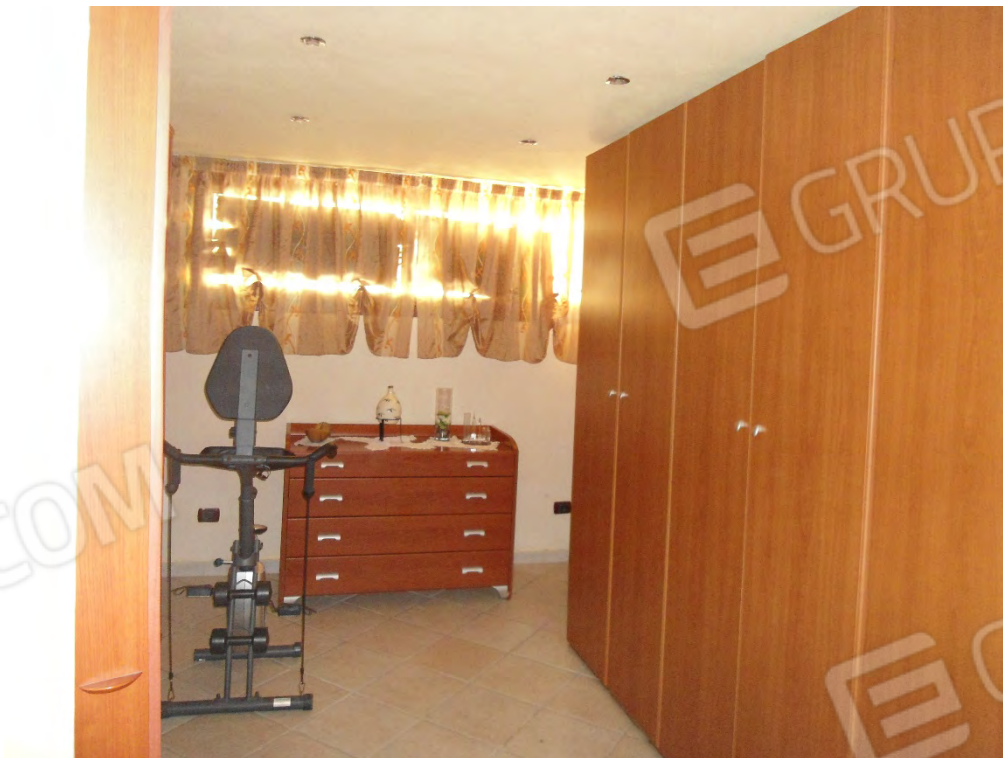
Foto n.24 – Camera guardaroba di pertinenza della camera padronale