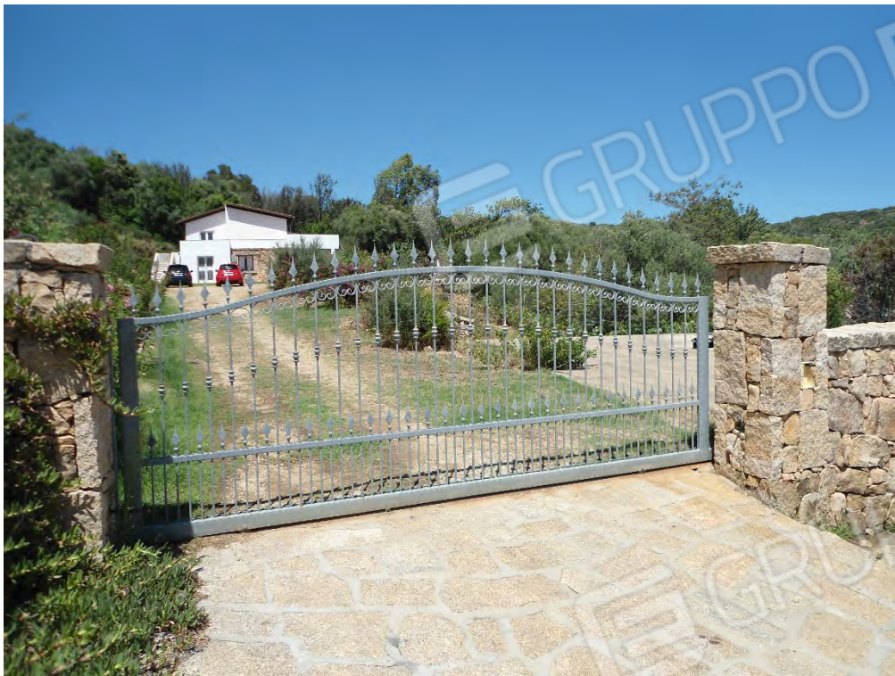
Foto n.31 – Scorcio del terreno di cui al foglio 18 particella 164