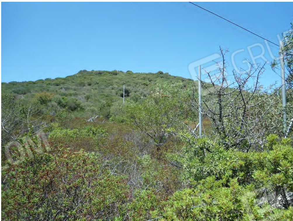
Foto n.30 – Scorcio dalla S.P. 73 del terreno di cui al foglio 18 particella 302