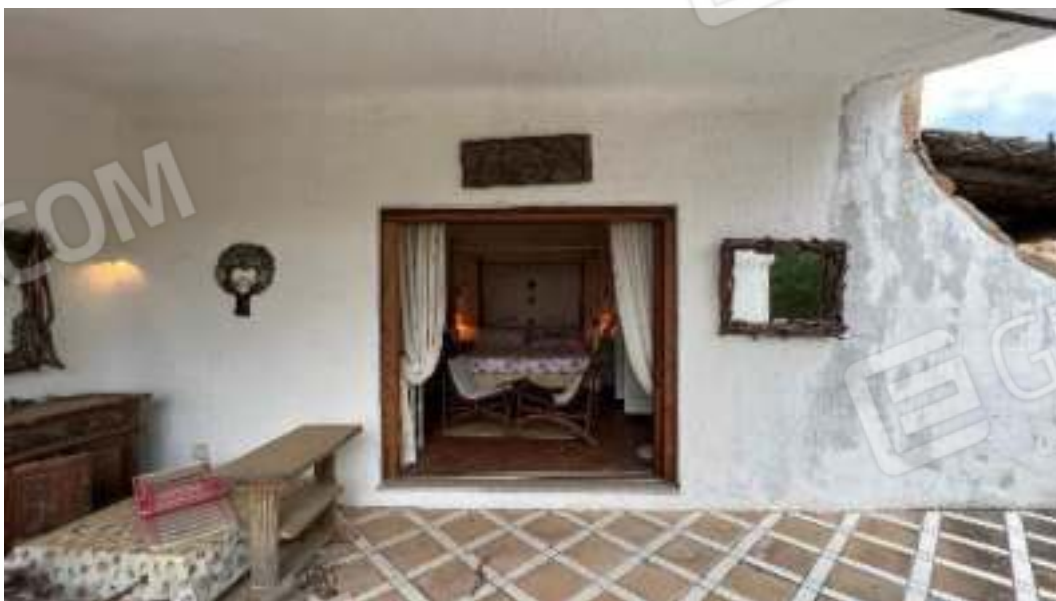
Figura 34 – Viste del piano terra, del camera 2 e della veranda esposta verso Est