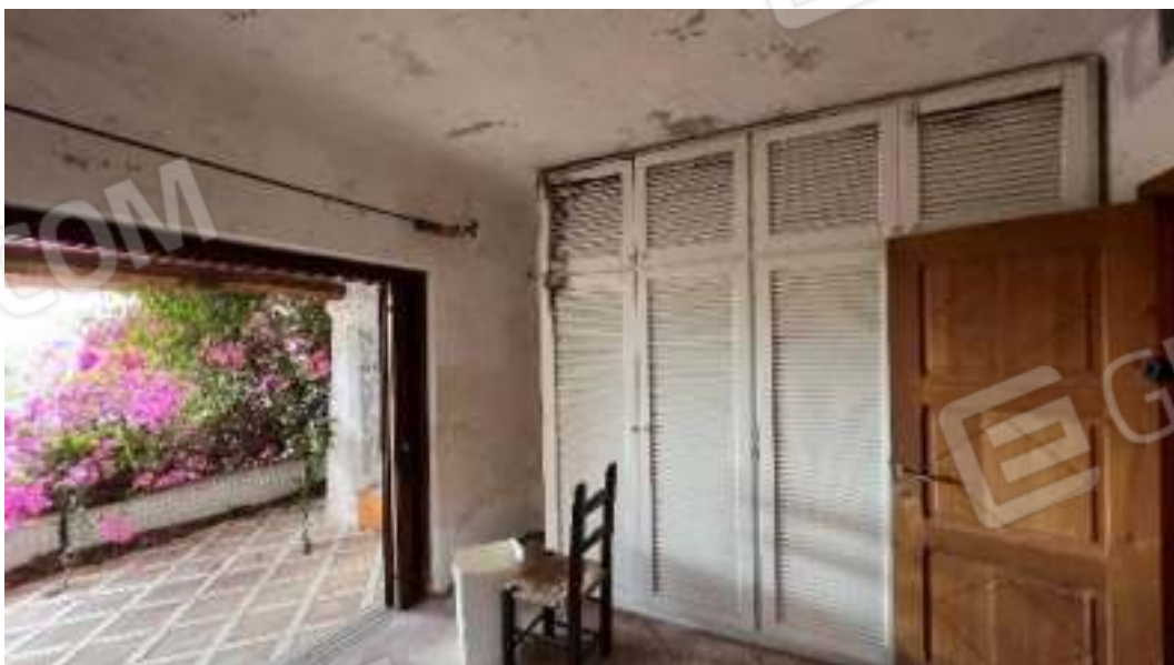
Figura 37 – Viste del piano terra, della camera 3