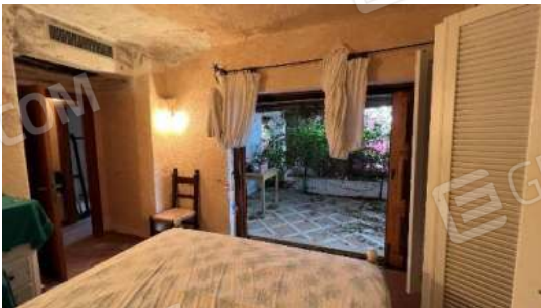
Figura 40 – Viste del piano terra, della camera 4