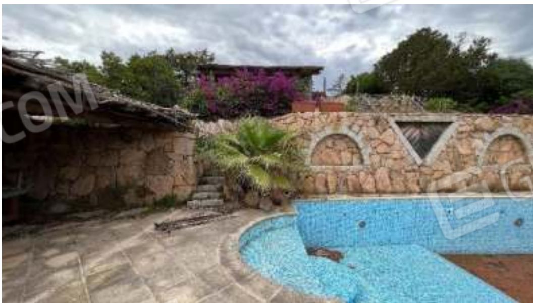
Figura 23 – Viste delle facciate del fronte Nord del bene