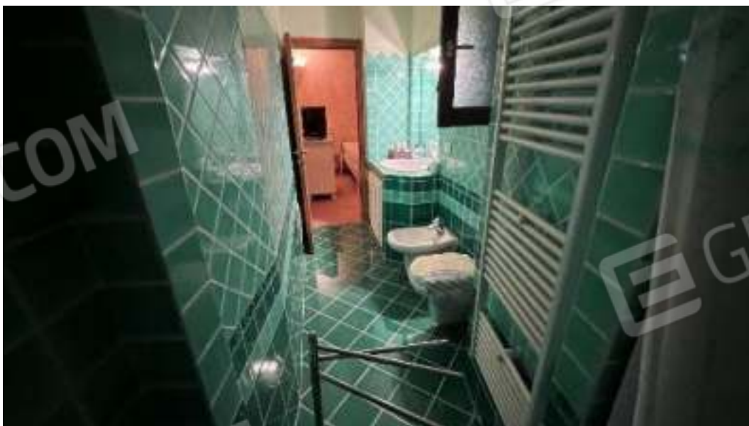
Figura 49 – Figura 50 – Viste del piano seminterrato del bagno 5