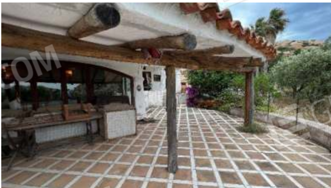
Figura 25 – Viste delle verande esterne accessibili dal soggiorno volte verso Est