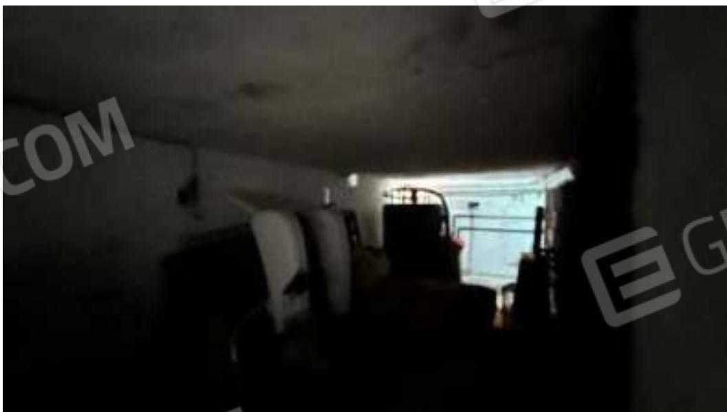
Figura 58 – Viste del piano seminterrato del locale tecnico