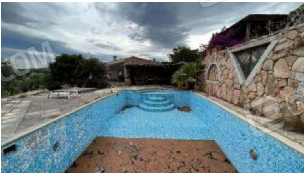
Figura 17 – Ulteriori viste sulla piscina