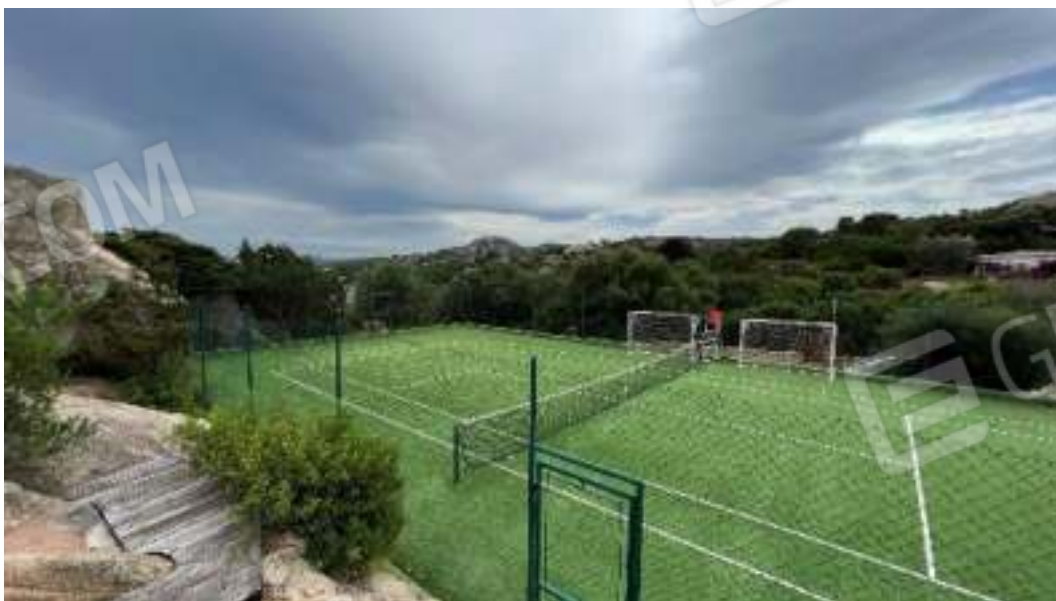
Figura 4 – Viste di un campo sportivo del comprensorio ubicato nelle immediate vicinanze del bene