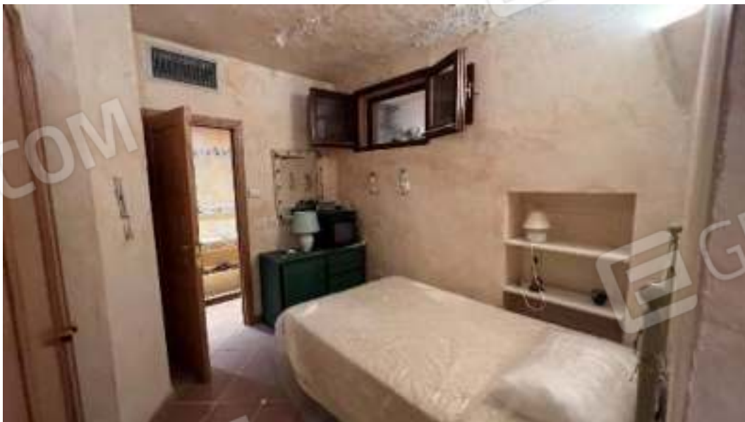
Figura 55 – Viste del piano seminterrato della lavanderia stiroeria arredata come camera da letto