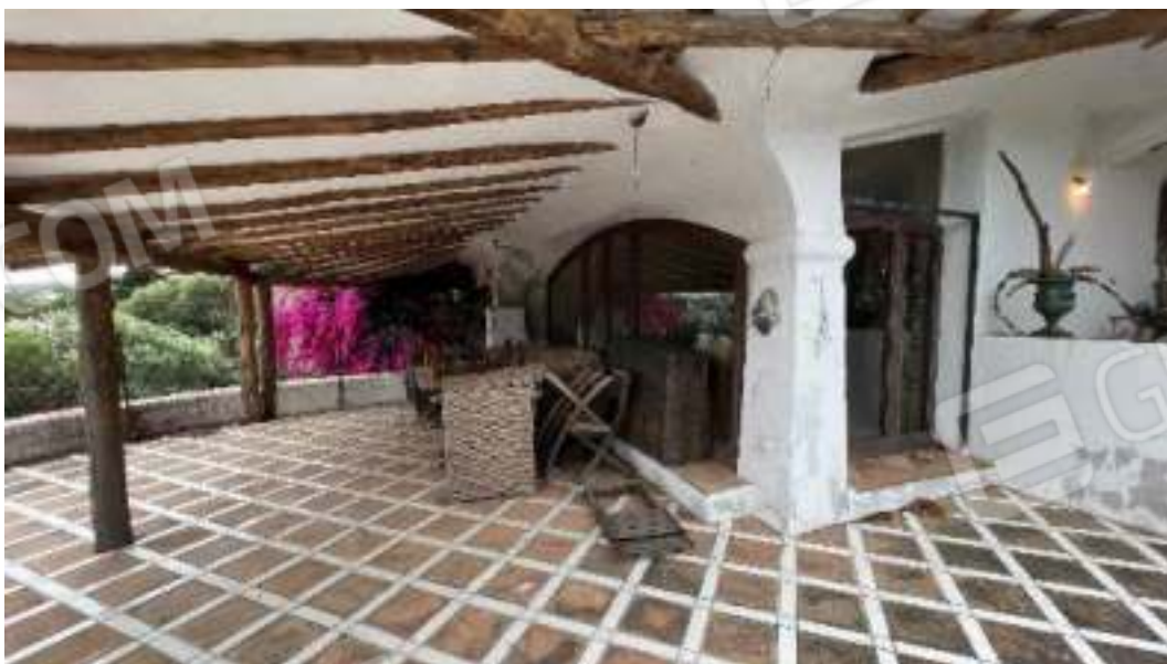
Figura 24 – Viste delle verande esterne accessibili dal soggiorno volte verso Est