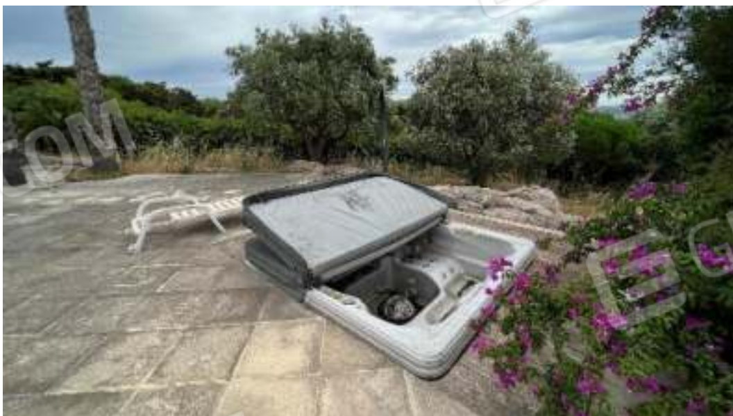
Figura 18 – Viste sulla terrazza che ospita piscina e vasca idromassaggio