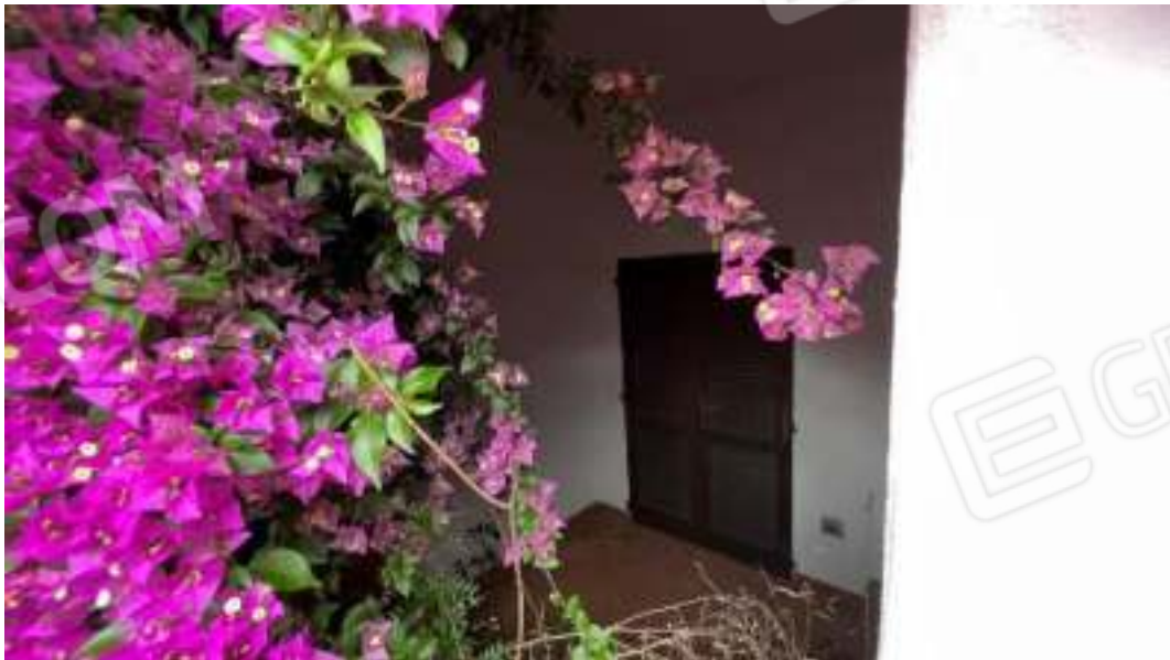
Figura 21 – Viste delle facciate del fronte Sud del bene