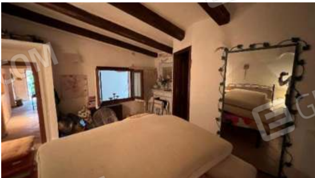
Figura 31 – Viste del piano terra, della camera 1