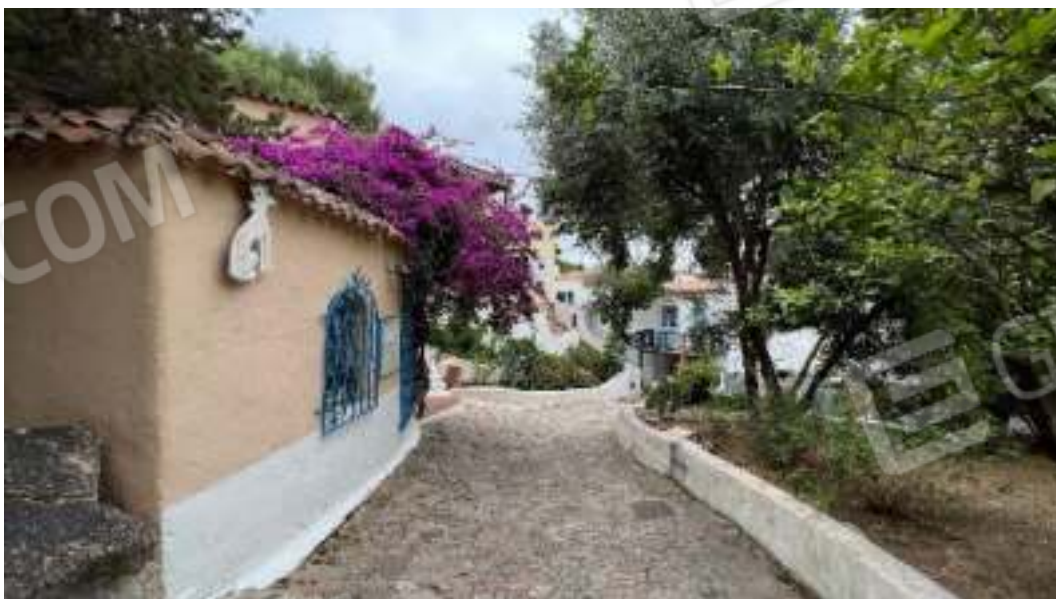
Figura 1 – Viste della zona di ingresso del comprensorio e dei collegamenti pedonali interni