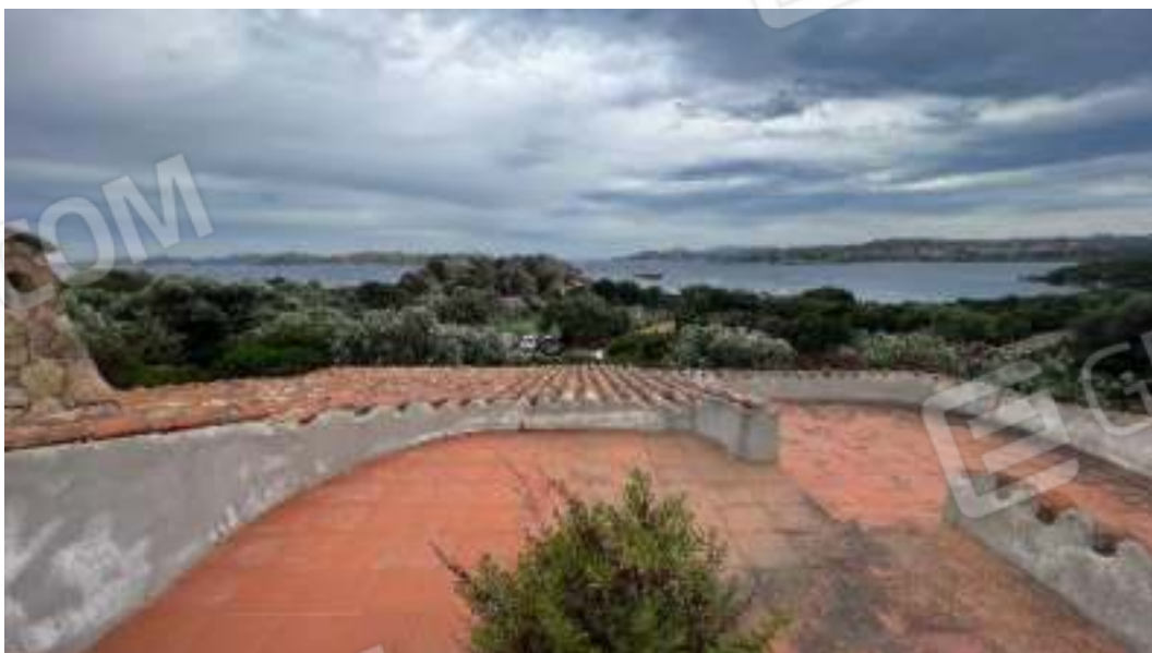
Figura 11 – Viste dal piano di copertura