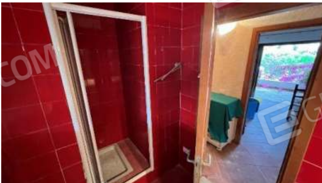
Figura 39 – Viste del piano terra, del bagno 3