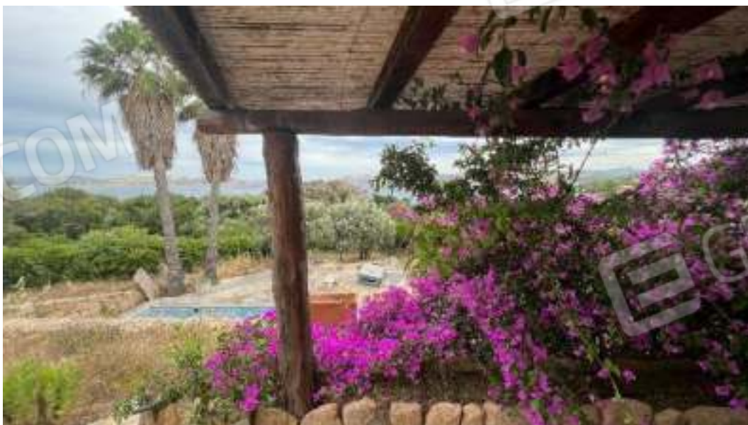
Figura 9 – Viste sull'area barbecue