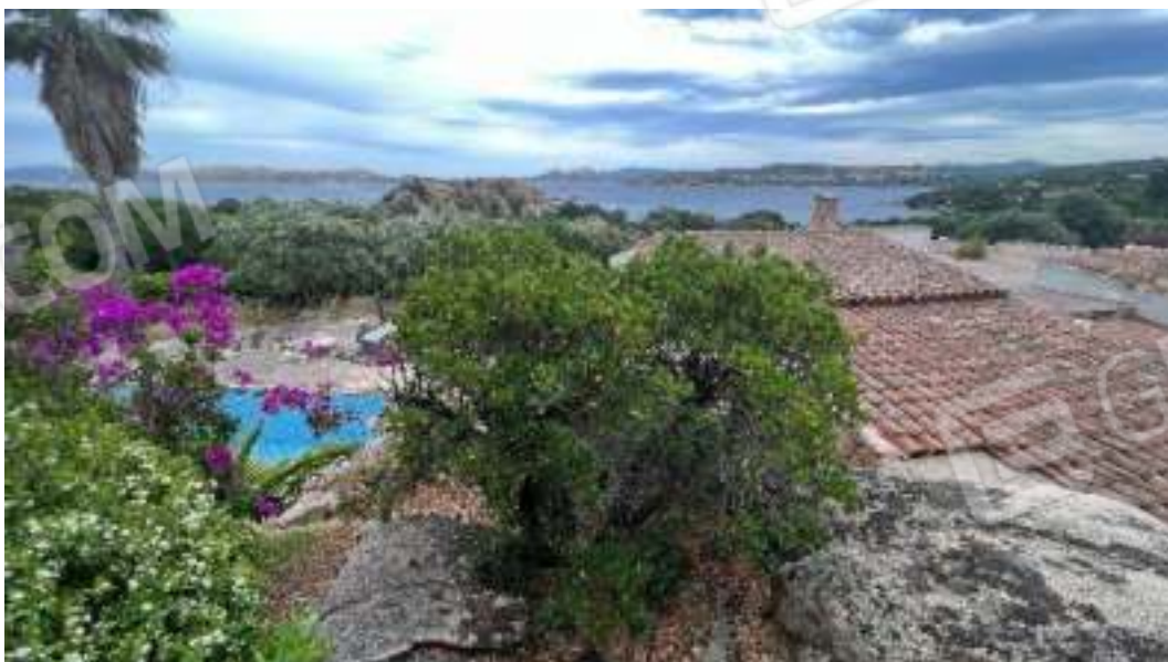
Figura 16 – Viste sulla piscina