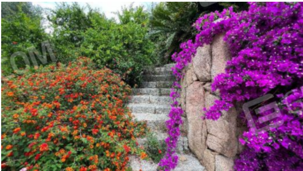
Figura 15 – Ulteriori viste dall'interno del giardino di proprietà degli spazi esterni del bene