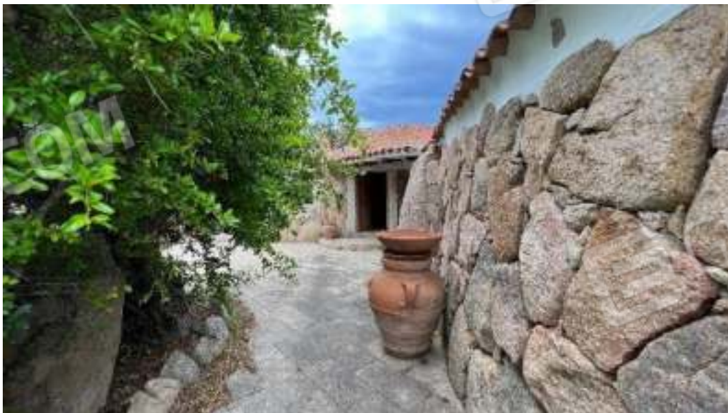
Figura 20 – Ulteriori viste delle facciate del fronte Ovest del bene