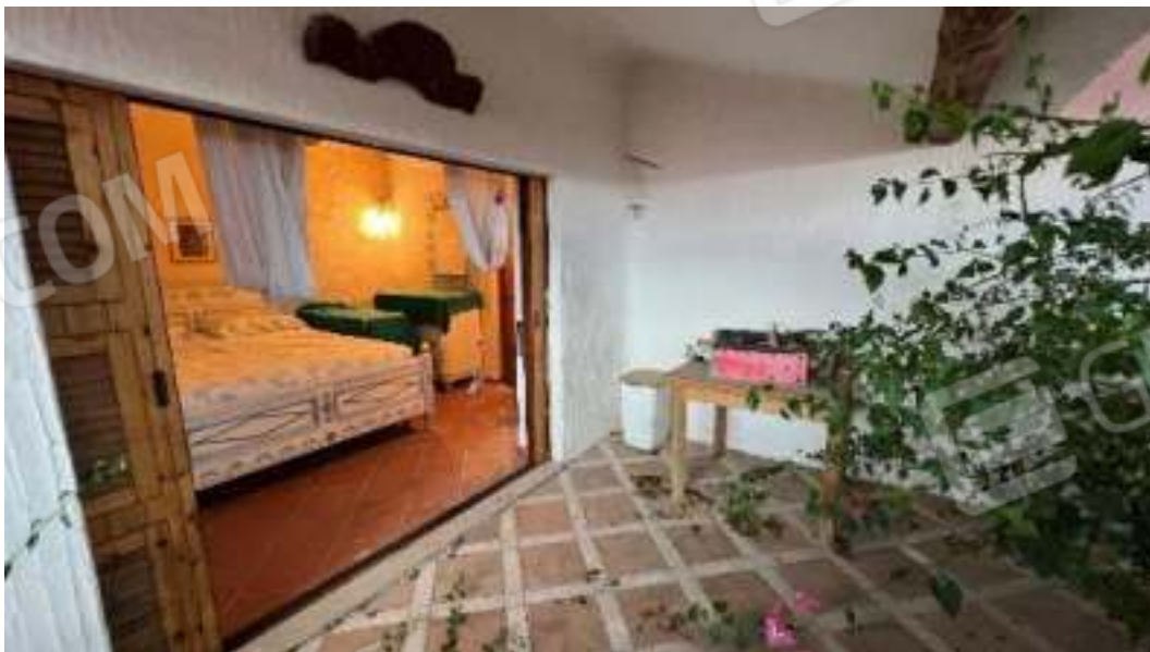
Figura 41 – Viste del piano terra, del camera 4 e della sua veranda