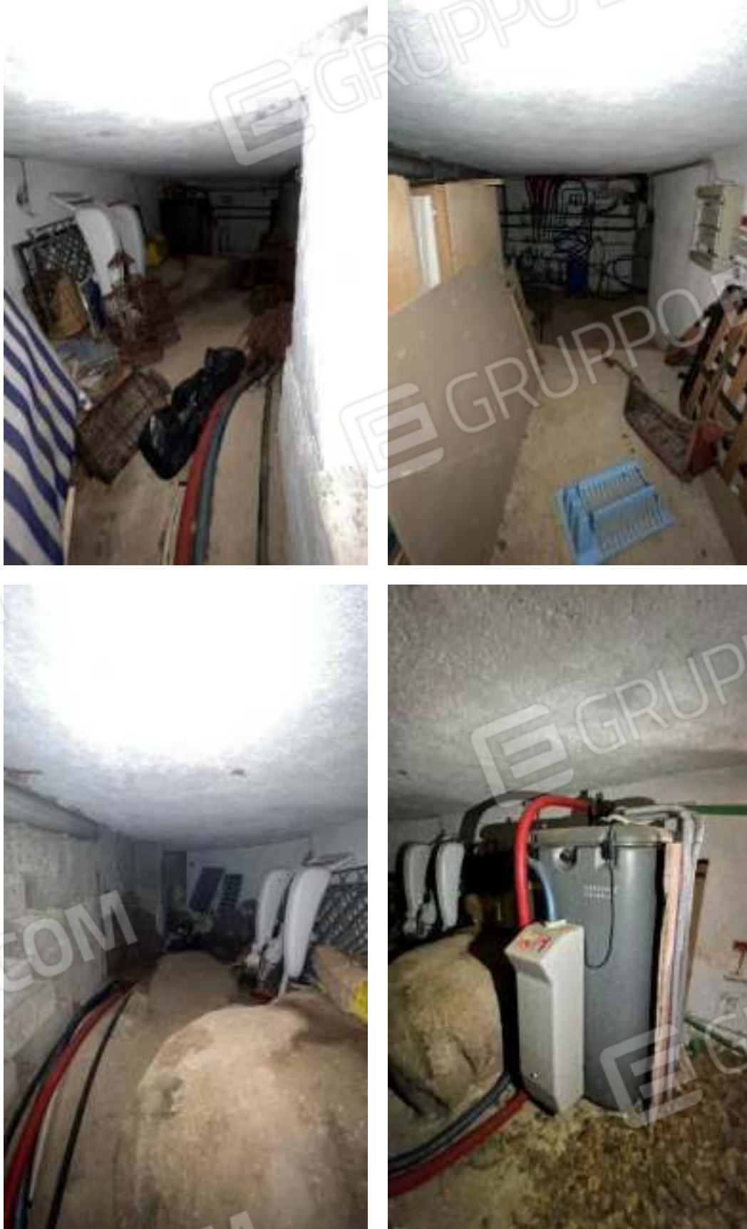
Figura 60 – Viste del piano seminterrato del locale tecnico