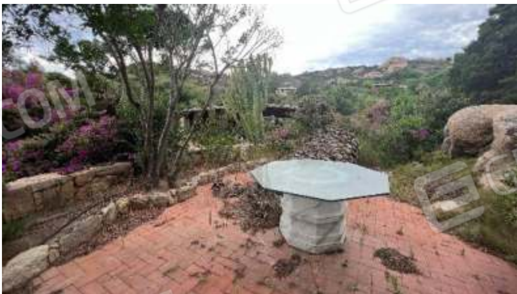
Figura 13 – Viste dell'area destinata a pranzo all'aperto