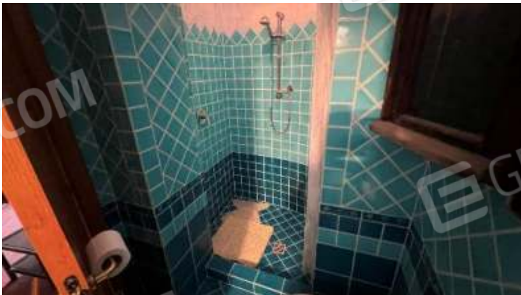
Figura 54 – Viste del piano seminterrato del bagno