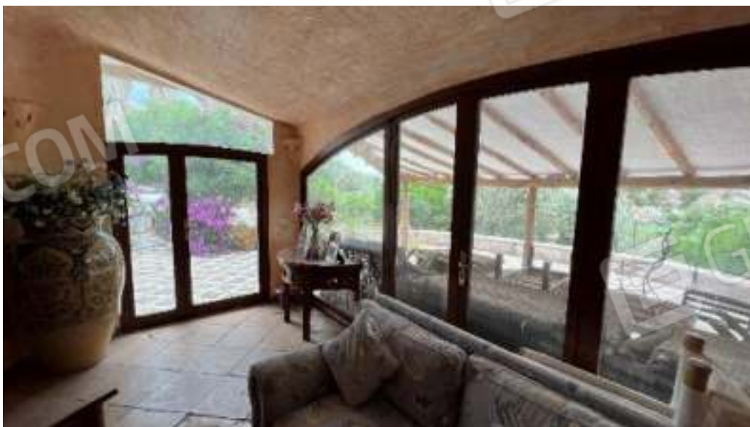
Figura 27 – Viste del piano terra, sulla sala da pranzo e sul soggiorno