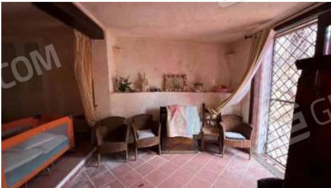
Figura 53 – Viste del piano seminterrato della camera 7