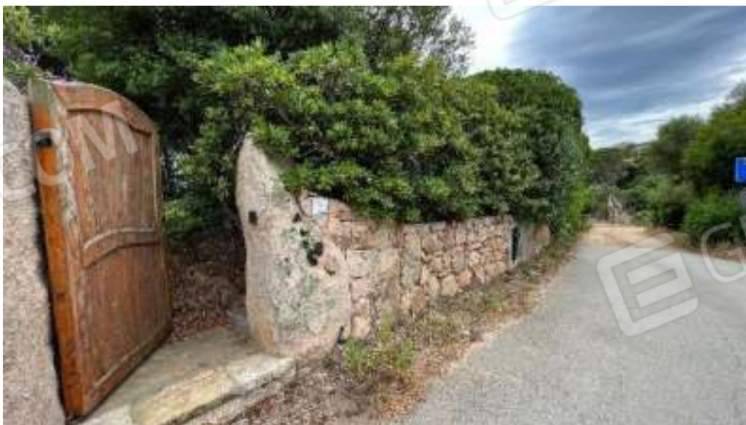
Figura 5 – Viste della recinzione esterna degli ingressi pedonali del bene