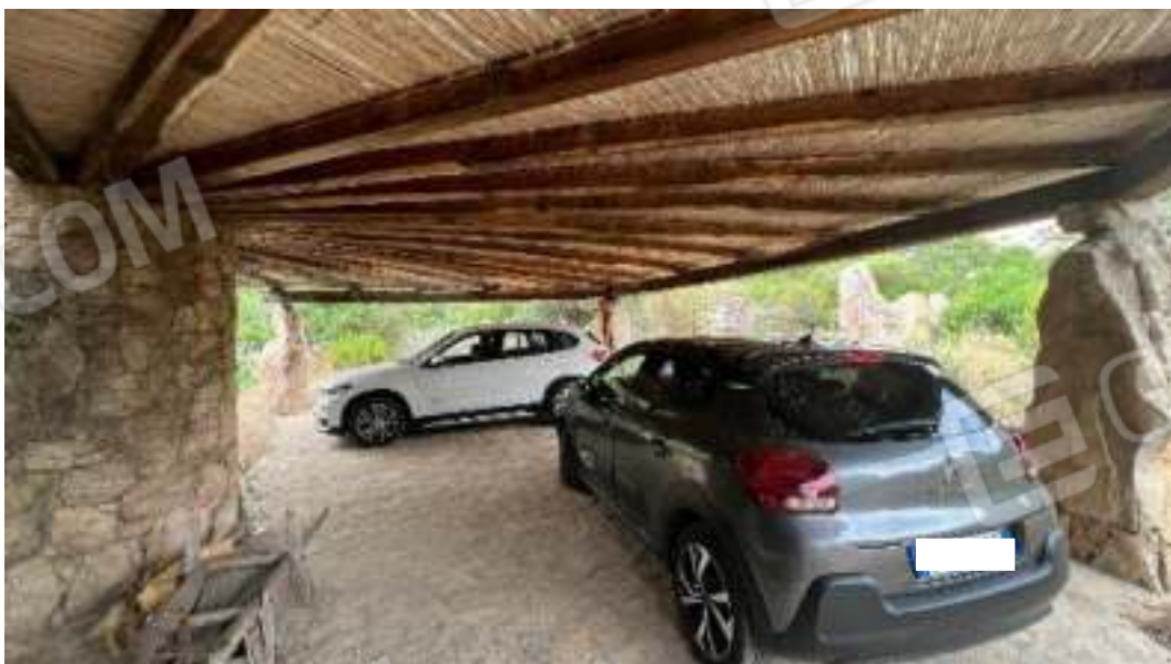
Figura 14 – Viste dell'area destinata a parcheggio coperto