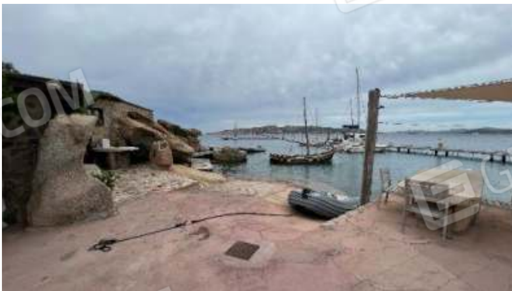
Figura 3 – Viste dello yacht club del comprensorio ubicato nelle immediate vicinanze del bene