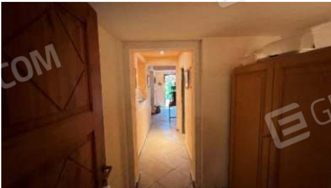
Figura 30 – Viste del piano terra, del disimpegno 1