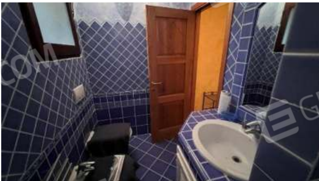
Figura 52 – Viste del piano seminterrato del bagno 6