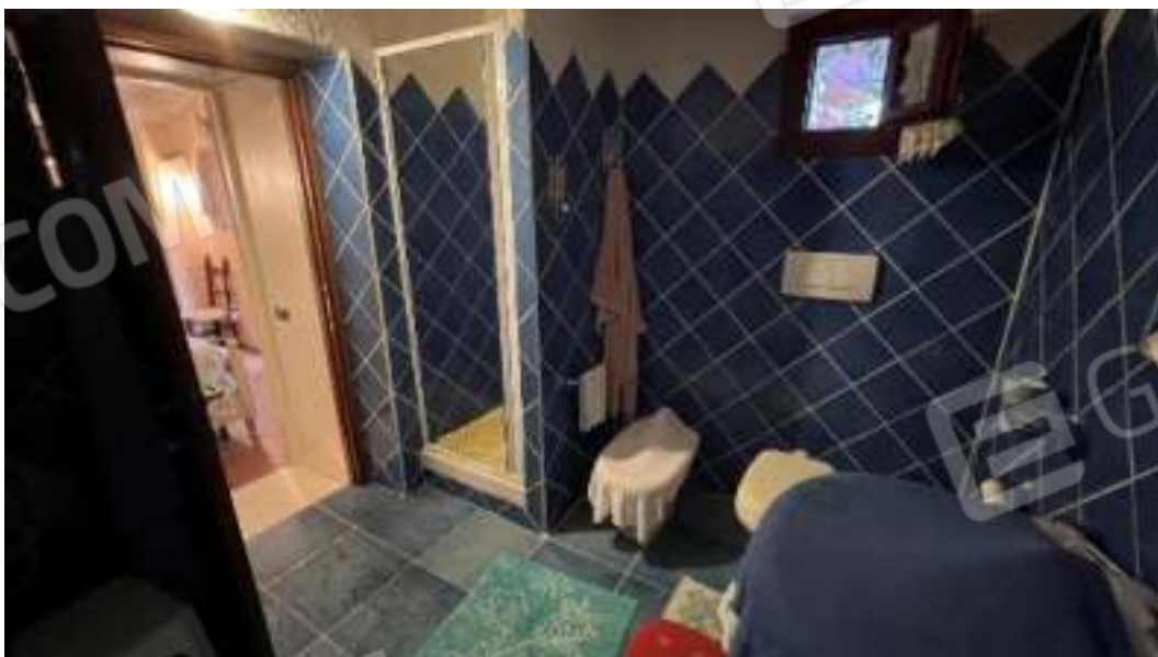
Figura 42 – Viste del piano terra, del bagno 4