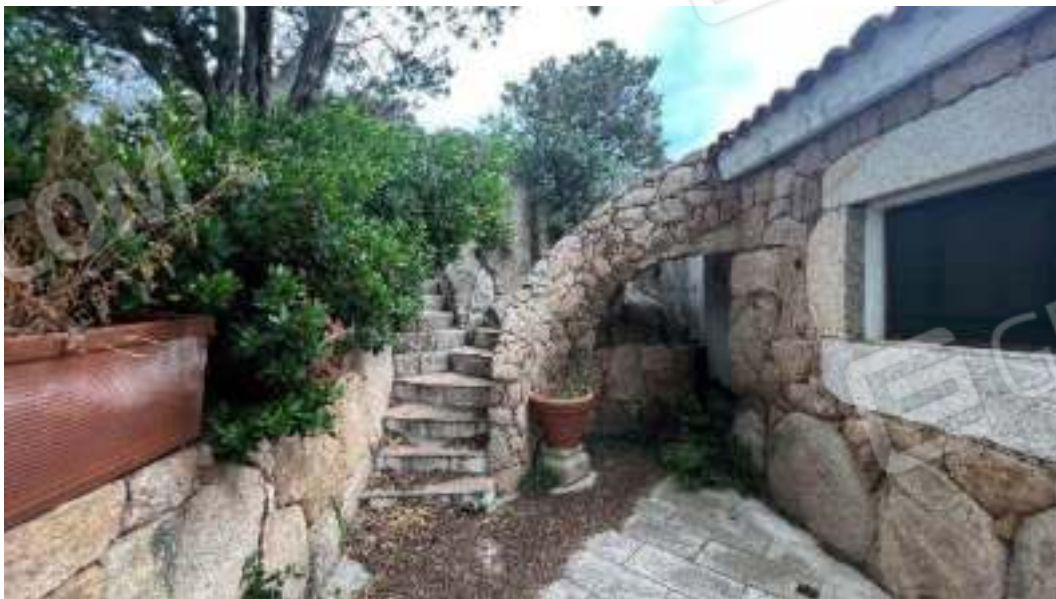
Figura 10 – Viste dall'interno del giardino di proprietà degli spazi esterni del bene