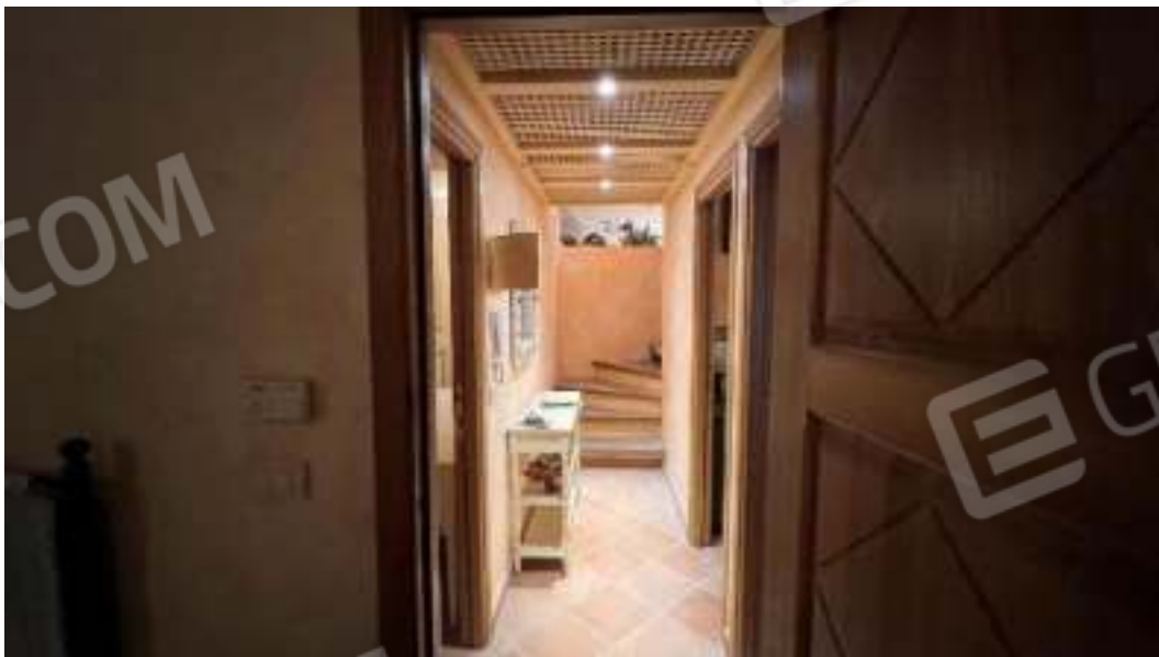
Figura 44 – Viste del piano seminterrato del disimpegno 3