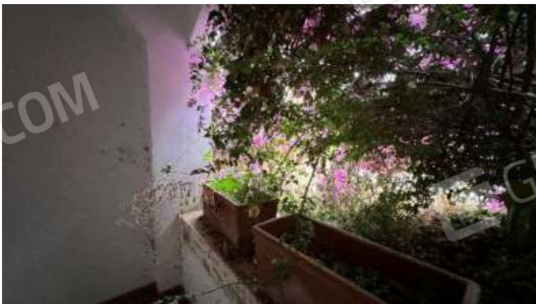
Figura 47 – Figura 48 – Viste del piano seminterrato della veranda della camera 5