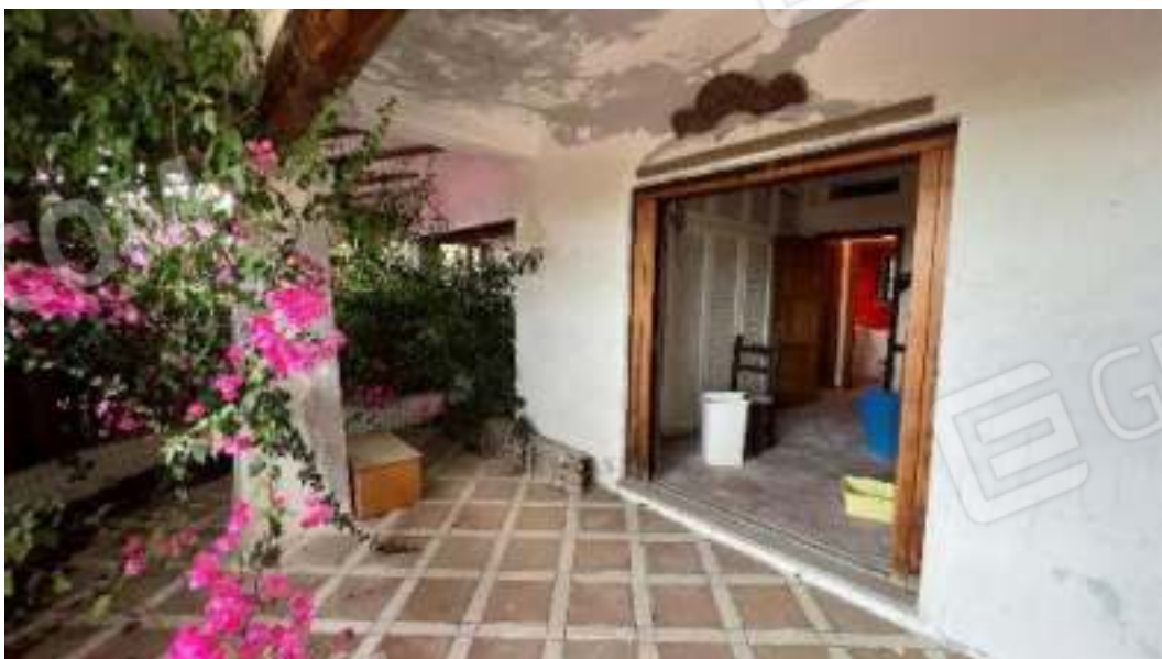
Figura 38 – Viste del piano terra, del camera 3 e della sua veranda