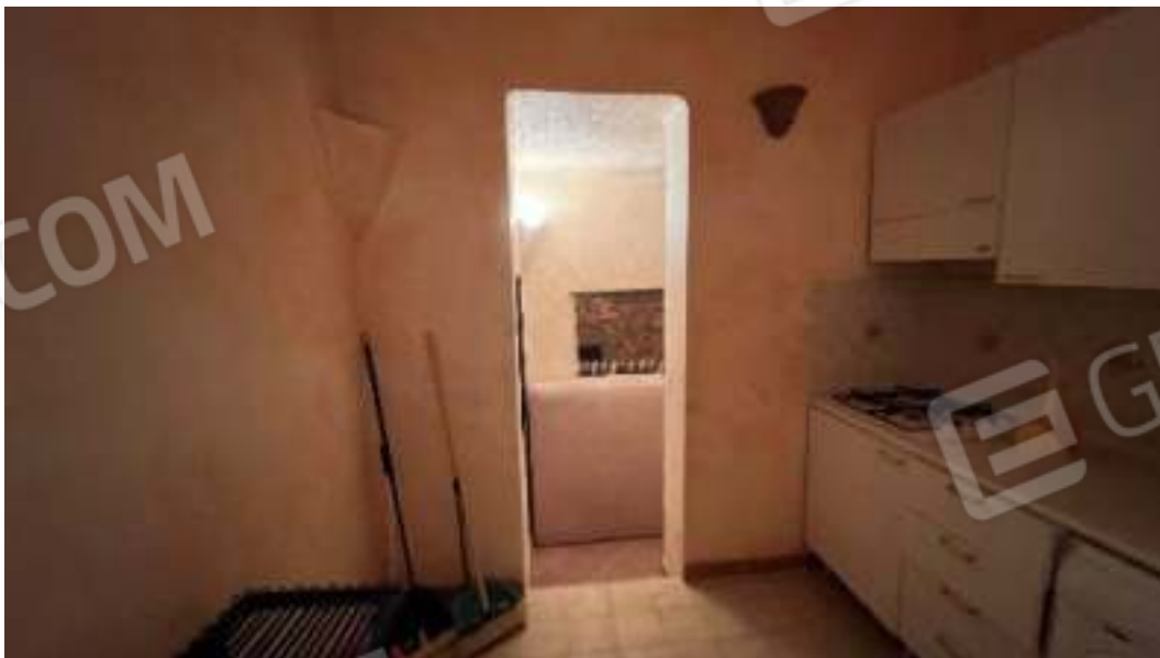
Figura 56 – Viste del piano seminterrato del locale di sgombero arredato come cucina