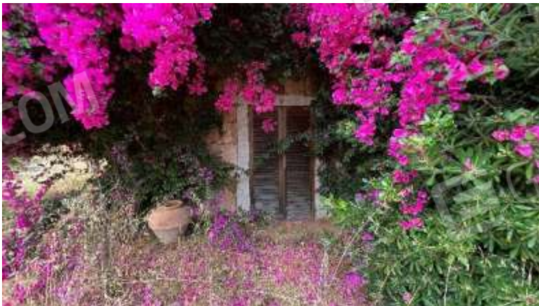
Figura 22 – Viste delle facciate del fronte Est del bene