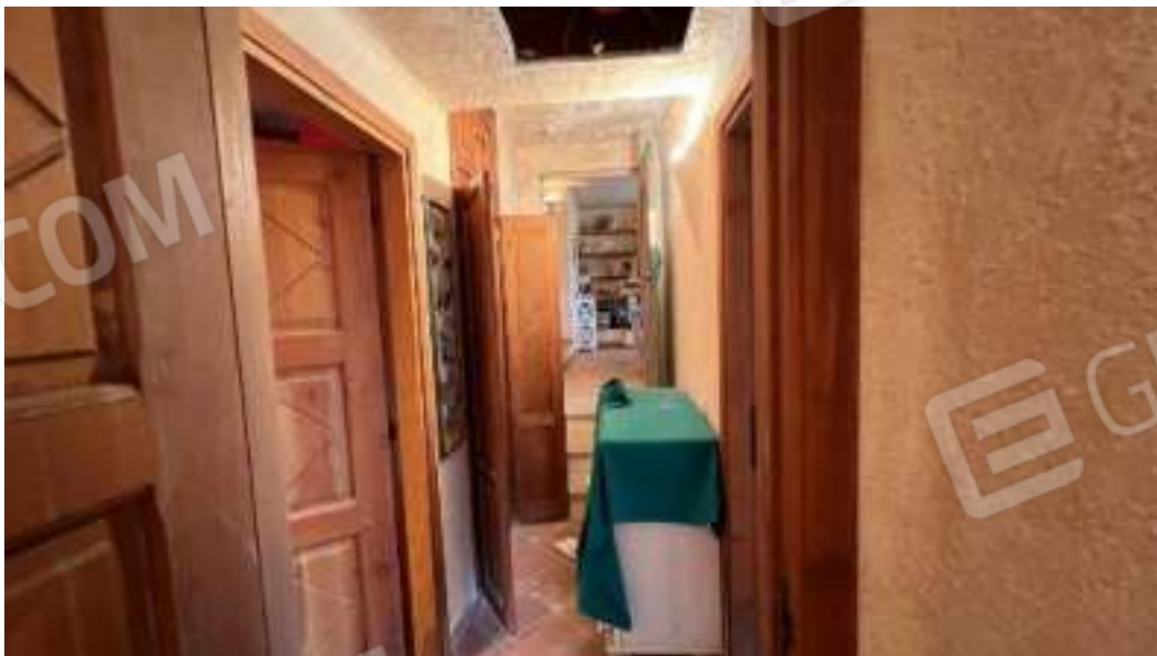
Figura 36 – Viste del piano terra, del disimpegno 2