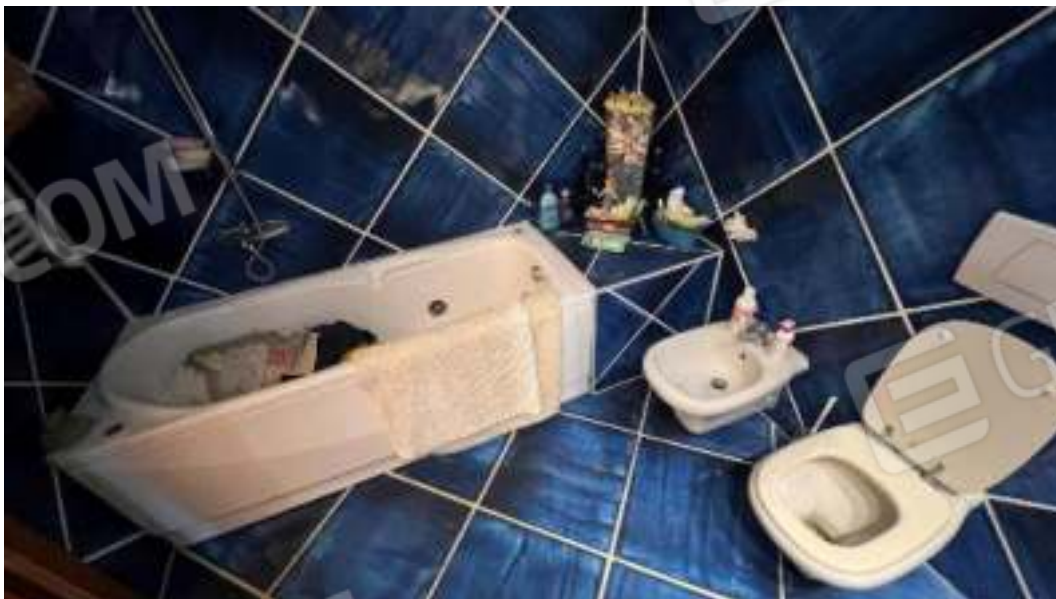
Figura 35 – Viste del piano terra, del bagno 2