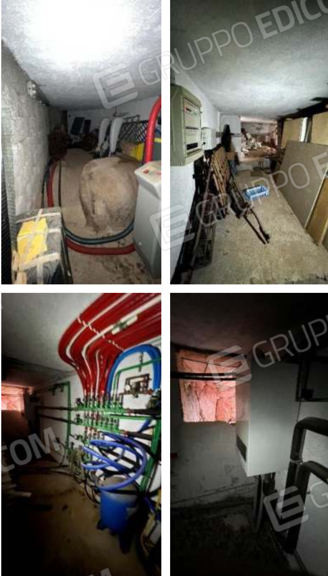
Figura 59 – Viste del piano seminterrato del locale tecnico