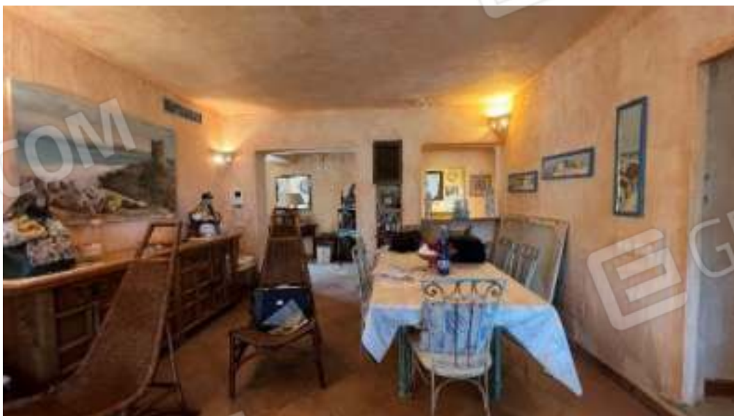
Figura 28 – Viste del piano terra, sulla sala da pranzo e sul soggiorno