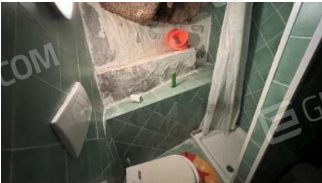
Figura 32 – Viste del piano terra, del bagno 1