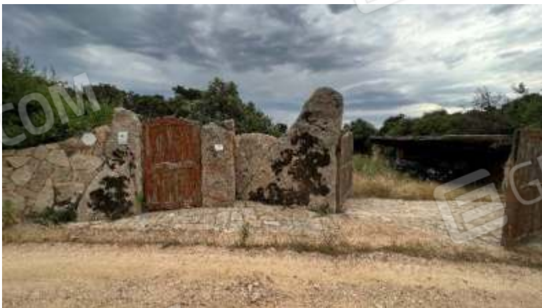
Figura 6 – Ulteriori viste della recinzione esterna degli ingressi sia pedonali sia carrabili del bene