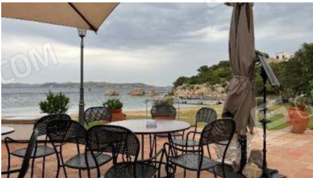
Figura 2 – Viste della piazzetta principale del comprensorio