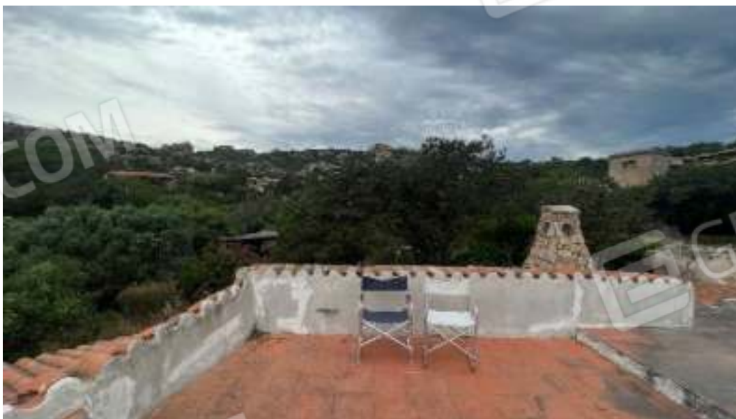
Figura 12 – Ulteriori viste dal piano di copertura