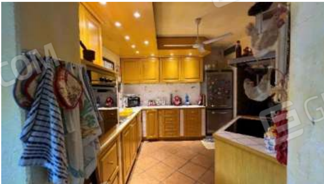
Figura 29 – Viste del piano terra, della cucina e tinello