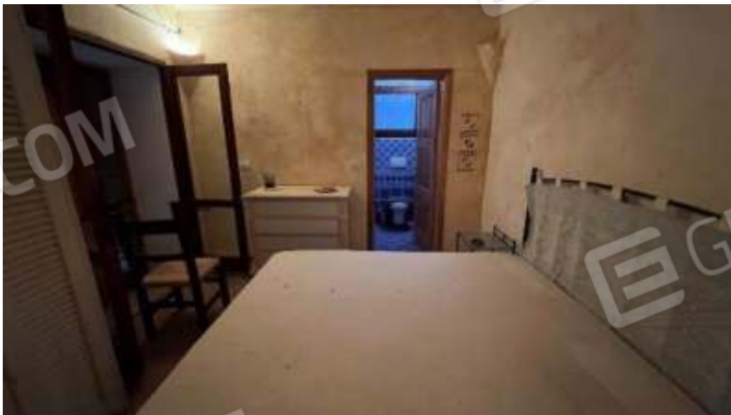
Figura 51 – Viste del piano seminterrato della camera 6