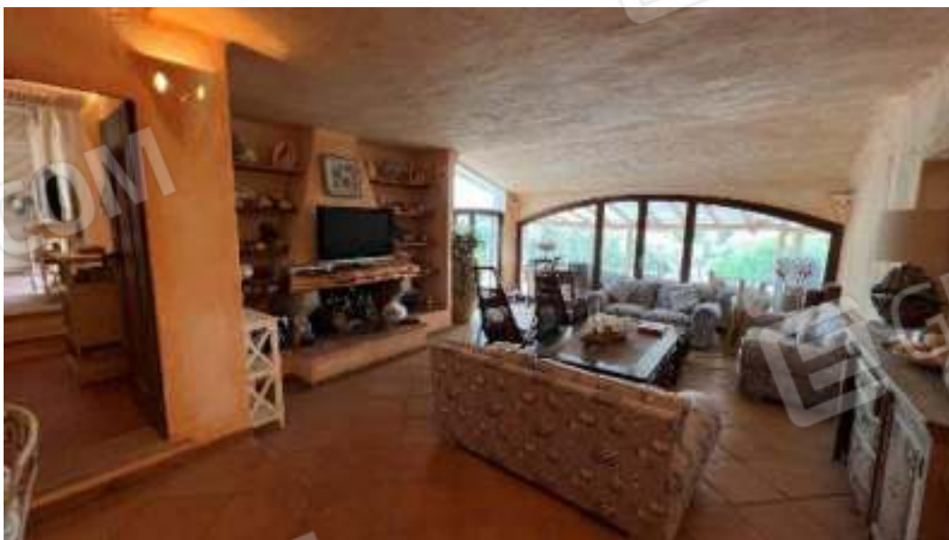
Figura 26 – Viste del piano terra sull'ingresso, sulla sala da pranzo e sul soggiorno