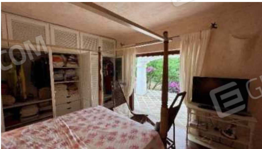
Figura 33 – Viste del piano terra, della camera 2