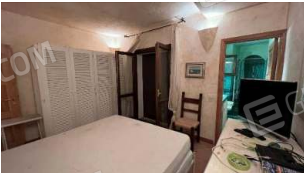
Figura 45 – Figura 46 – Viste del piano seminterrato della camera 5