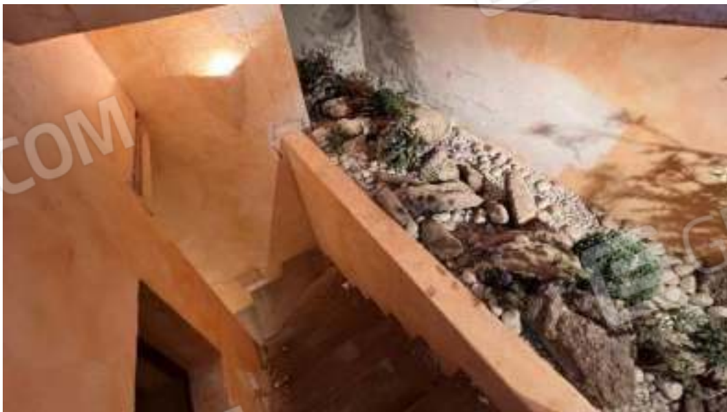
Figura 43 – Viste delle scale di collegamento tra piano terra e piano seminterrato