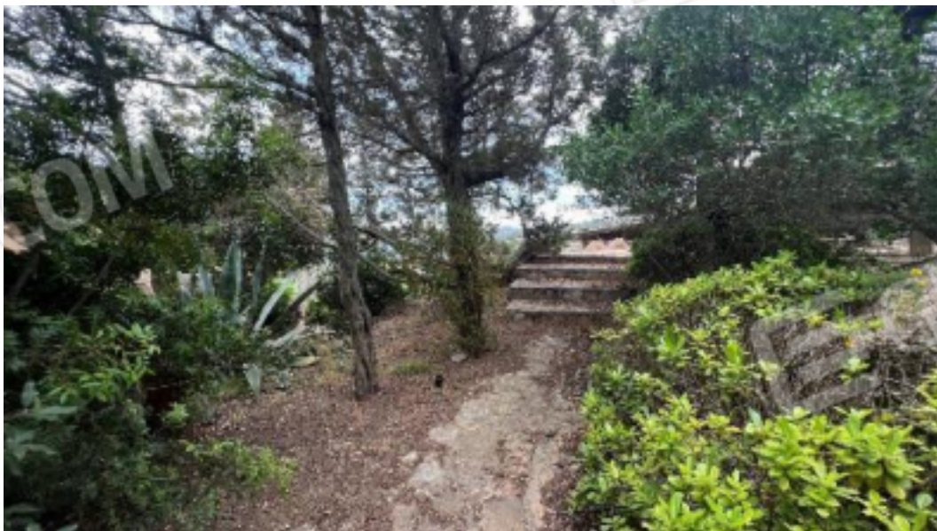
Figura 7 – Viste dall'interno del giardino di proprietà degli spazi esterni del bene