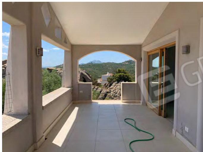
FOTO VERANDA PIANO PRIMO