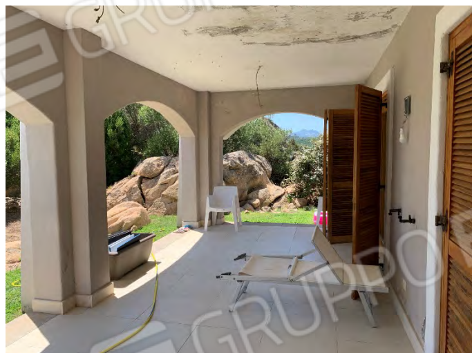
FOTO CORTE PERTINENZIALE