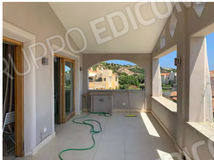
FOTO VERANDA PIANO TERRA