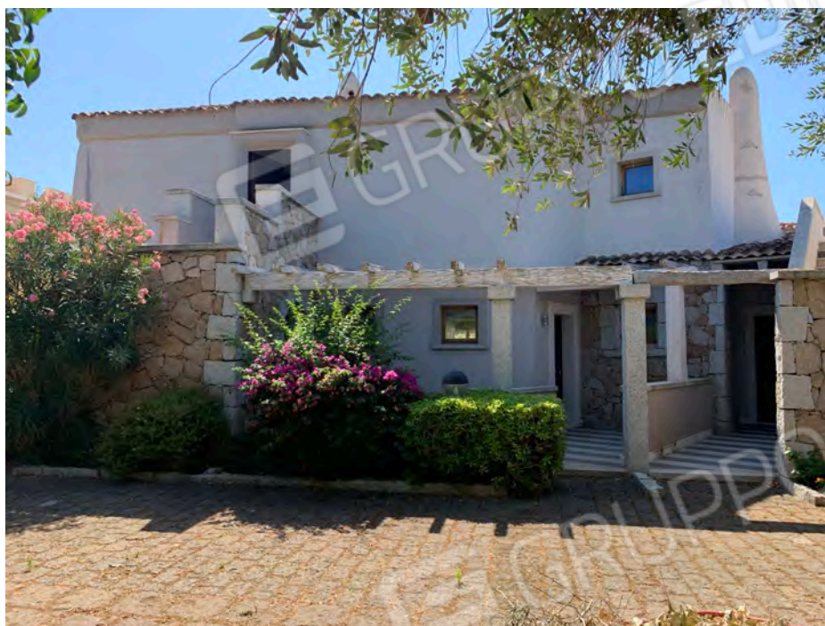
FOTO PROSPETTO FRONTALE