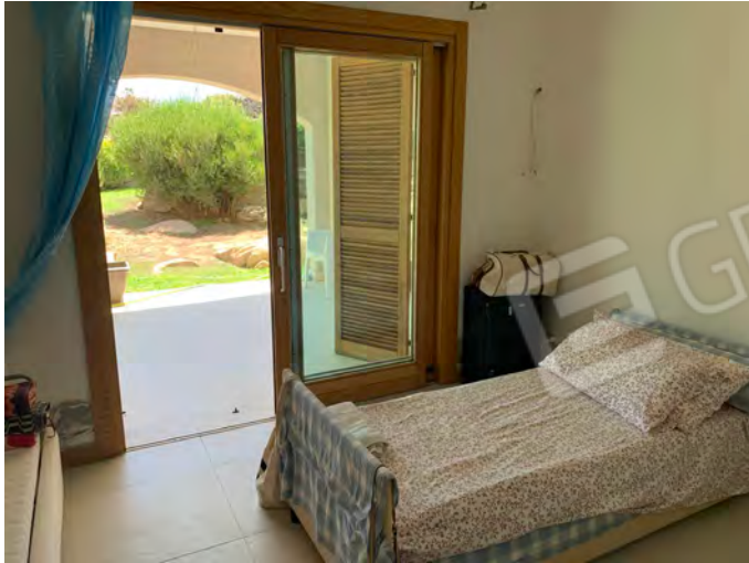
FOTO CAMERA 1