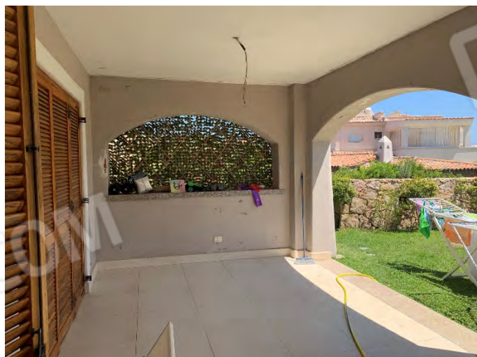
FOTO VERANDA PIANO TERRA