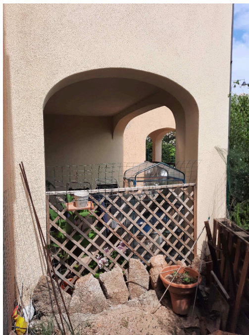
Particolare veranda lato Sud