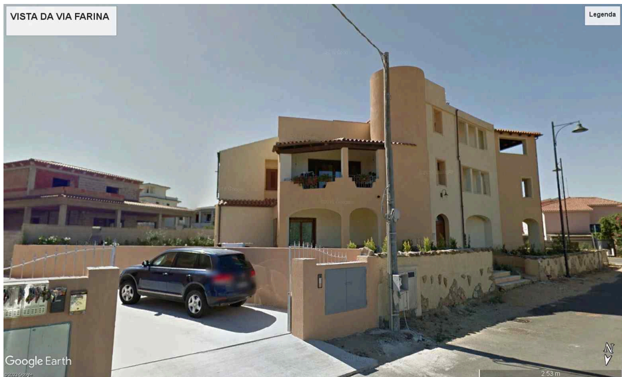
Vista da Via Farina con al centro ingresso scale comuni