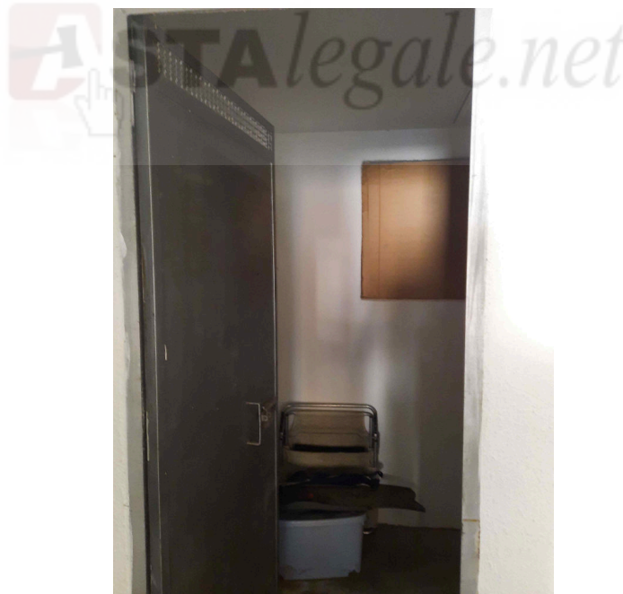
Locale di sgombero