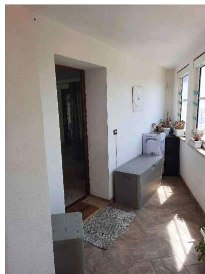
VERANDA INGRESSO NORD