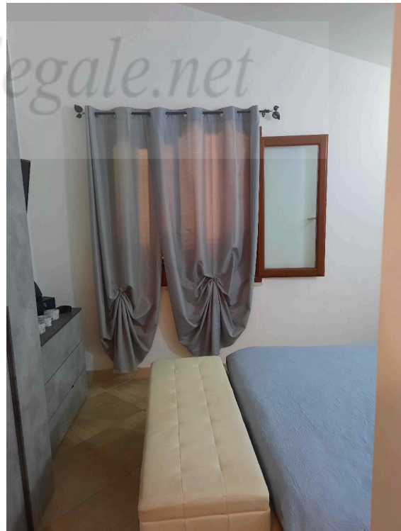
CAMERA DA LETTO 2

L'esperto incaricato Geom. Franco Garrucciu , via Germania 21 Olbia 3485169131