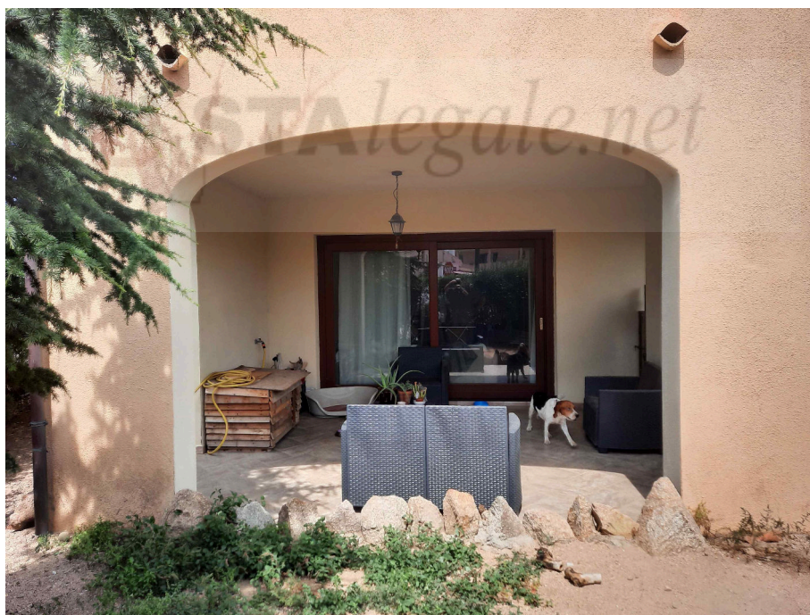
Particolare veranda lato ovest

L'esperto incaricato Geom. Franco Garrucciu , via Germania 21 Olbia 3485169131