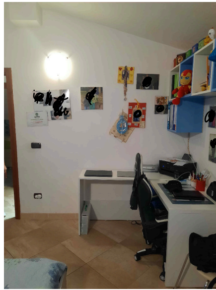
CAMERA DA LETTO 1