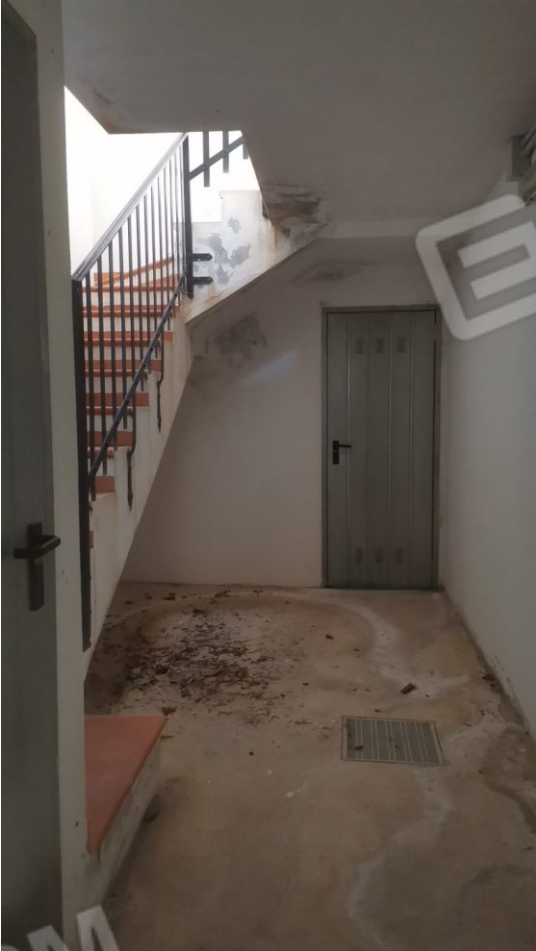
FIGURE 30: A) SCALA DI ACCESSO ALL'INTERRATO;