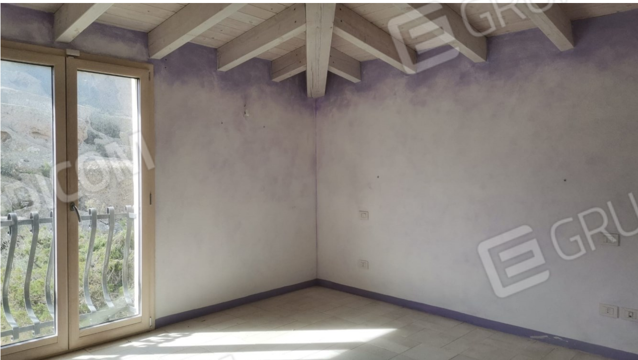
FIGURE 13: CAMERA DA LETTO