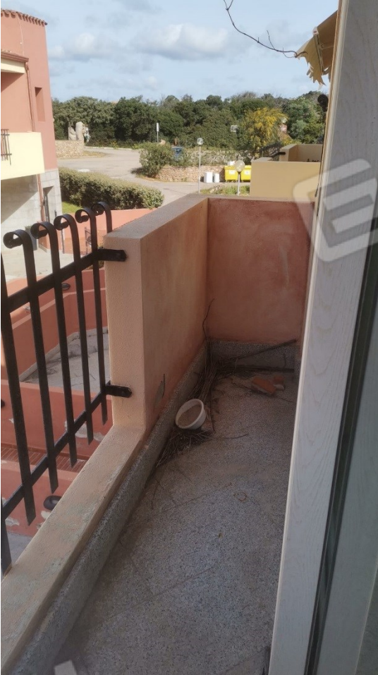
FIGURE 12: A) DETTAGLIO BALCONE RESIDUO DELLA ZONA GIORNO;