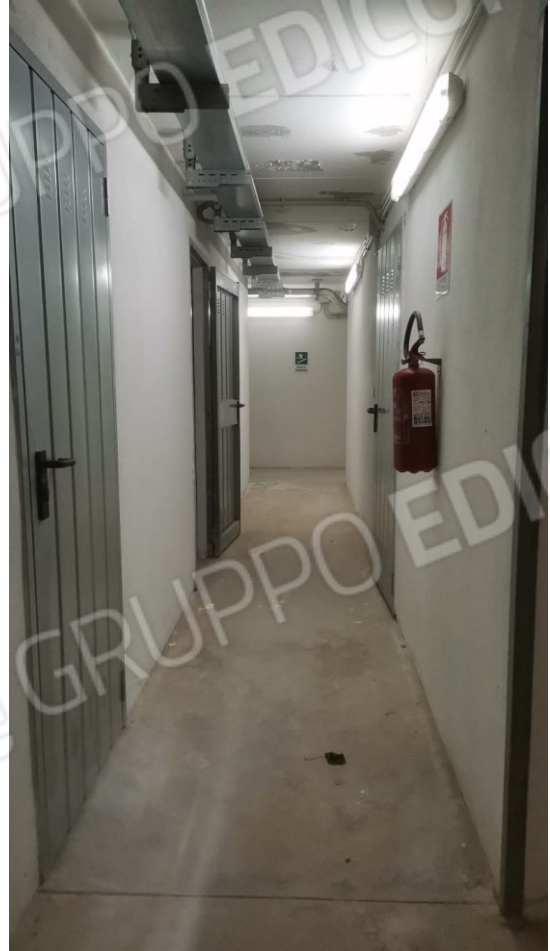
B) CORRIDOIO DI ACCESSO ALLE CANTINE