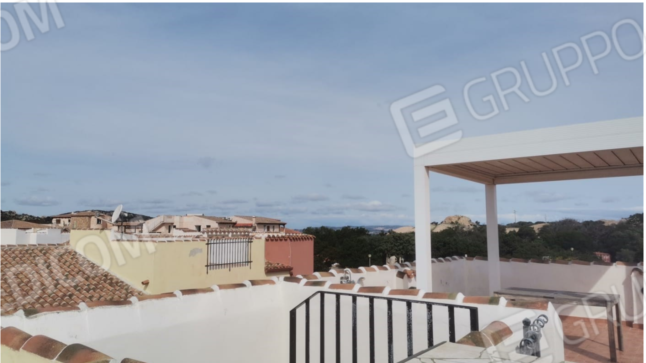
FIGURE 25: ACCESSO DALLE SCALE E VISTA SULLA PROPRIETÀ CONFINANTE