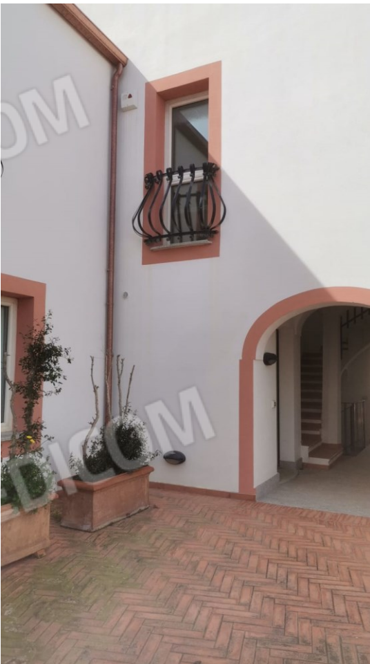
FIGURE 6: A) BALCONE IMMOBILE IN OGGETTO