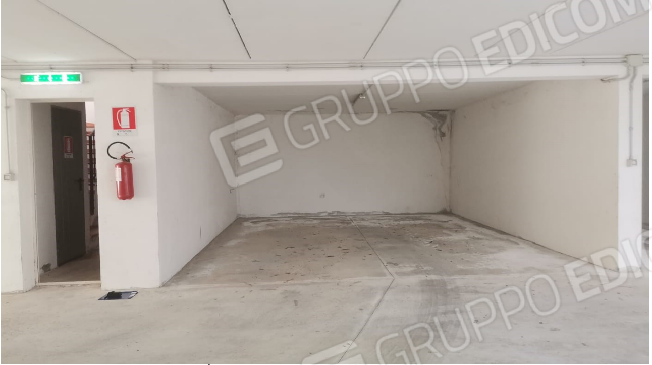
FIGURE 33: POSTO AUTO DI PROPRIETÀ