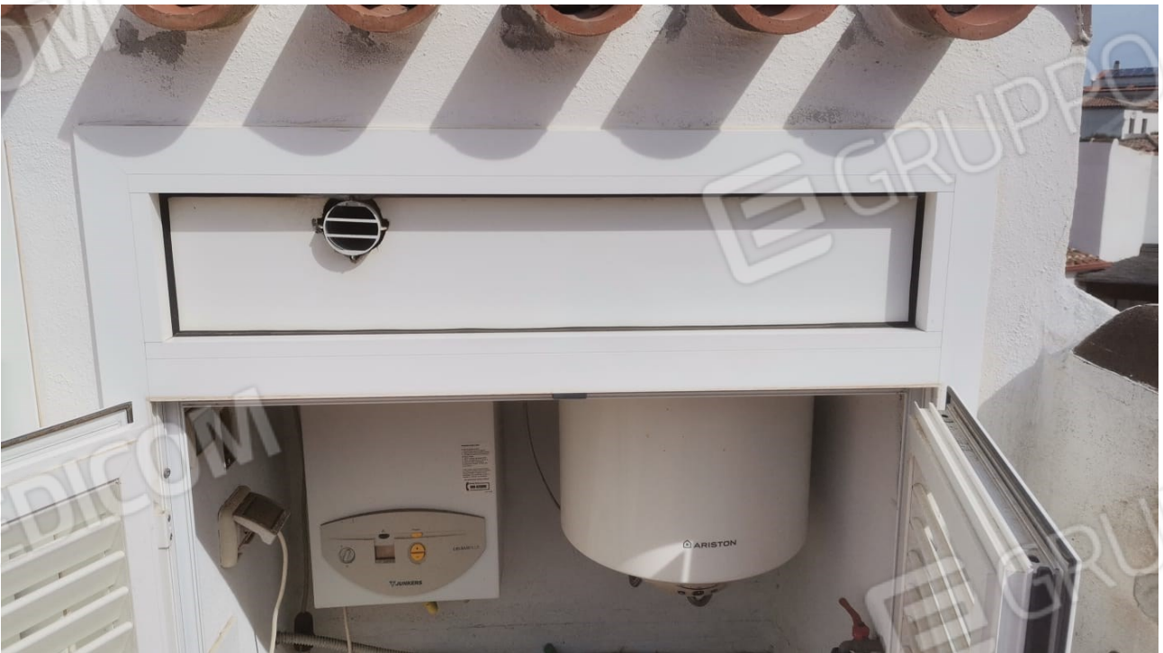
FIGURE 27: ARMADIO IMPIANTI