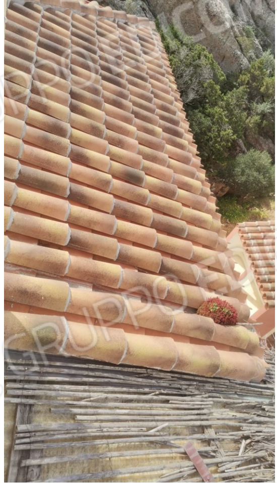
B) STATO ATTUALE DELLA COPERTURA