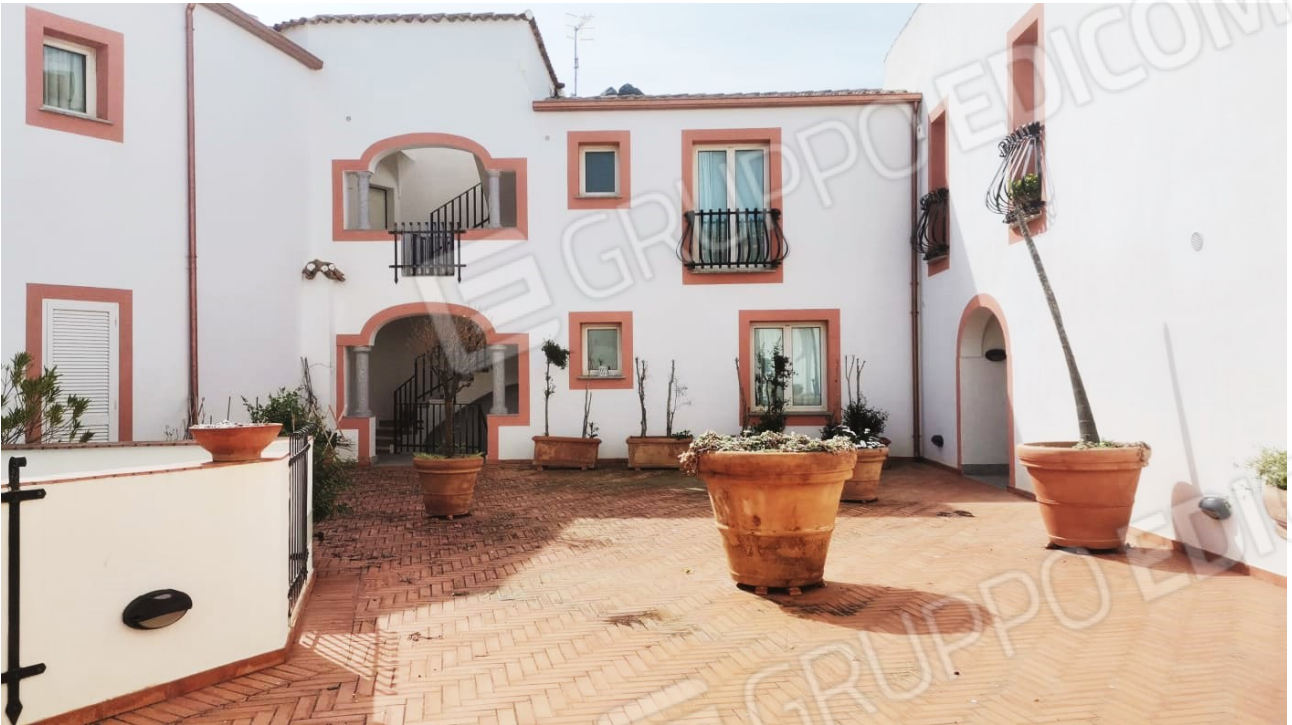
FIGURE 5: FACCIATE INTERNE ALLA CORTA DEL BLOCCO. IN ALTO A DESTRA L'AFFACCIO DALLA ZONA GIORNO (ANGOLO COTTURA) DELL'IMMOBILE OGGETTO DI CAUSA