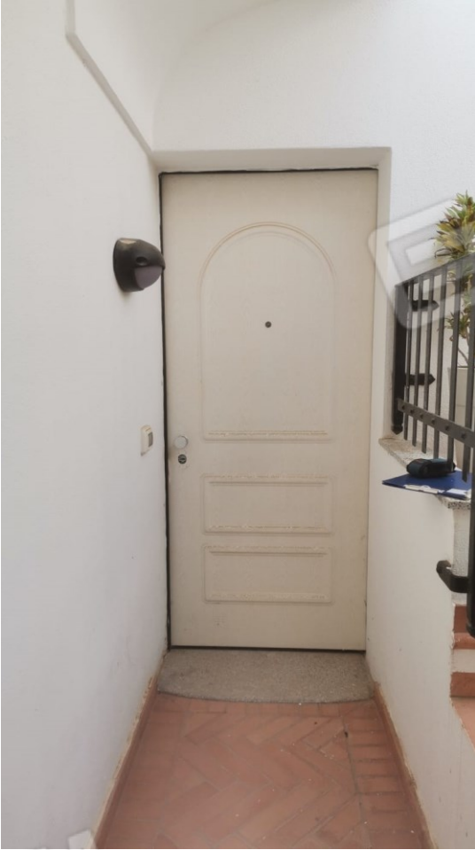
FIGURE 7: ACCESSO AL SUB. 33 (APPARTAMENTO)