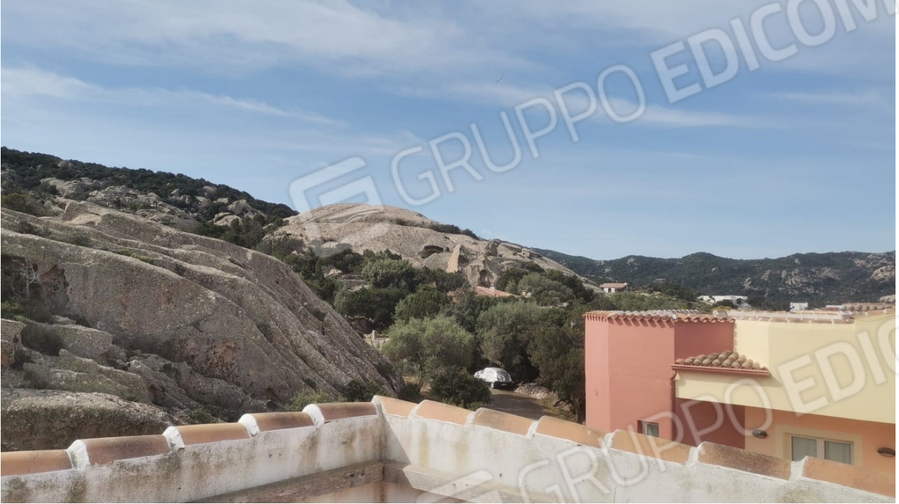
FIGURE 24: VISTA SUL PAESAGGIO