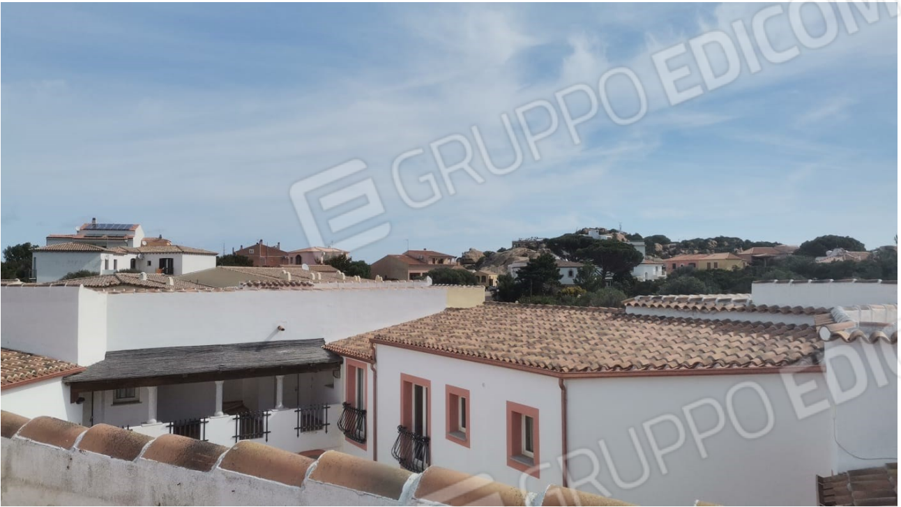
FIGURE 26: VISTA SULLA CORTE INTERNA E SUL BORGO