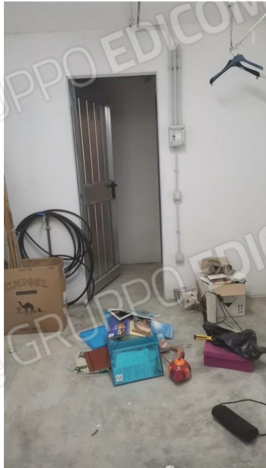
FIGURE 31: A) E B) SPAZI INTERNI ALLA CANTINA DI PROPRIETÀ