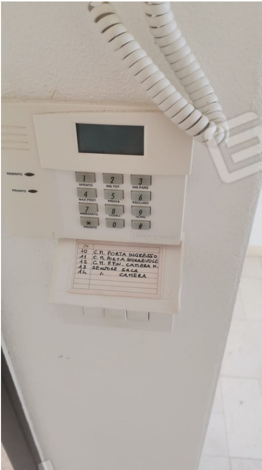
FIGURE 18: A) IMPIANTO CITOFONICO;