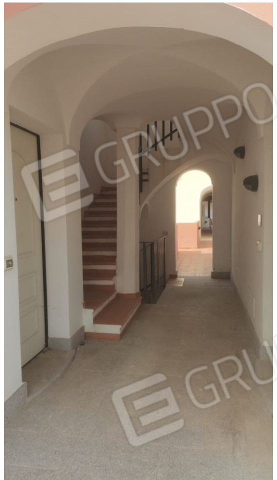
B) PASSAGGIO AL VANO SCALA