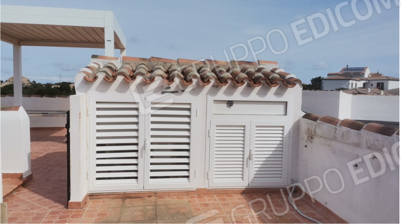
FIGURE 22: ARMADIO IMPIANTI