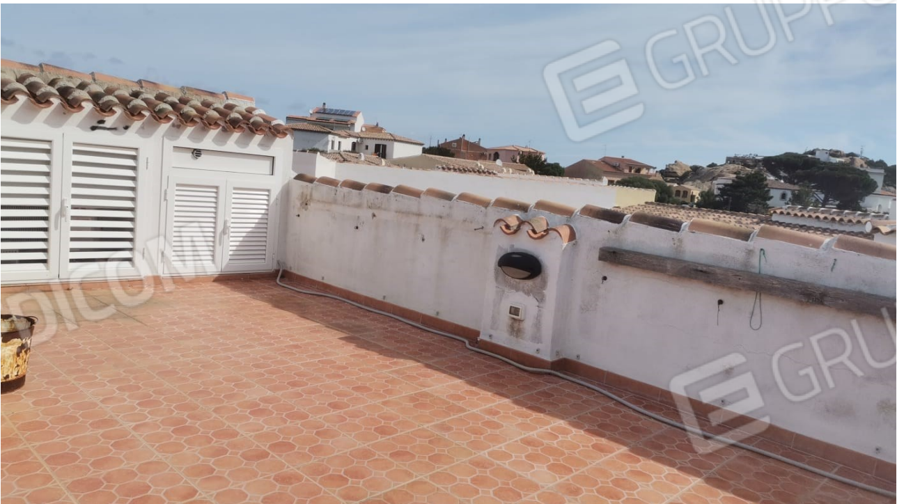
FIGURE 21: LASTRICO DI PROPRIETA' ESCLUSIVA