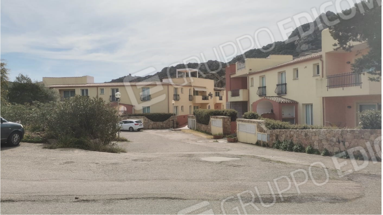
FIGURE 1: CONDOMINIO LE CASE DI PIETRA, SLARGO DI ACCESSO