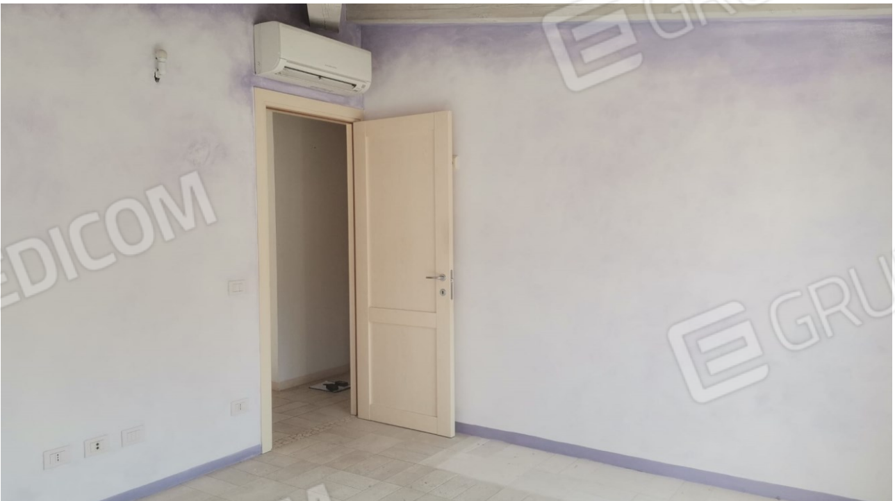
FIGURE 15: CAMERA DA LETTO