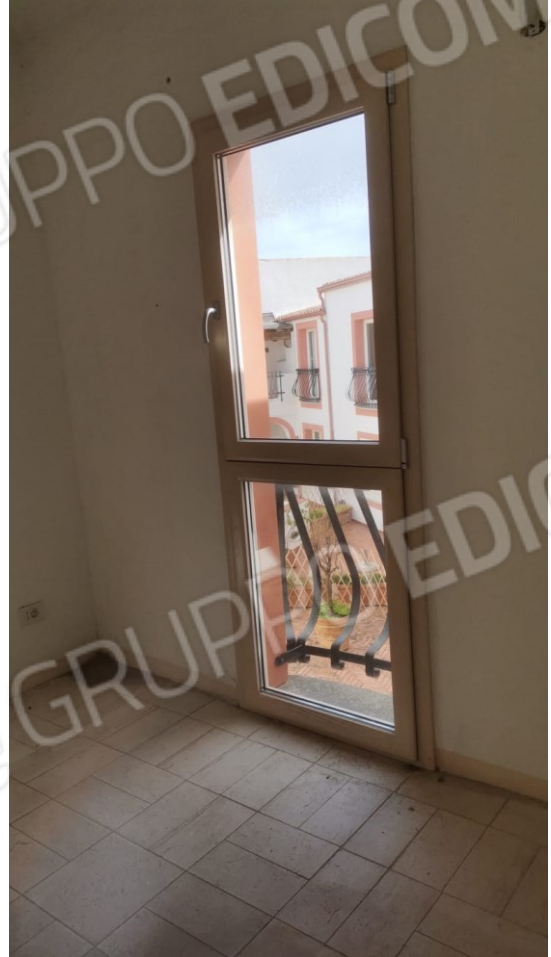
B) AFFACCIO DELL'ANGOLO COTTURA ALLA CORTE INTERNA