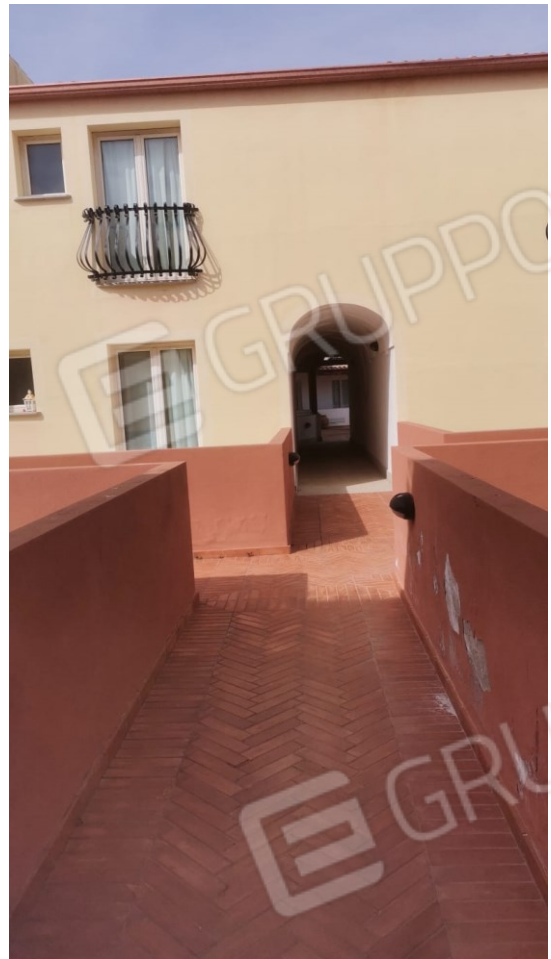
FIGURE 4: A) ACCESSO PRINCIPALE ALLA CORTE INTERNA; B) PERCORREZZE INTERNE ALLO SPAZIO COMUNE