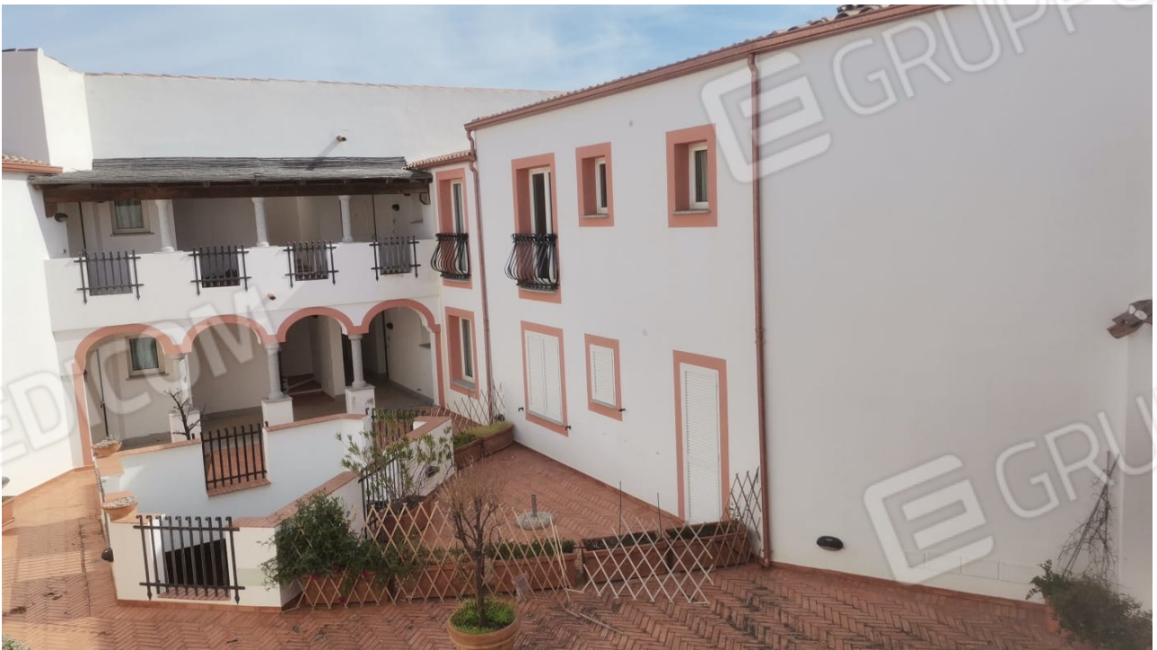
FIGURE 19: VISTA DALLA FINESTRA DELL'ANGOLO COTTURA