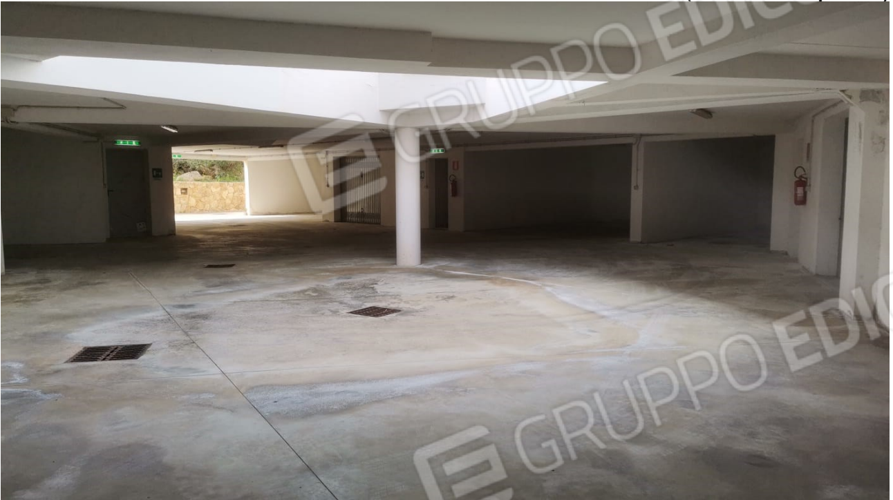
FIGURE 32: SPAZIO MANOVRA E ACCESSO AI GARAGE INTERRATI