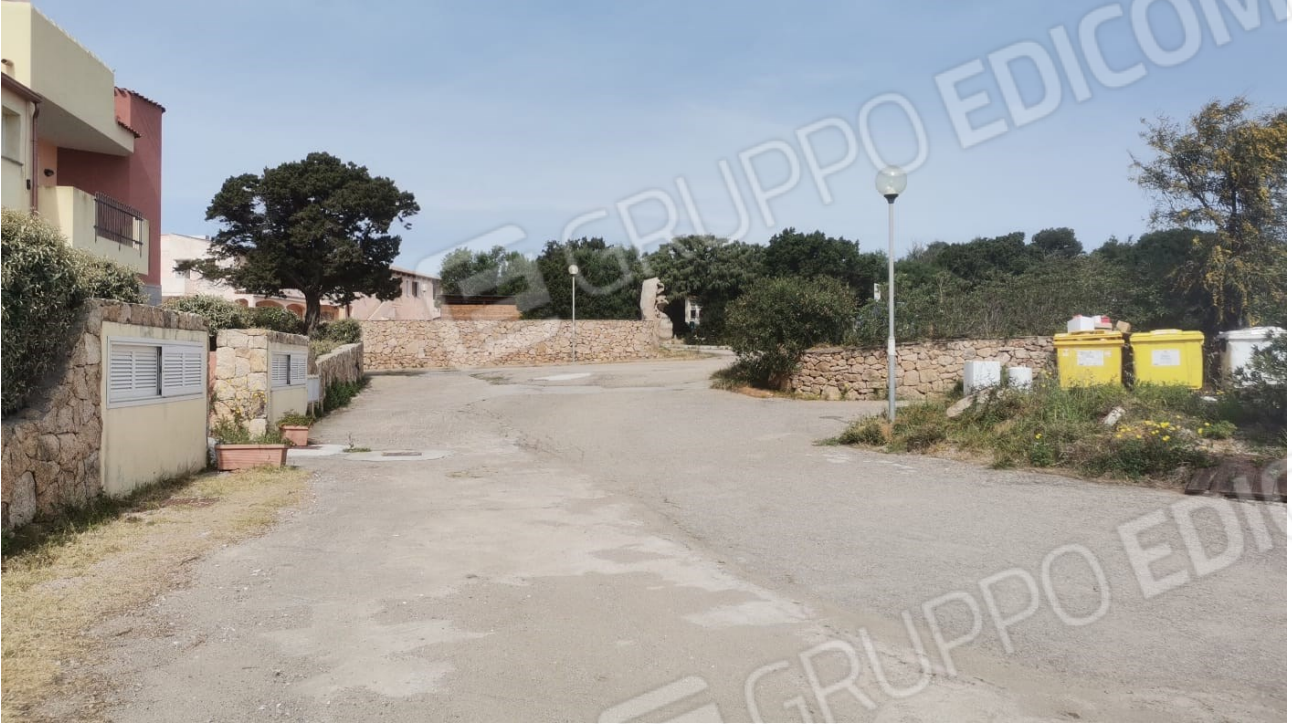
FIGURE 3: ACCESSO SU VIA L'ALDIOLA