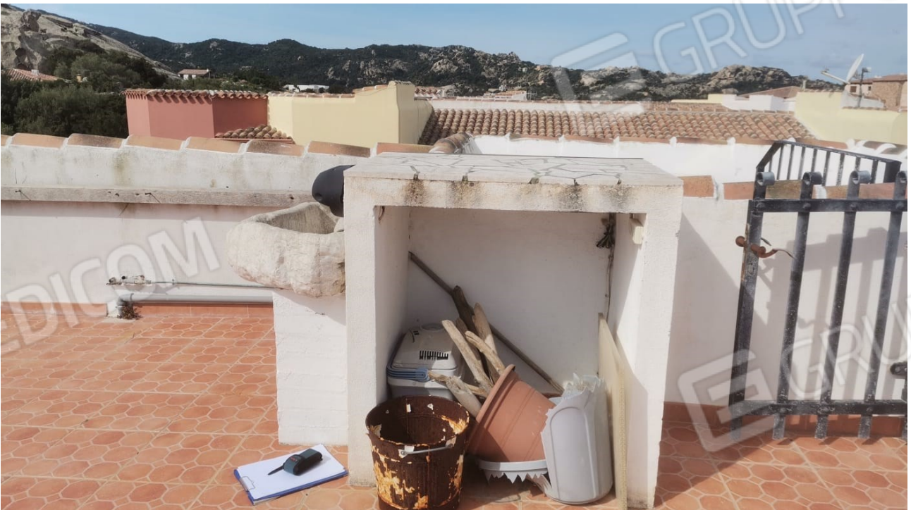
FIGURE 23: SPAZIO PER BARBECUE