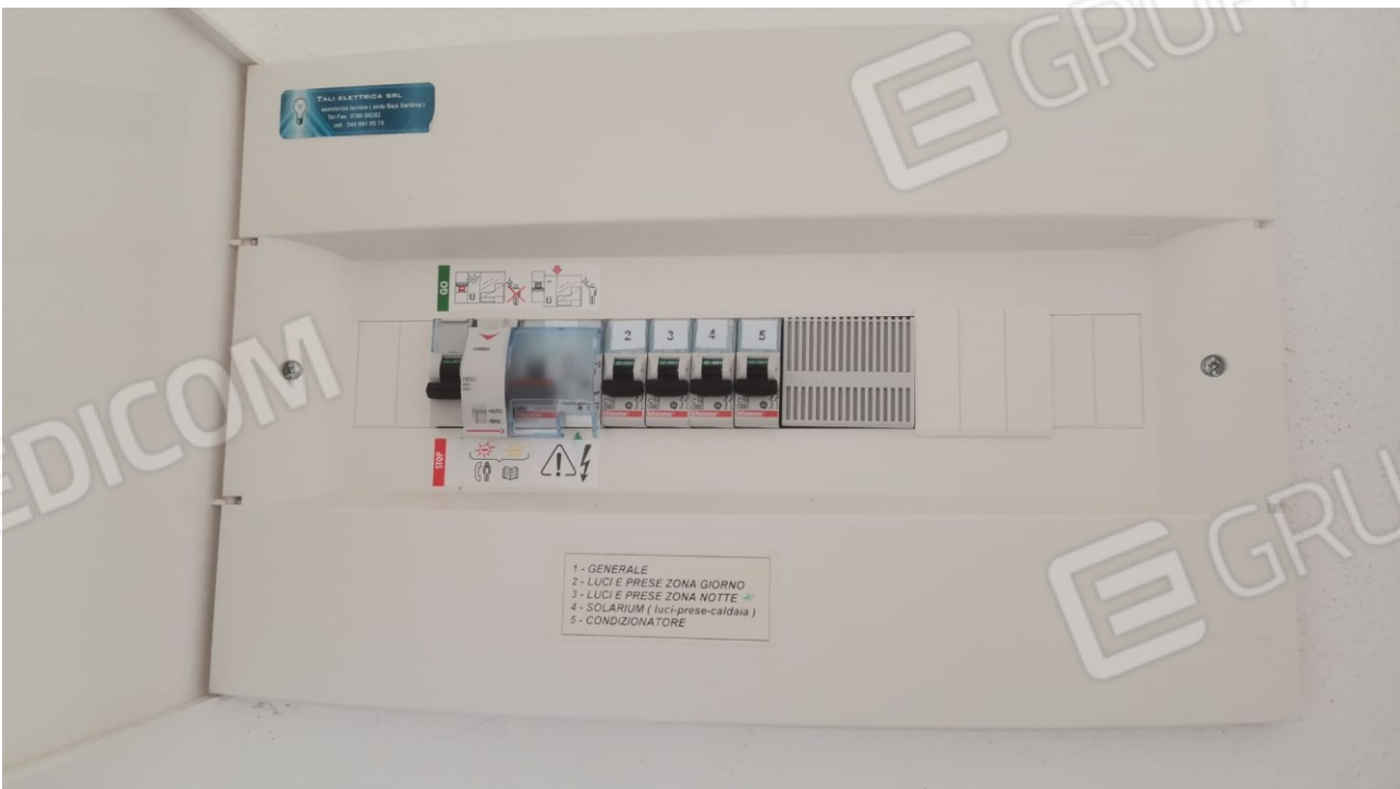
FIGURE 17: CONTATORE