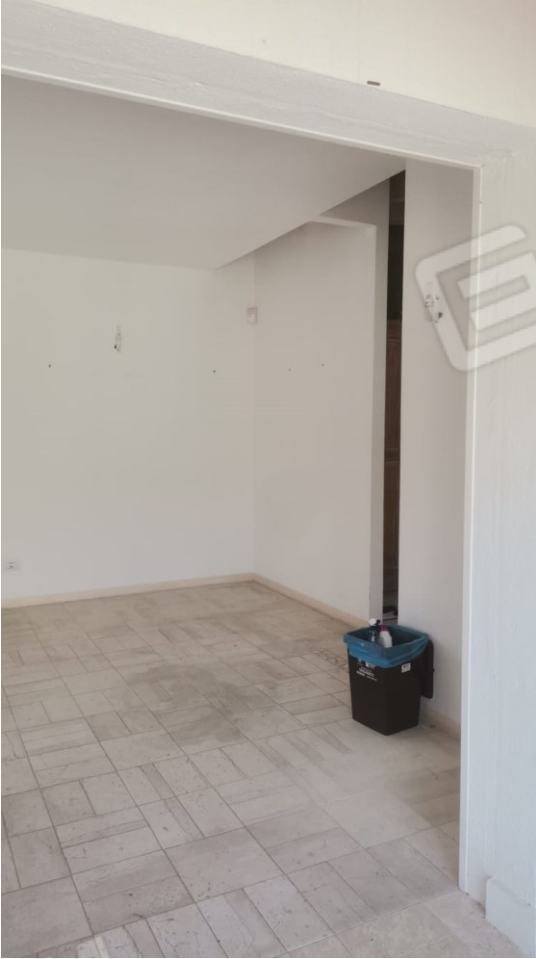
FIGURE 9: A) ZONA GIORNO;