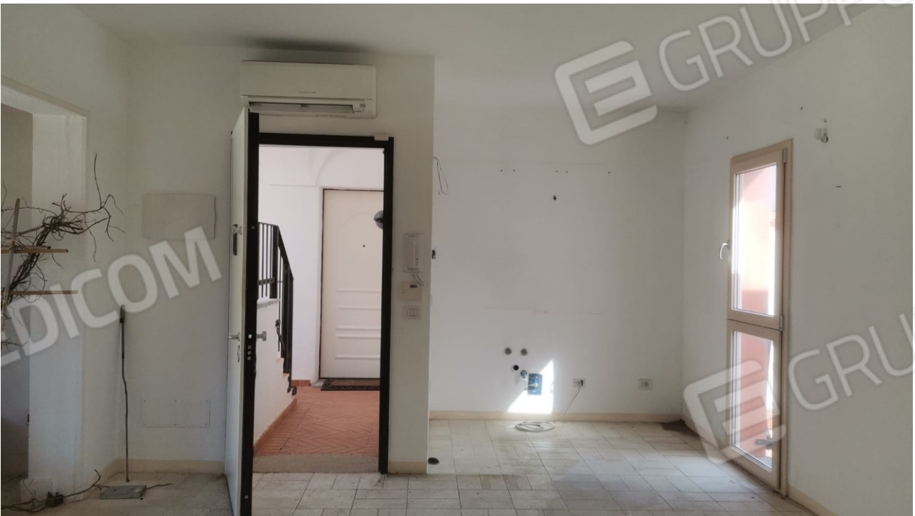
FIGURE 8: ZONA GIORNO E SULLA DESTRA ANGOLO COTTURA