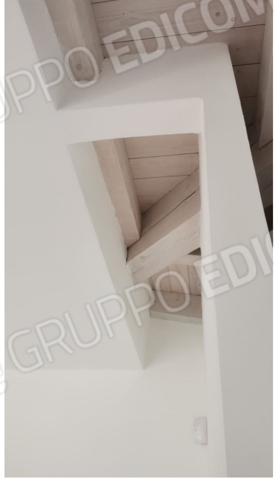
B) DETTAGLIO ATTACCO SOLAIO