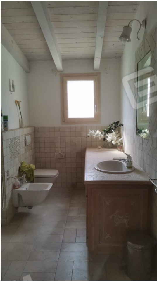
FIGURE 16: A) BAGNO;