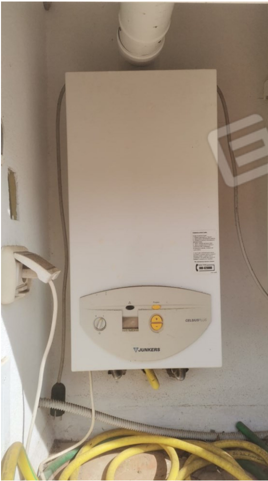
FIGURE 28: A9 CALDAIA GAS;