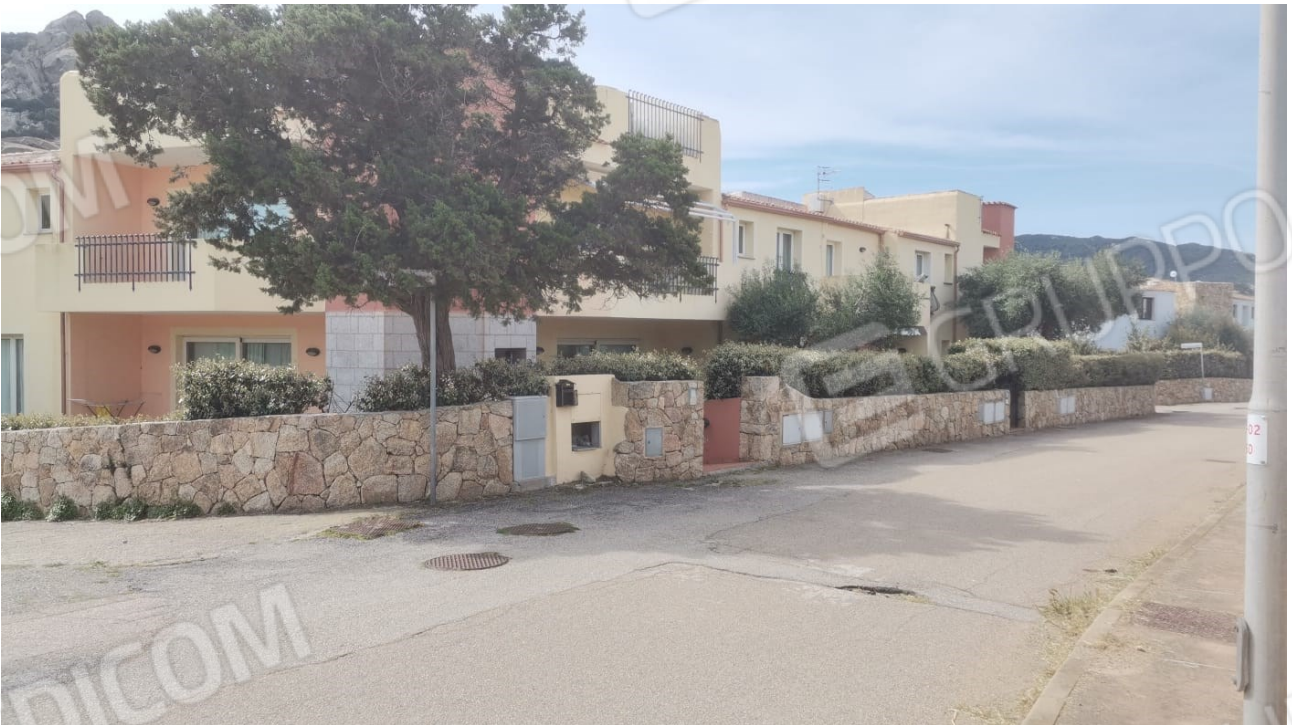
FIGURE 2: DETTAGLIO RECINZIONE ALLE UNITA' DEL PIANO TERRA