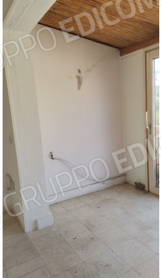
FIGURE 10: VERANDA DA RIPRISTINARE ATTUALMENTE PARTE DELLA ZONA GIORNO