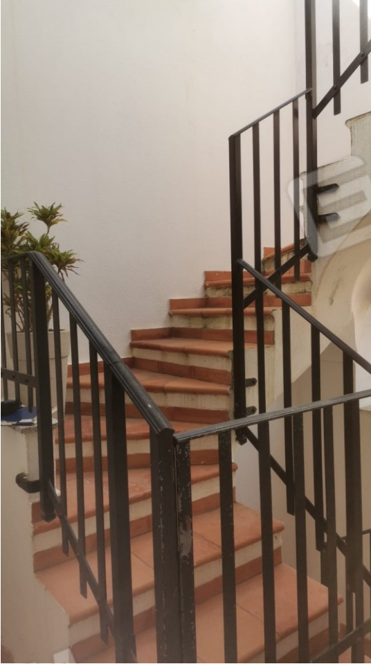
FIGURE 20: A) SCALE DI ACCESSO ALLA COPERTURA;