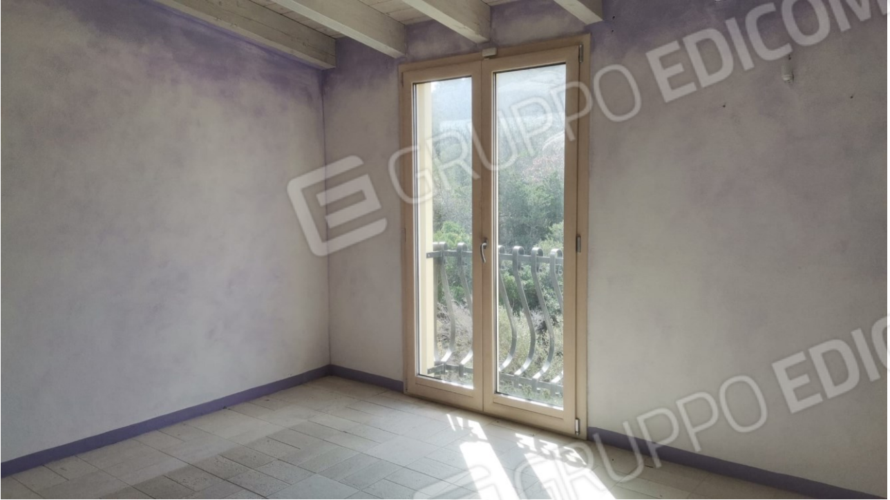
FIGURE 14: CAMERA DA LETTO