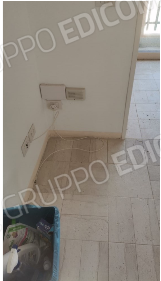
B) IMPIANTO TELEFONICO