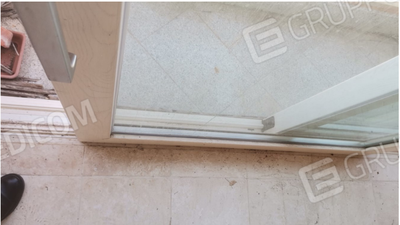
FIGURE 11: PARTICOLARE INFISSO VERANDA ZONA GIORNO DA RICOLLOCARE