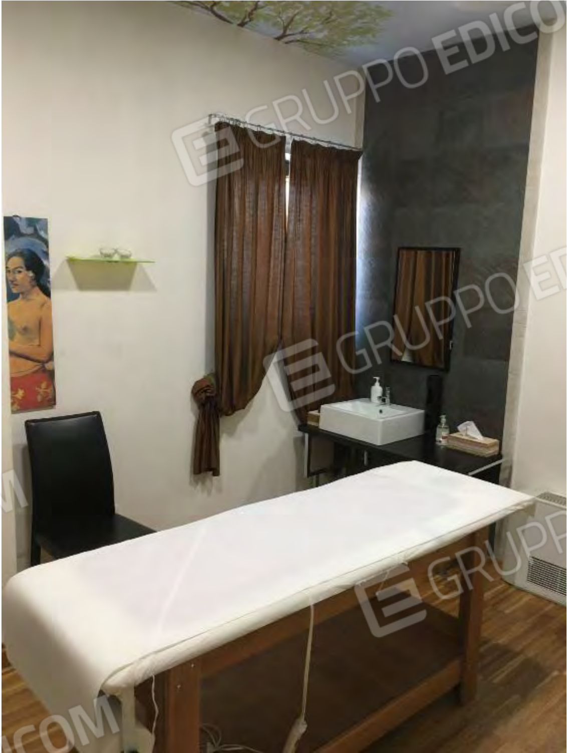
LABORATORIO ESTETICO CENTRO BENESSERE