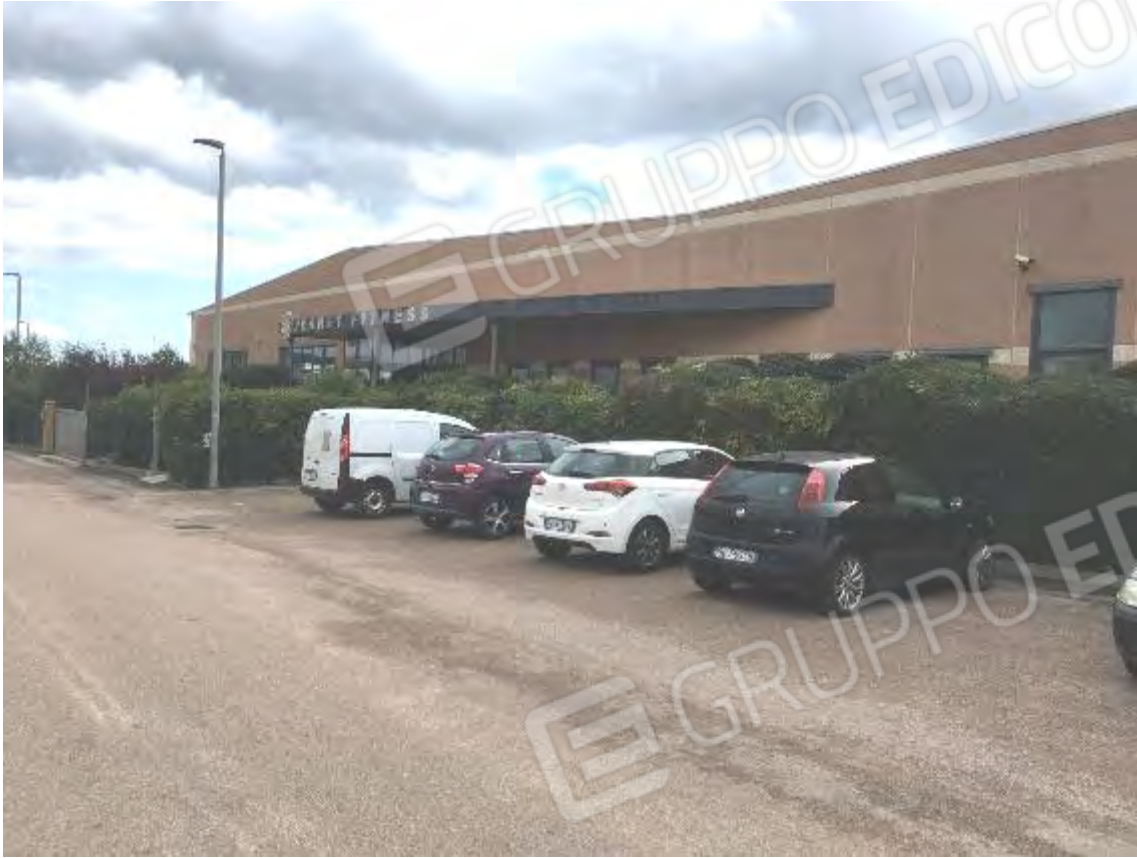
INGRESSO PRINCIPALE PROSPETTO NORD SU VIA QATAR