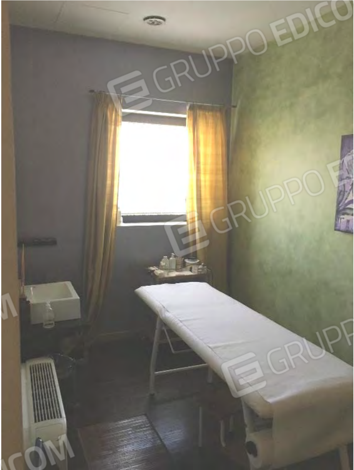
LABORATORIO ESTETICO CENTRO BENESSERE