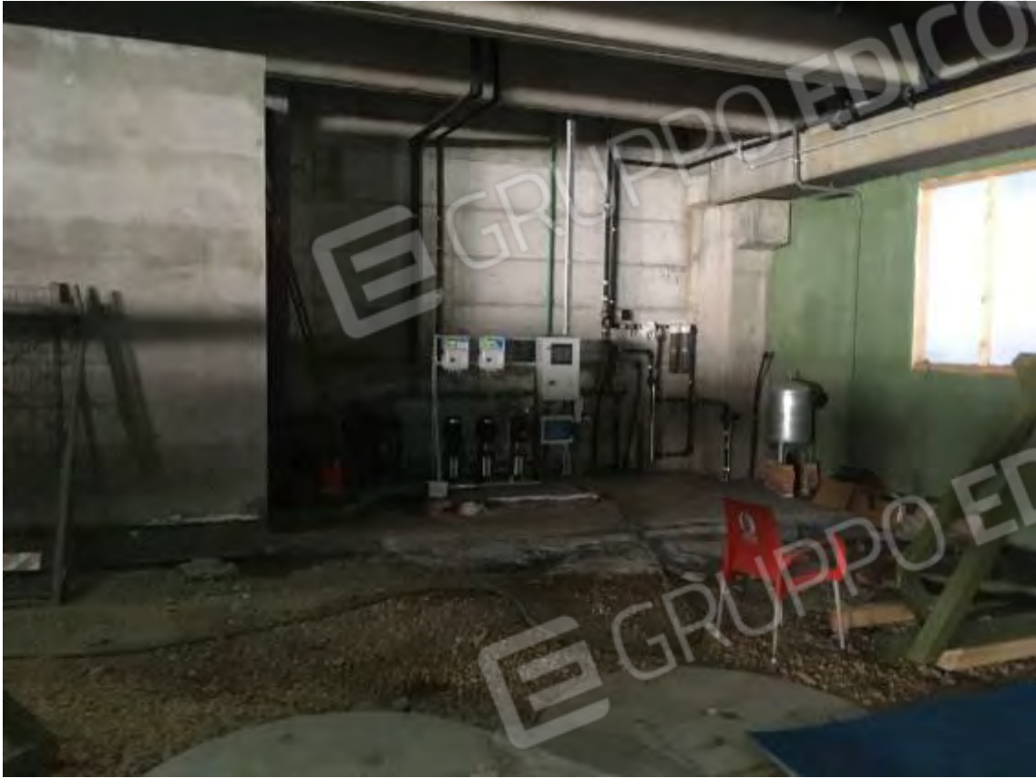
LOCALE TECNICO SEMINTERRATO