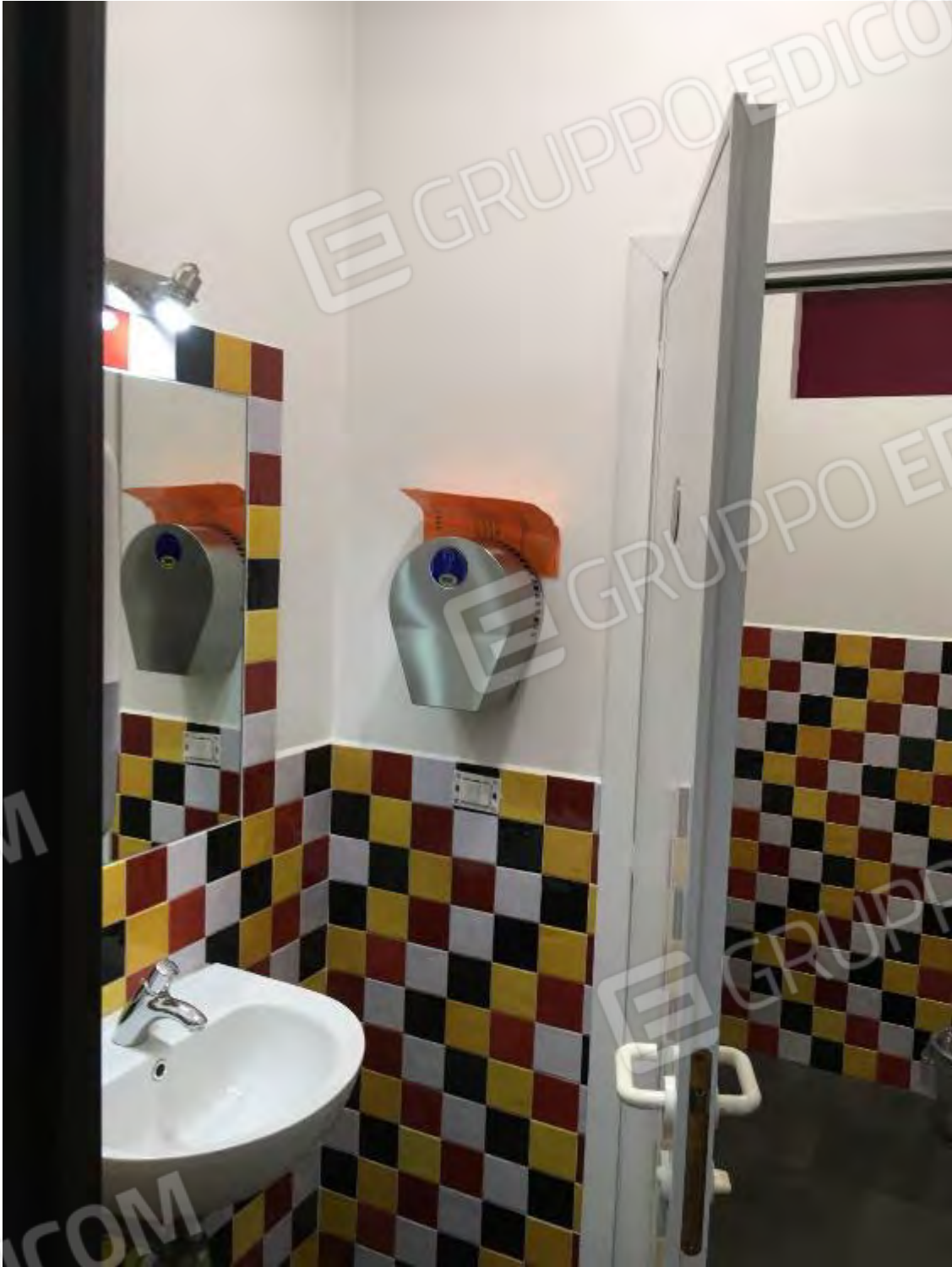
SERVIZIO IGIENICO SALONE