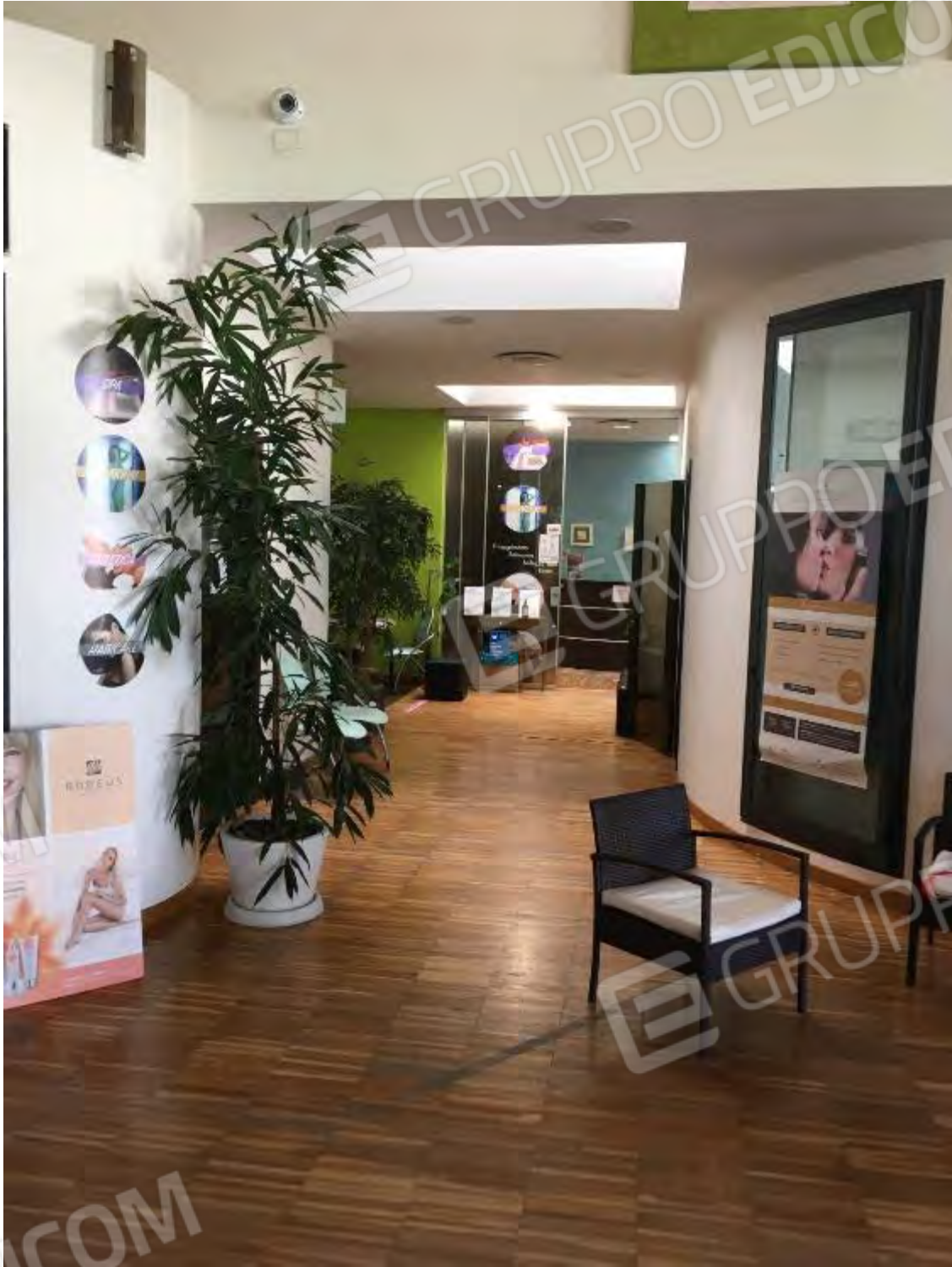
INGRESSO CENTRO BENESSERE