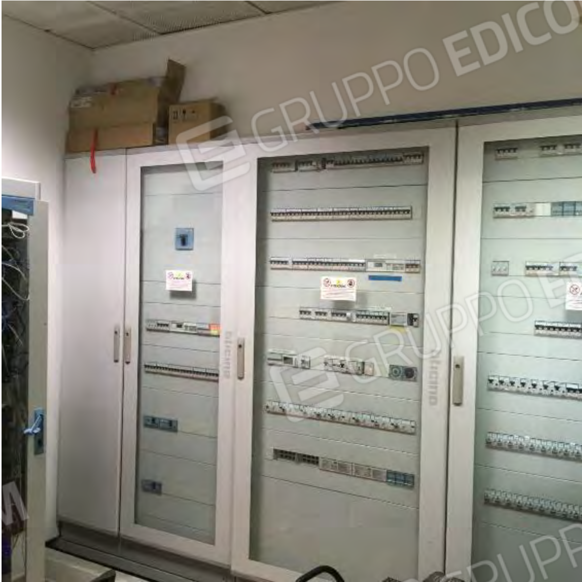
LOCALE QUADRI ELETTRICI