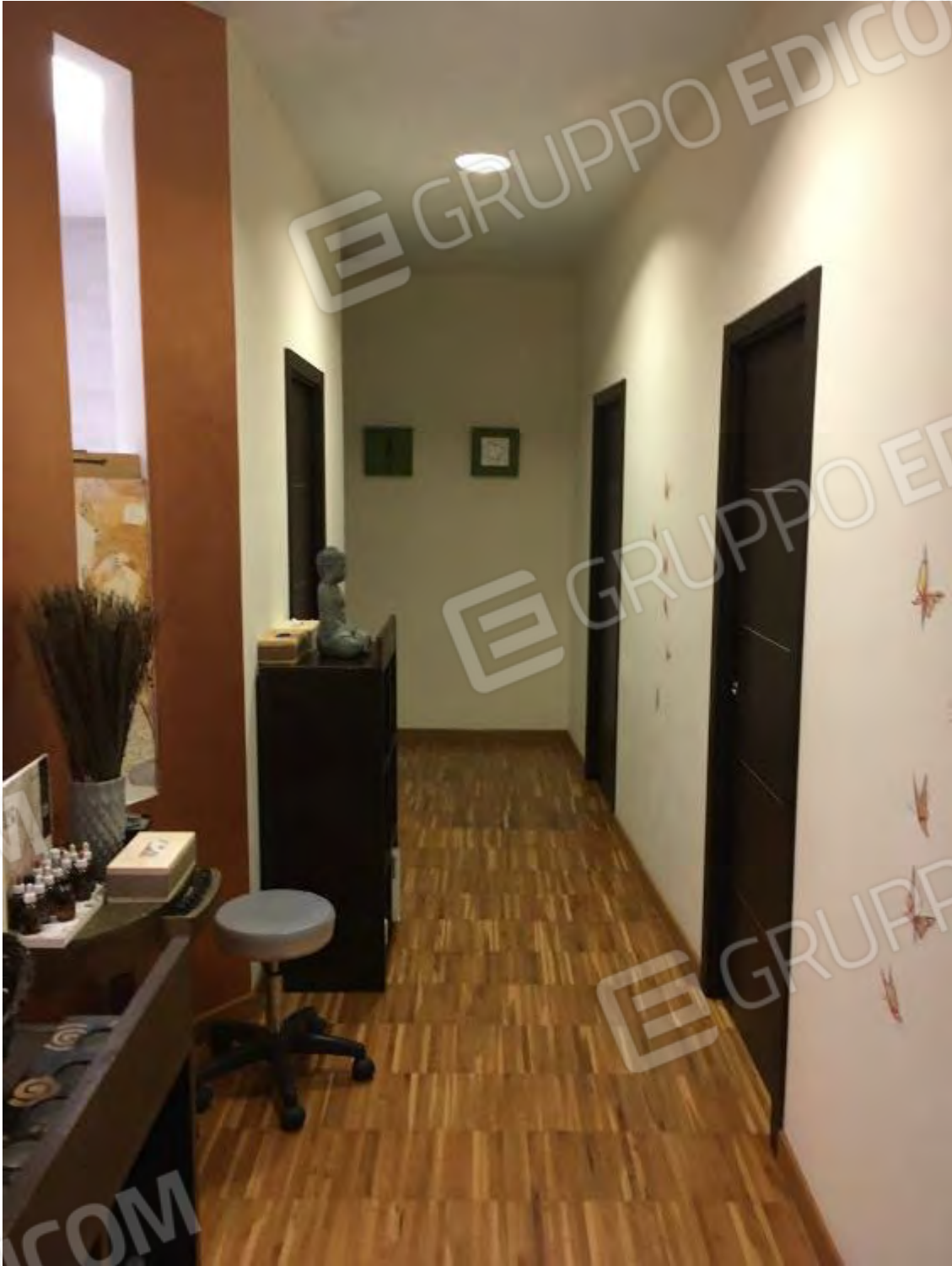
SPAZI DISTRIBUTIVI CENTRO BENESSERE