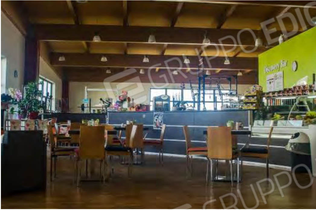
HALL / BAR