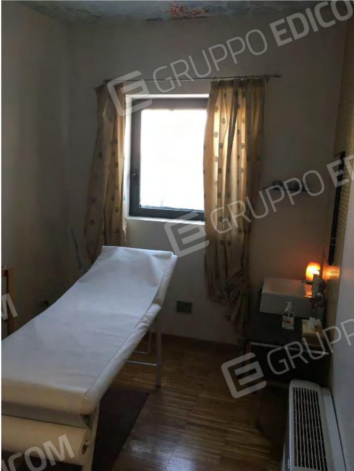
LABORATORIO ESTETICO CENTRO BENESSERE