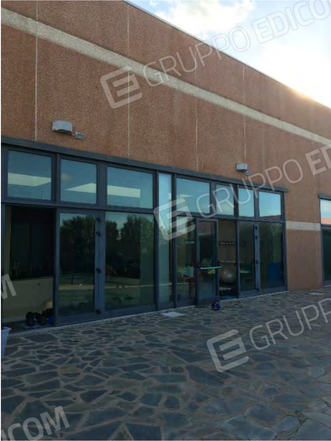
AREA ESTERNA PISCINA