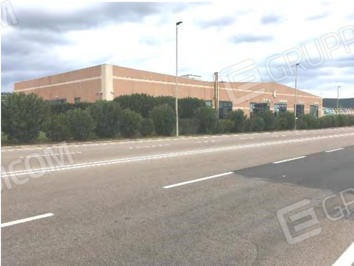
PROSPETTO SUD E OVEST SU S.P. 82