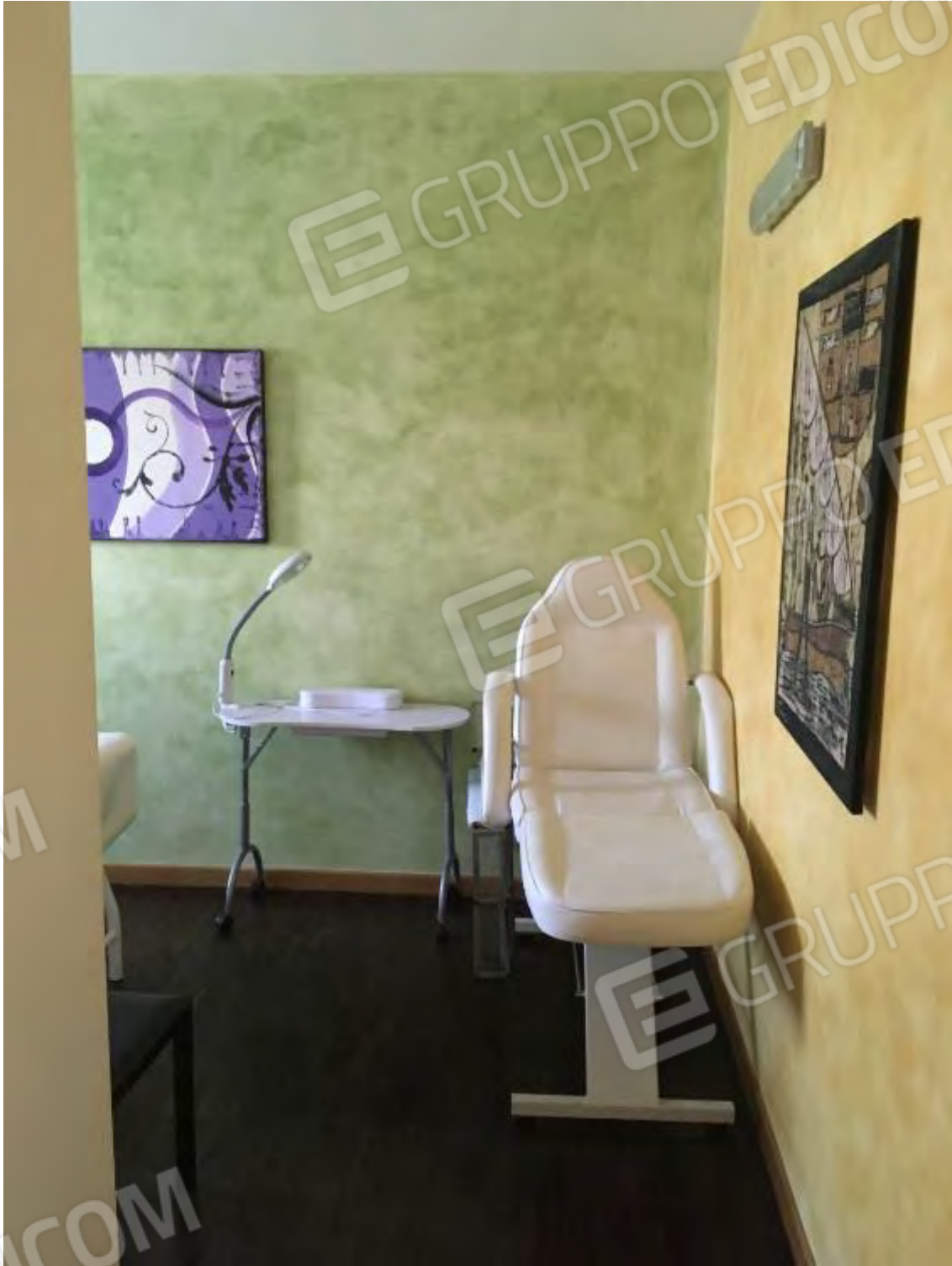
LABORATORIO ESTETICO CENTRO BENESSERE