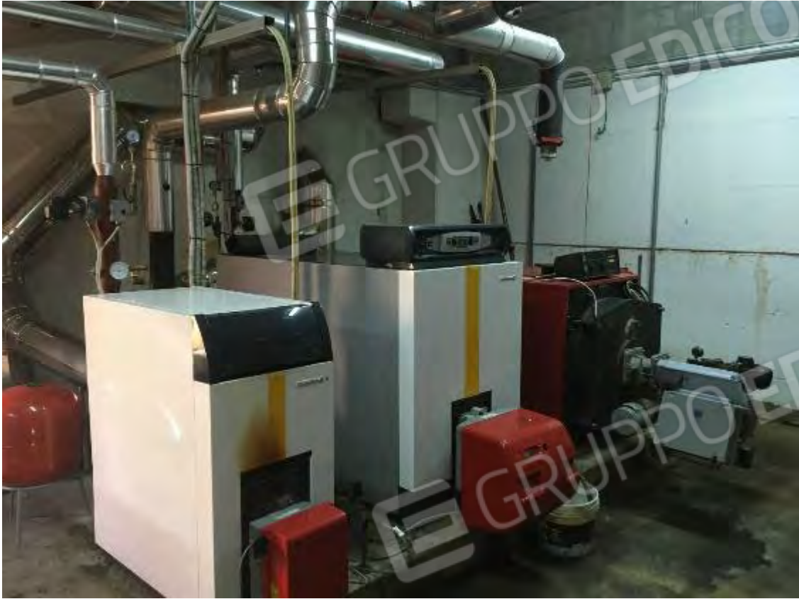
LOCALE TECNICO SEMINTERRATO