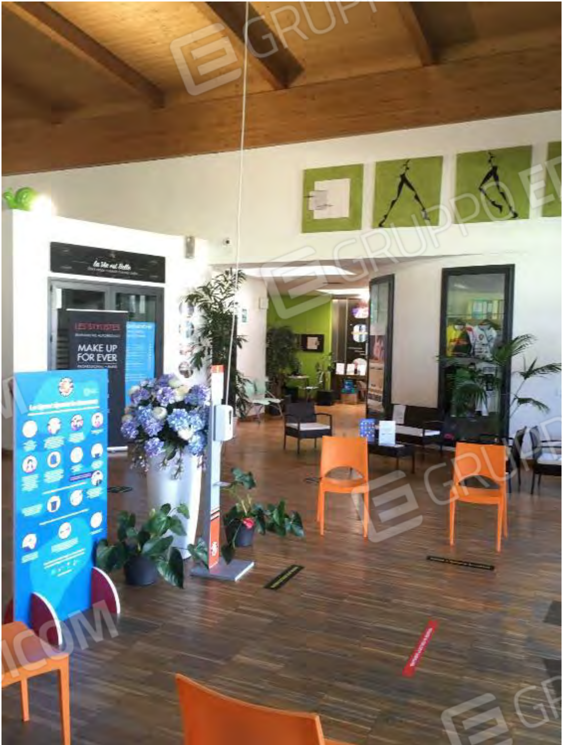
HALL / ACCOGLIENZA