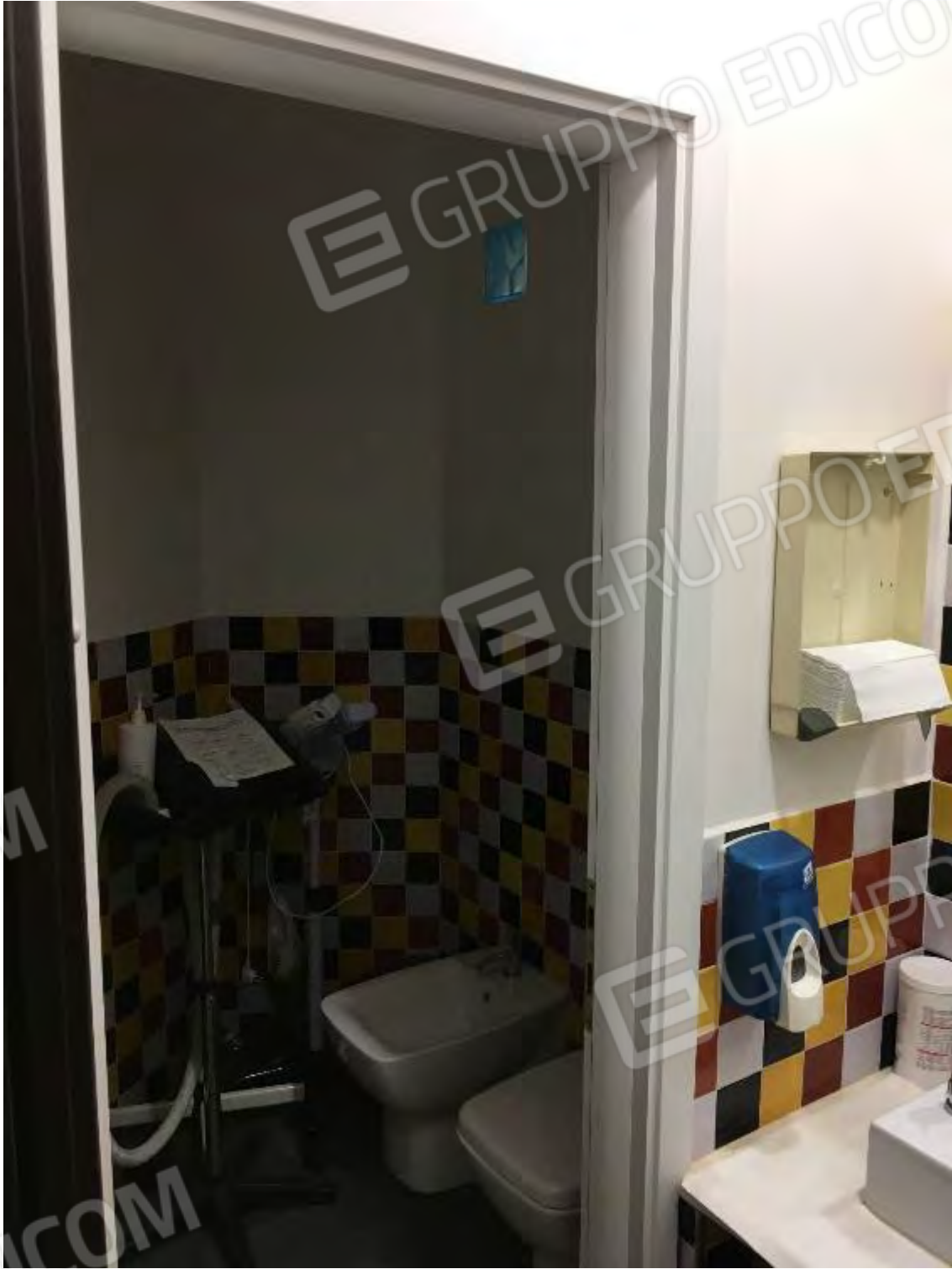
SERVIZIO IGIENICO CENTRO BENESSERE