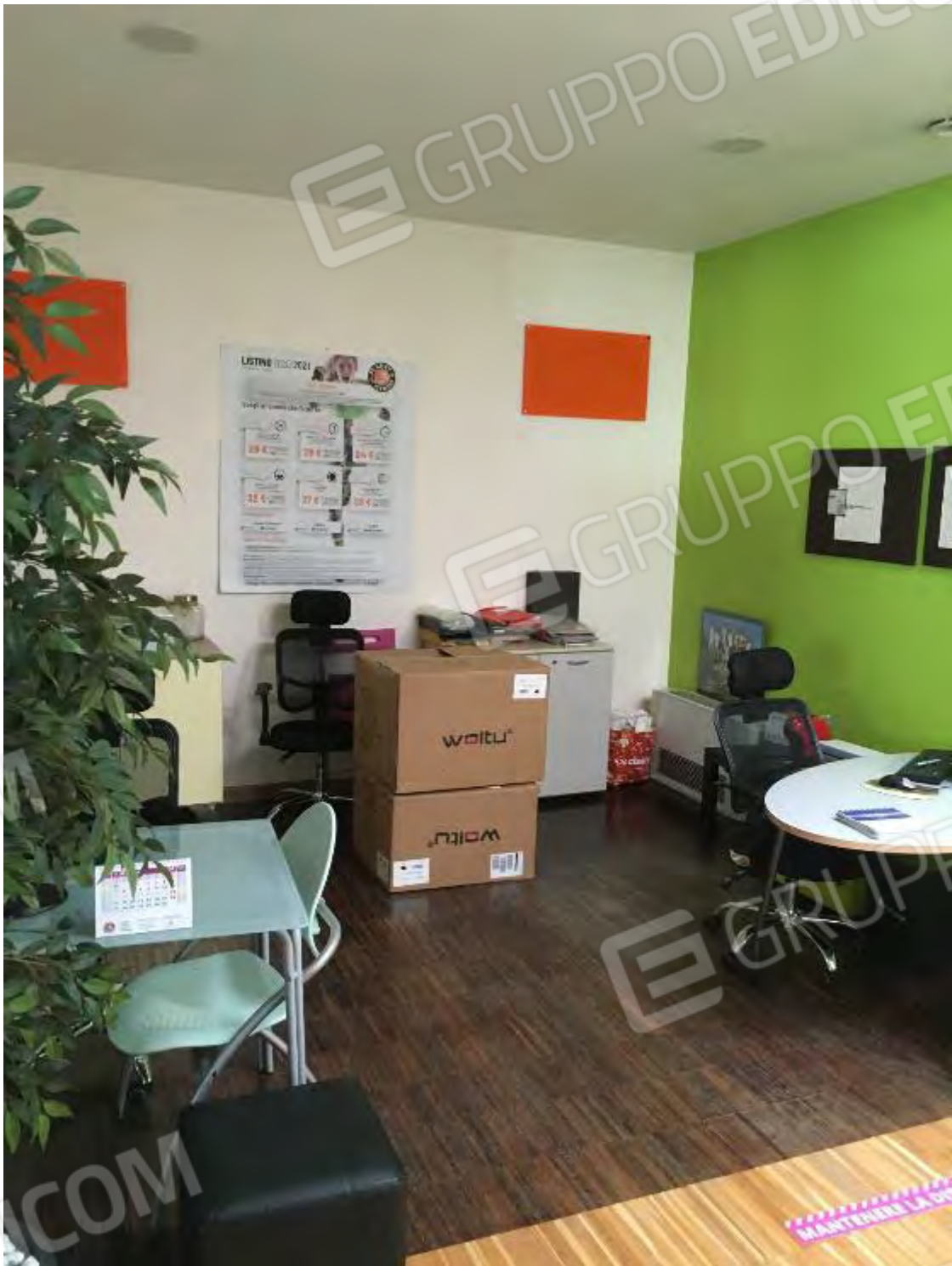
UFFICIO CENTRO BENESSERE