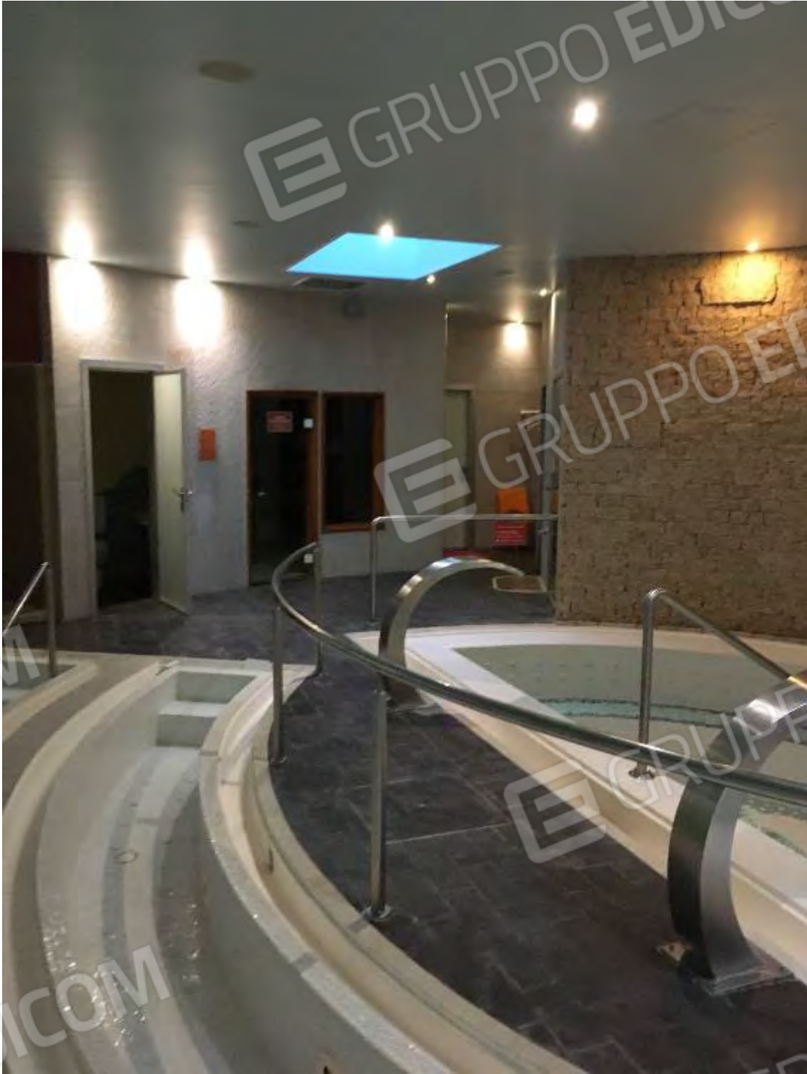
VASCA IDROMASSAGGIO E PERCORSI