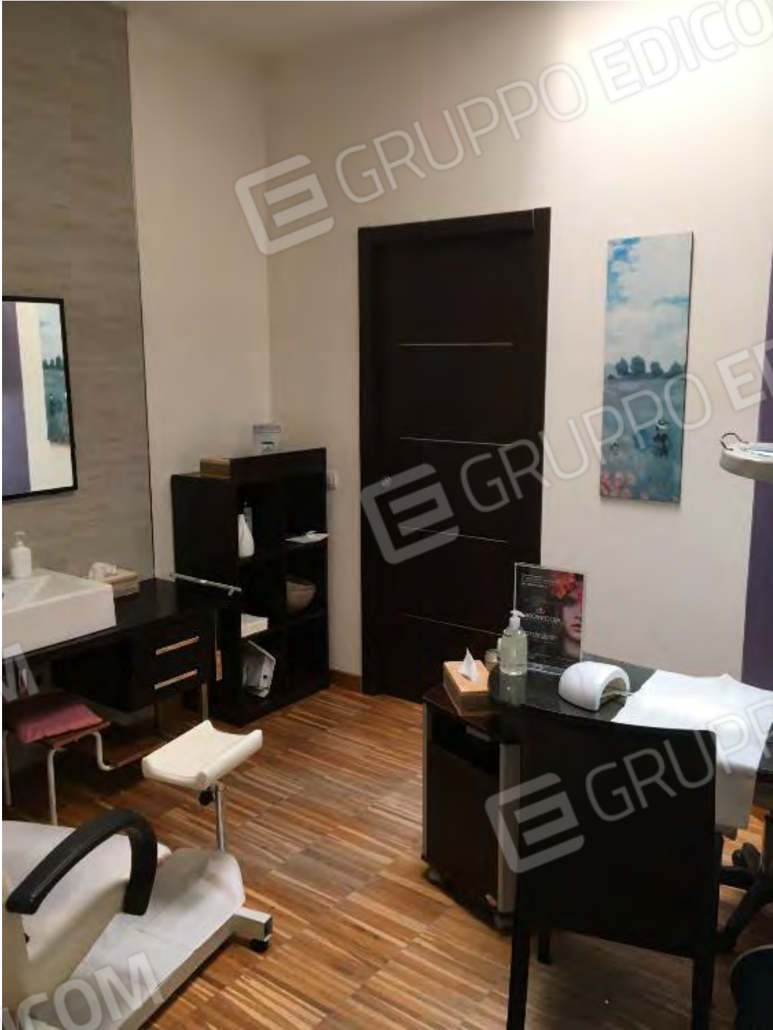
LABORATORIO ESTETICO CENTRO BENESSERE