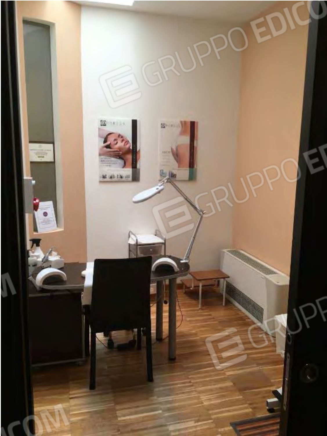
LABORATORIO ESTETICO CENTRO BENESSERE