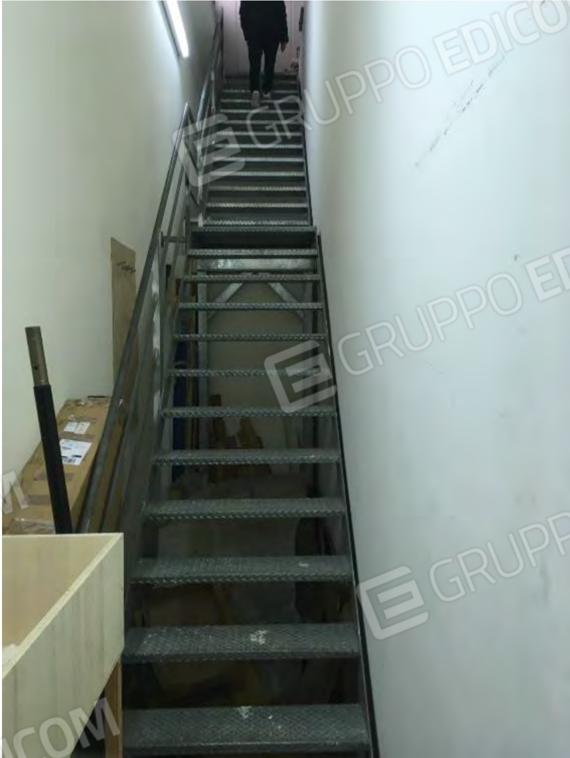
SCALA ACCESSO PIANO COPERTURA