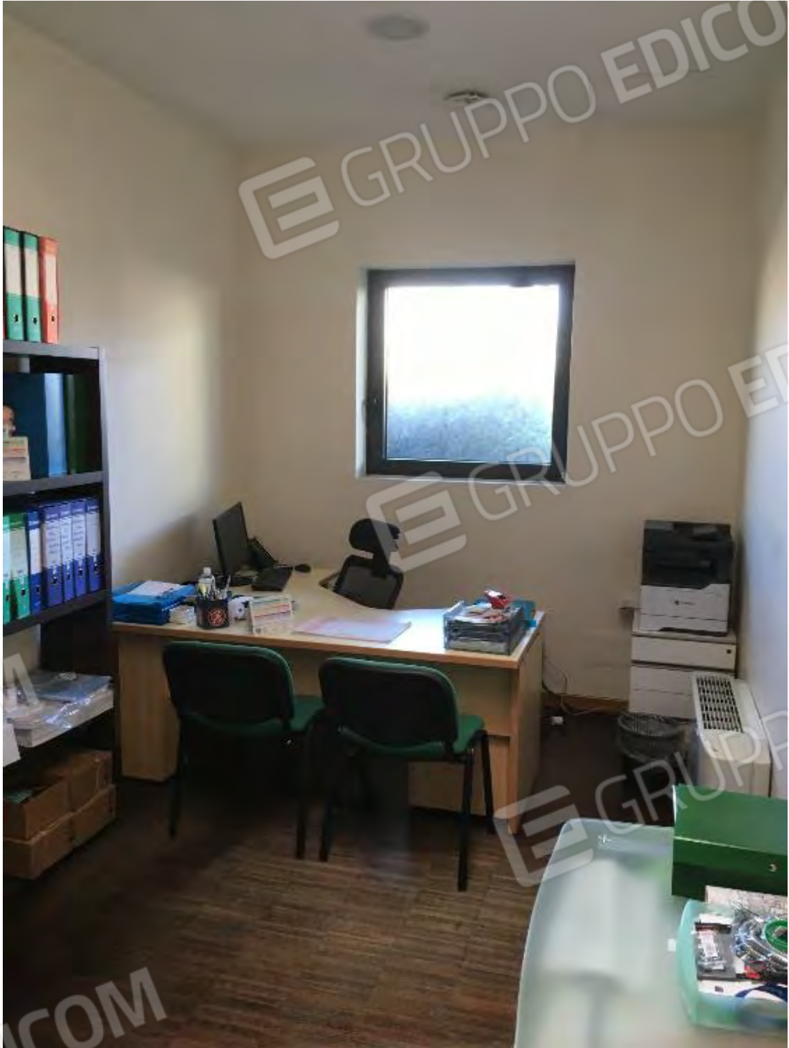
UFFICIO CENTRO BENESSERE