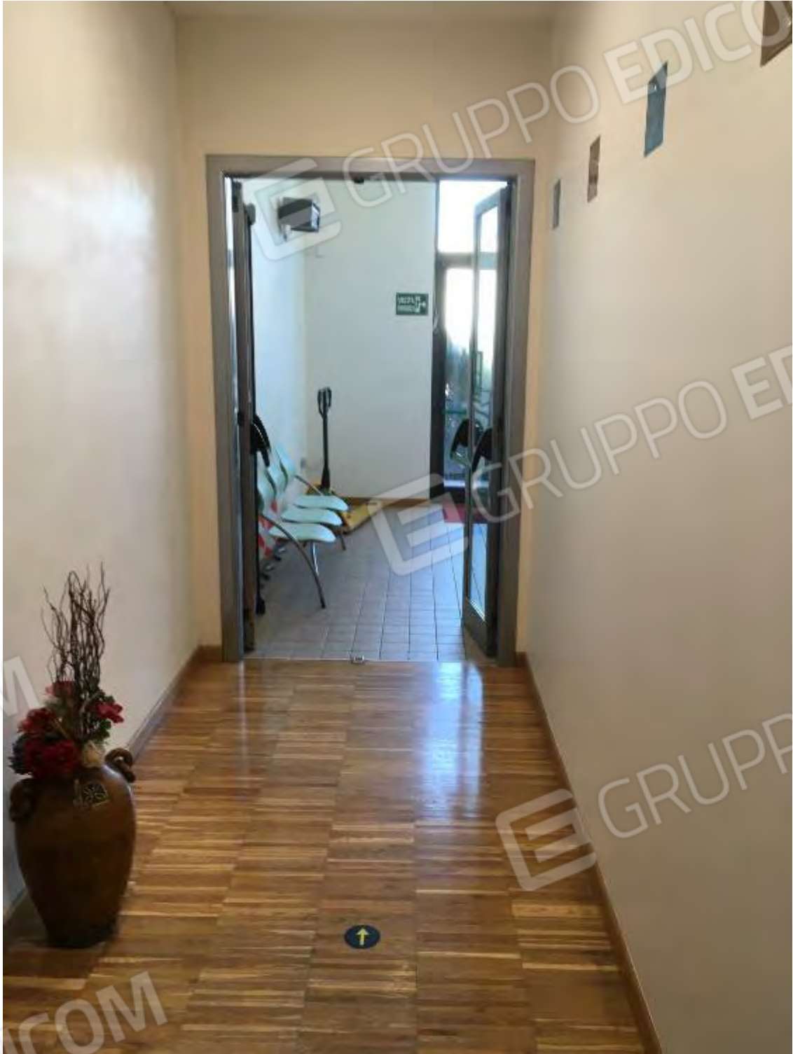
USCITA EMERGENZA CENTRO BENESSERE