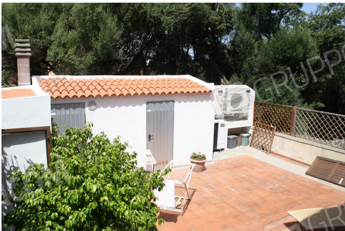
Area di pertinenza con generatori di aria caldo/freddo