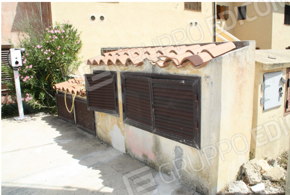
Manufatto con contatori