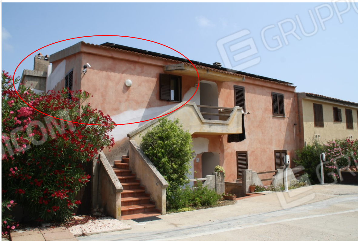
Ripresa dello Stabile sul lato sud – ovest – individuazione Lotto