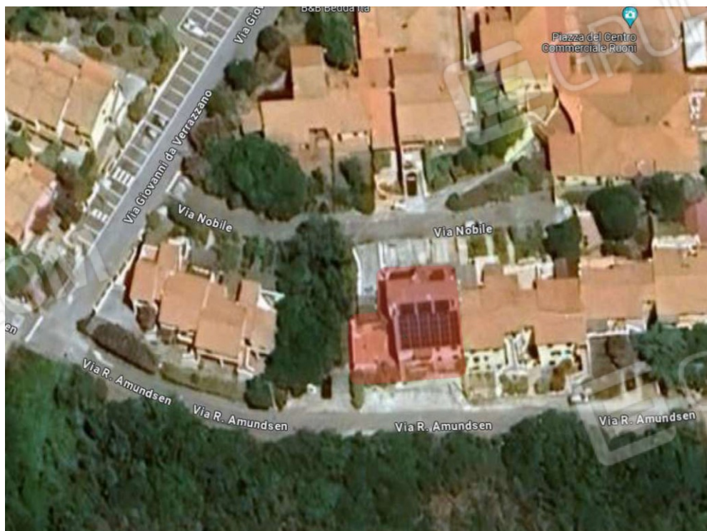
Foto aerea con individuazione dello stabile in cui è sito il Lotto eseguito