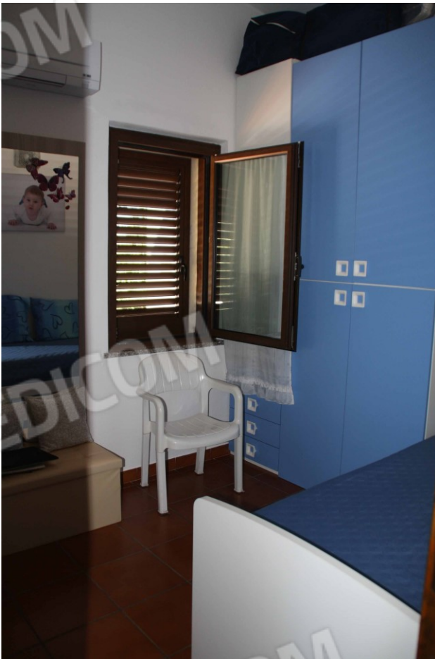
Studio ad uso camera