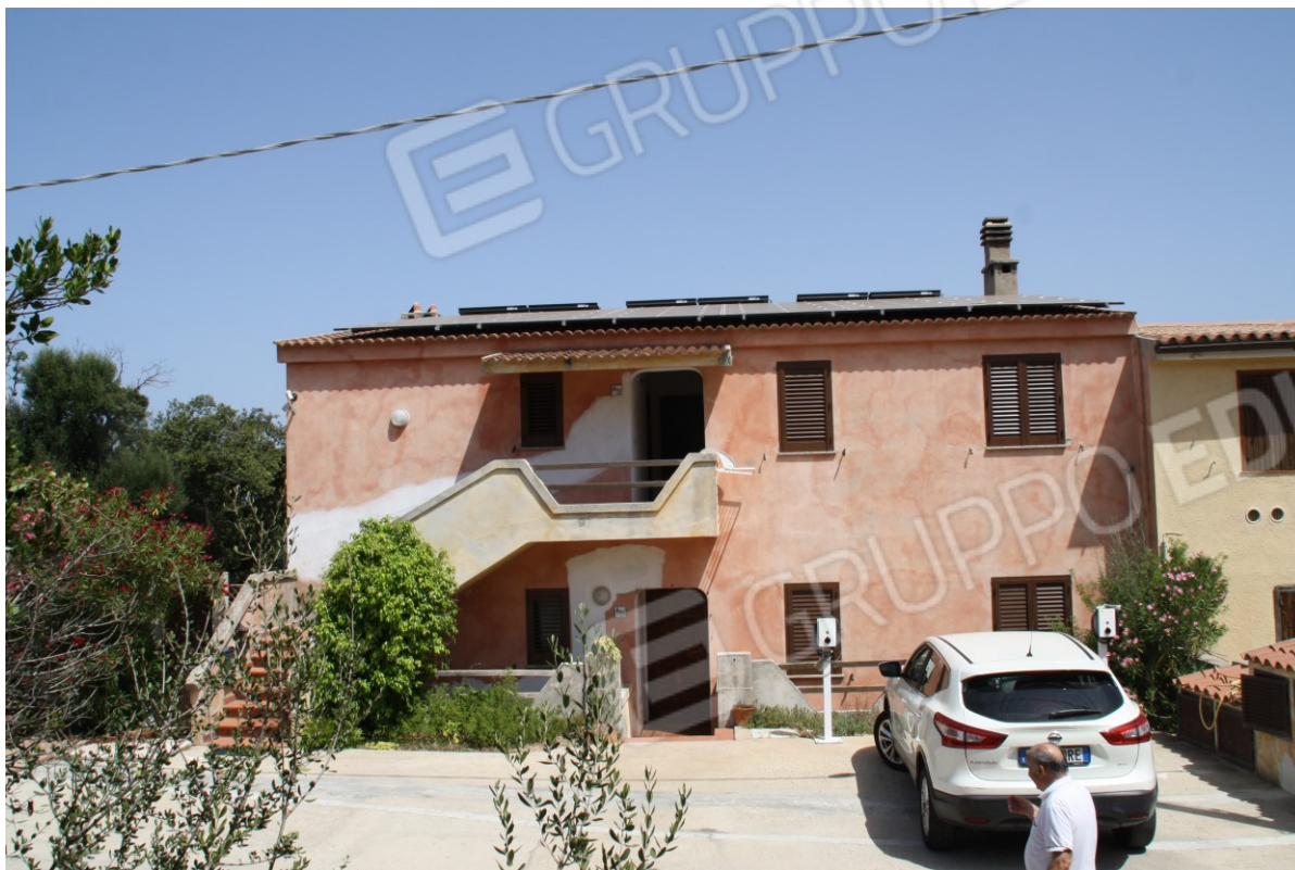
Stabile in cui è sito l'appartamento – Facciata su via Amundsen