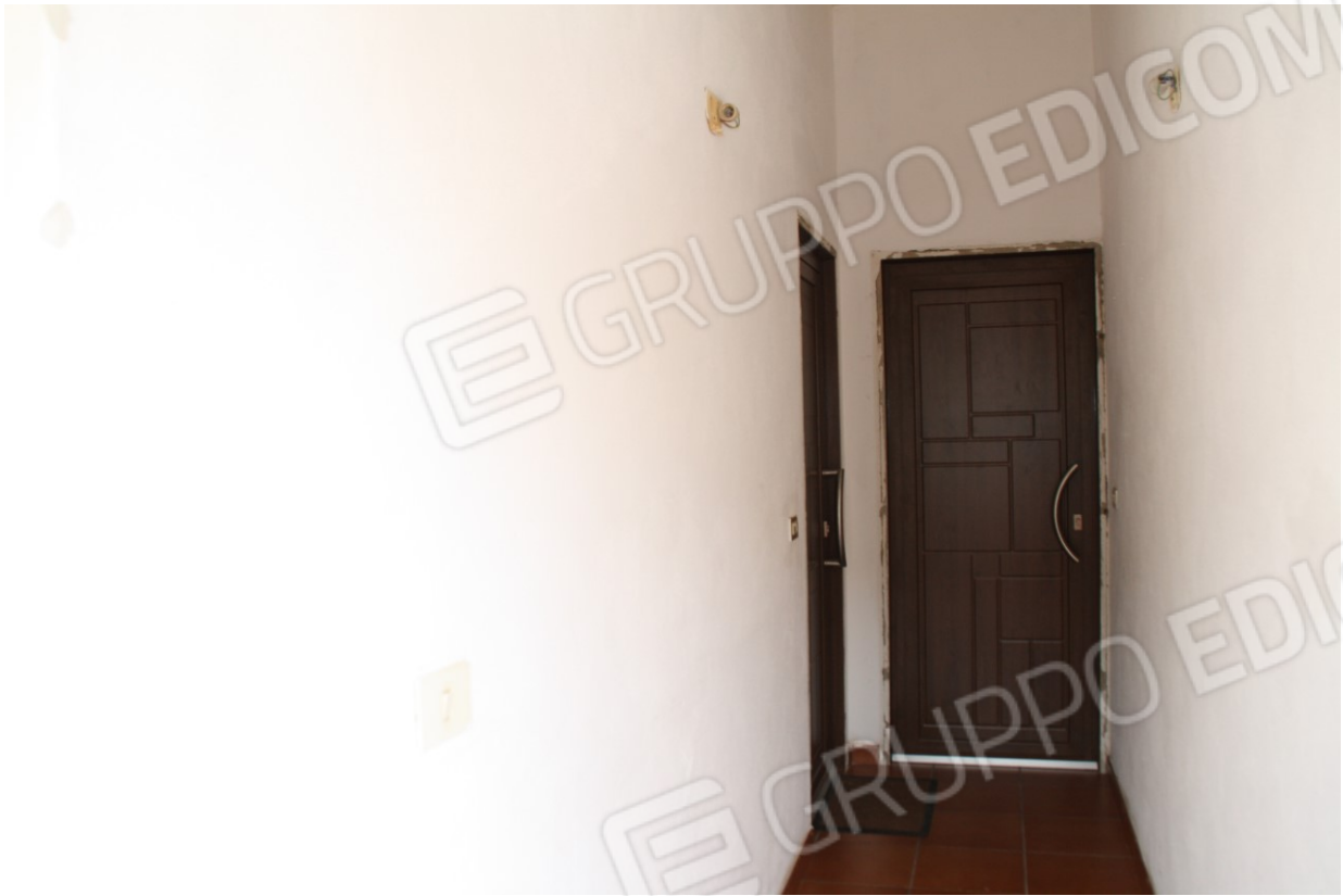
Ingresso (subalaterno 4)