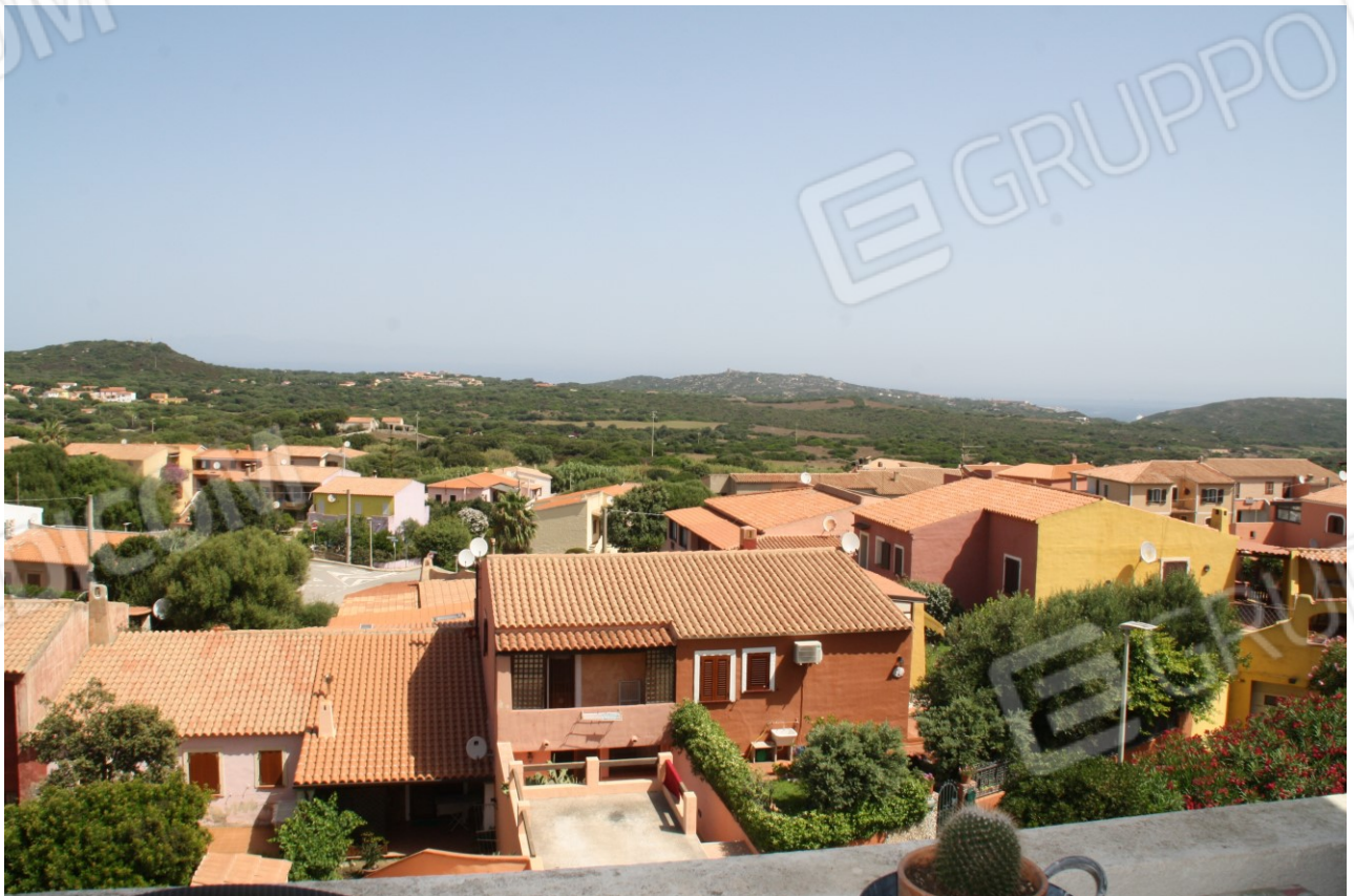
Veduta a nord dal terrazzo