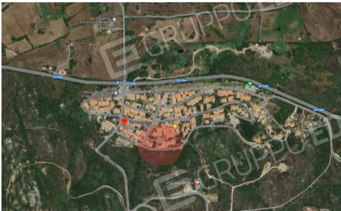
Foto aerea dell'abitato di "Ruoni" con individuazione della zona in cui è ubicato l'immobile