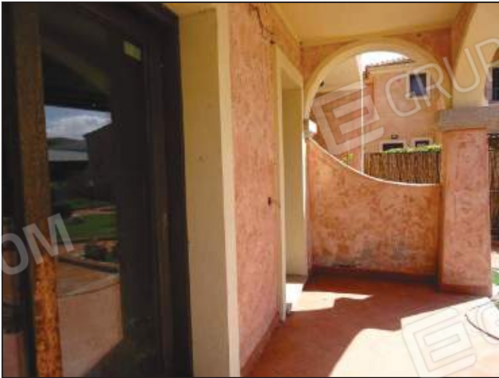
Vista della veranda coperta lato sud (ingresso alla proprietà).