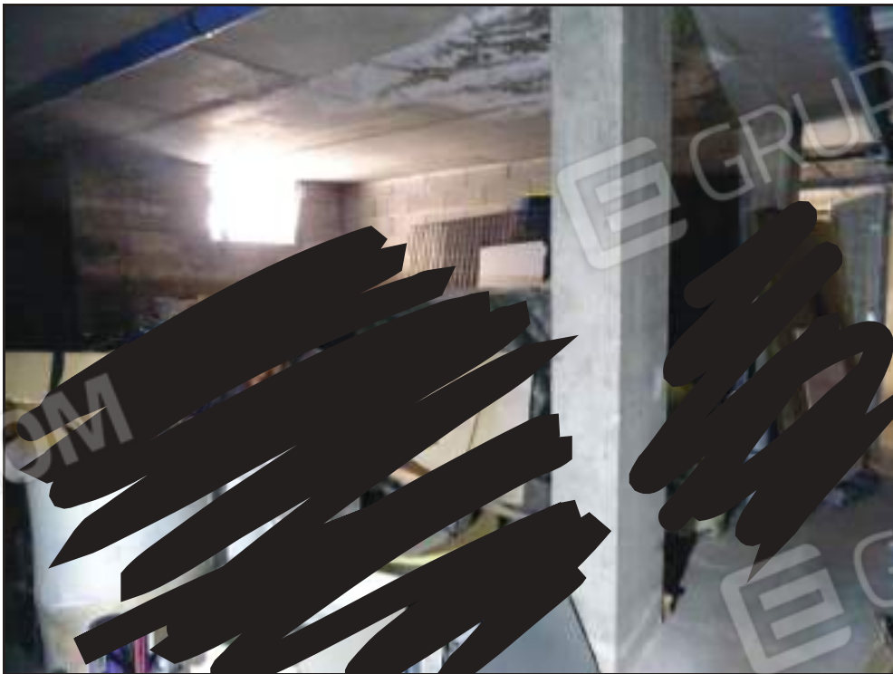
Vista dei locali subb. 22, 23.