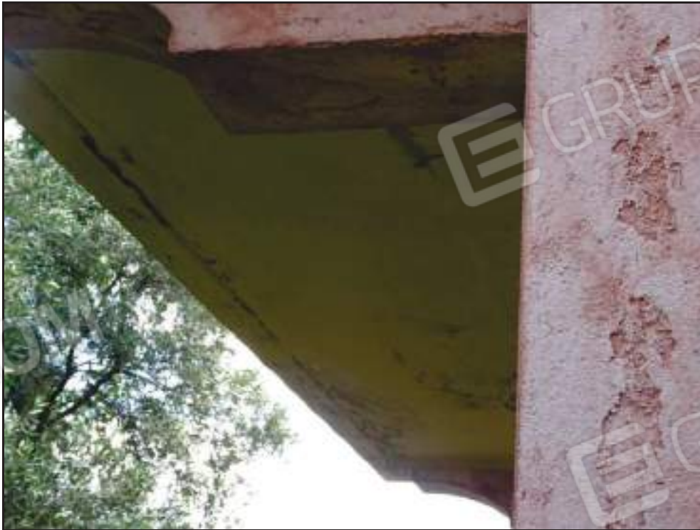
Particolare esfoliazioni tinteggiatura sul soffitto della veranda coperta lato nord.