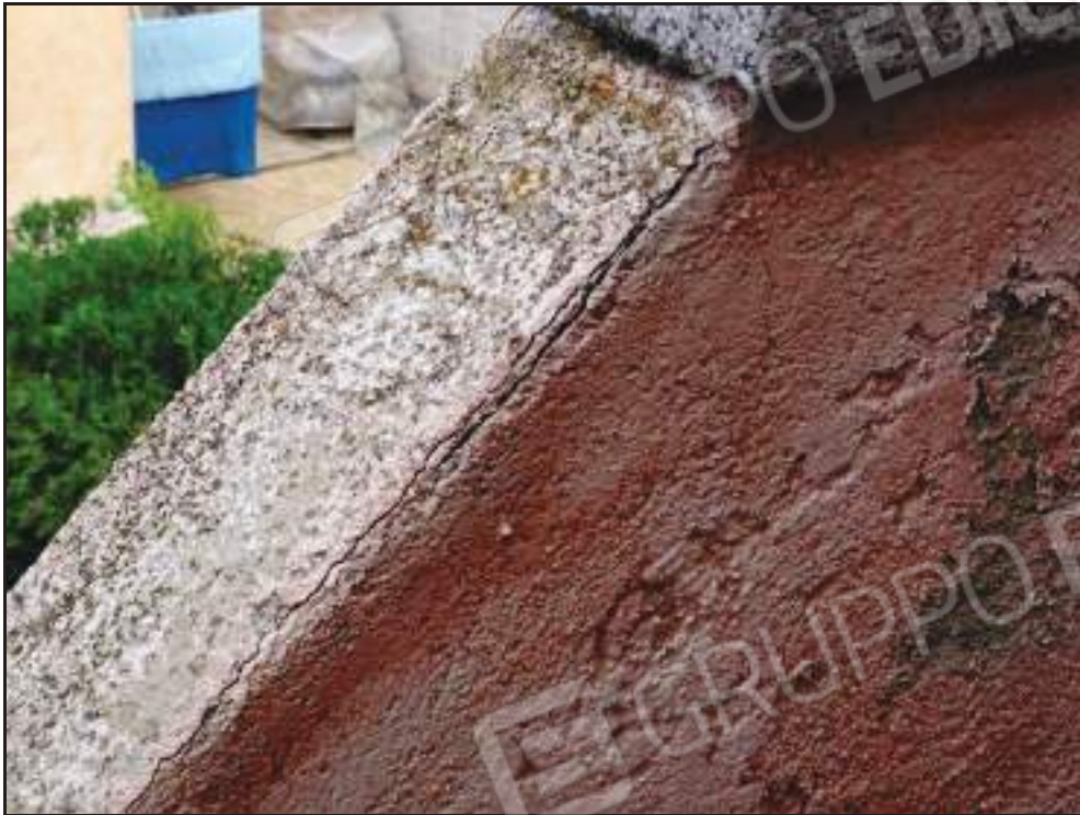
Particolare lesioni nel parapetto balconi.