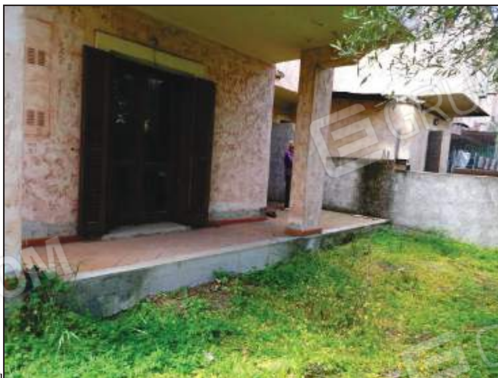
Vista dal giardino sulla veranda di pertinenza della padronale.