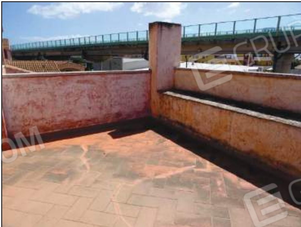
Vista sulla terrazza panoramica esposta a sud.