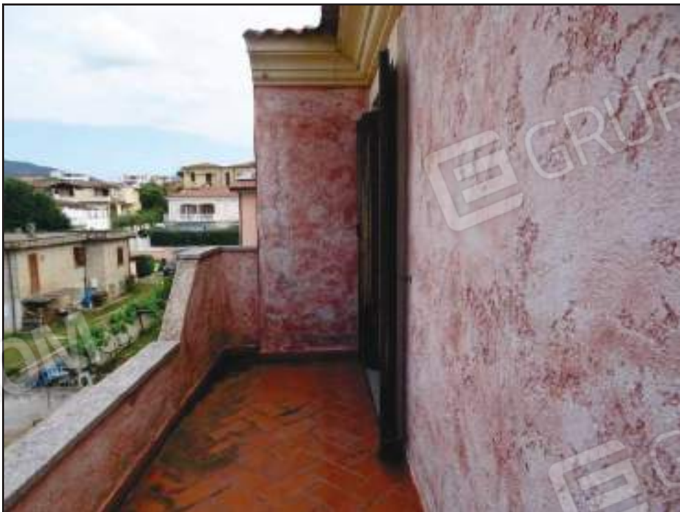
Vista del balcone rivolto ad ovest.