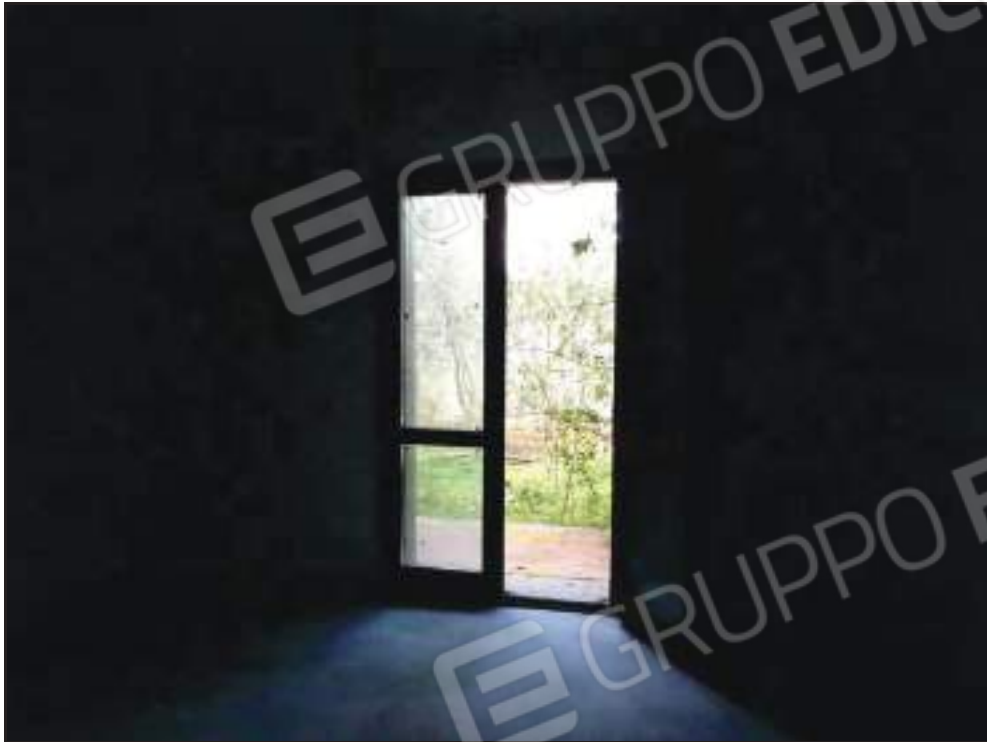
Vista della camera da letto singola.