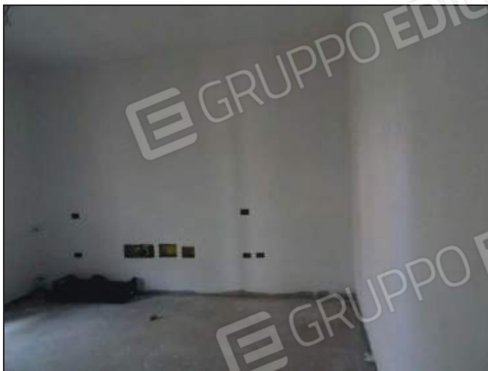
Vista della camera da letto padronale.