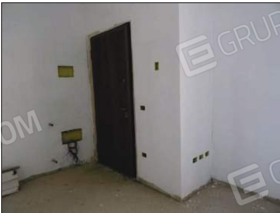
Vista dell'ingresso sul soggiorno.