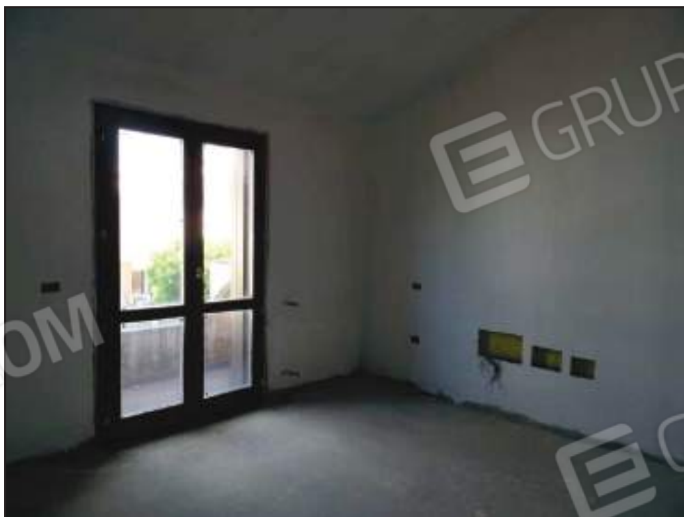
Vista della camera da letto padronale con accesso al balcone lato nord.