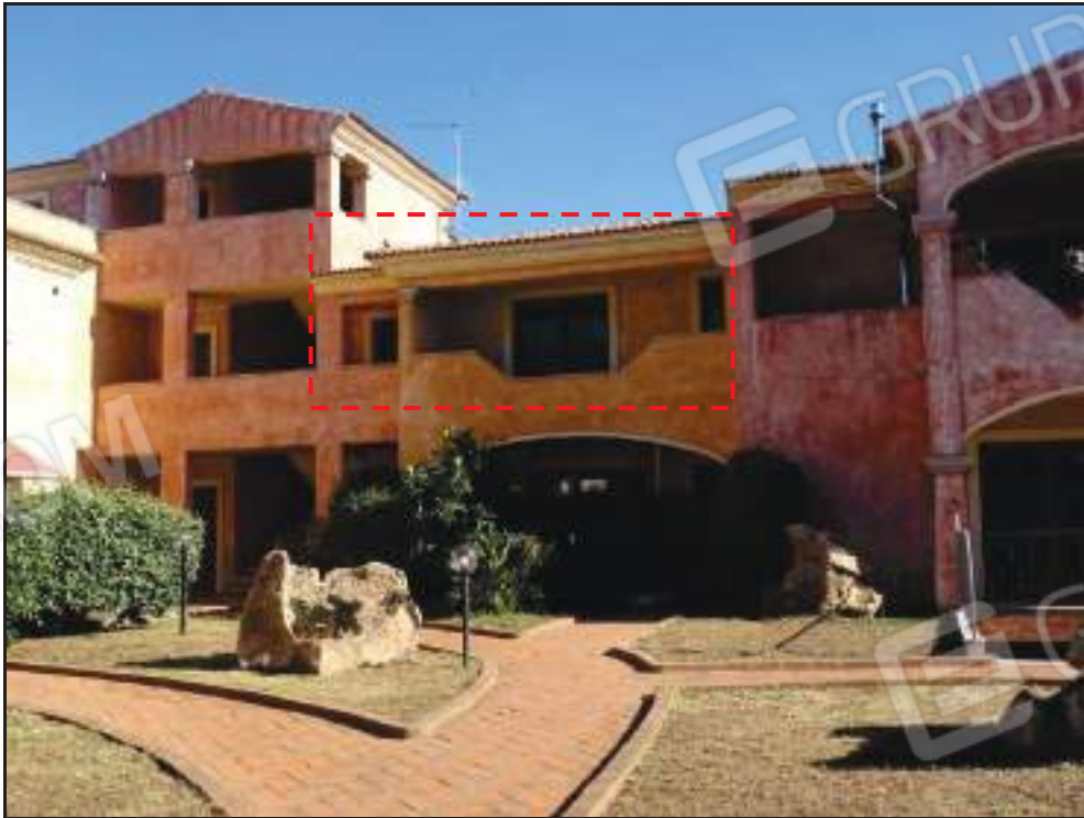
Vista del Sub.11 dall'area condominiale.