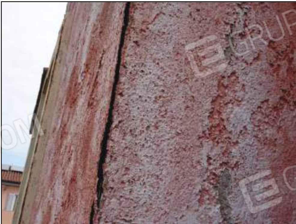
Particolare lesioni intonaco della muratura esterna.