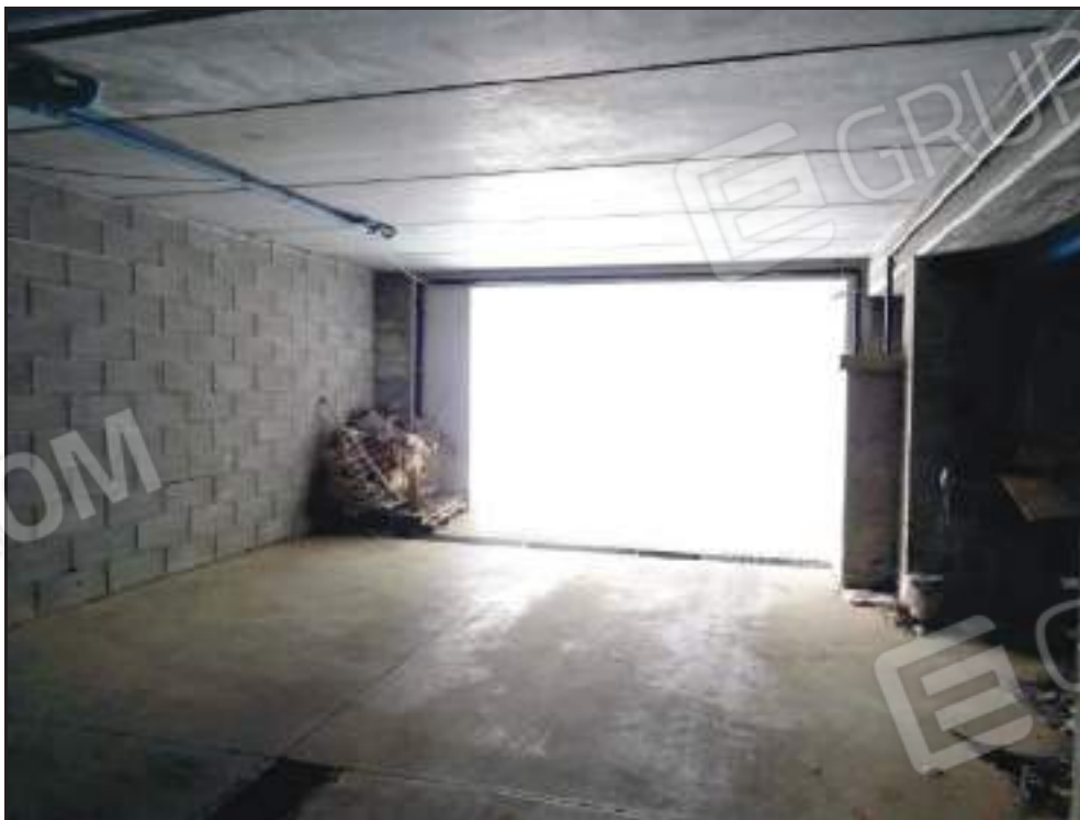
Vista dell'ingresso carrabile al garage.