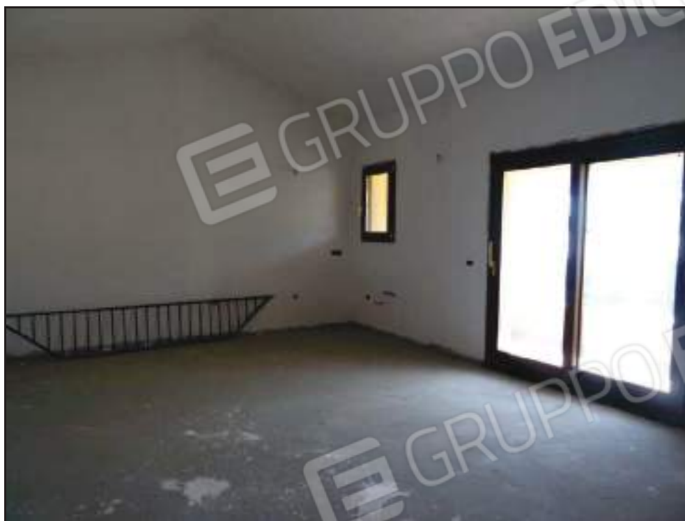
Vista del soggiorno con accesso alla veranda coperta lato sud.