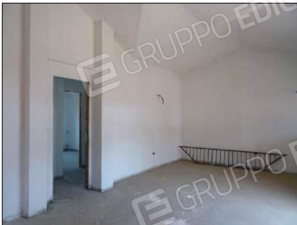
Vista del soggiorno con accesso alla zona notte.