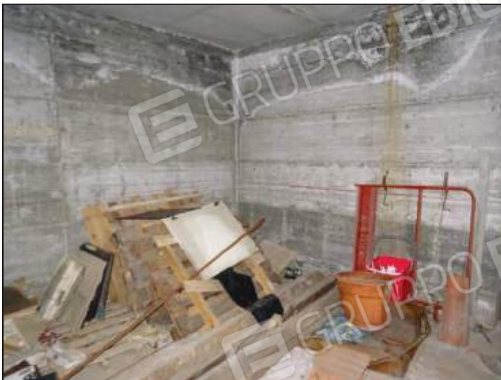
Particolare infiltrazioni nel locale sub 28.