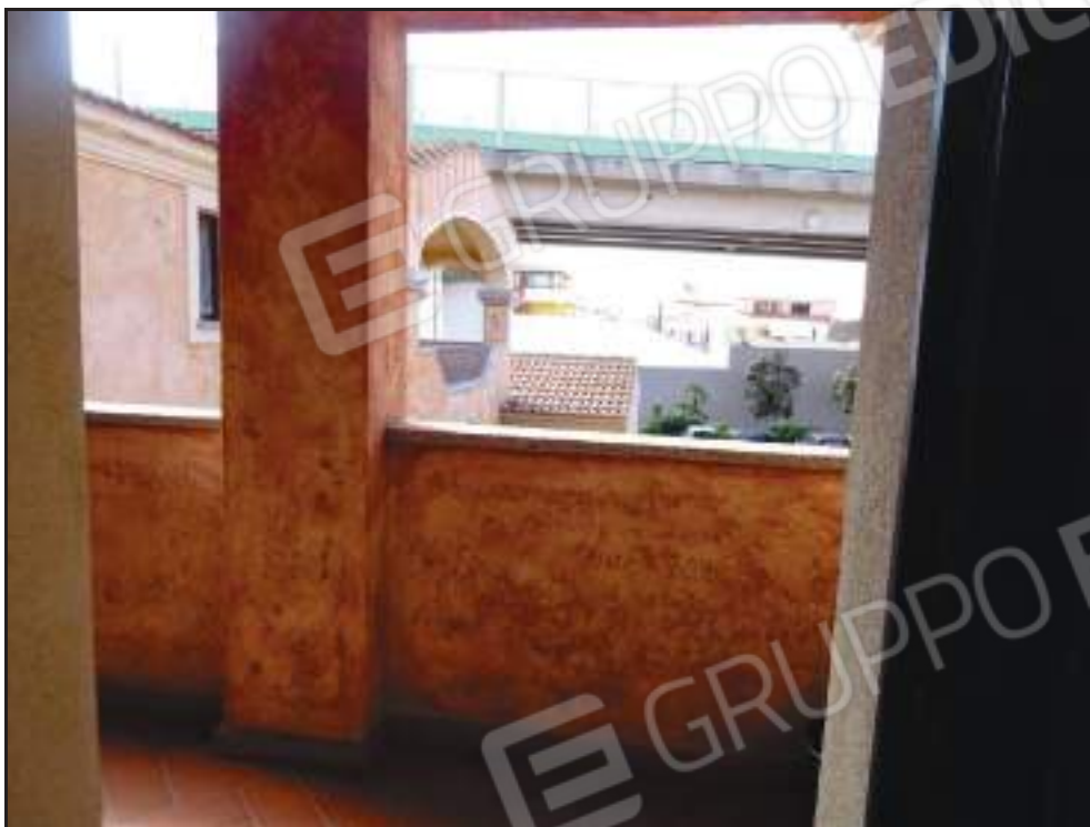
Vista ingresso dal pianerottolo di pertinenza.