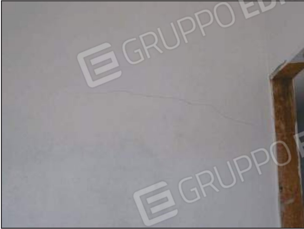
Particolare crepa di assentamento in una camera da letto.