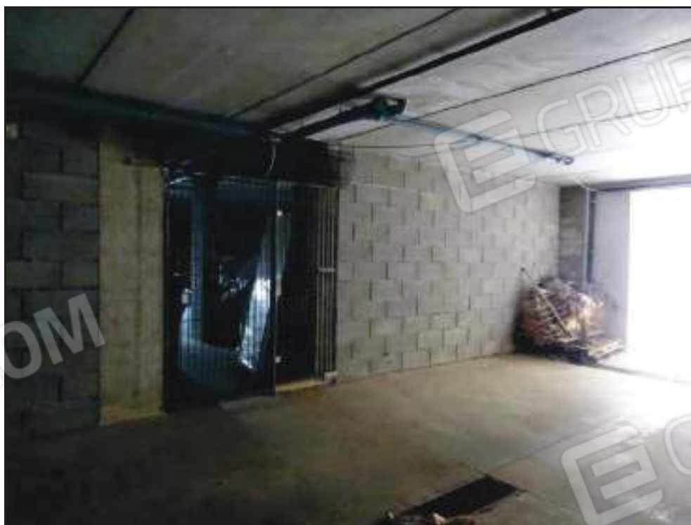
Vista ingresso ai locali subb. 21, 22, 23.