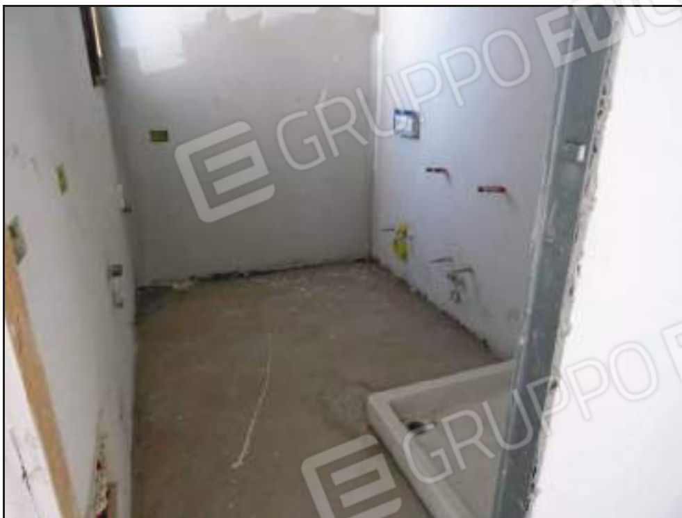
Vista ingresso al bagno.