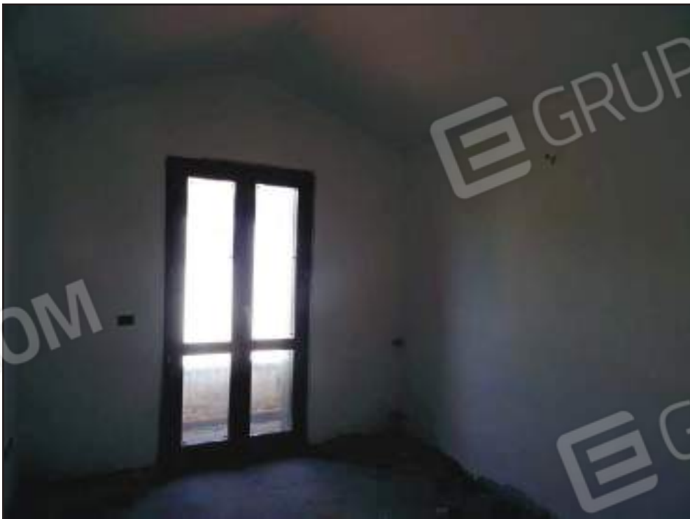
Vista della camera da letto singola con accesso al balcone lato nord.