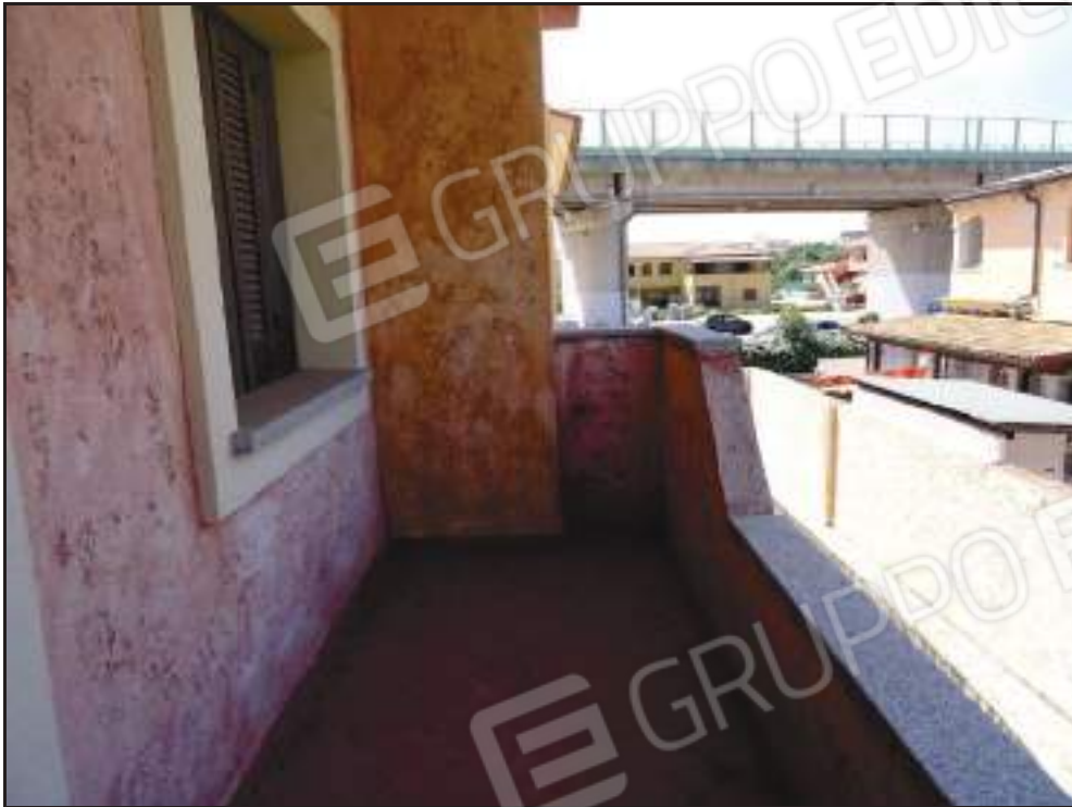
Vista della veranda coperta lato ovest con accesso dal soggiorno.