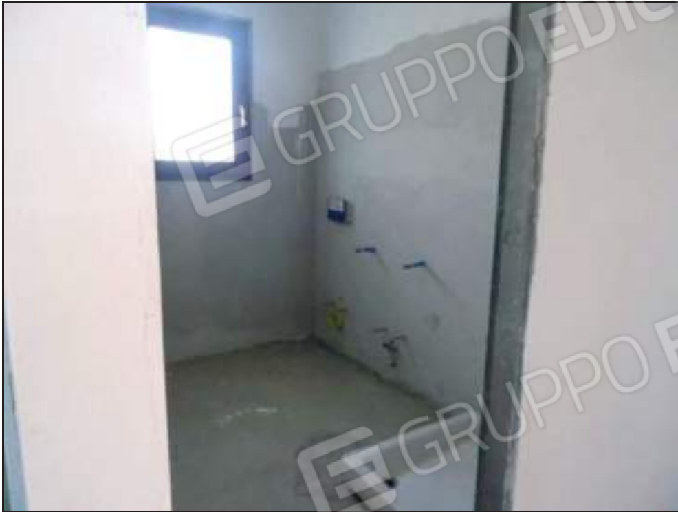
Vista ingresso al bagno lato nord.