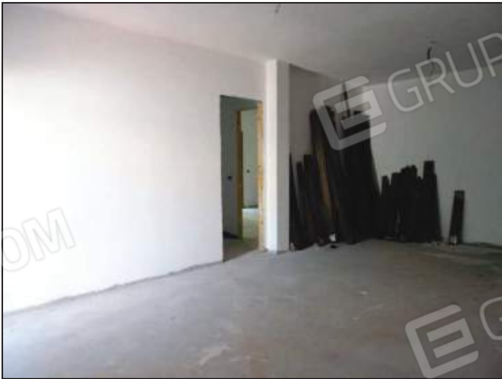
Vista del soggiorno con porta di accesso alla zona notte.