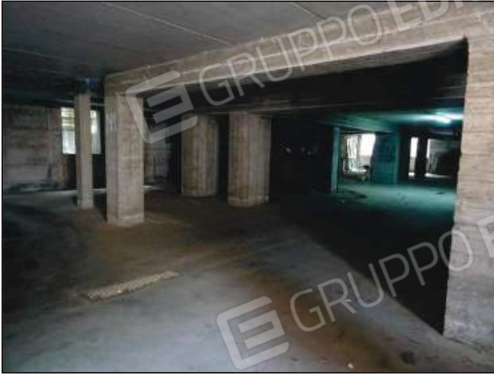
Vista sul garage