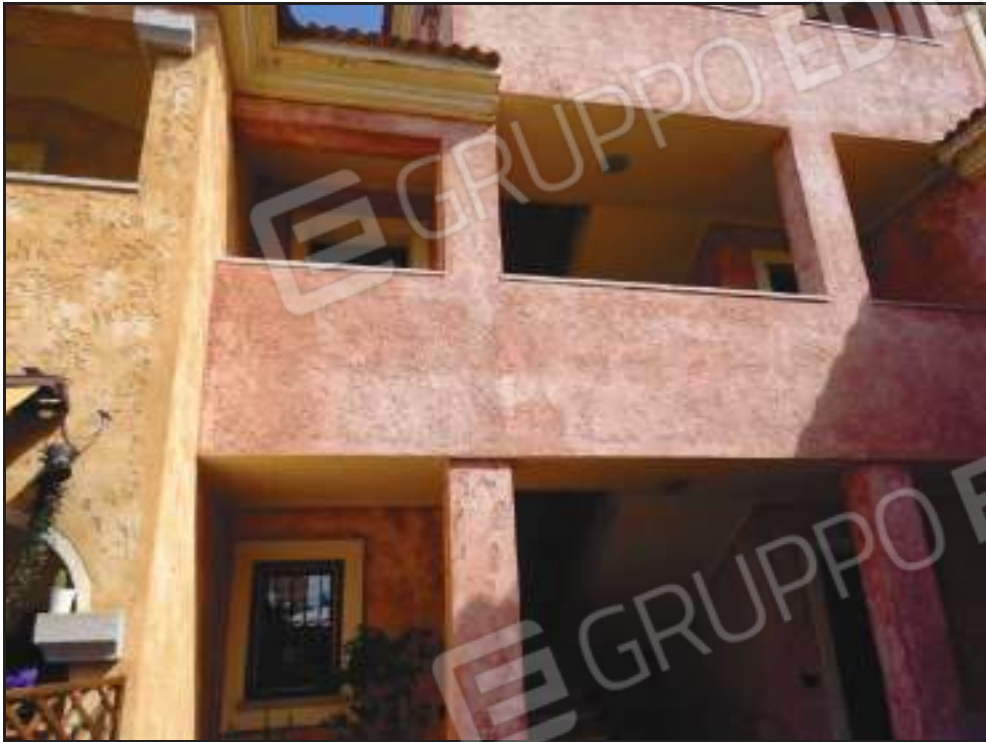
Vista della proprietà dall'area condominiale.