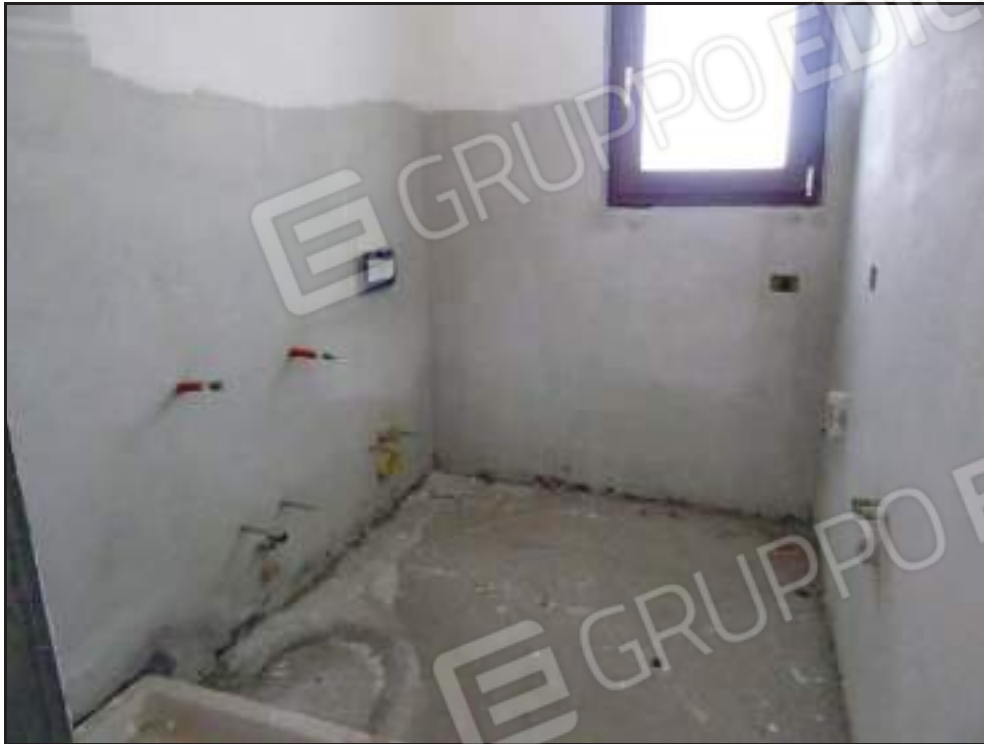
Vista dell'ingresso al bagno.