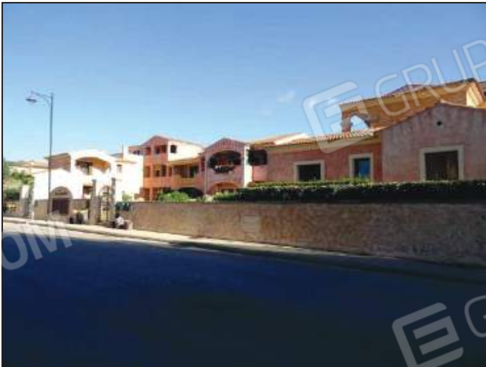
Vista del complesso immobiliare "Le Ginestre" da via Strasburgo.