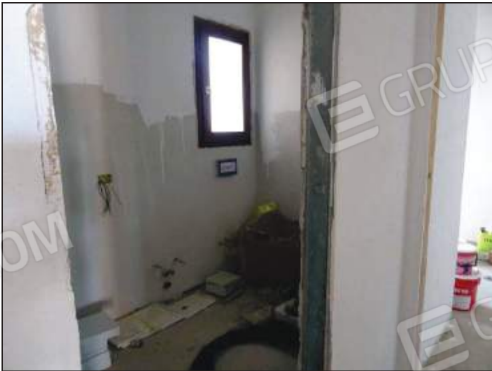
Vista ingresso al bagno lato nord.