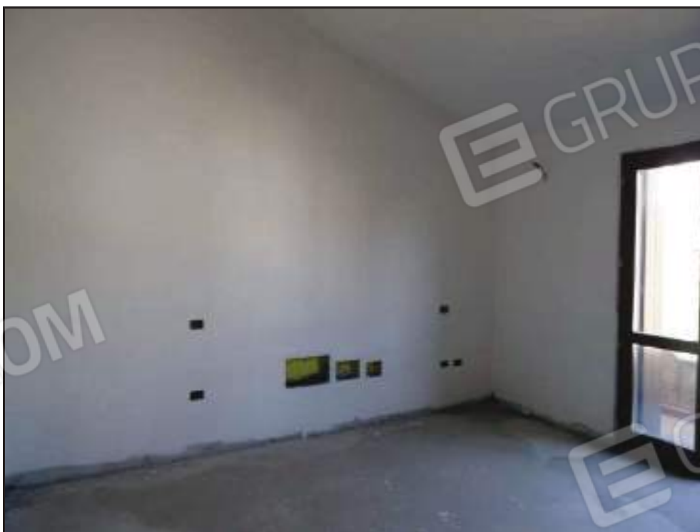
Vista della camera da letto padronale.