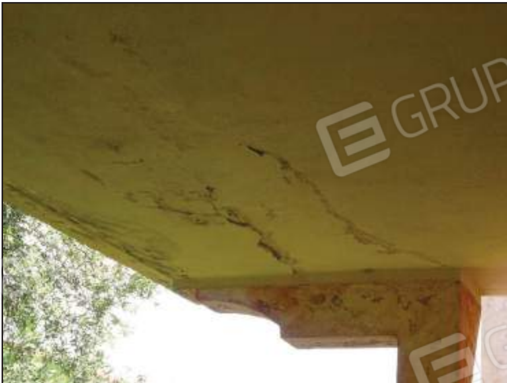
Particolare esfoliazioni tinteggiatura sul soffitto della veranda coperta lato nord.