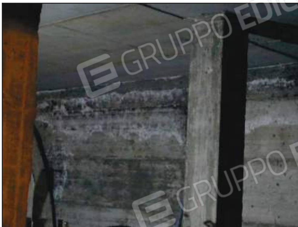
Particolare infiltrazioni parete nei locali subb. 22, 23