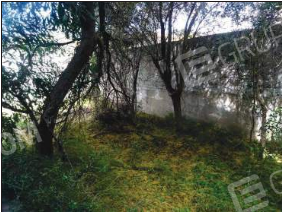
Vista sul giardino di pertinenza.