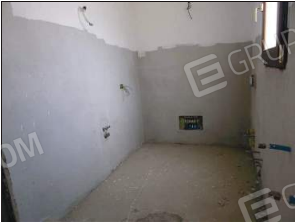
Vista del bagno annesso alla camera padronale.