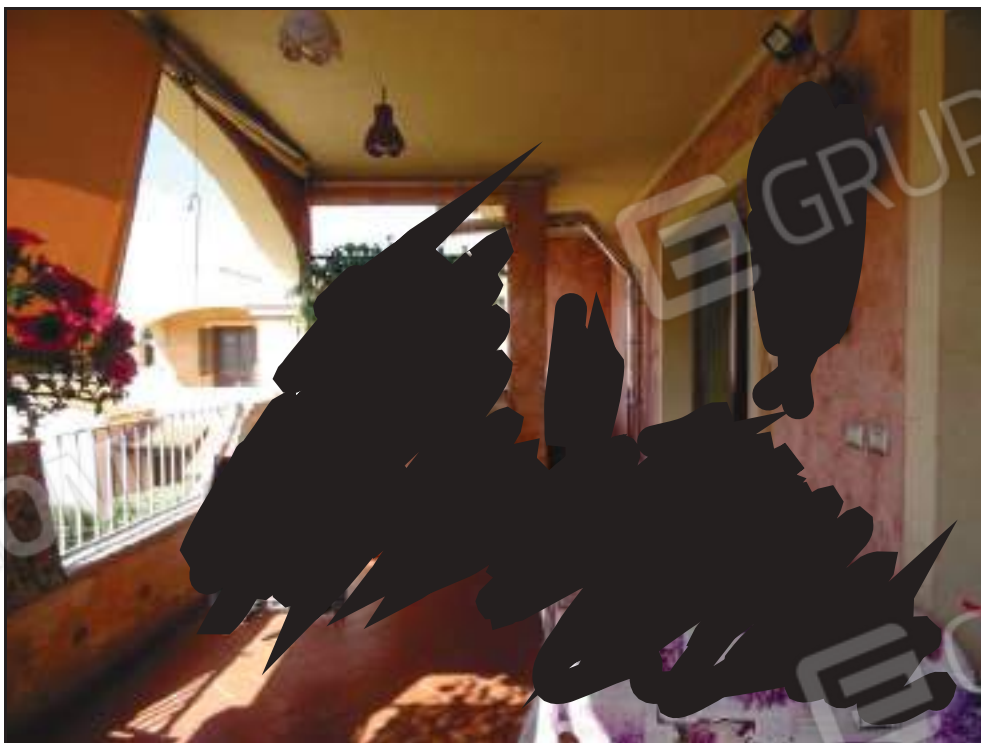
Vista sulla veranda coperta lato sud. (ingresso all'appartamento)