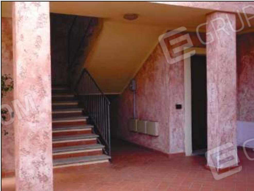
Vista ingresso alla proprietà dal corpo scala condominiale.