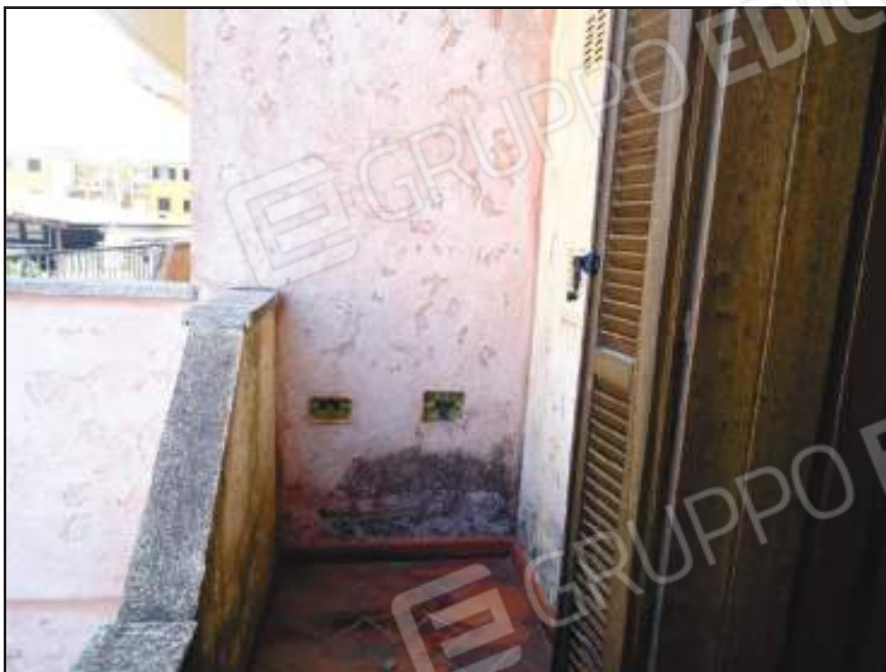
Stato di degrado nel balcone annesso alla camera padronale.