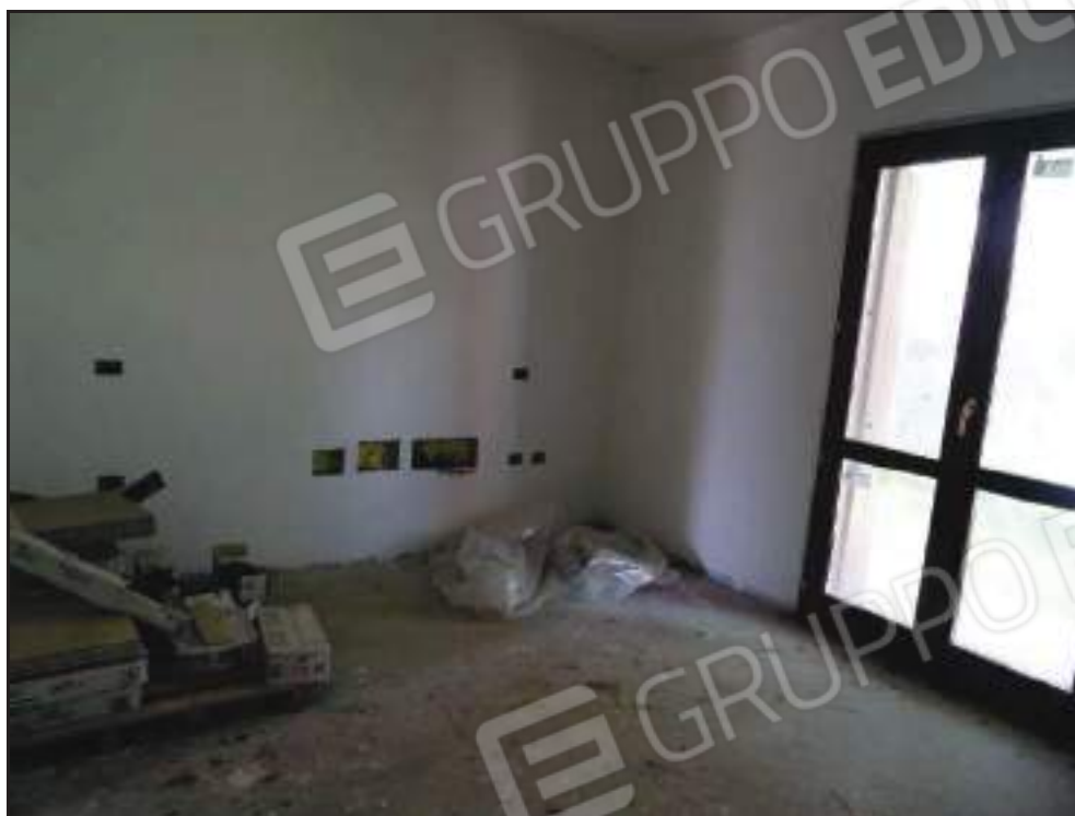
Vista della camera da letto padronale con accesso al giardino.