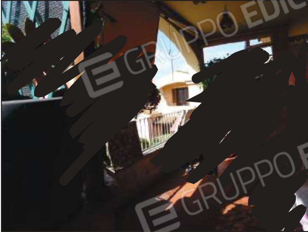
Vista sulla veranda coperta lato sud.