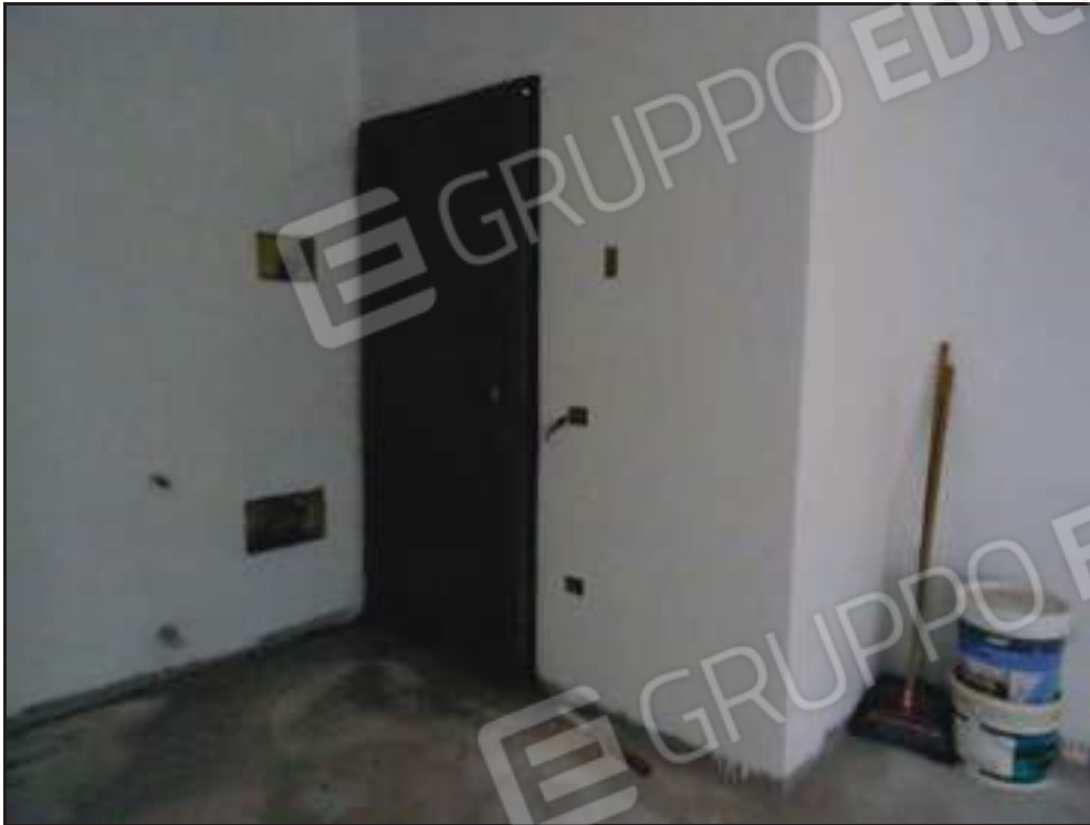
Vista dell'ingresso sul soggiorno.