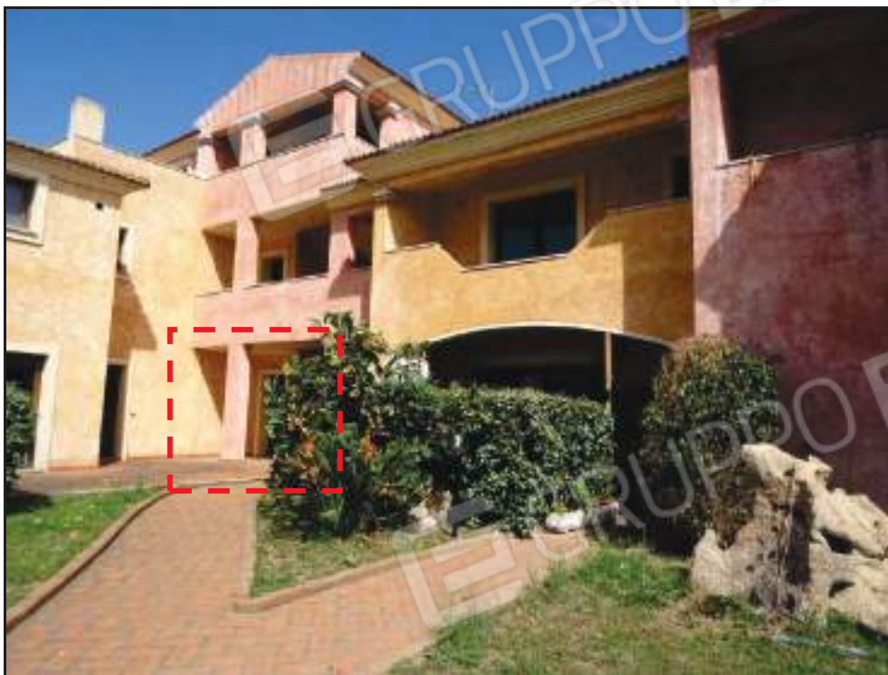
Vista del sub. 3 dall'area condominiale.