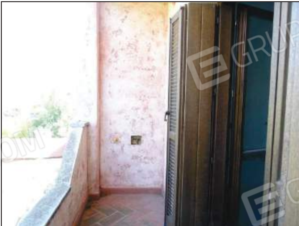
Vista della veranda coperta annessa alla camera padronale.