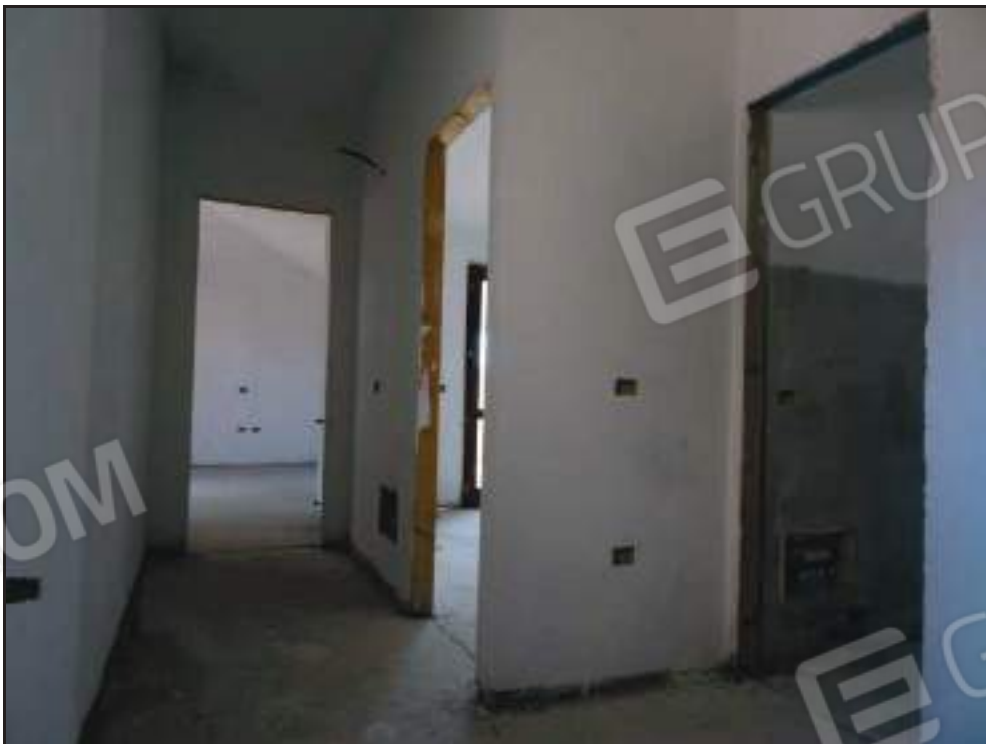
Vista del disimpegno al piano primo con accesso alle camere.