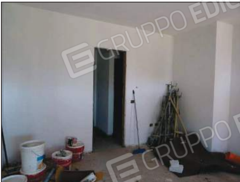
Vista del soggiorno con accesso alla zona notte.