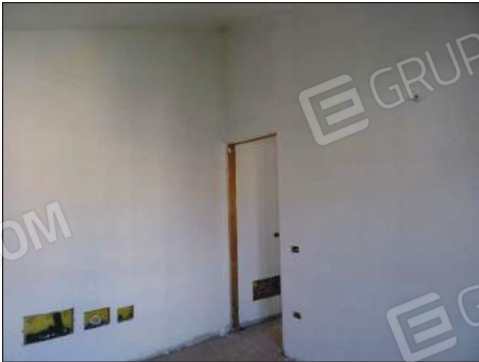
Vista dell'ingresso alla camera da letto padronale.