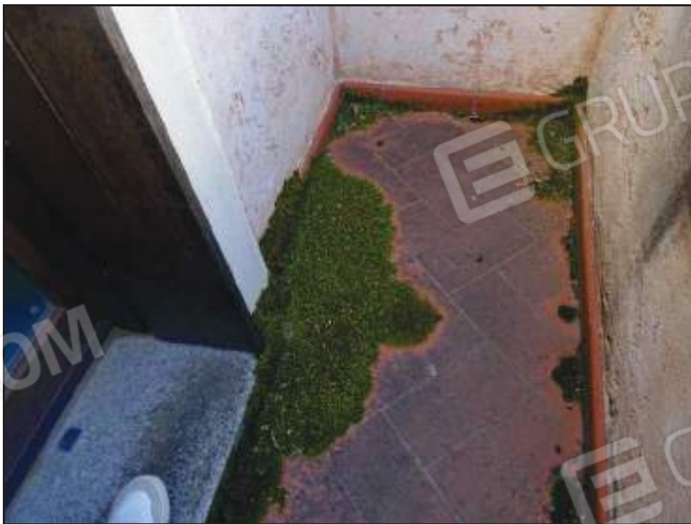
Particolare criticità nel balcone annesso alla camera da letto singola.