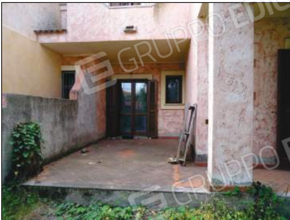
Vista dal giardino sulla veranda con accesso alla camera singola.