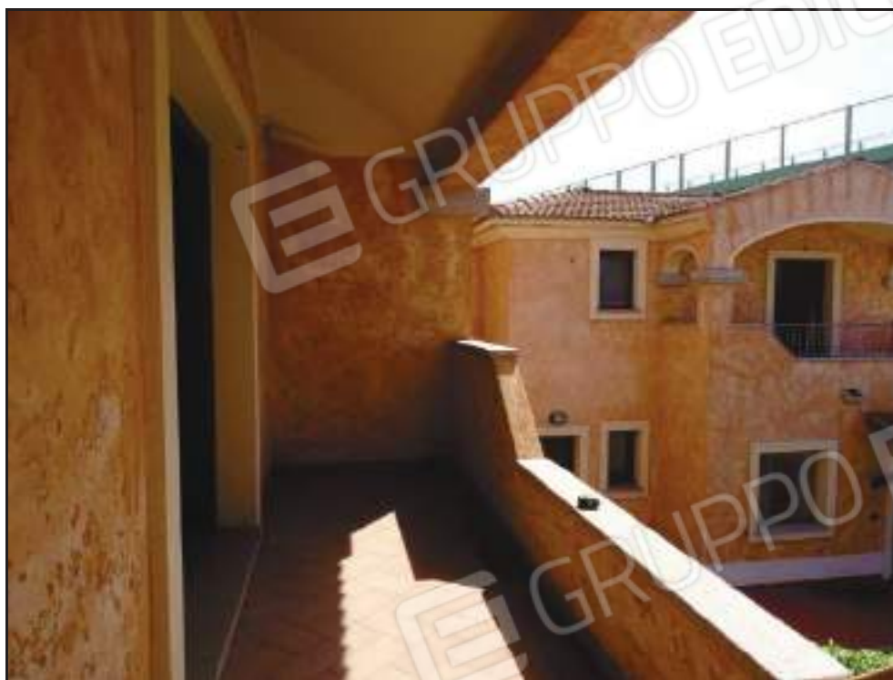
Vista sulla veranda coperta lato sud con accesso dal soggiorno.