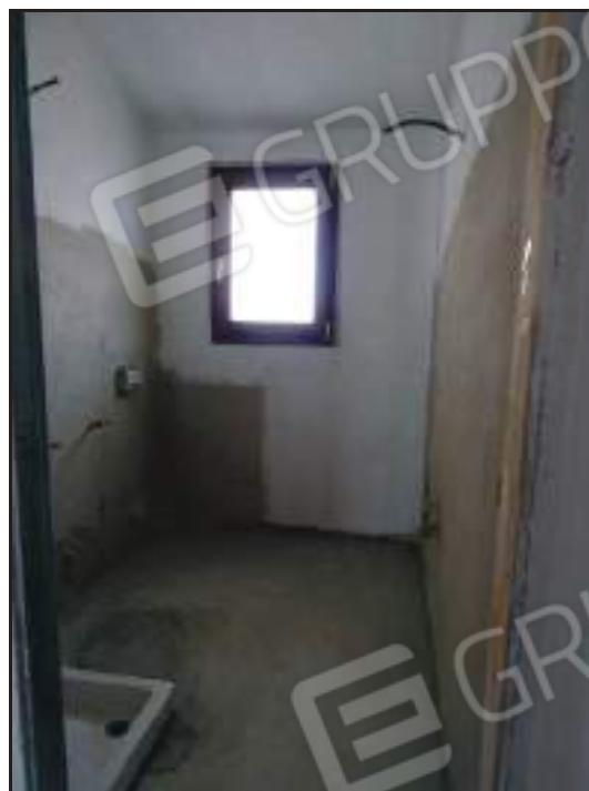
Vista ingresso al bagno lato nord.