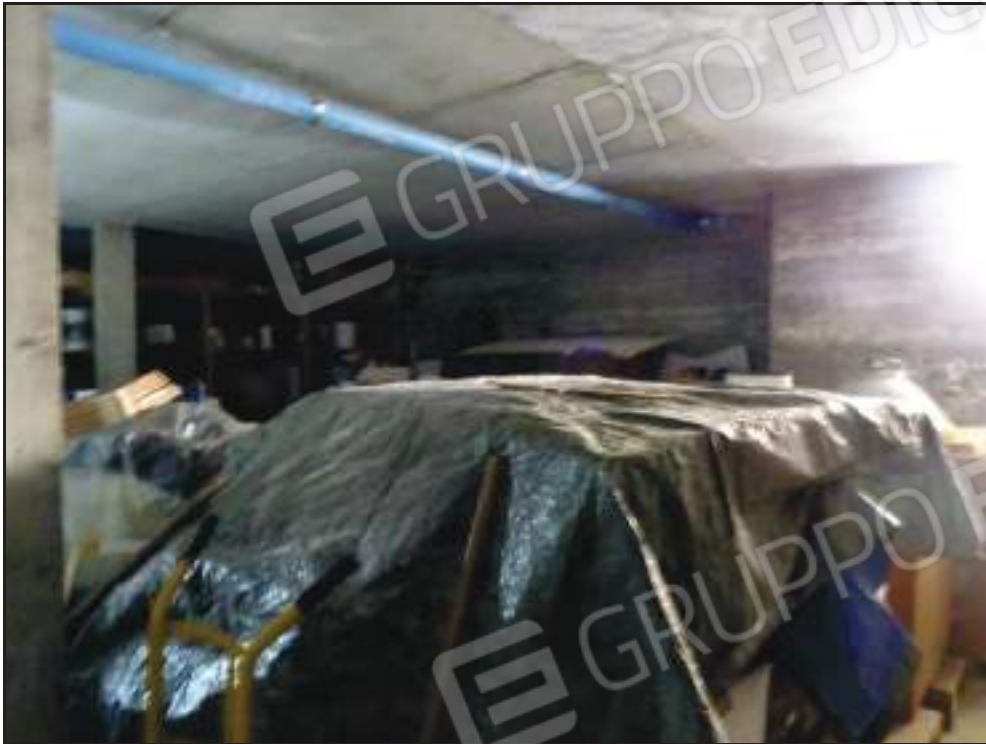
Vista dei locali subb. 22, 23.