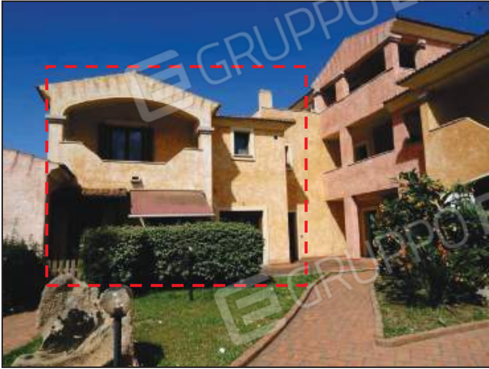
Vista del sub. 2 dall'area condominiale.