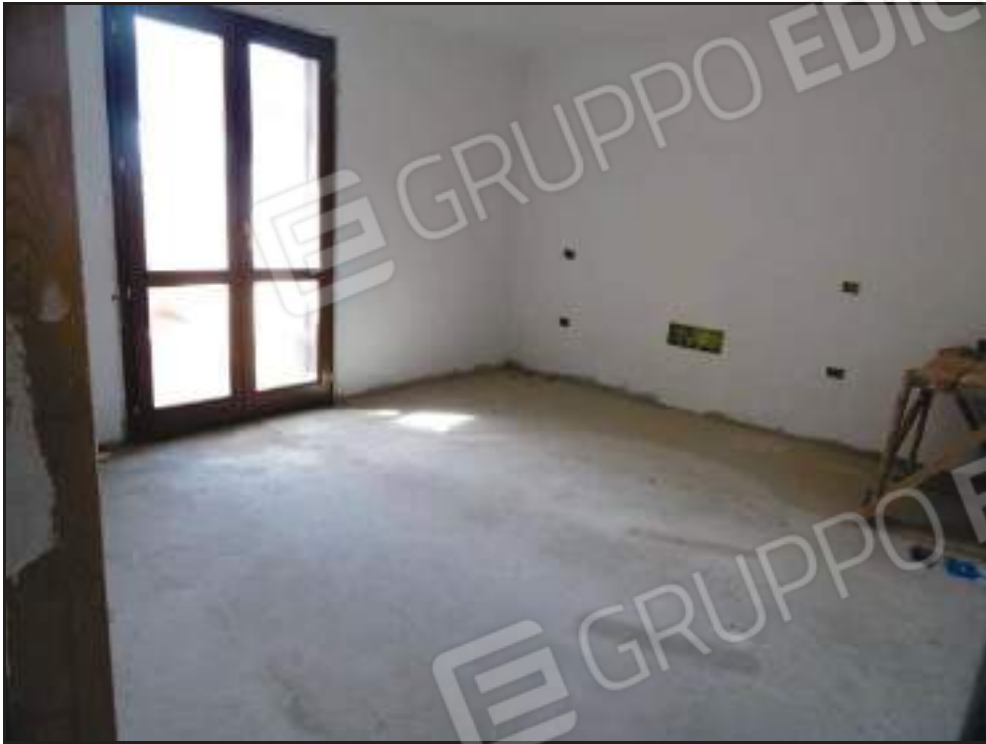
Vista della camera da letto padronale con affaccio ad est.