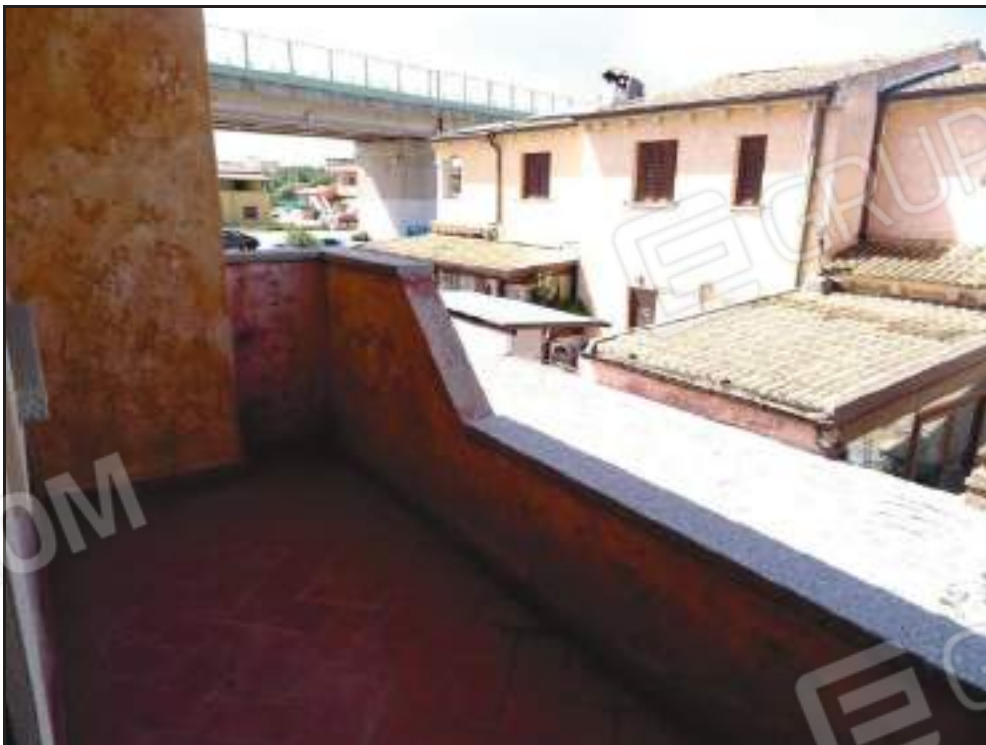
Vista della veranda coperta lato ovest con accesso dal soggiorno.