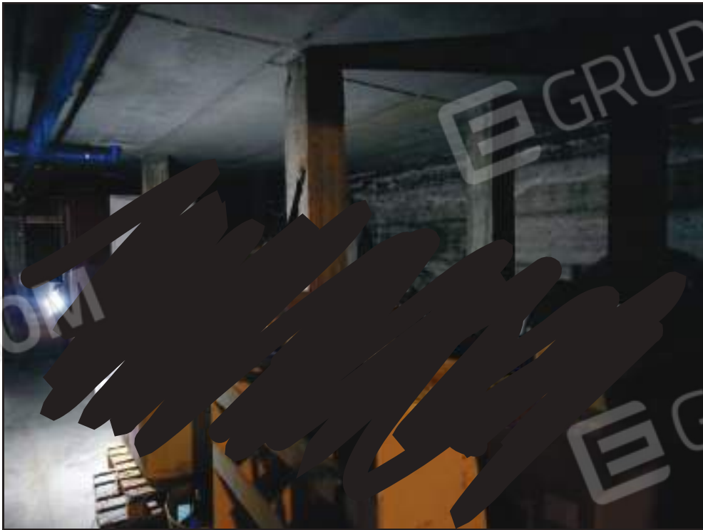
Vista dei locali subb. 22, 23