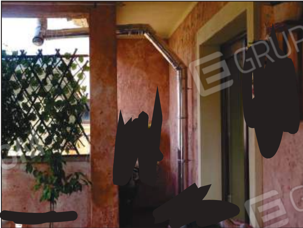
Vista sulla veranda coperta lato sud.