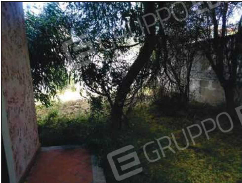
Vista sul giardino di pertinenza.