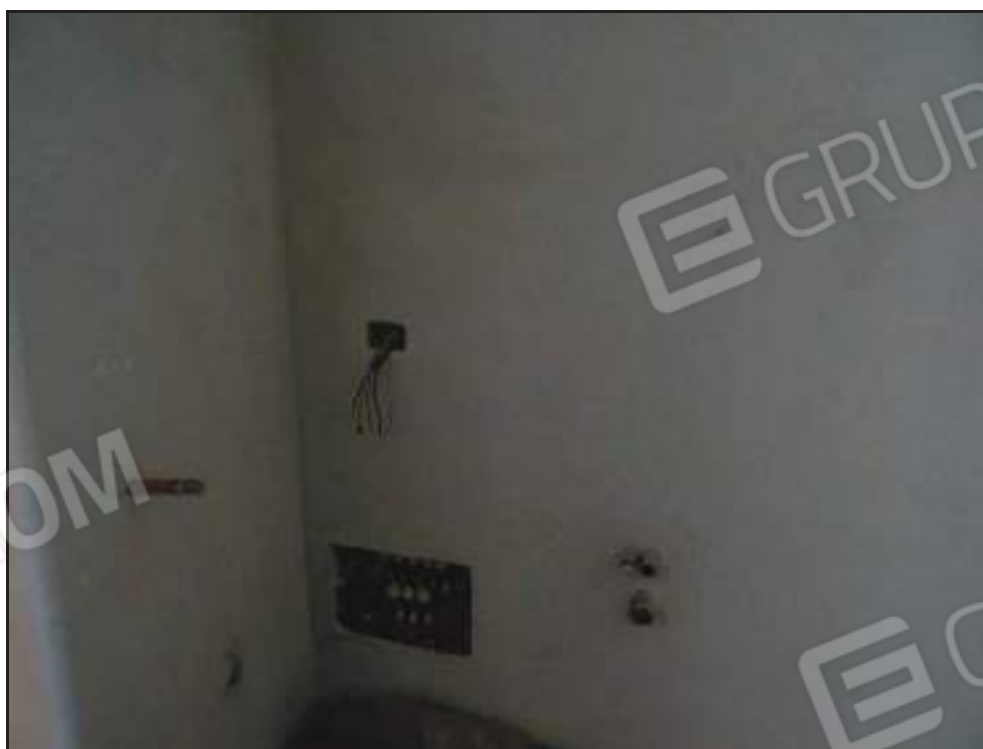
Particolare stato realizzazione impianti.