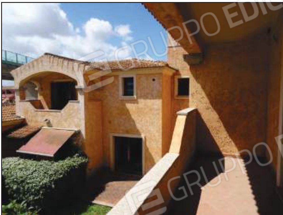
Vista sulla veranda coperta lato sud con accesso dal soggiorno.