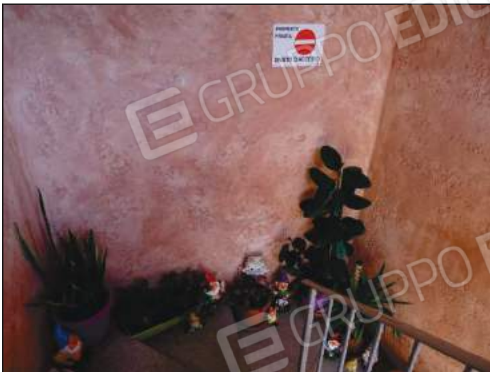
Ingresso dalle scale di pertinenza.