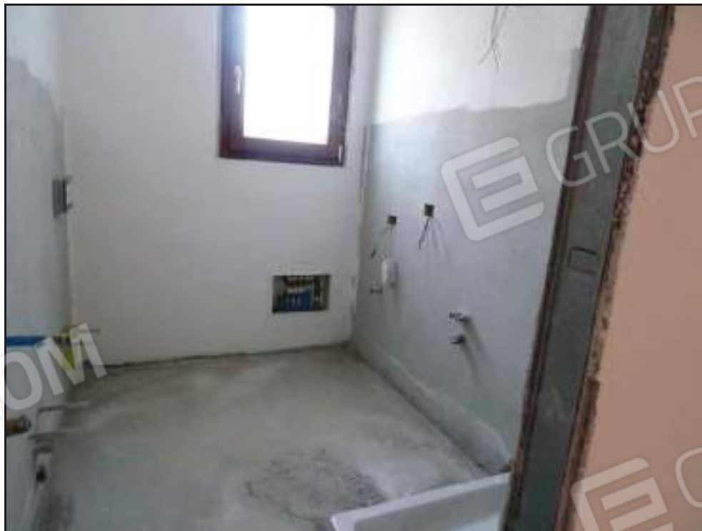
Vista ingresso al bagno lato ovest.