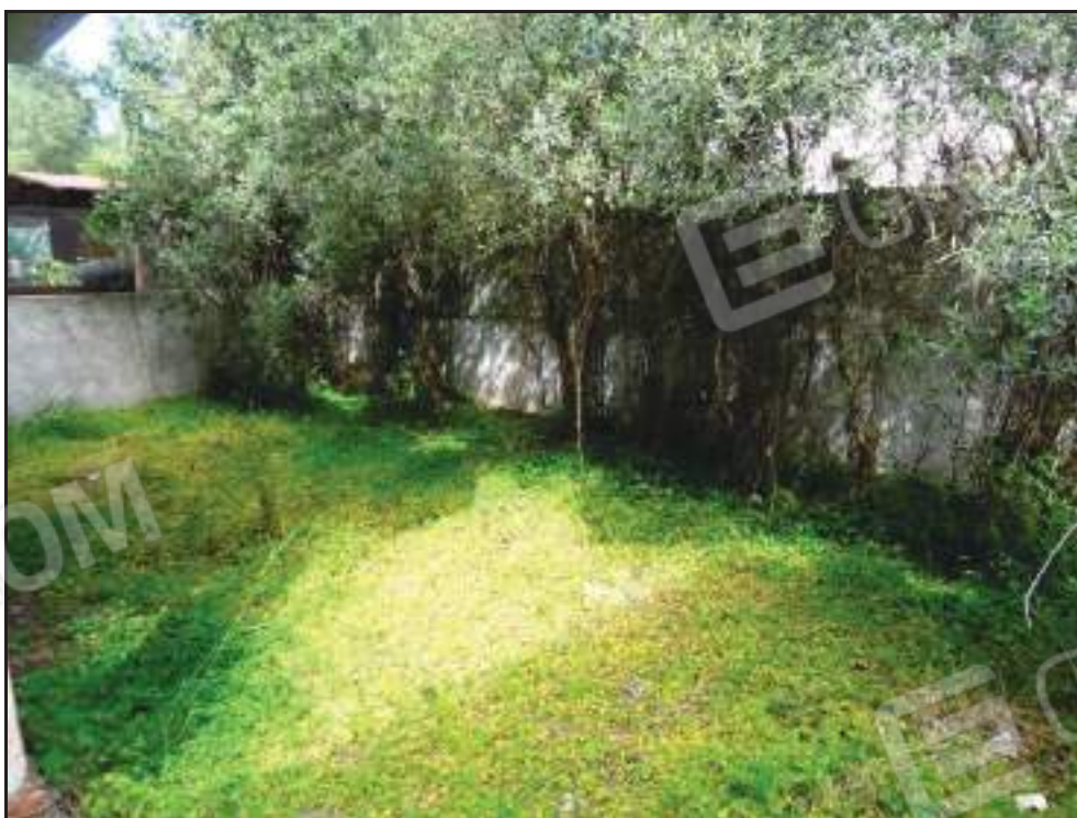
Vista sul giardino esposto a nord.