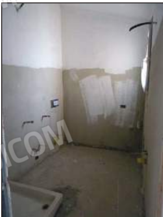
Vista ingresso al bagno lato ovest.