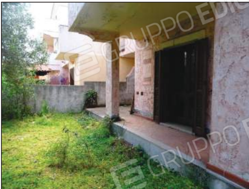
Vista dal giardino sulla veranda con accesso alla camera padronale.