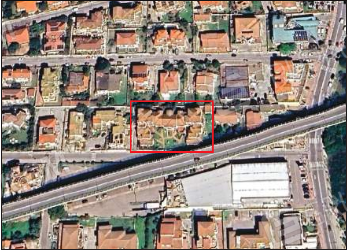
Aerofoto di Olbia con individuazione dell'immobile.