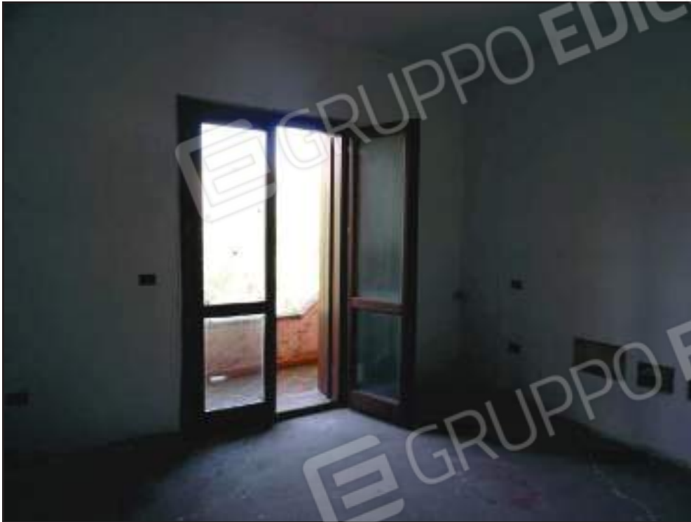
Vista camera da letto padronale con accesso alla veranda lato nord.