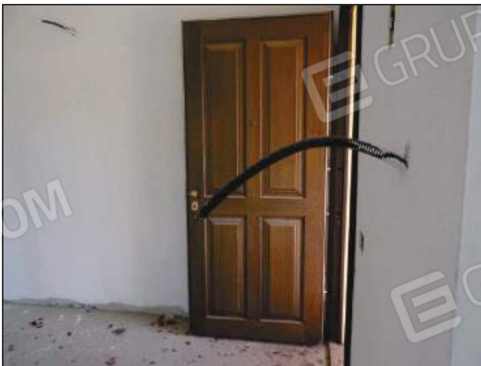
Vista dell'ingresso sul soggiorno.