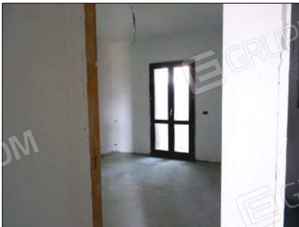
Vista dell'ingresso alle camere sul lato nord.