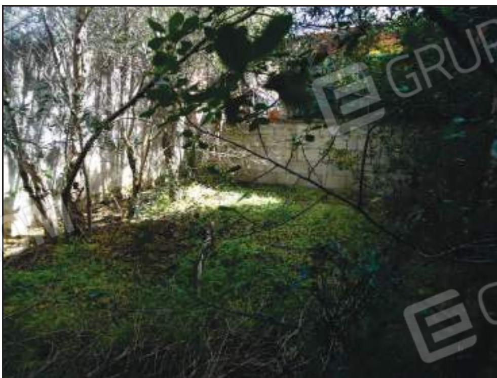
Vista sul giardino di pertinenza.