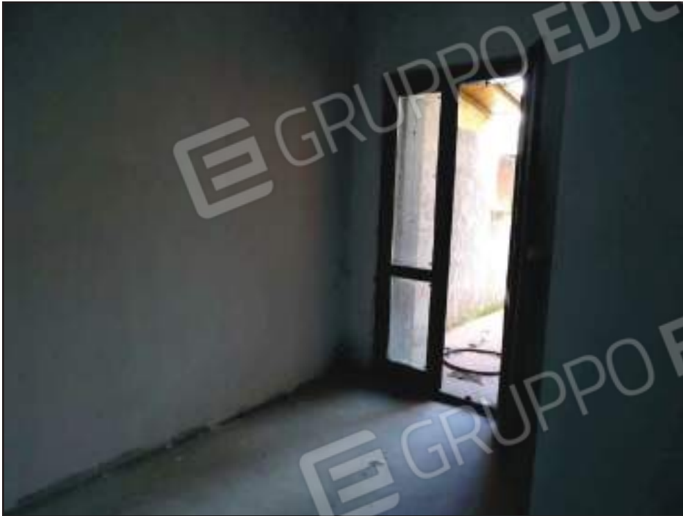
Vista camera da letto singola con accesso al giardino.