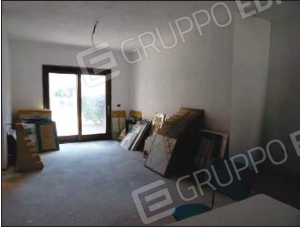
Vista del soggiorno con affaccio alla pertinenza lato est.