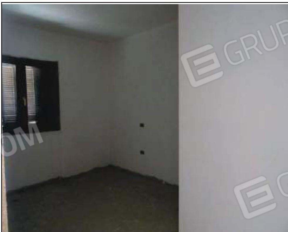
Vista della camera da letto singola con affaccio ad ovest.