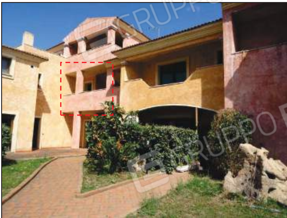
Vista del Sub. 5 dall'area condominiale.