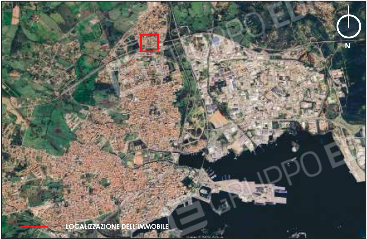
Aerofoto di Olbia con ubicazione degli immobili oggetto di perizia.