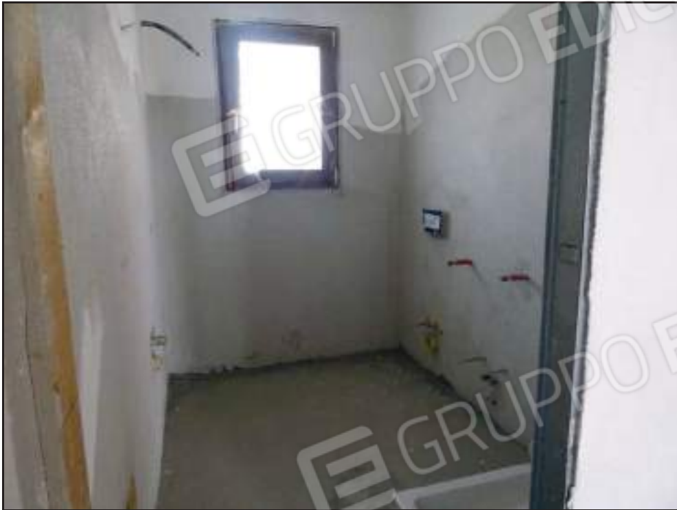
Vista ingresso al bagno.