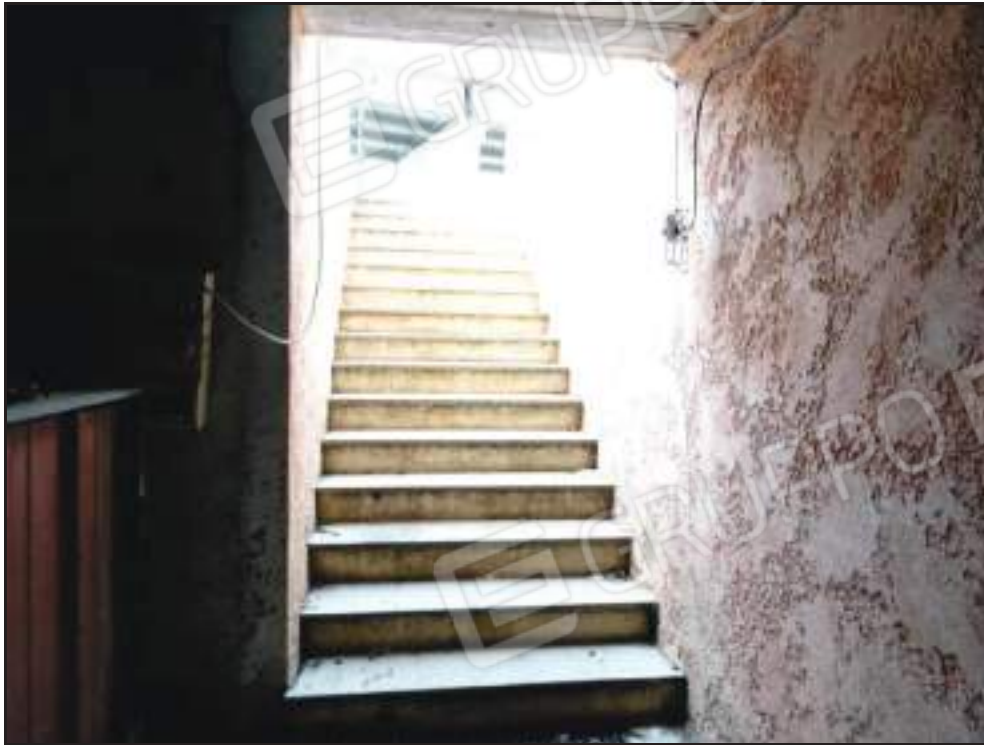
Vista della scala di accesso al piano interrato.

Documentazione fotografica Sub. 21-22-23-28