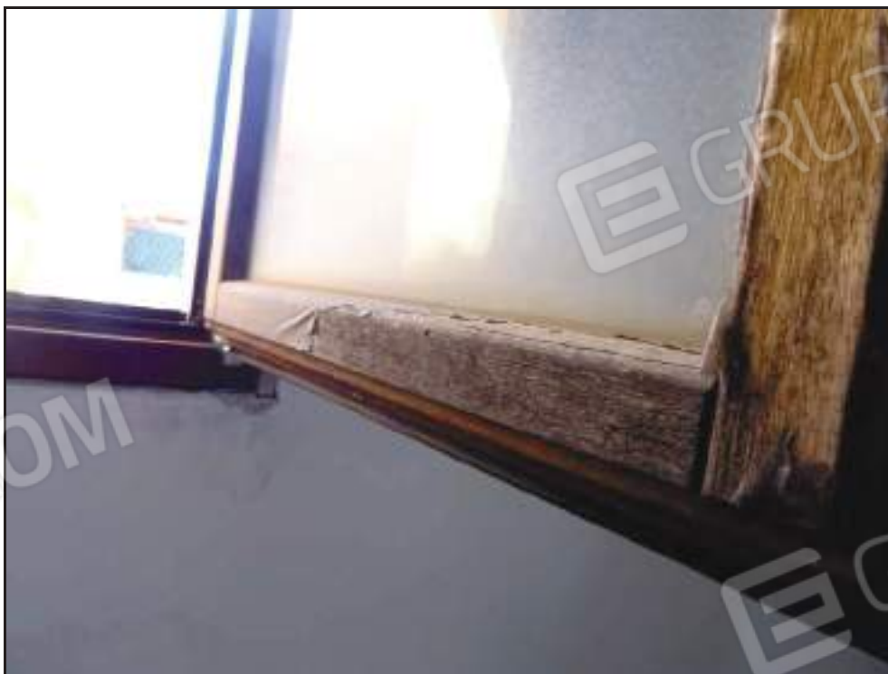
Particolare deterioramento infissi esterni più esposti.