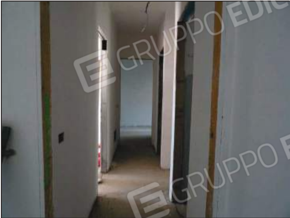
Vista del disimpegno con ingressi a camere e bagni.