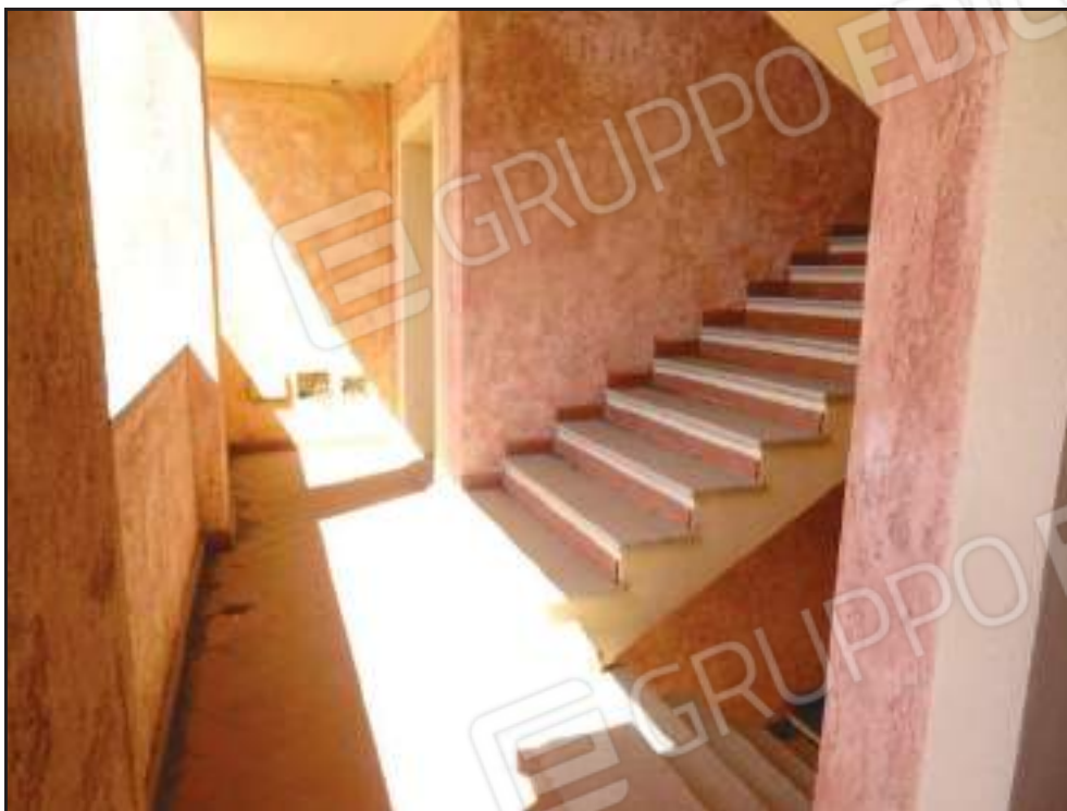
Vista del corpo scala condominiale dal pianerottolo di pertinenza.