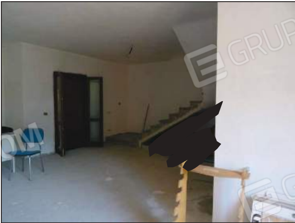
Vista del soggiorno con scala di accesso al piano primo.