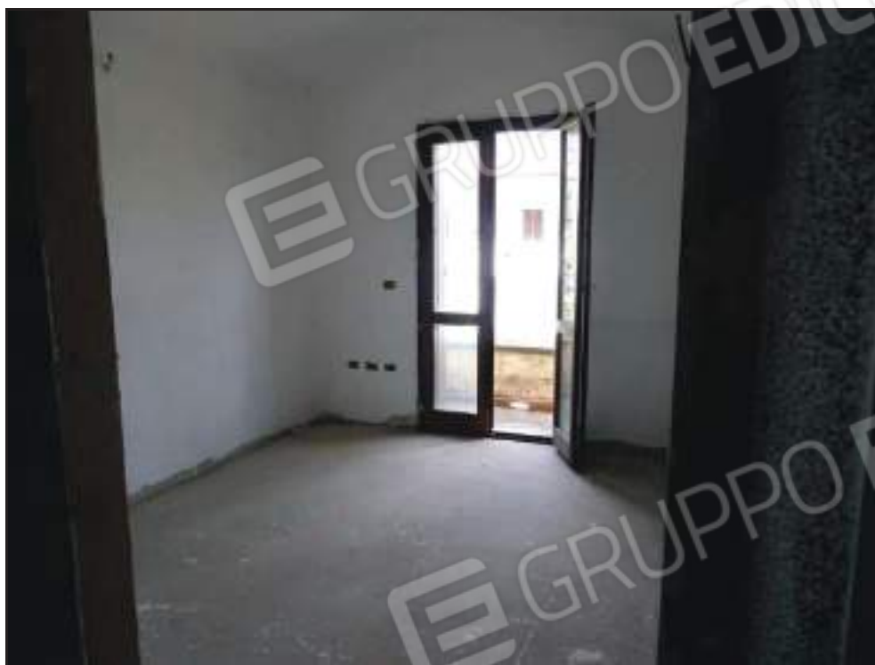
Vista della camera da letto singola con accesso al balcone lato nord.