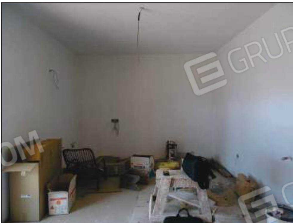
Vista del soggiorno e zona cottura.