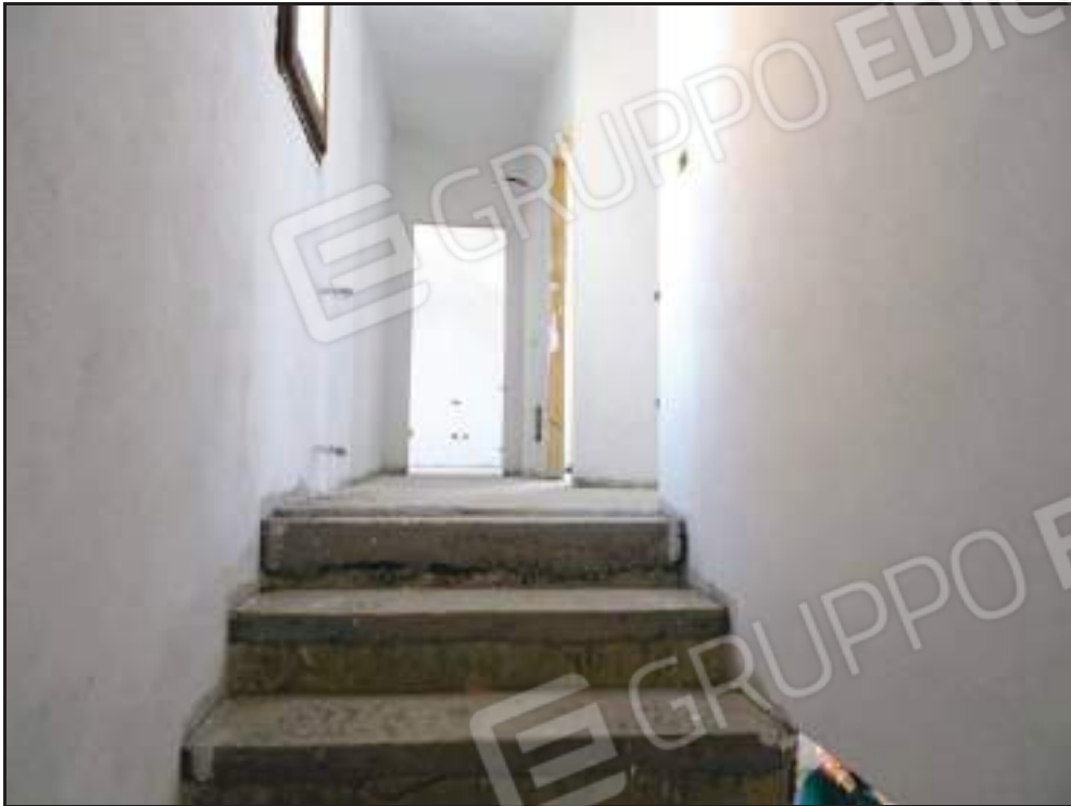
Vista del disimpegno dalla scala di accesso al piano primo.