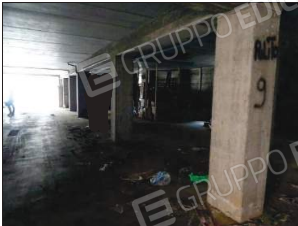
Vista sul garage.