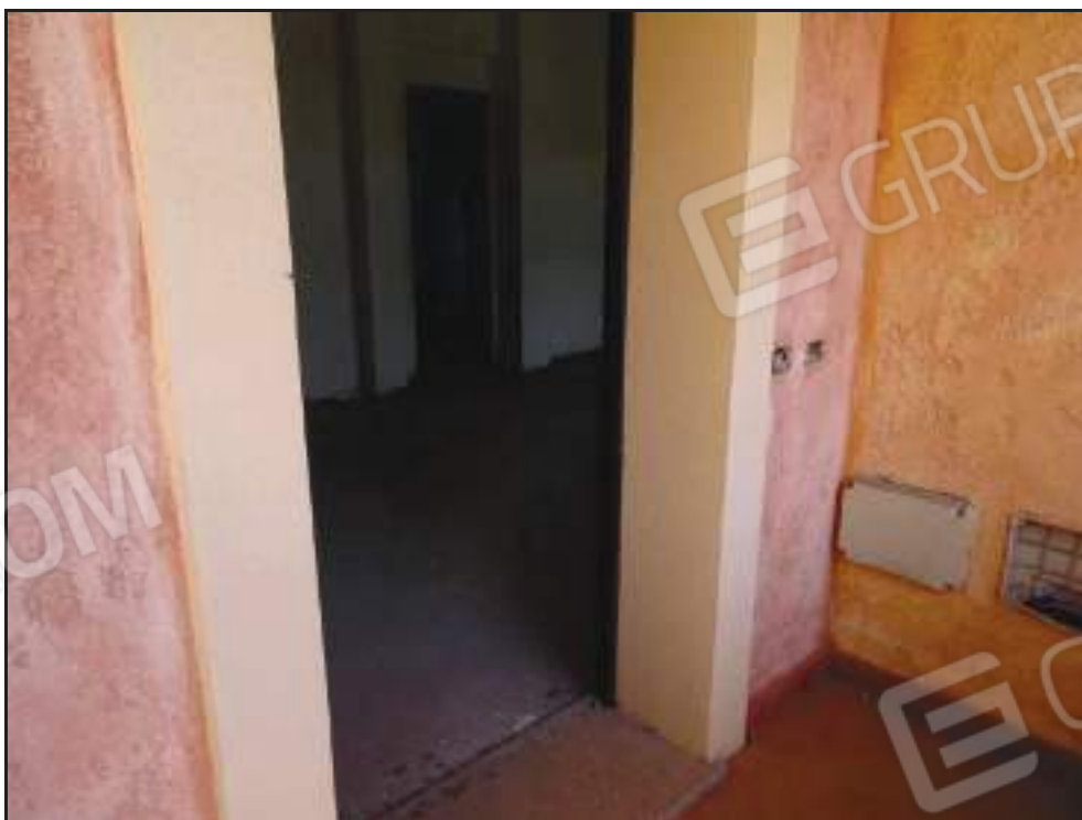
Vista del portoncino di ingresso dal pianerottolo di pertinenza.