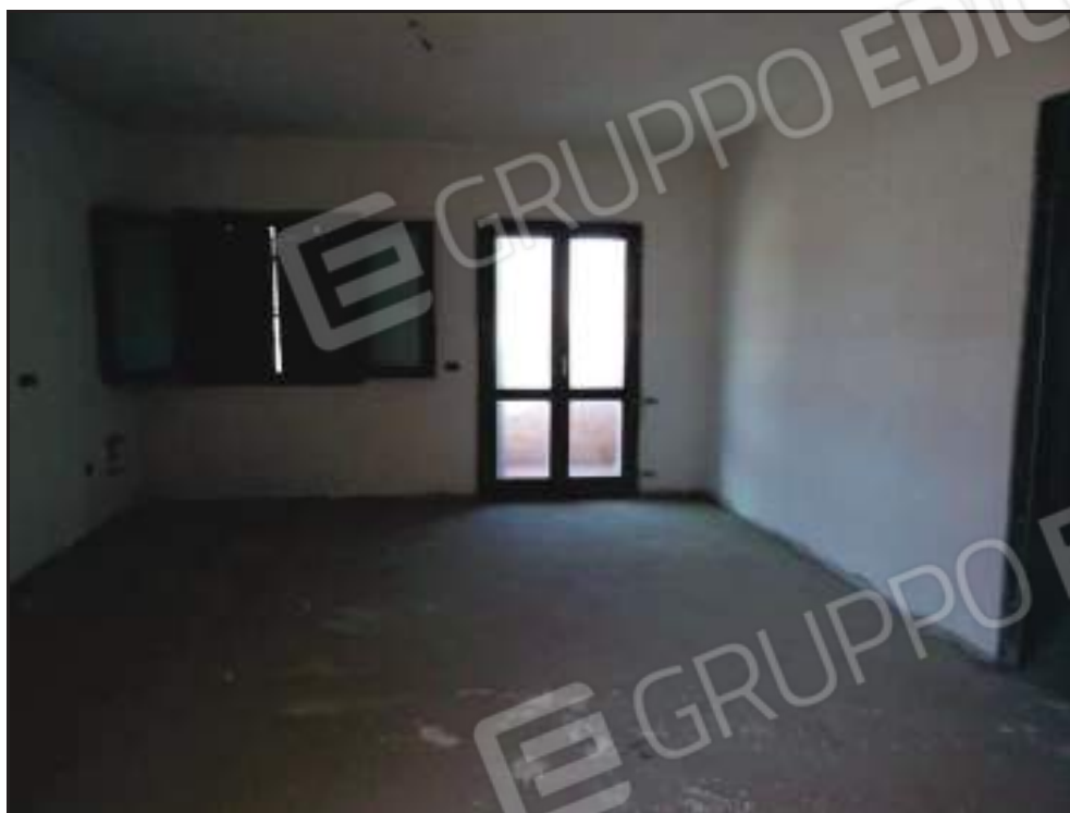
Vista del soggiorno con accesso alla veranda lato ovest.