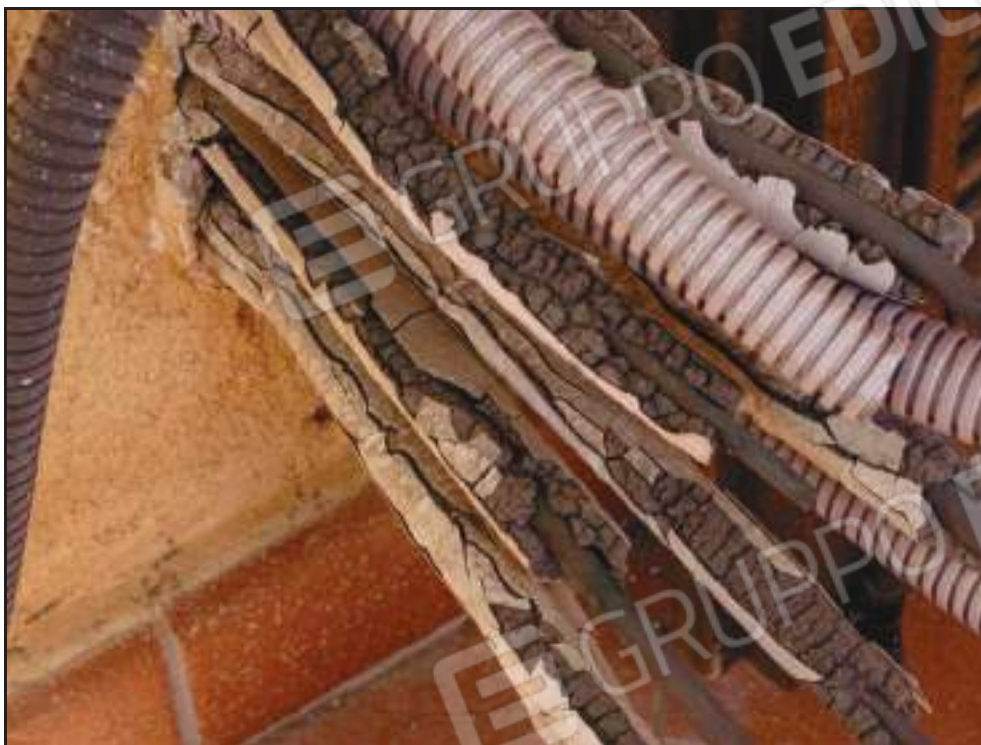
Particolare deterioramento di tubazioni impianto di condizionamento.