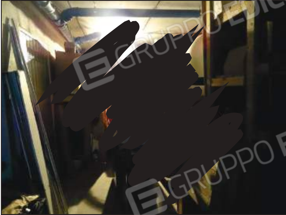
Vista dei locali subb. 22, 23 e porta accesso al sub. 21.