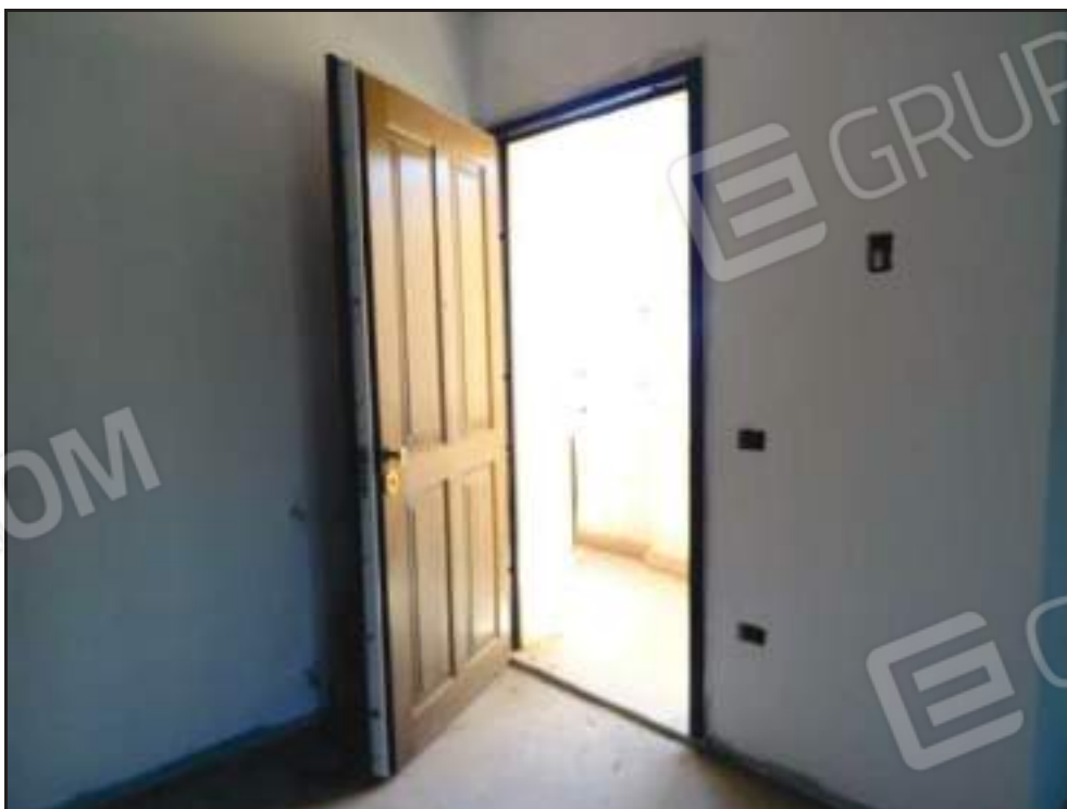
Vista dell'ingresso sul soggiorno.