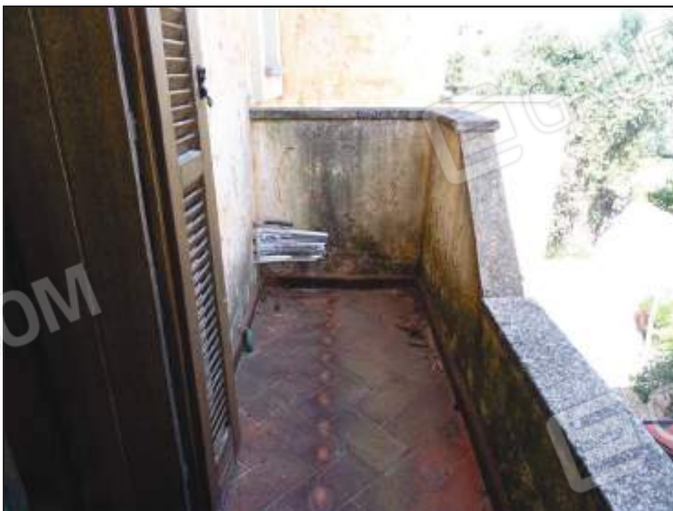
Stato di degrado nel balcone annesso alla camera padronale.