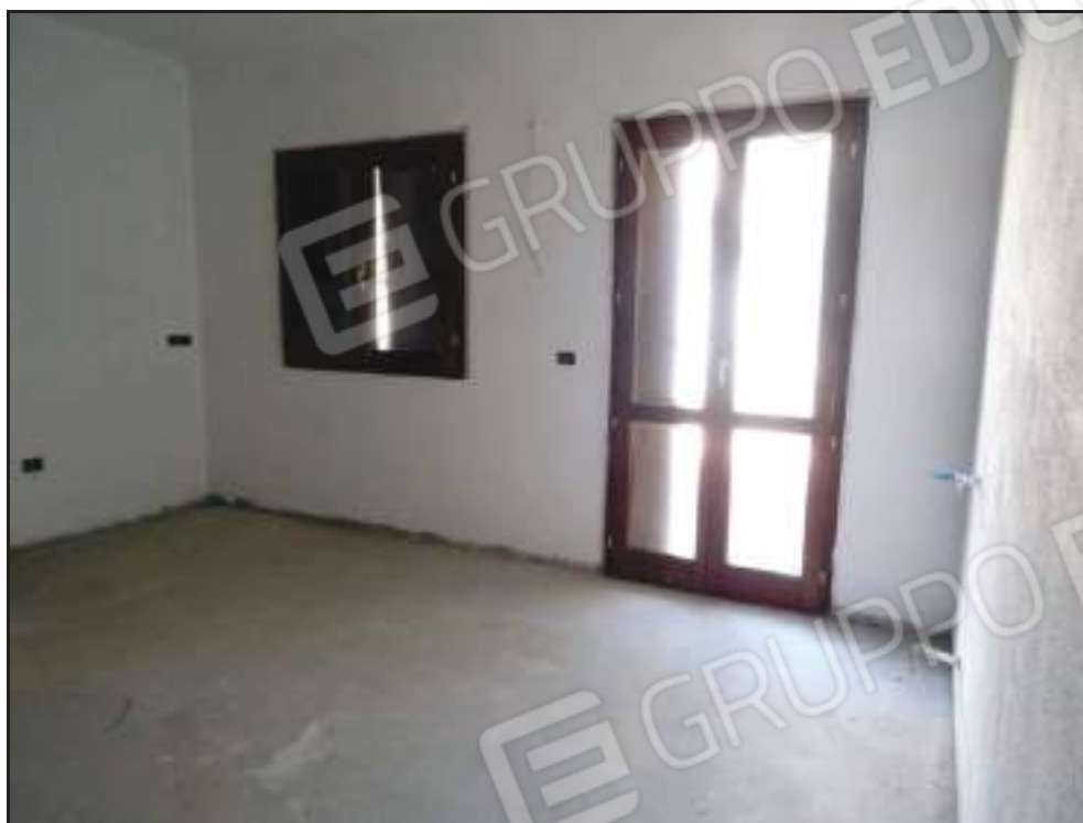
Vista del soggiorno con porta di accesso alla zona notte.