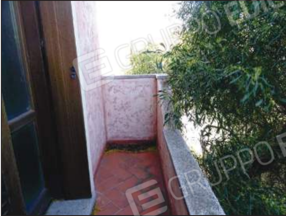
Vista del balcone lato nord annesso alla camera singola