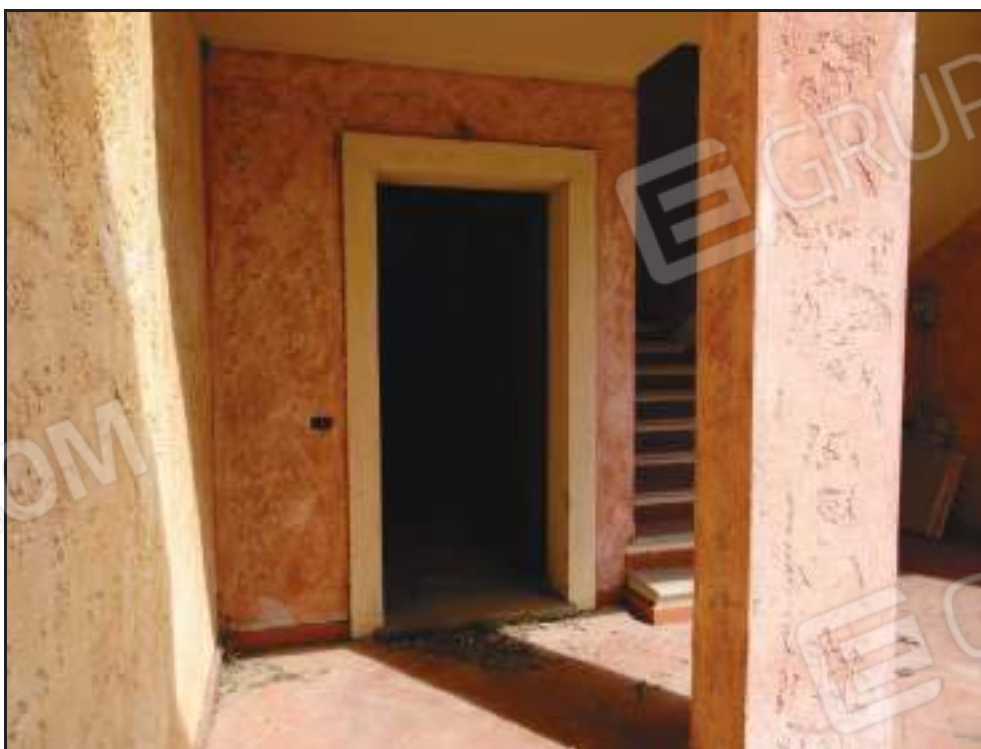
Vista del portoncino di ingresso dall'area di pertinenza.