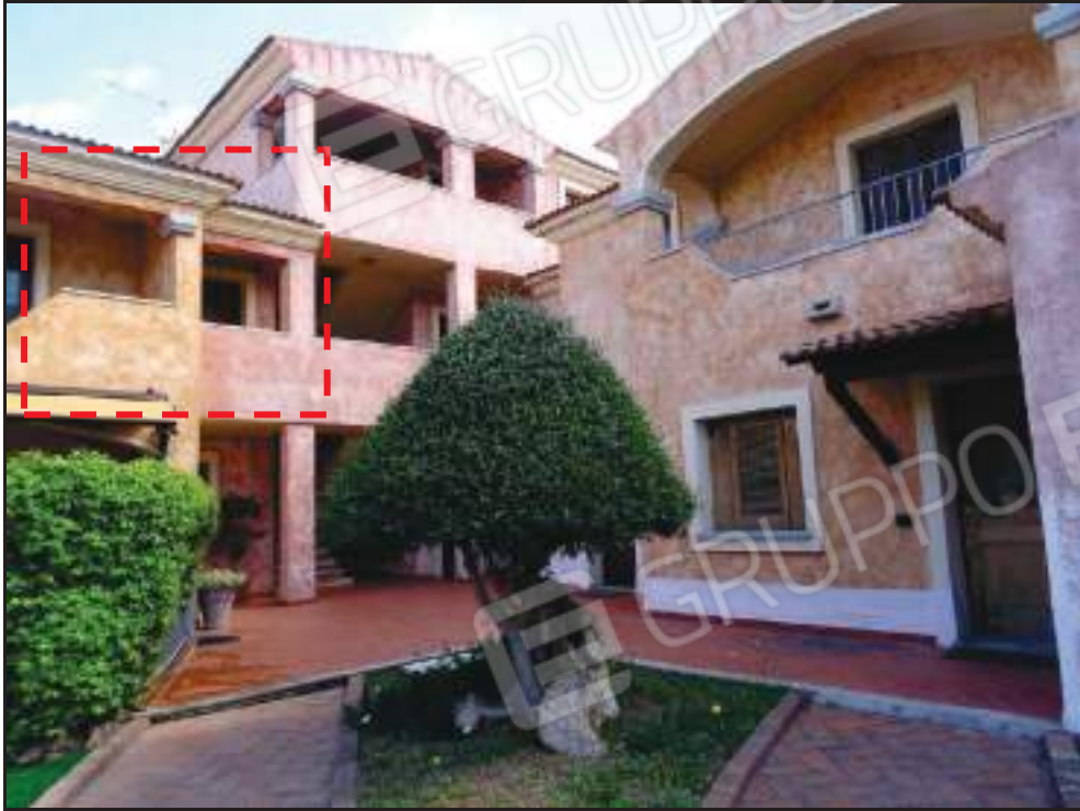
Vista del sub. 13 dall'area condominiale.