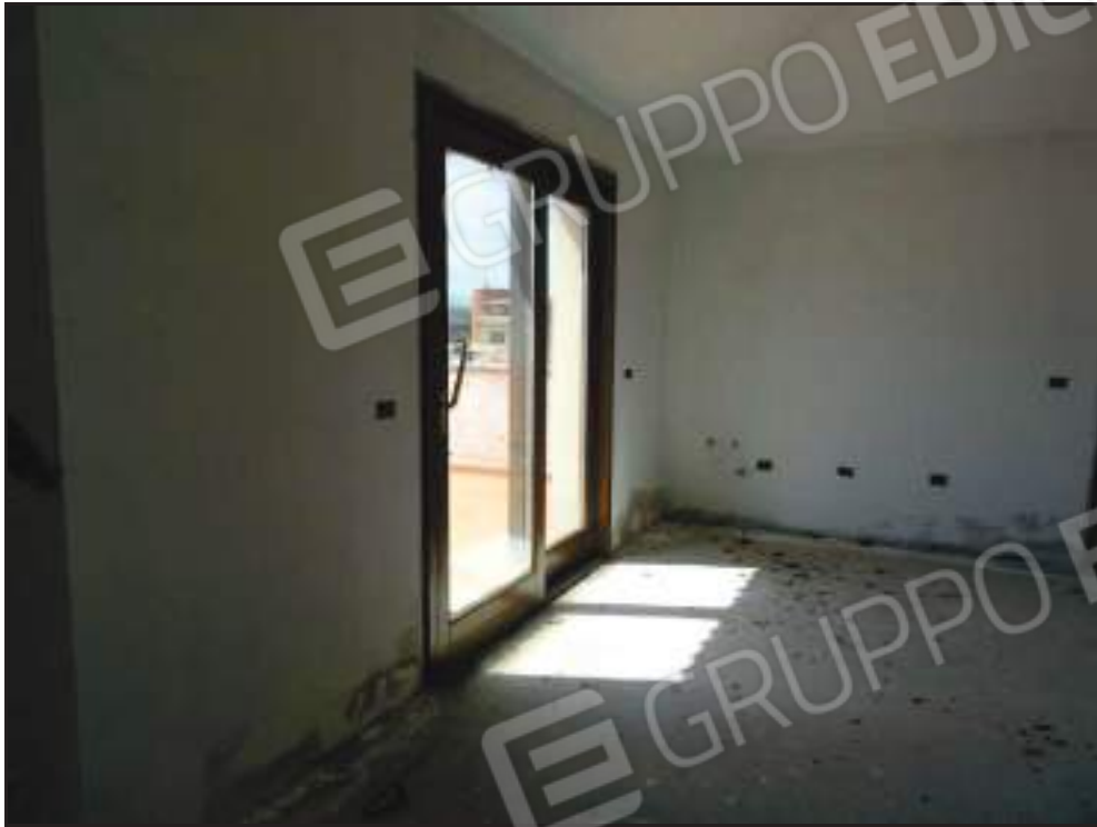
Vista del soggiorno con accesso alla terrazza.