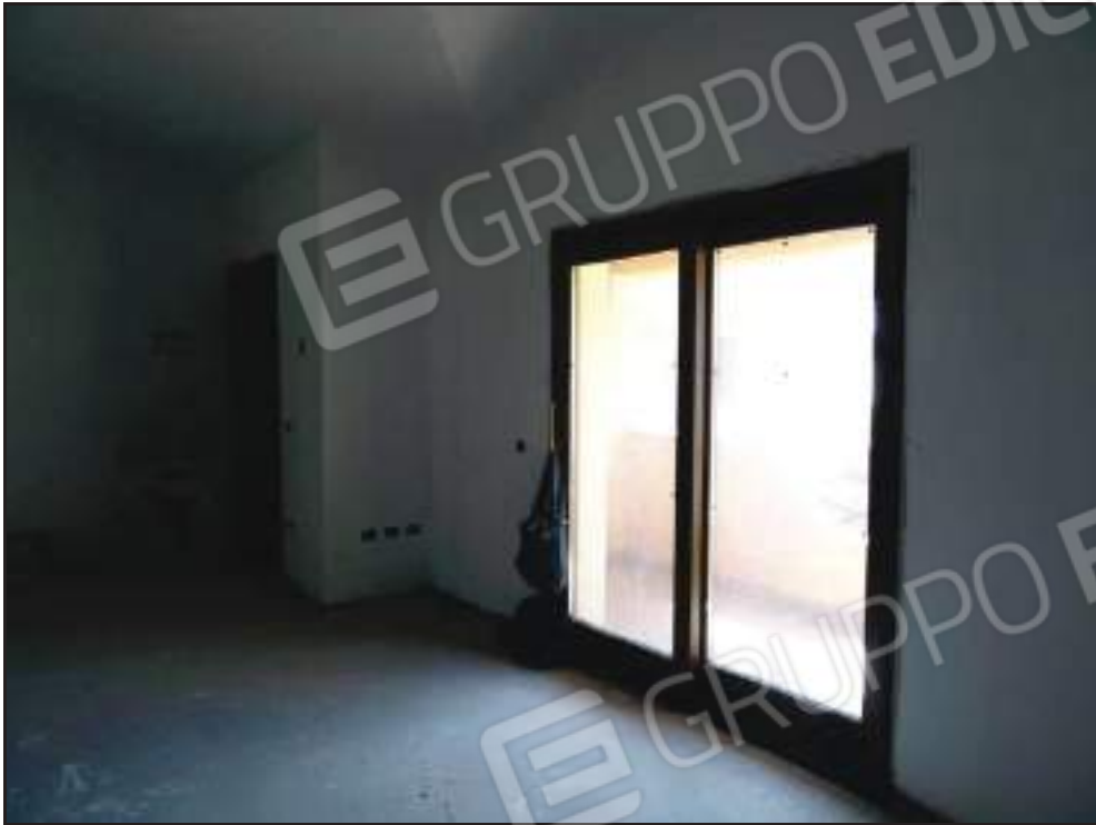
Vista del soggiorno con accesso alla veranda coperta lato sud.