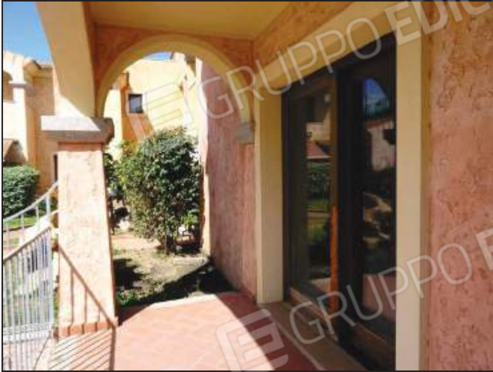
Vista della veranda coperta lato sud.