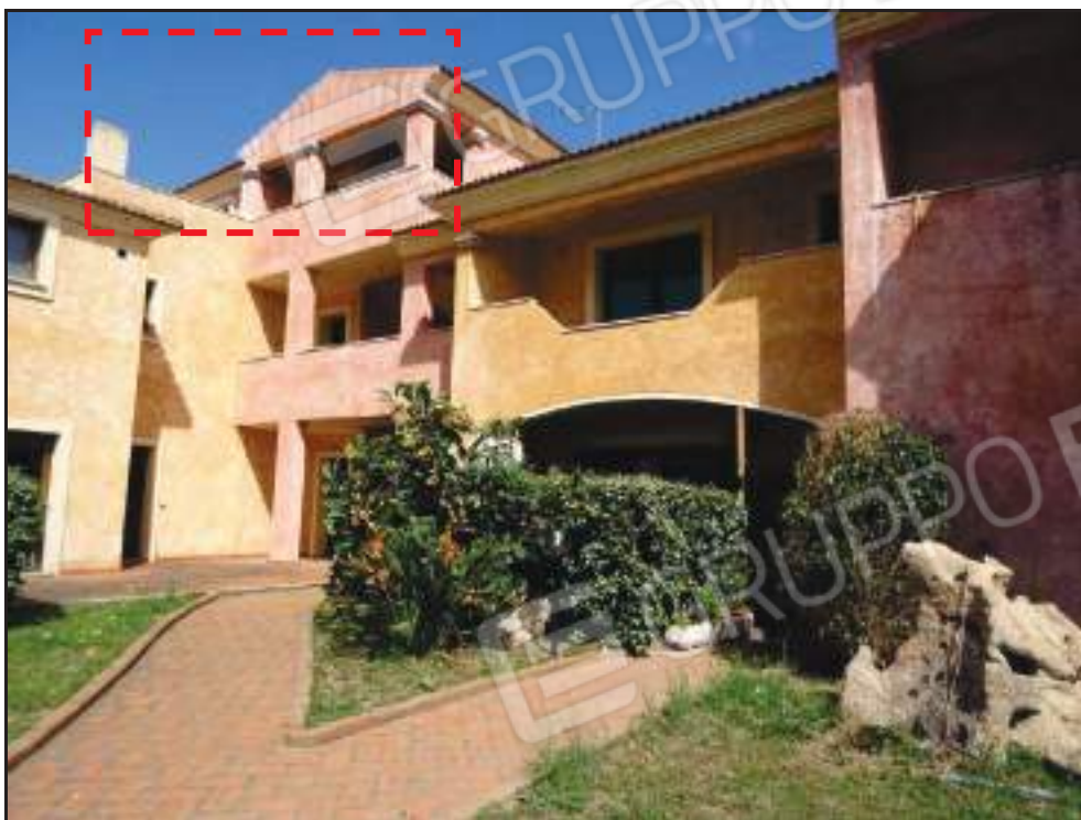
Vista del Sub. 15 dall'area condominiale.