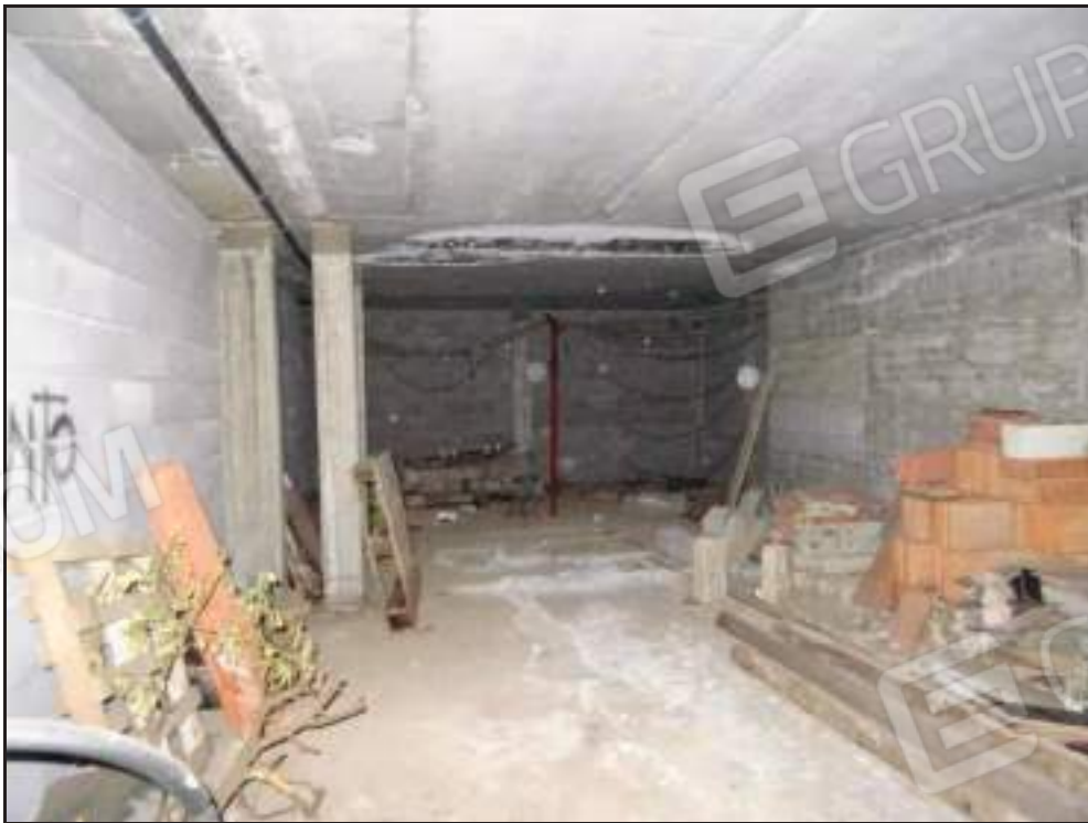
Particolare infiltrazioni nel locale sub 28.