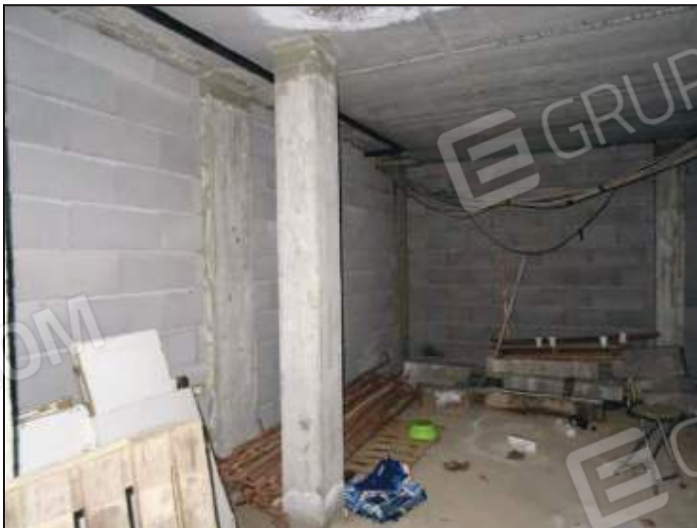
Vista del locale sub 28.