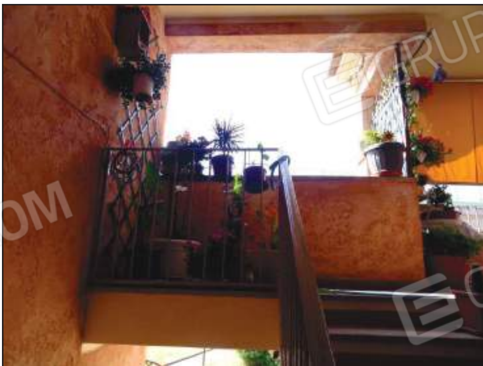
Vista della veranda coperta dalle scale di pertinenza.