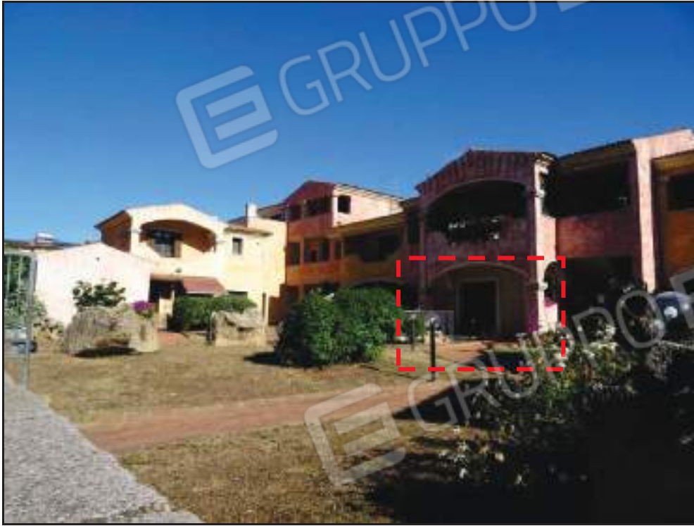
Vista del sub. 5 dall'area condominiale.