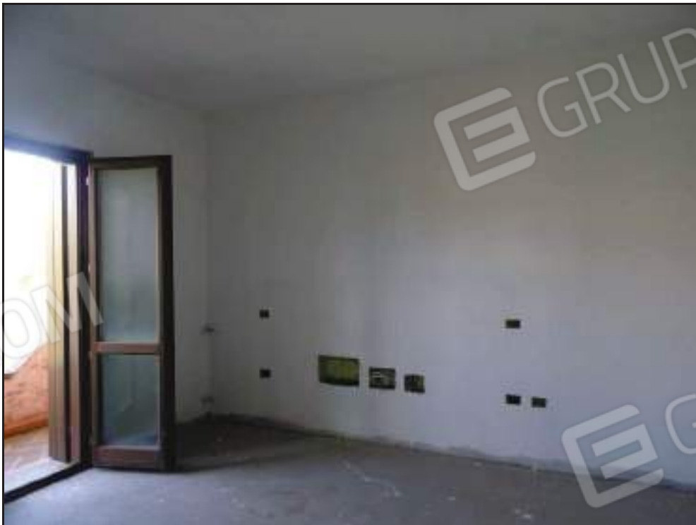
Vista camera da letto padronale.