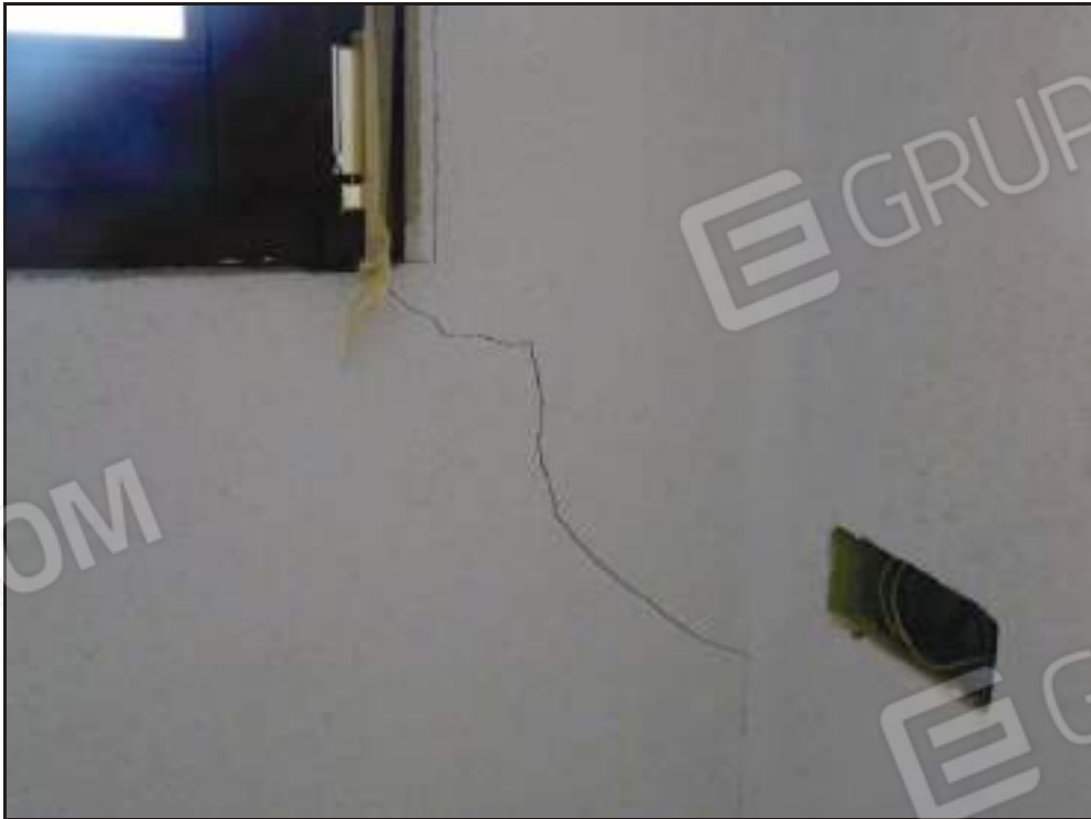
Particolare crepa di assestamento parete soggiorno.