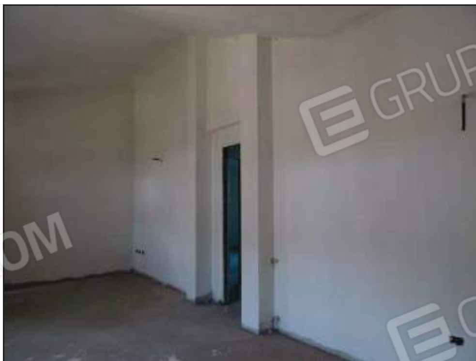
Vista del soggiorno con accesso alla zona notte.