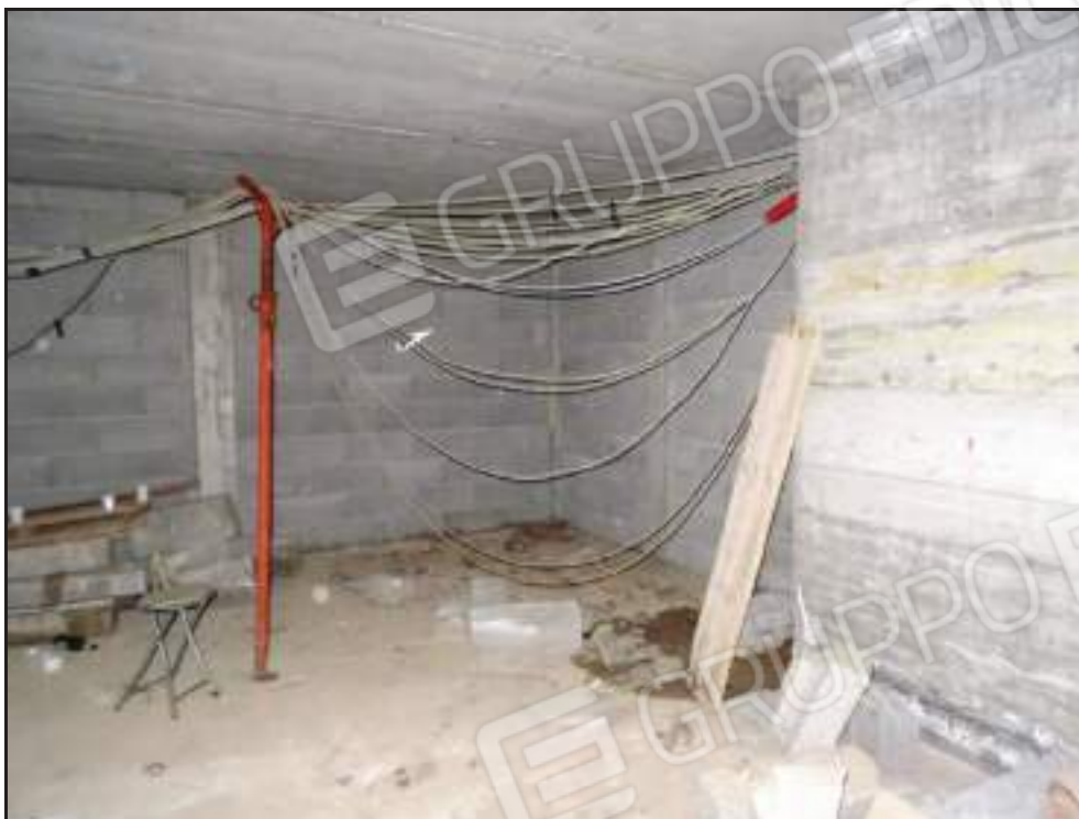
Vista del locale sub 28.