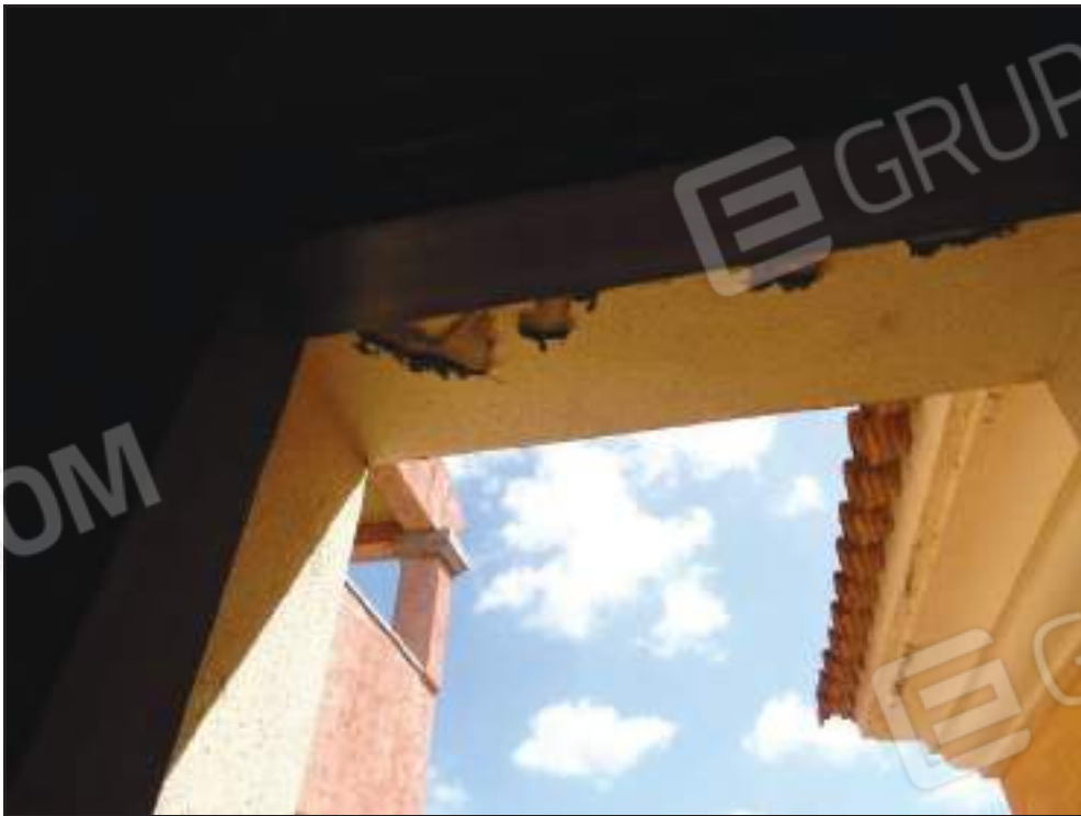
Particolare esfoliazione architrave finestra nel disimpegno al piano primo.