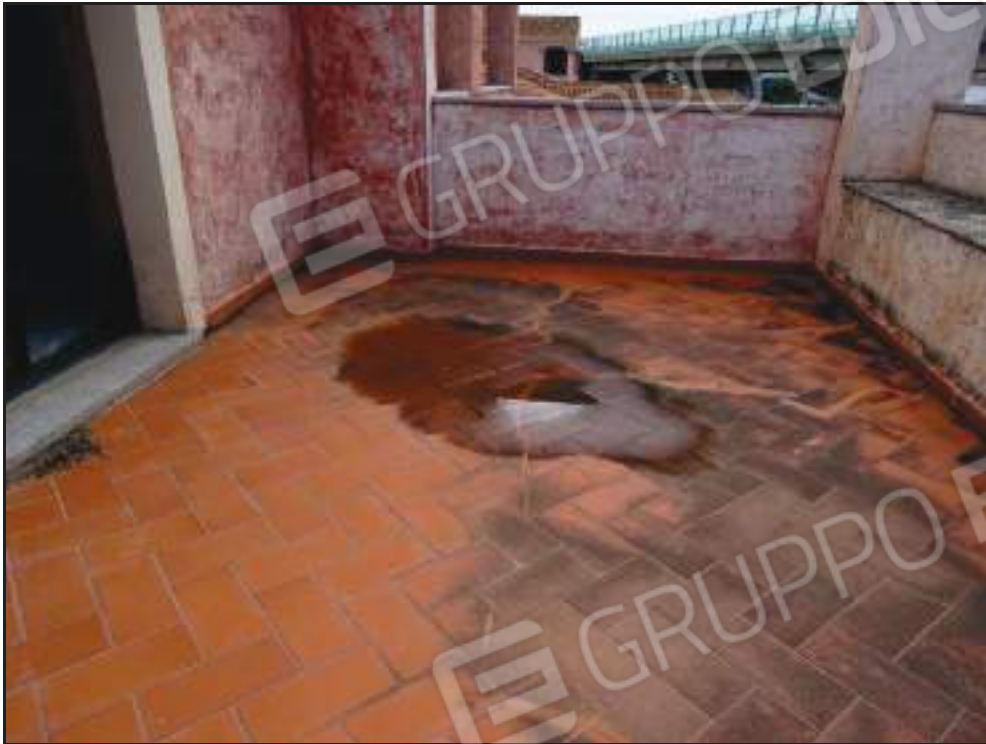
Ristagno acque piovane nel pavimento della terrazza rivolta a sud.