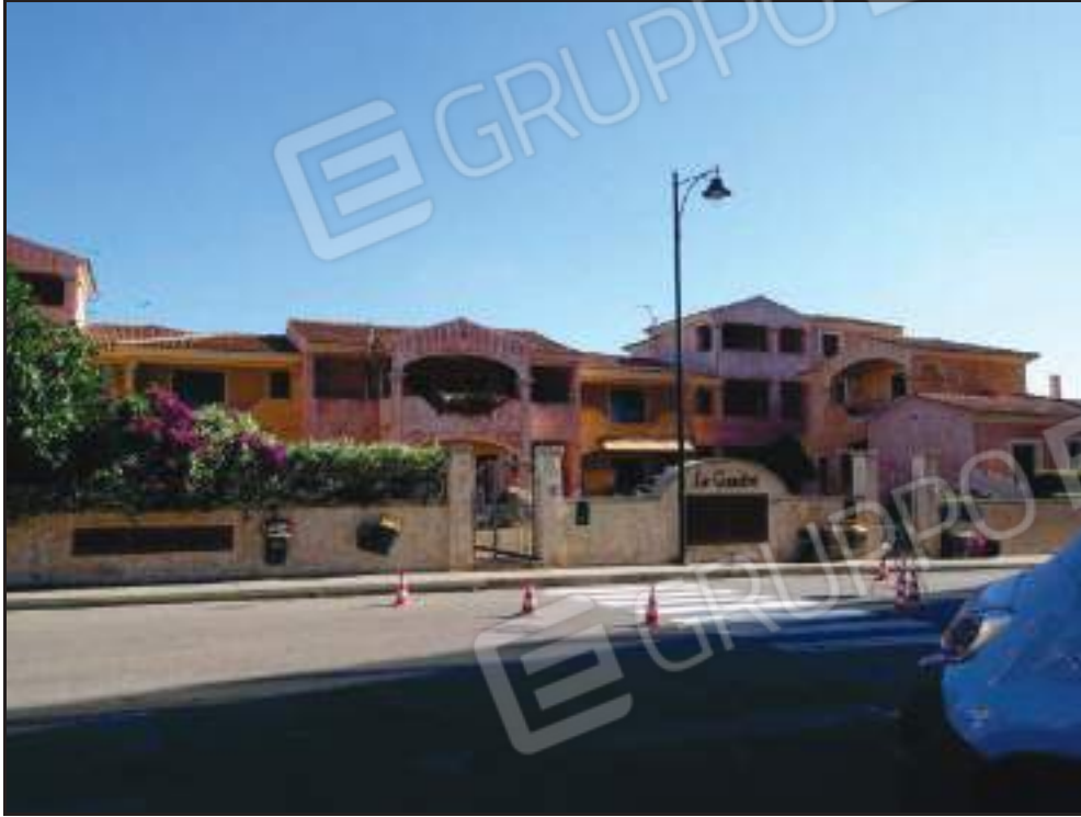
Vista dei cancelletti di accesso alla proprietà e facciata principale su via Strasburgo.