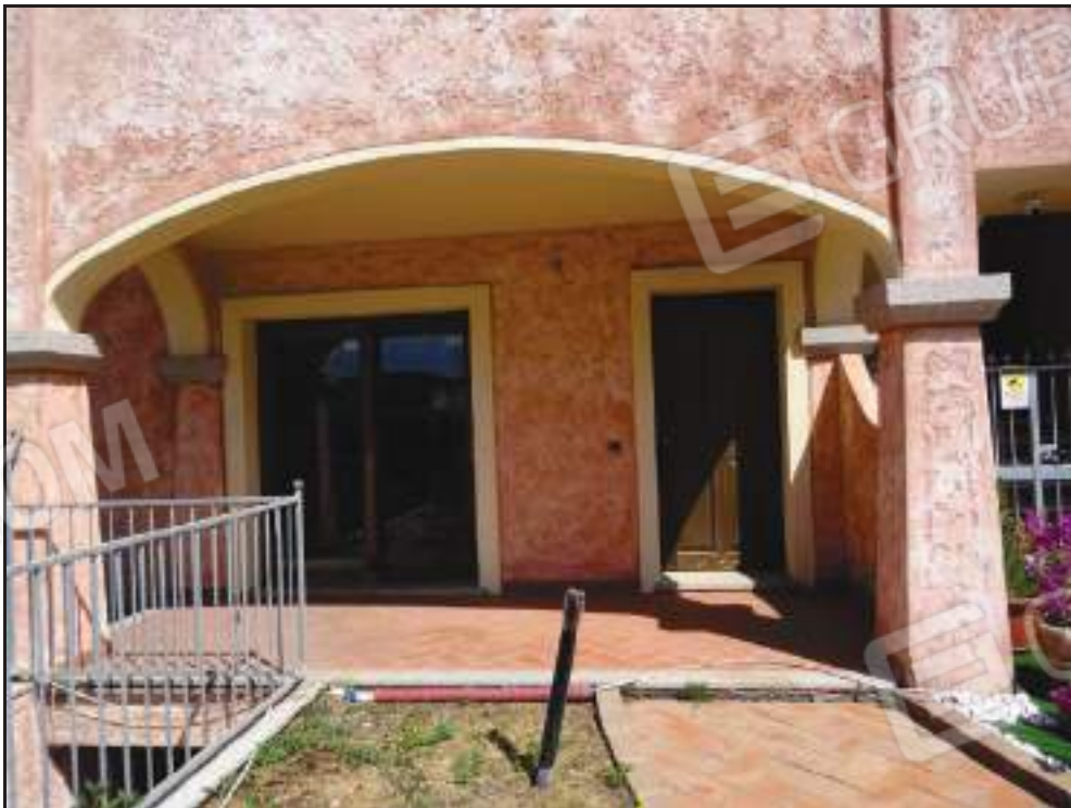
Vista del portoncino di ingresso alla proprietà.