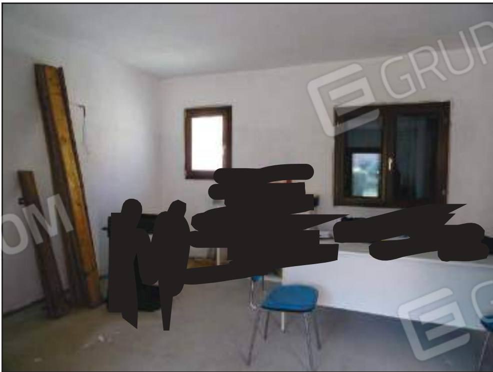
Vista del soggiorno e zona cottura al piano terra.