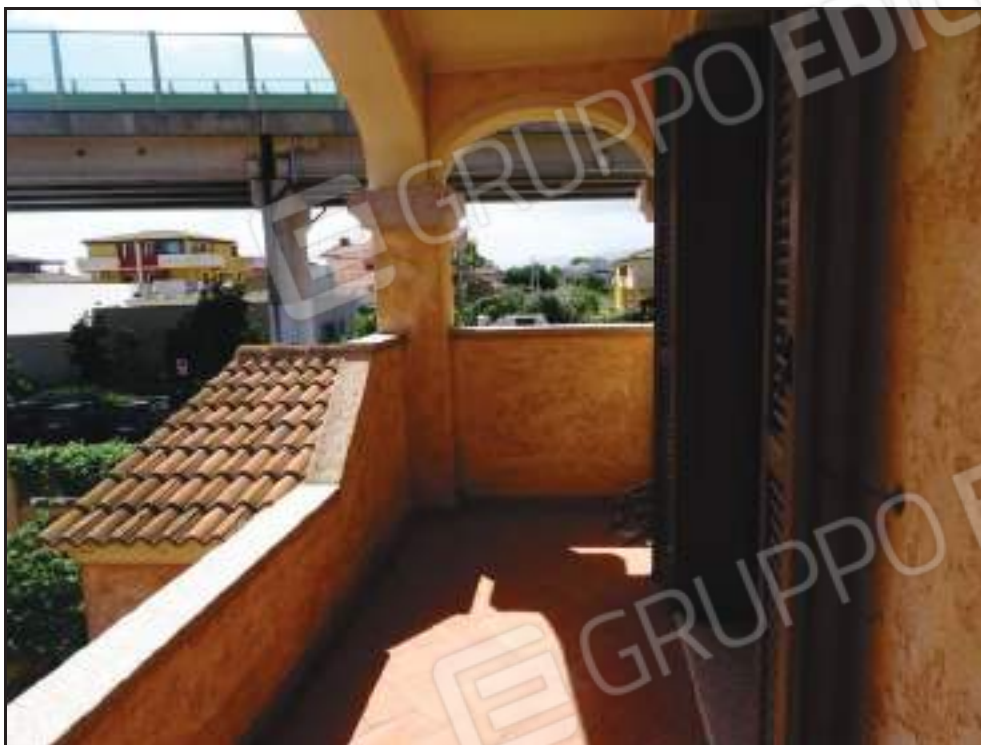
Vista sulla veranda coperta annessa alla camera padronale.