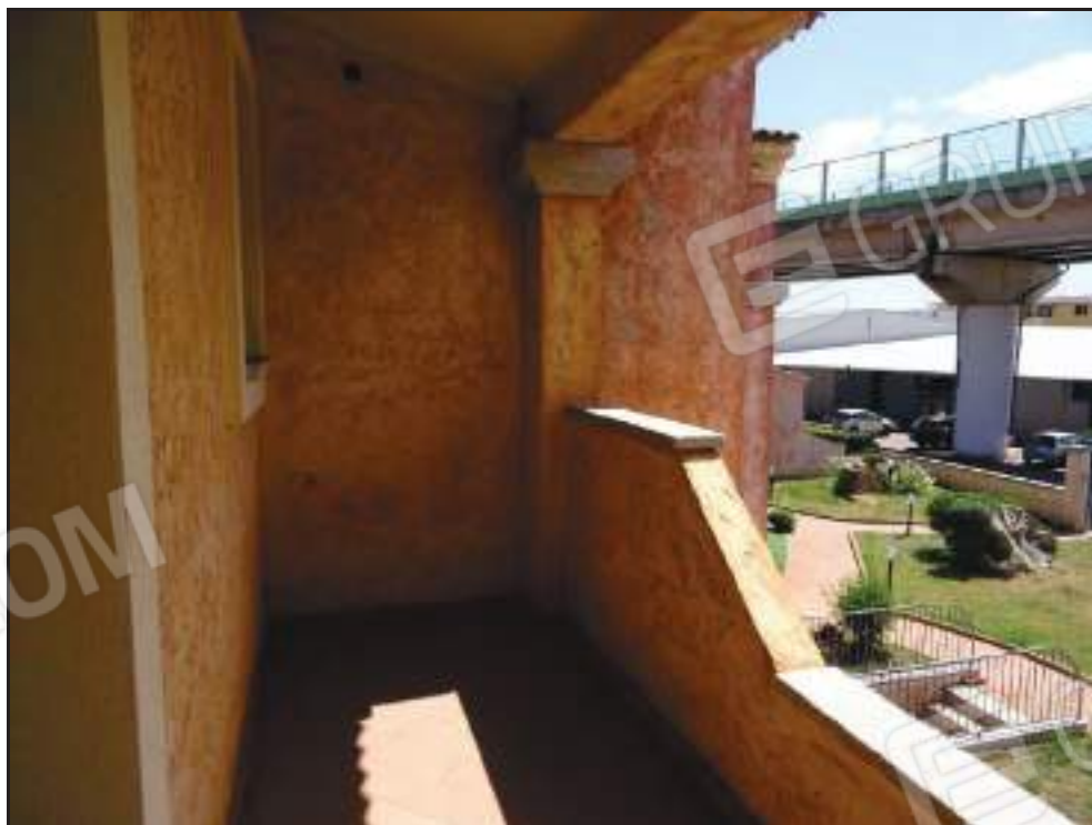
Vista sulla veranda coperta lato sud con accesso dal soggiorno.