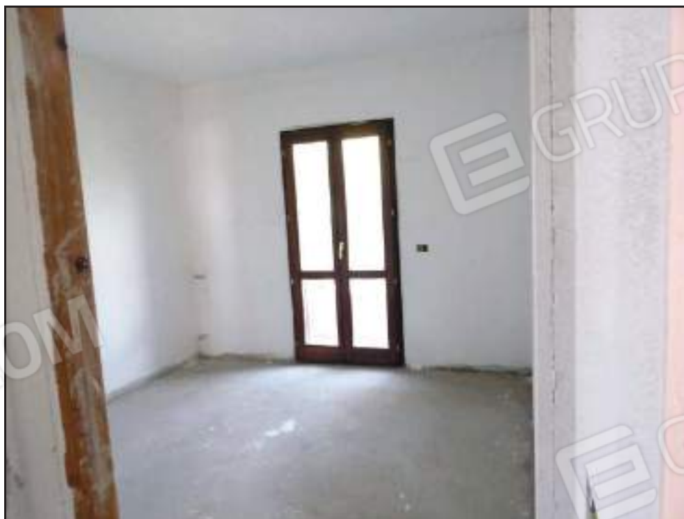
Vista ingresso alla camera da letto singola.