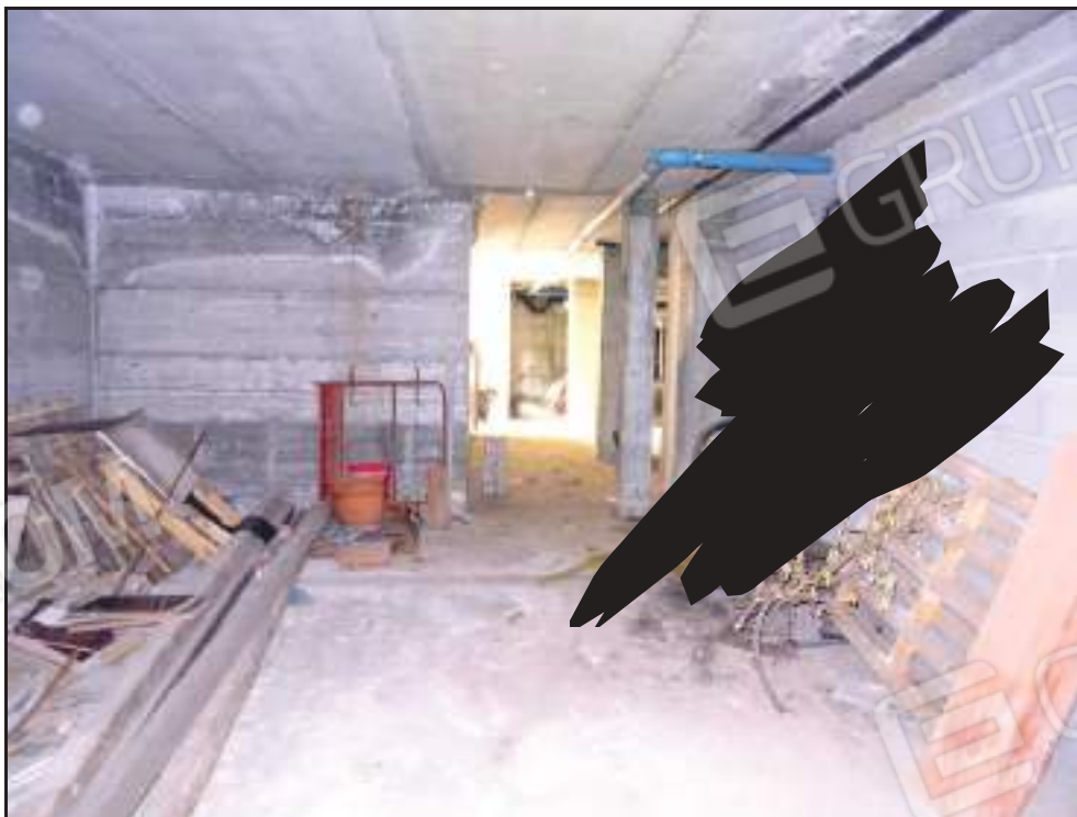
Vista del locale sub 28.