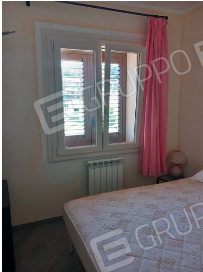
Foto 6 Ambienti della zona notte .