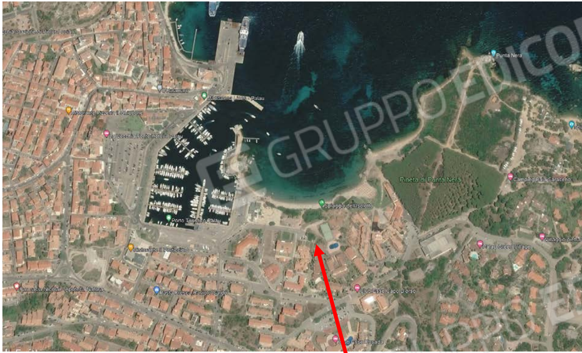
Foto 1 - Ubicazione dell' immobile nel contesto urbano di Palau