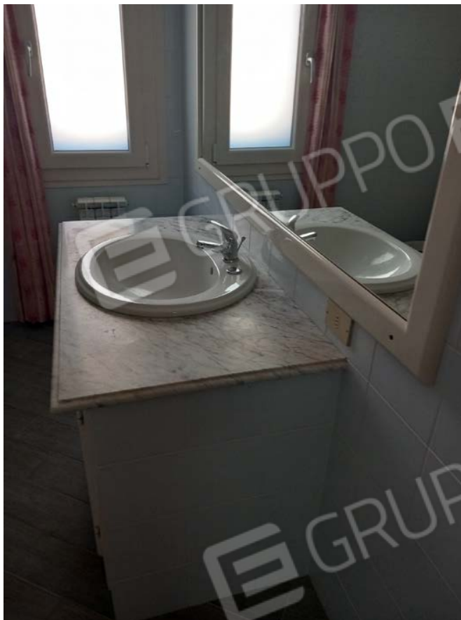
Foto 8 Ambienti della zona notte.