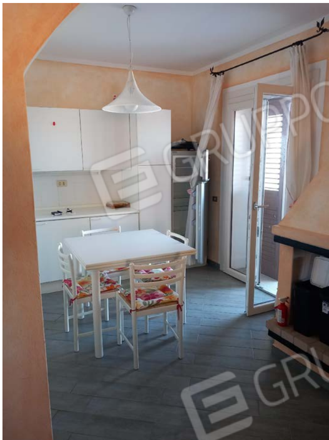
Foto 5 Zona Giorno Cucina .