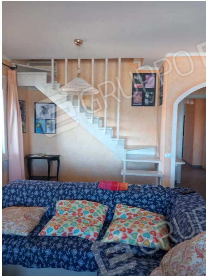
Foto 10 Accesso al piano sottotetto .