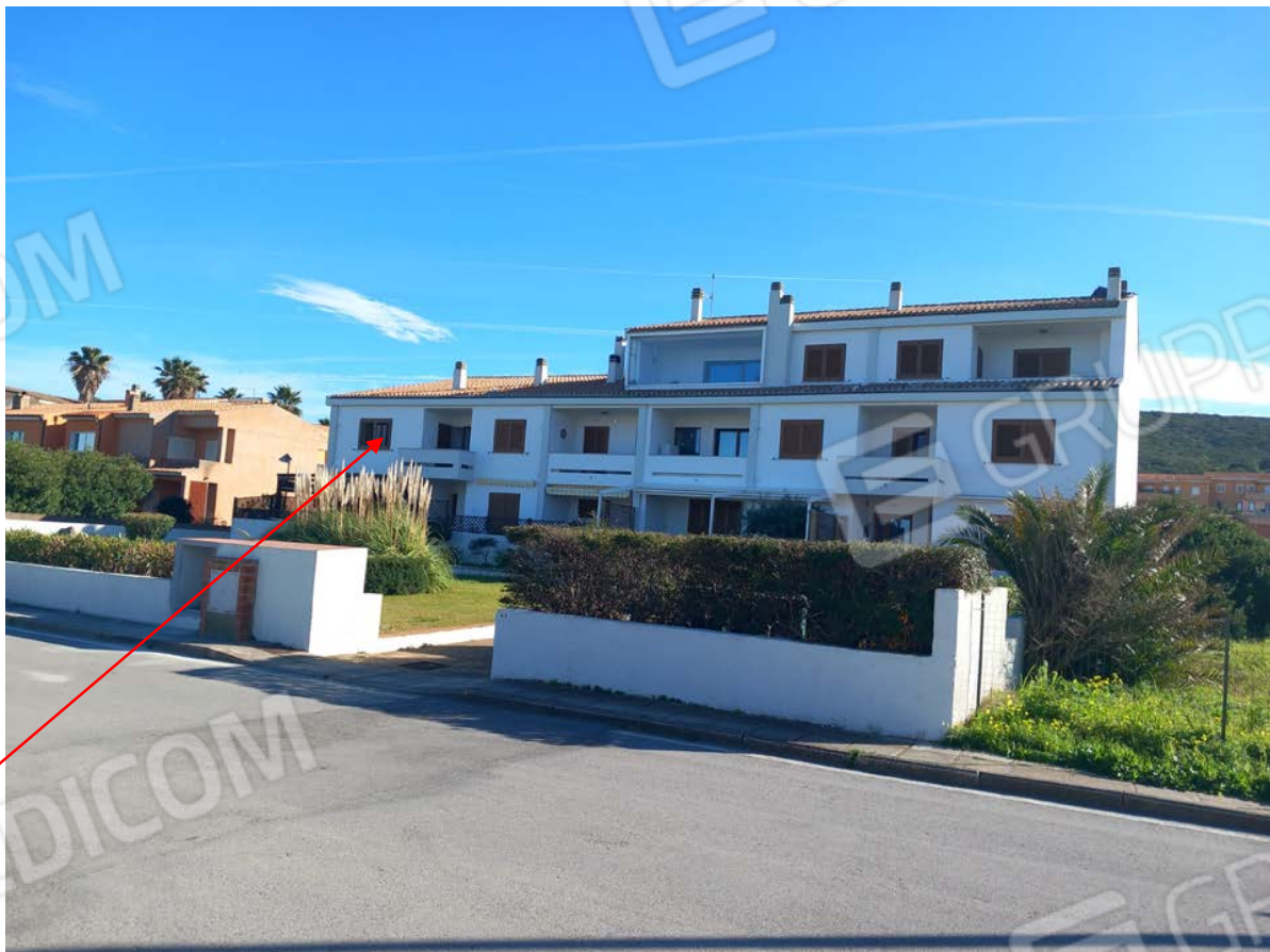
Foto 2 - L' edificio condominio "l'Isolotto" facciata prospiciente la Via di Riva dei Lestrigoni;