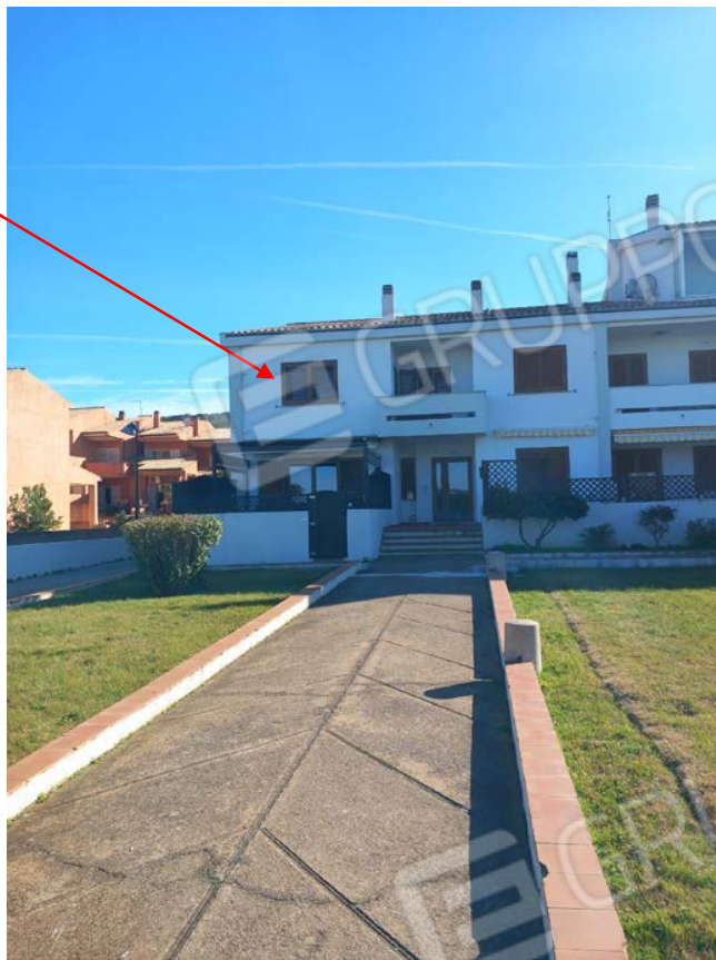
Foto 3 Particolare della vista dell' ingresso principale