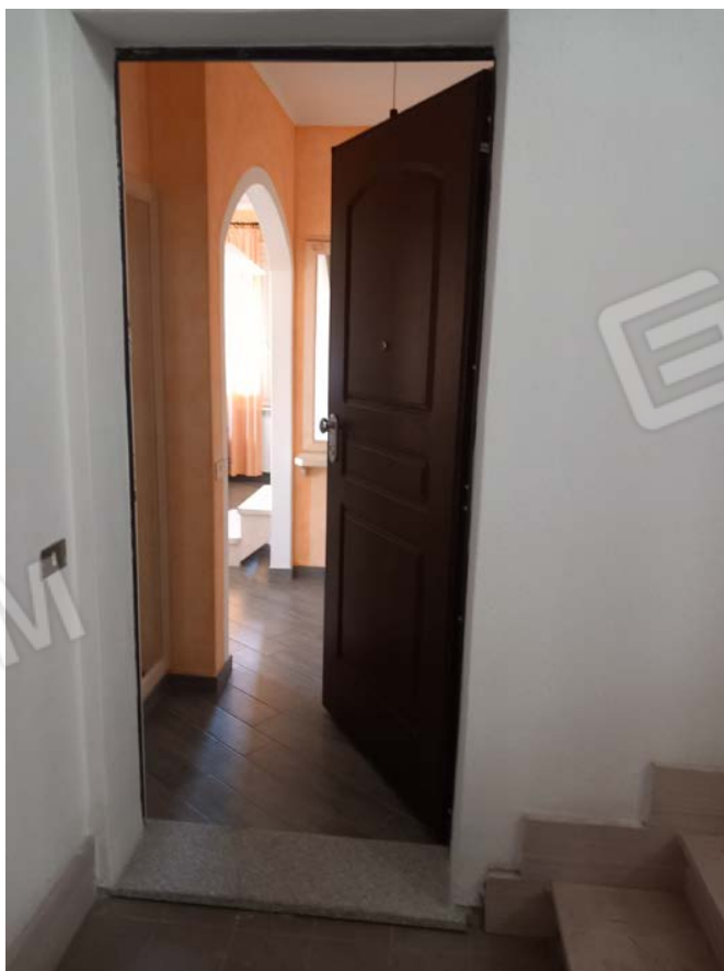
Foto 4 Particolare ingresso