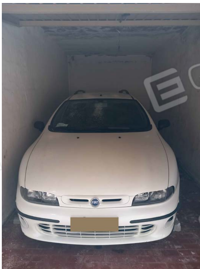
Foto 14 Box auto coperto.