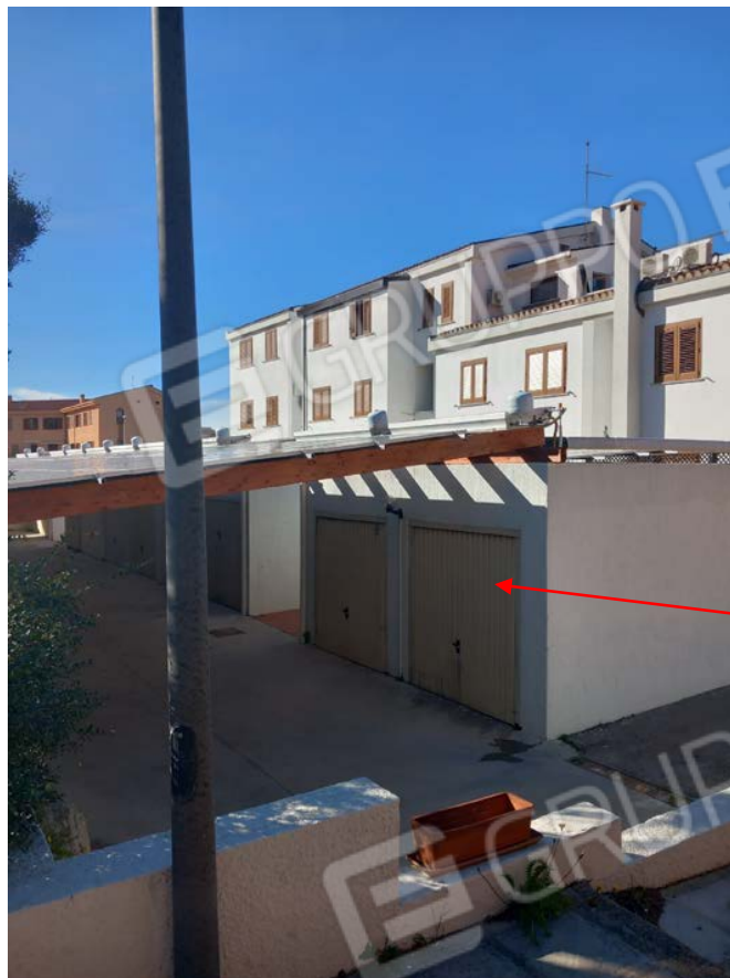
Foto 13 Retro del condominio Box auto coperto .