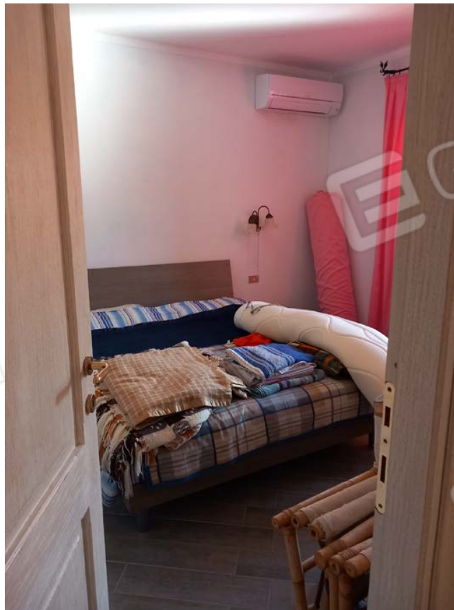
Foto 7 Ambienti della zona notte .