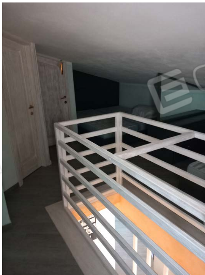
Foto 11 Piano Sottotetto .