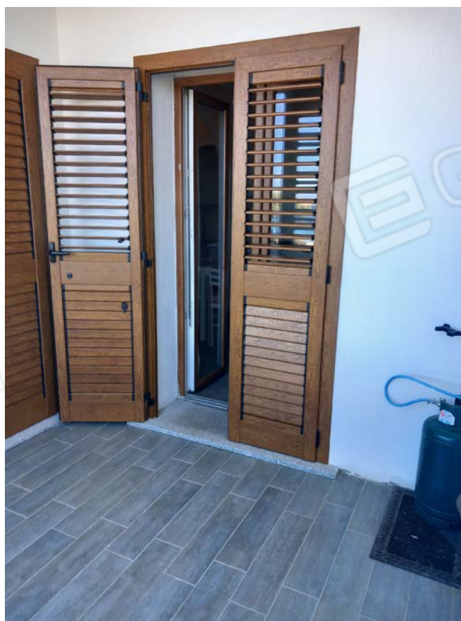
Foto 5 Terrazzo Esterno .