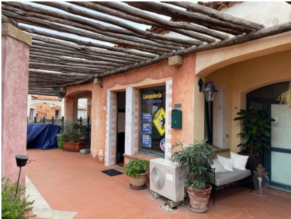
Esterni: fronte fabbricato e ingresso

Esecuzione Immobiliare R.G.E. n. 53/2020 Arch. Alessio Moledda Mail: alessiomoleddaarchitetto@gmail.com PEC: alessio.moledda@archiworldpec.it