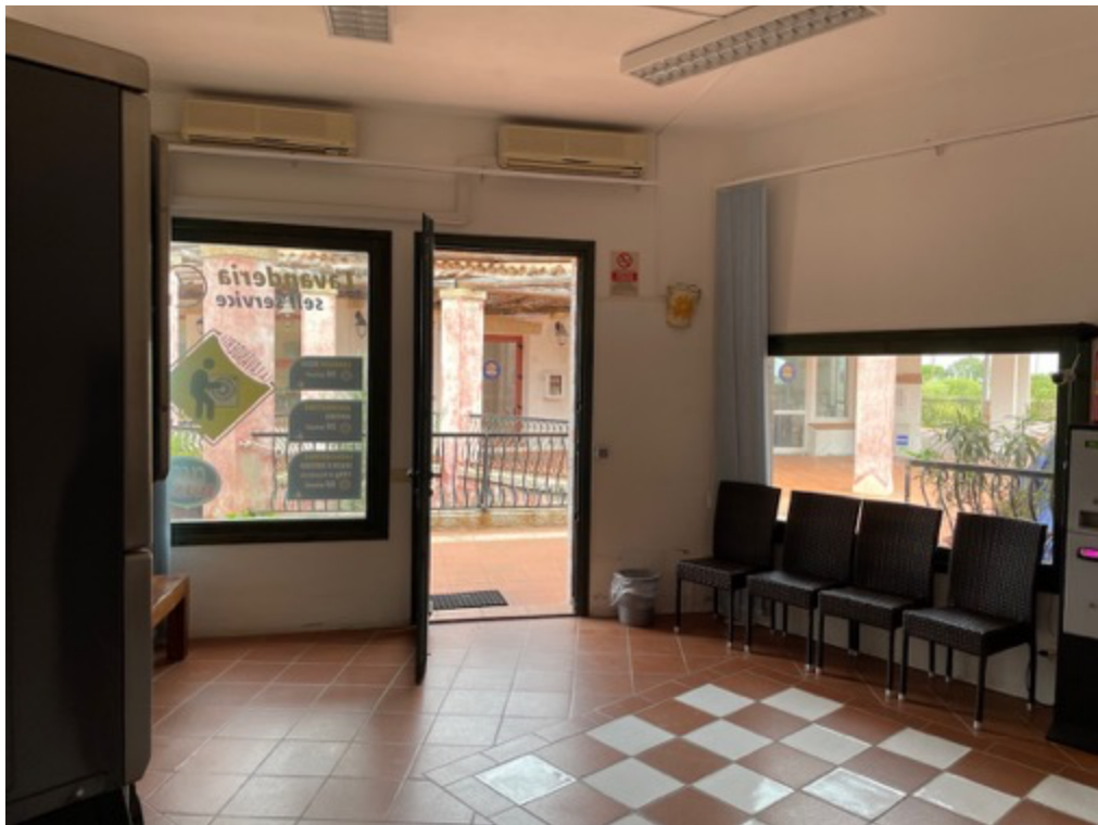
Esterni: locale commerciale

Esecuzione Immobiliare R.G.E. n. 53/2020 Arch. Alessio Moledda Mail: alessiomoleddaarchitetto@gmail.com PEC: alessio.moledda@archiworldpec.it