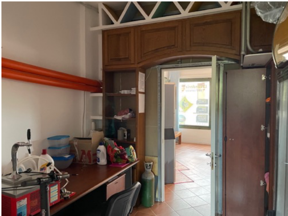
Esterni: locale commerciale (vano magazzino)