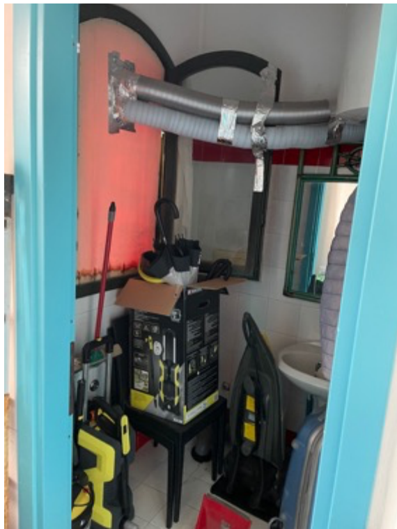
Interni: anti-bagno e bagno

Esecuzione Immobiliare R.G.E. n. 53/2020 Arch. Alessio Moledda Mail: alessiomoleddaarchitetto@gmail.com PEC: alessio.moledda@archiworldpec.it