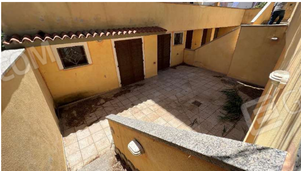
Figura 9 – Viste del subalterno 62