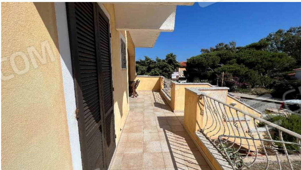
Figura 3 – Viste del subalterno 57