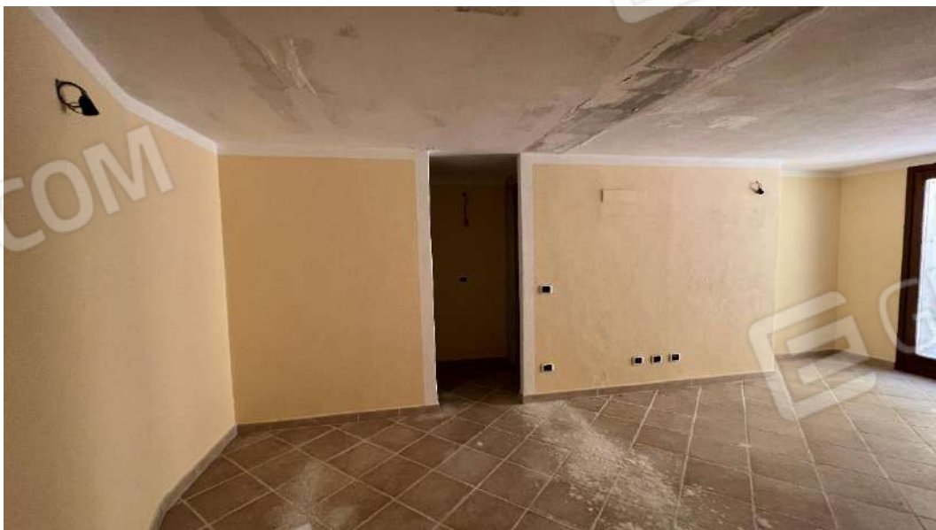
Figura 11 – Viste del subalterno 62