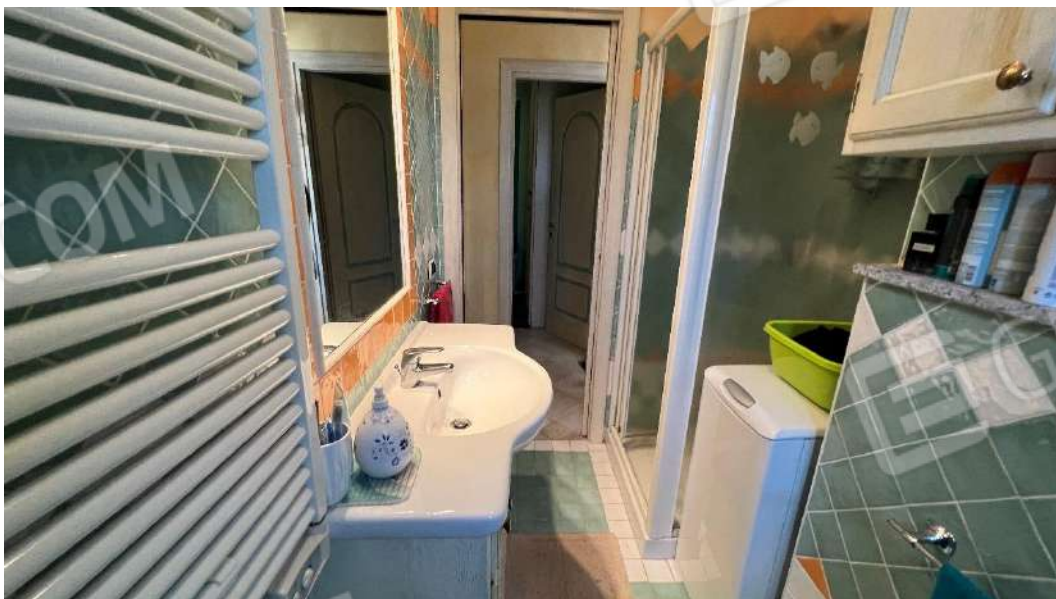
Figura 8 – Viste del subalterno 57