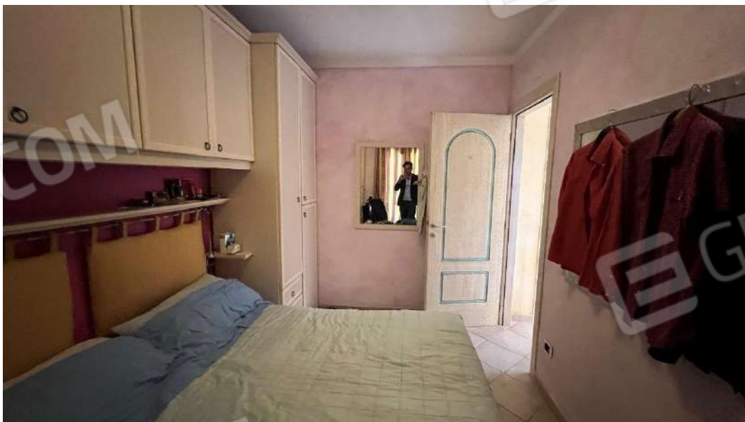
Figura 6 – Viste del subalterno 57