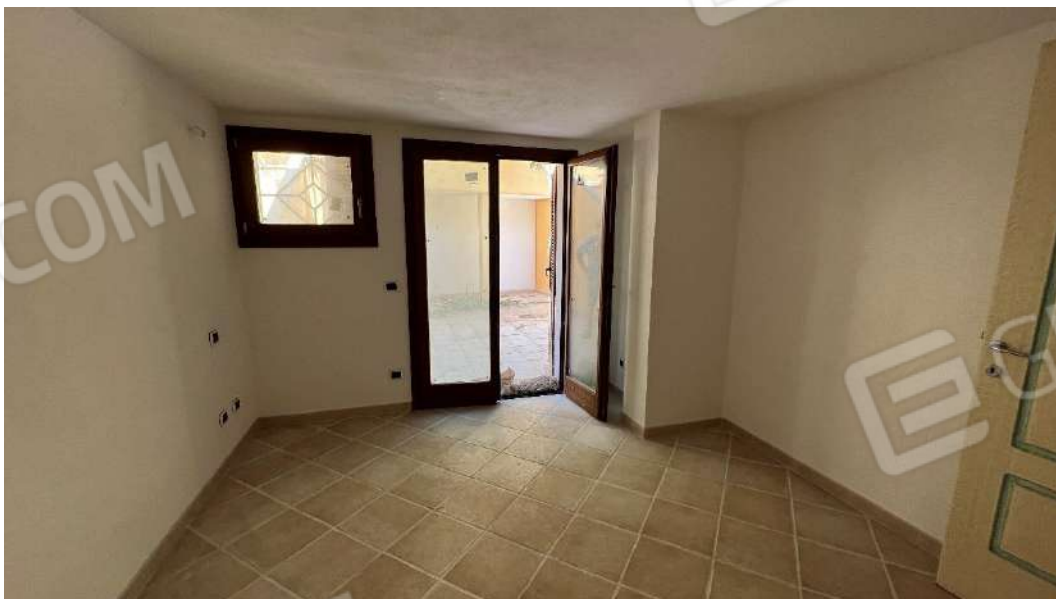
Figura 12 – Viste del subalterno 62