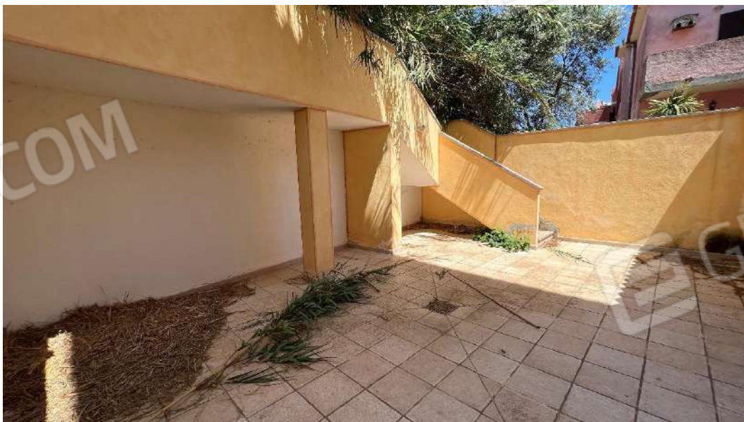
Figura 10 – Viste del subalterno 62