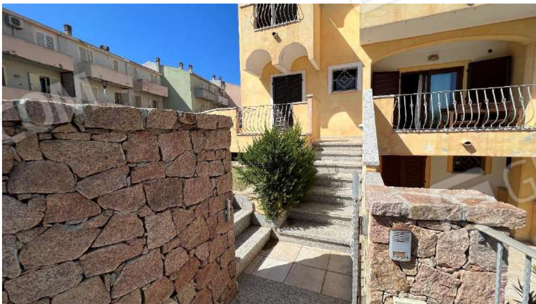
Figura 1 – Viste del subalterno 57