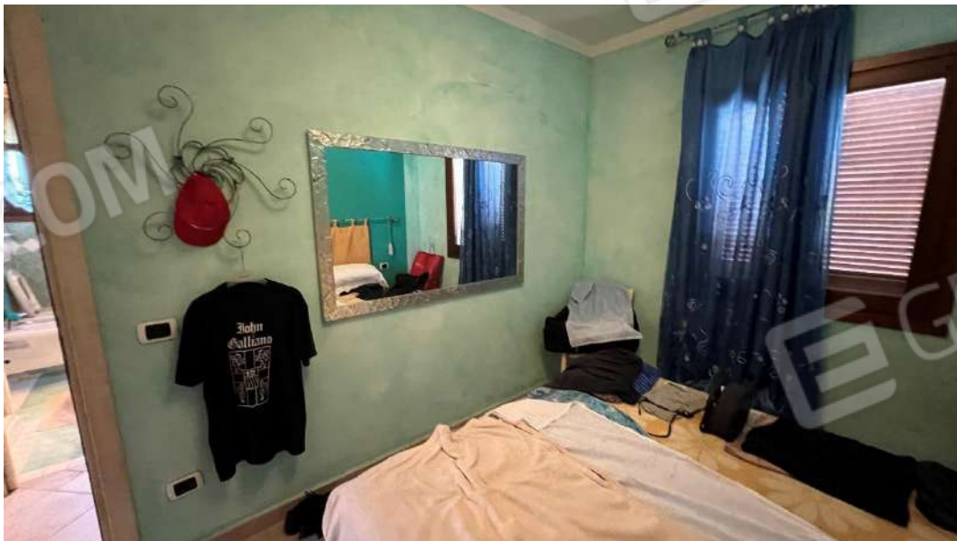
Figura 7 – Viste del subalterno 57