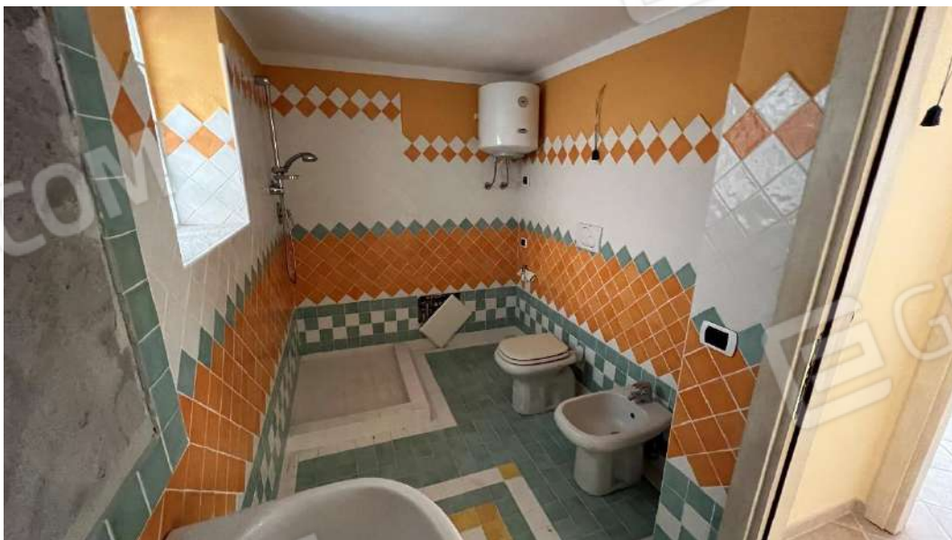
Figura 13 – Viste del subalterno 62