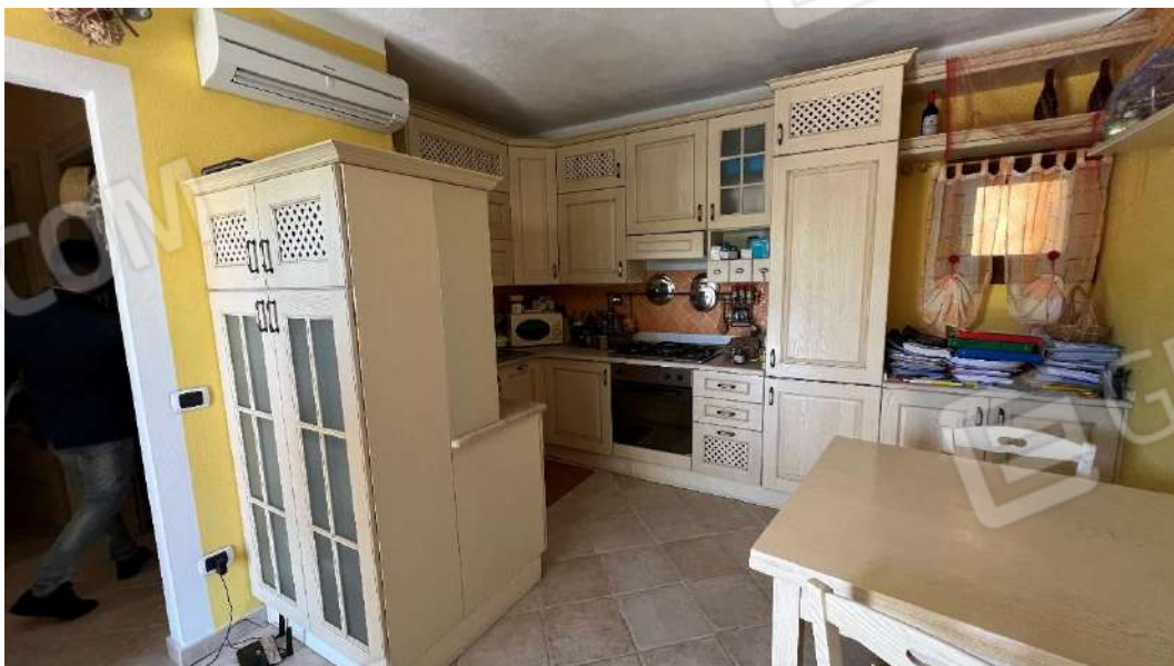
Figura 4 – Viste del subalterno 57