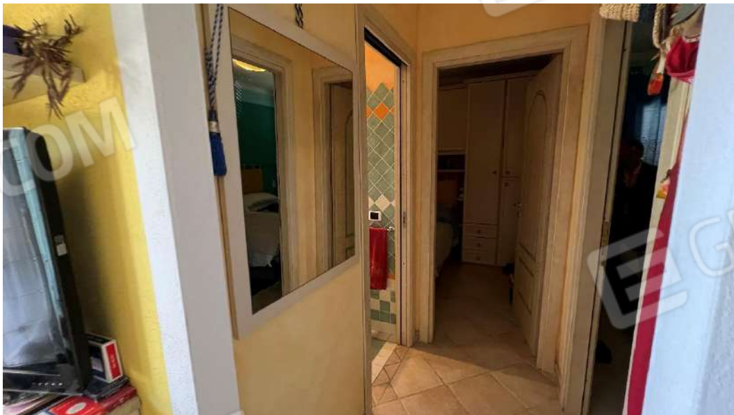
Figura 5 – Viste del subalterno 57