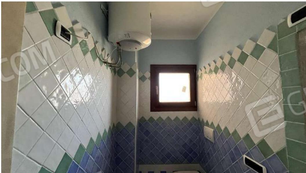
Figura 8 – Viste del subalterno 42