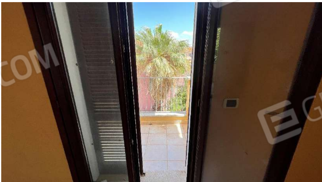
Figura 2 – Viste del subalterno 42