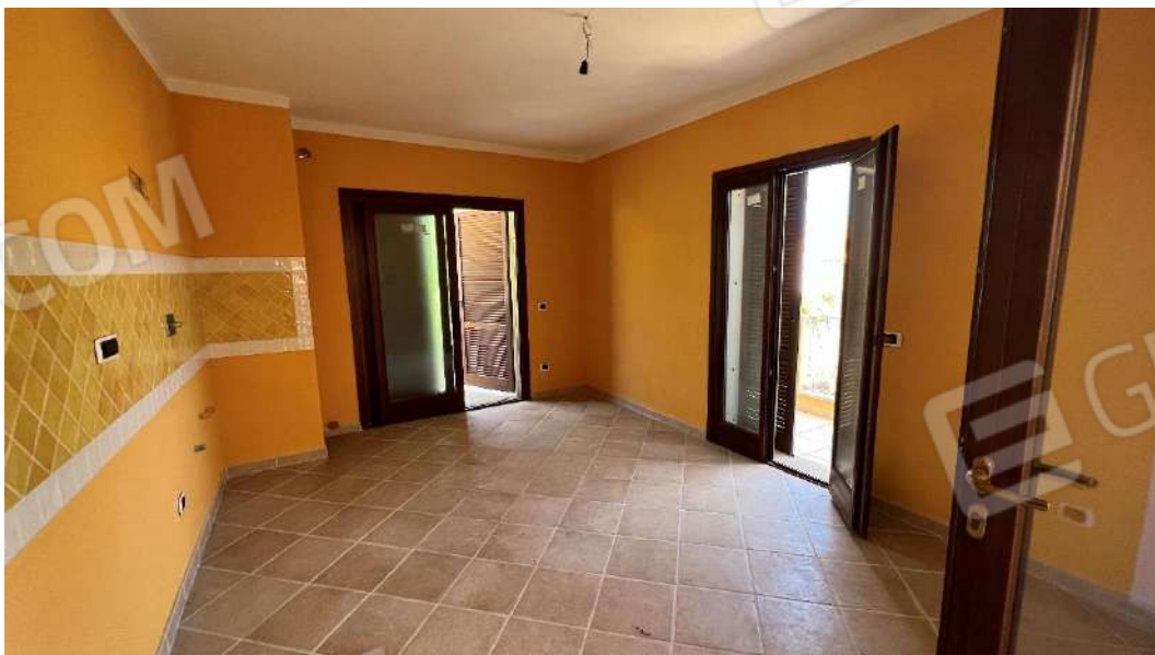
Figura 1 – Viste del subalterno 42