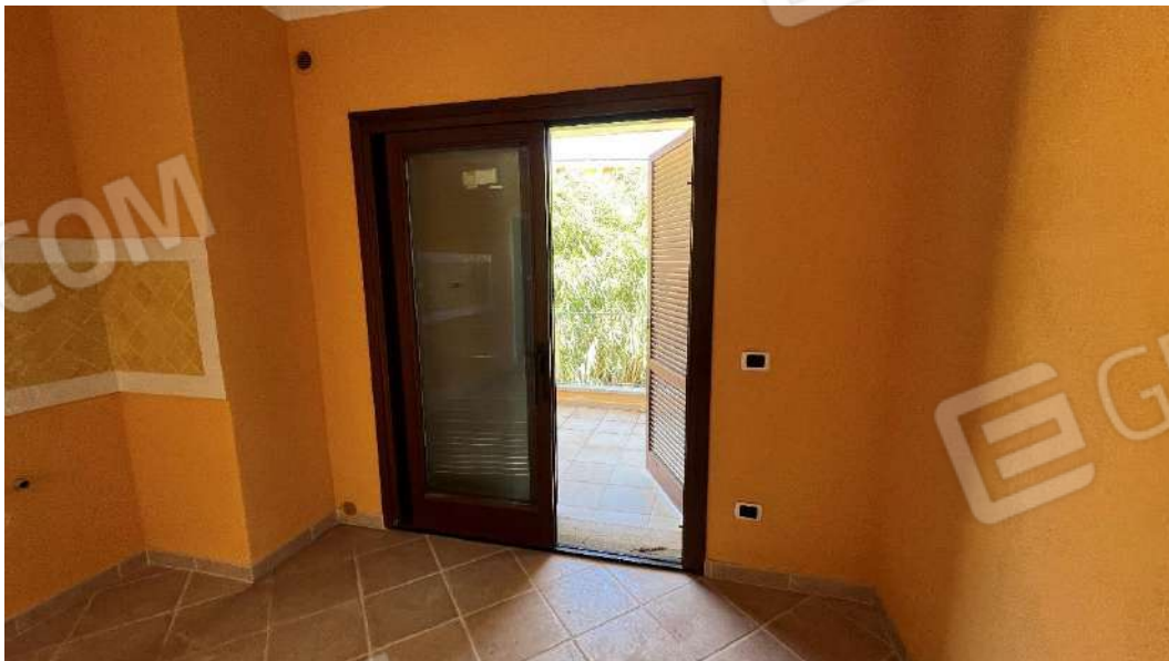
Figura 3 – Viste del subalterno 42