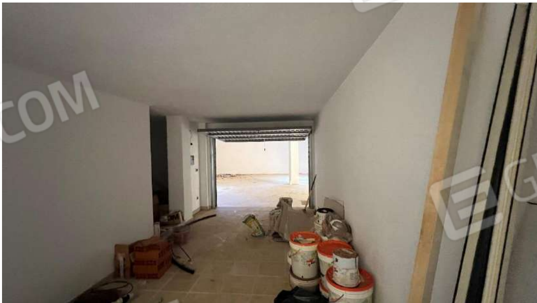
Figura 11 – Viste del subalterno 15