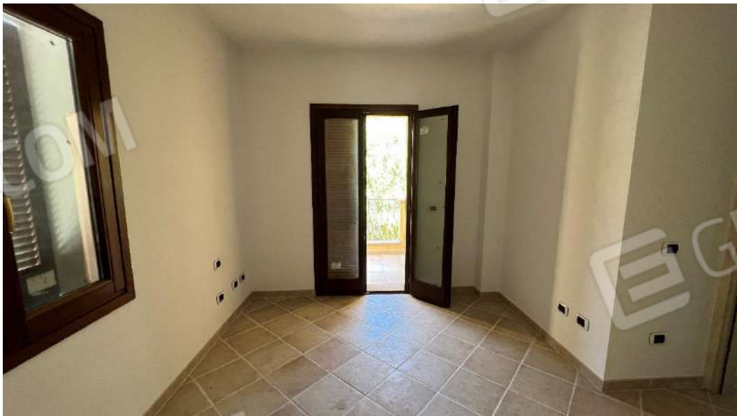
Figura 6 – Viste del subalterno 42