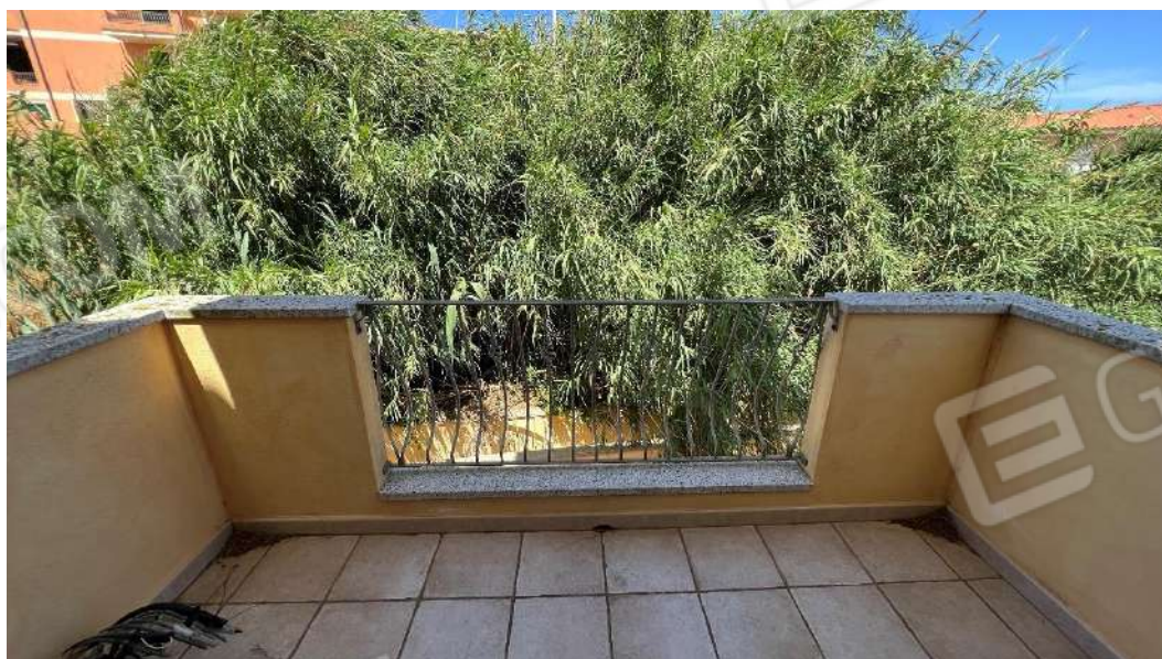
Figura 4 – Viste del subalterno 42