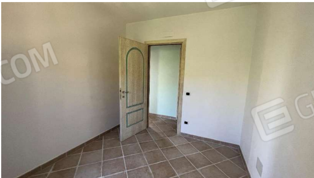
Figura 5 – Viste del subalterno 42