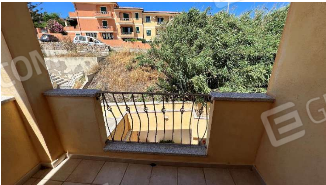
Figura 7 – Viste del subalterno 42