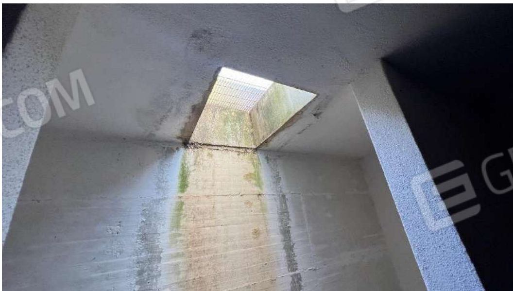
Figura 12 – Viste del subalterno 15