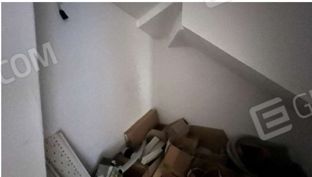
Figura 10 – Viste del subalterno 15