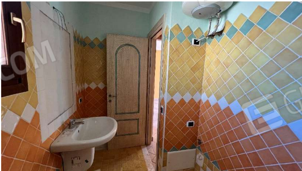
Figura 5 – Viste del subalterno 47