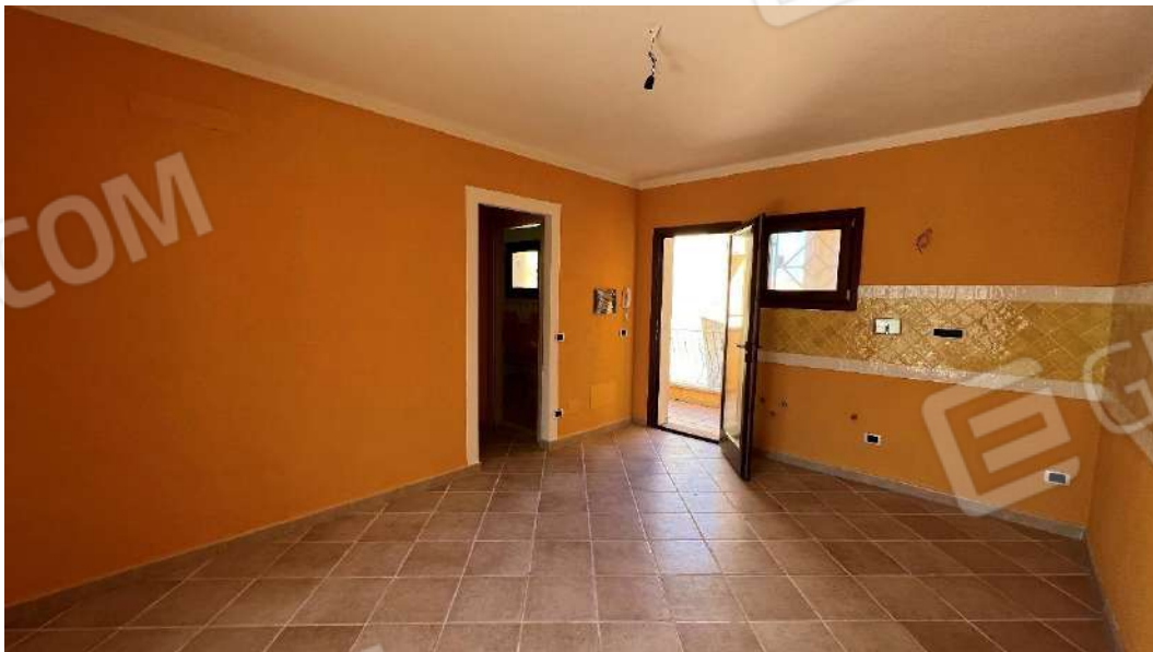
Figura 2 – Viste del subalterno 47