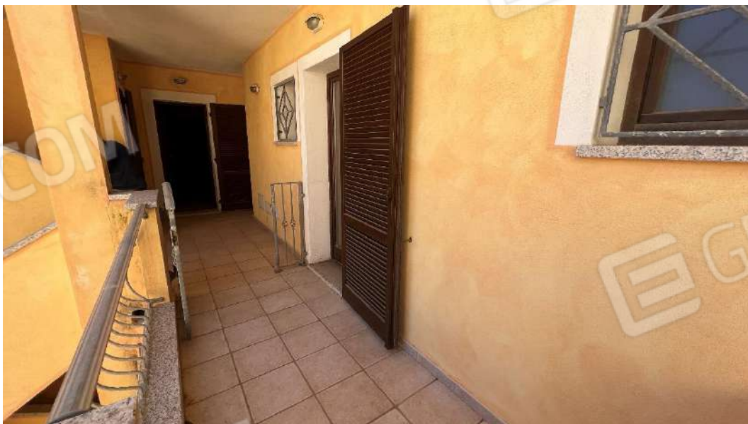
Figura 1 – Viste del subalterno 47