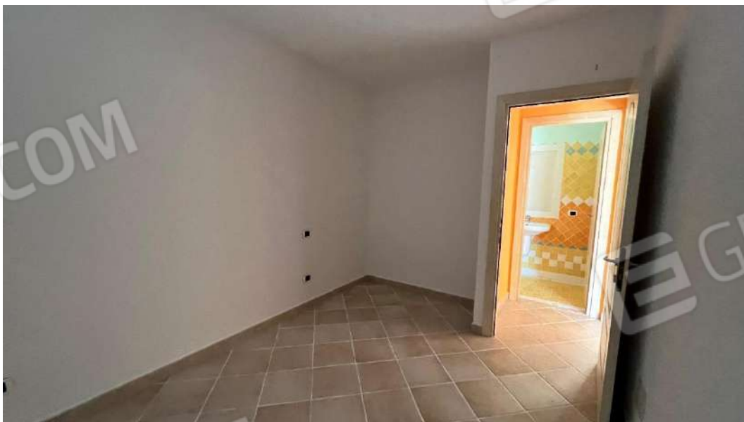
Figura 4 – Viste del subalterno 47