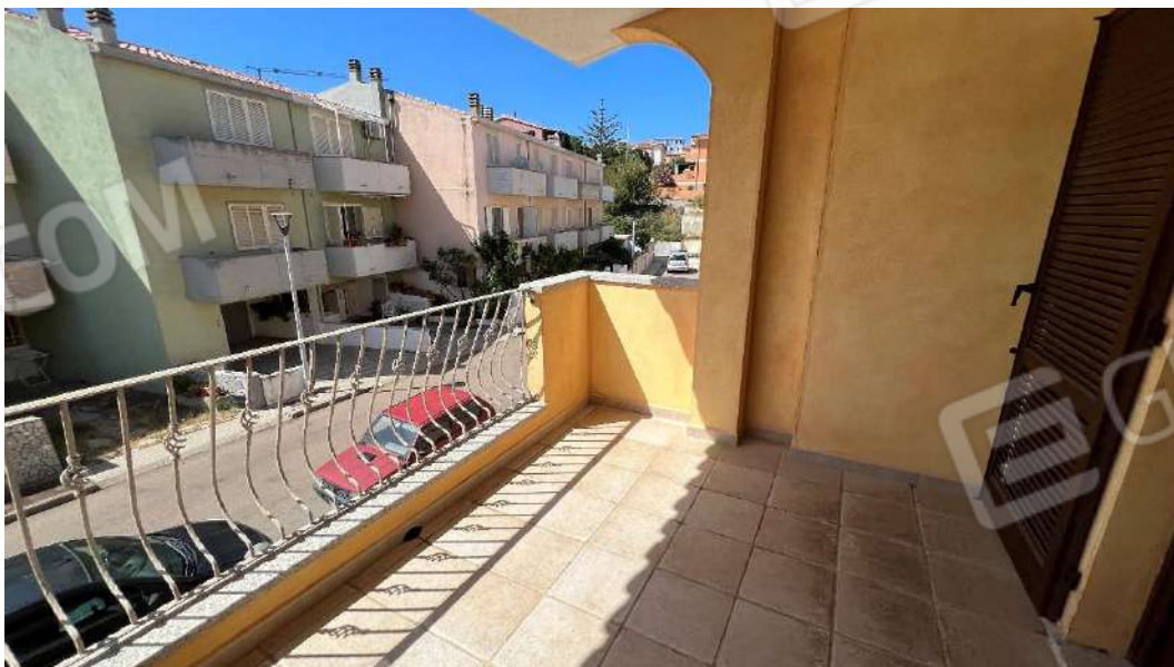
Figura 3 – Viste del subalterno 47