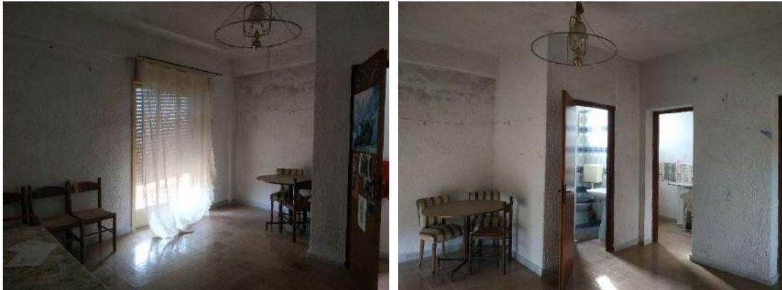
Figure 4 –Soggiorno-pranzo