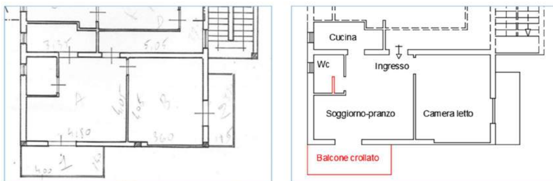
Figure 9 – A sx stralcio dell'elaborato grafico della concessione edilizia, a dx restituzione grafica dello stato dei luoghi

In figura 9 il confronto tra l'elaborato grafico relativo alla concessione edilizia e lo stato dei luoghi.