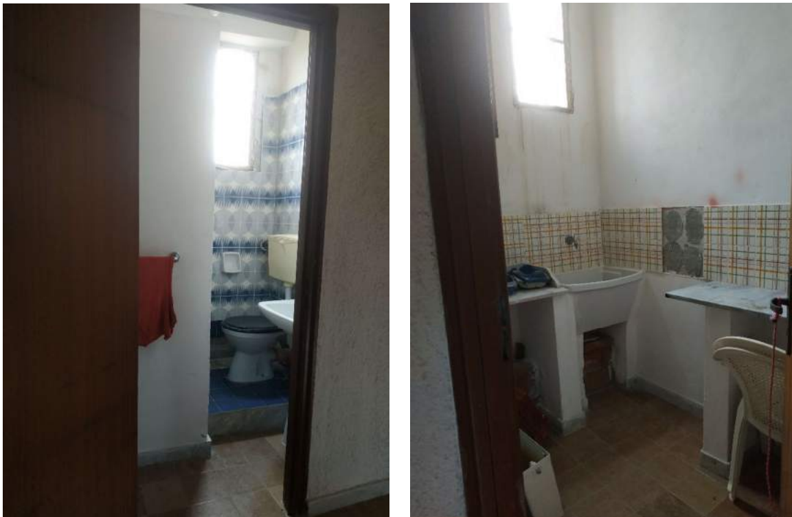
Figura 5 – A sx il servizio igienico a dx il vano cucina