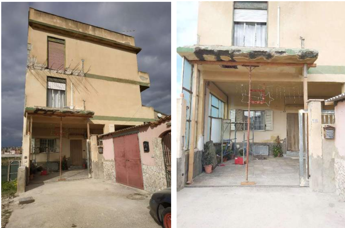
Figure 3 –Prospetto Sud Accesso all'area di corte – particolare del corpo pensile crollato

Le figure 3 – 4 – 5 – 6 riportano parte del rilievo fotografico, la figura 7 il rilievo metrico dei luoghi.