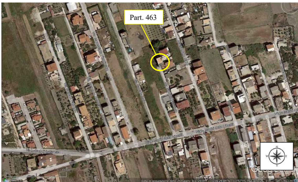
Figura 2 - Individuazione di massima del fabbricato in cui è censito il bene pignorato

Il fabbricato dove è ubicato l'immobile si trova all'interno di un'area di corte non esclusiva. Quest'ultima si affaccia a Sud-Est sulla strada Soldato Friscaro a Sud-Ovest sulle particelle 138 e 139 a Nord-Ovest con la particella 200 a Nord-Est con la particella 351. L'appartamento inoltre confina a Nord con il sub 13 dello stesso piano inserito nel lotto di vendita 2 della presente procedura; La figura 2 riporta l'ortofoto con l'individuazione del fabbricato di cui l'unità è parte.