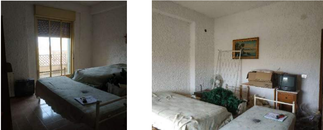
Figura 6 – Camera da letto