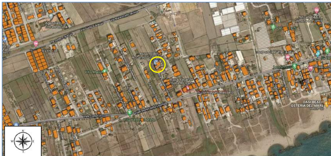
Figura 1 - Individuazione di massima del fabbricato in cui sono dislocati i beni pignorati. Immagini satellitari estratte da Google Heart con la sovrapposizione dell'estratto di mappa catastale.

Nella figura 1 si riporta la sovrapposizione dell'immagine satellitari della zona di interesse con il foglio di mappa catastale per un'univoca individuazione dei beni oggetto del pignoramento.