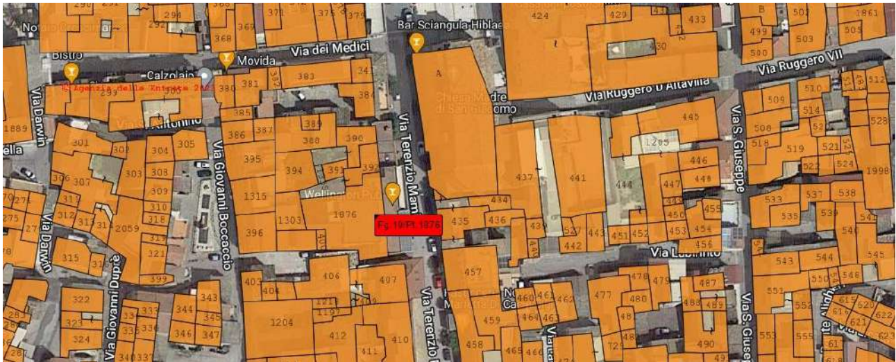
Ortofoto dell'area ove risiede il bene pignorato