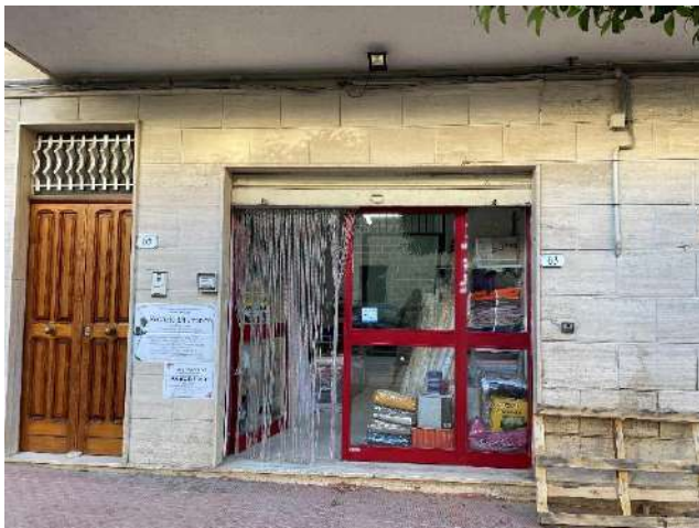
Foto esterne del lotto pignorato.

Il magazzino oggetto del presente pignoramento è articolato ad un unico livello, posto nel piano sotterraneo di un edificio in Ravanusa (AG) in via Terenzio Mamiani n. 63. L'accesso al bene, al momento del sopralluogo, avviene tramite un piccolo magazzino situato al piano terra che però appartiene ad altri proprietari. Durante il sopralluogo l'esecutato ha dichiarato che la servitù di passaggio avviene solo tramite accordi privati tra i proprietari, che è a suo uso esclusivo e che l'accesso originario può essere ripristinato riaprendo la porta originaria, accessibile da un vano scala presente dietro il fabbricato. Dal magazzino posto al piano terra al civico n. 63, si accede alla proprietà posta al piano sotterraneo tramite un vano scala. Il cespite è costituito da un grande vano utilizzato come deposito, un piccolo bagno con antibagno, un ripostiglio ed infine di un ufficio creato con infissi removibili. La superficie totale è di circa 329 mq.