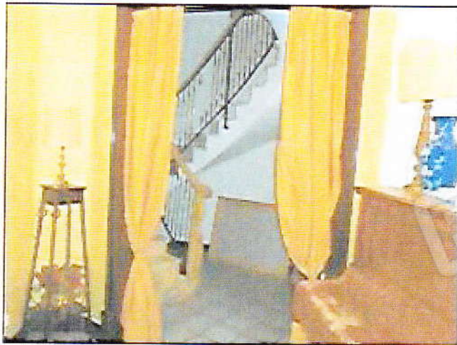
Ingresso al 1° piano