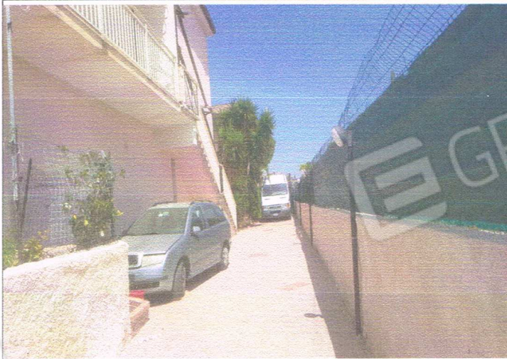
Foto n.1: Accesso partt.ile 1155/5 (appartamento 2° piano) e 1302/2 (magazzino piano terra)