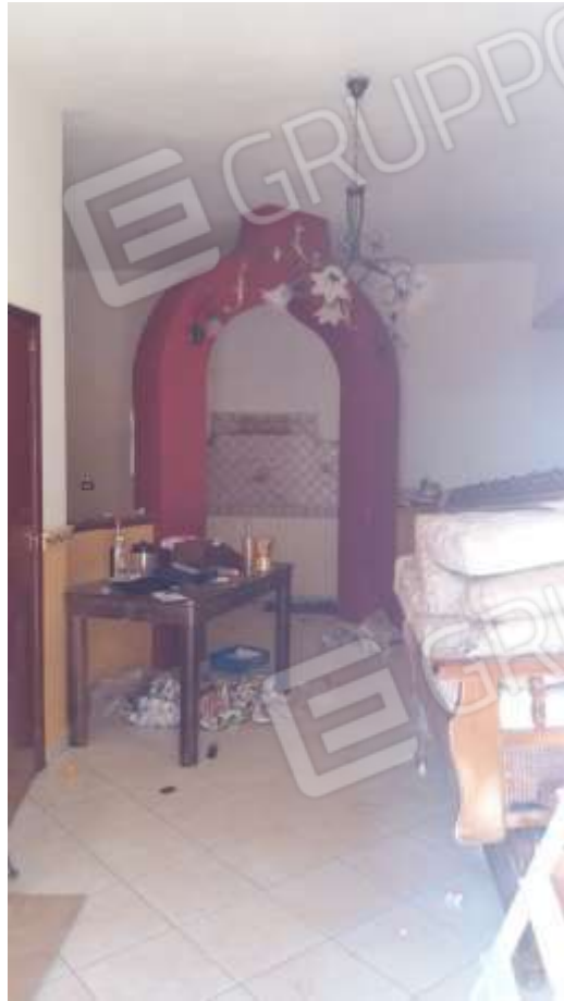
FOTO 5 - Veduta dell'ingresso a piano terra.