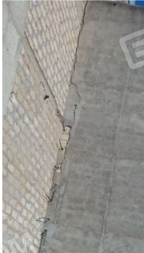
FOTO 4 - Particolare della lesione