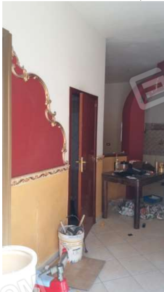
FOTO 8 - Veduta del wc a piano terra.