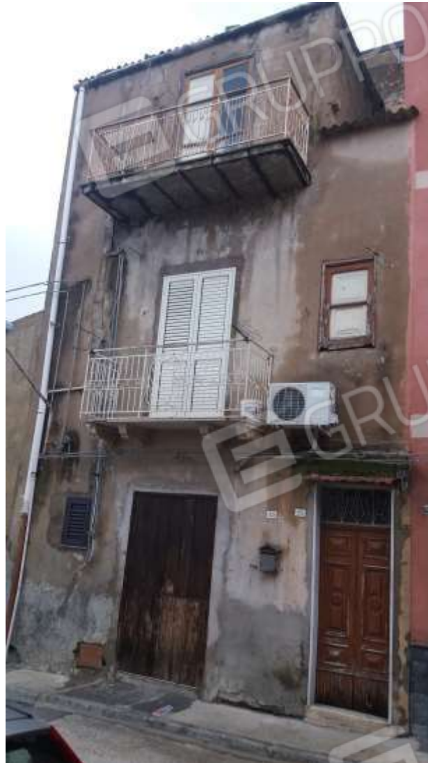
FOTO 1 - Veduta dell'unità immobiliare, sito in Via Cangiamila 53