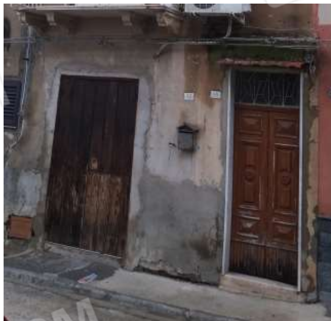
FOTO 2 - Veduta del portone d'ingresso