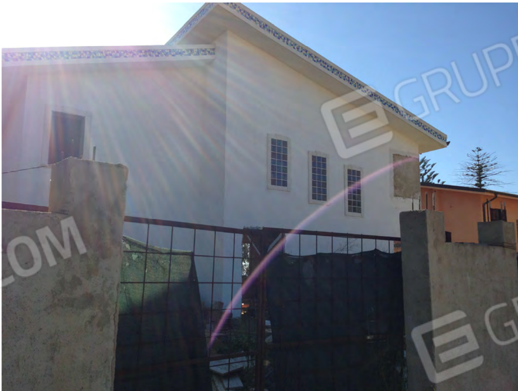
Prospetto lato via del sole con ingresso carrabile sul vialetto condominiale con altre unità immobiliari