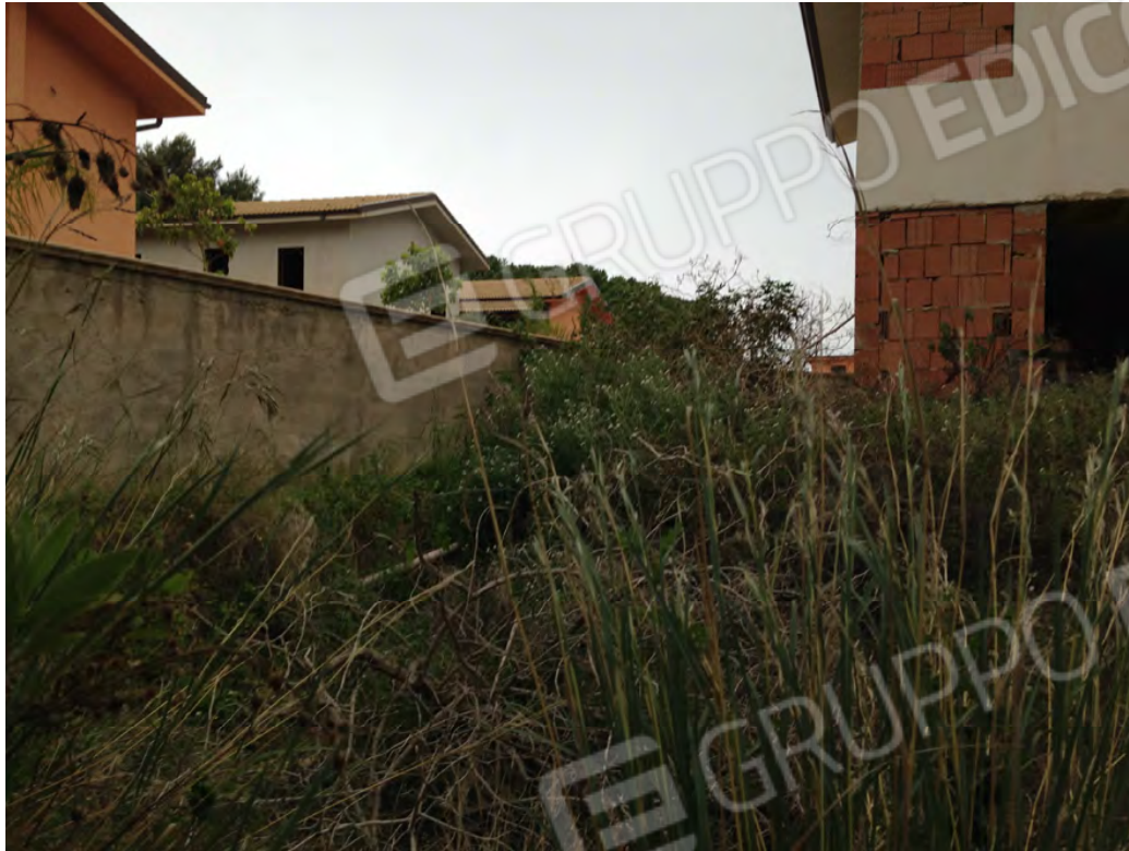
Corte del fabbricato costituito da terreno vegetale privo di piantumazione lato ovest