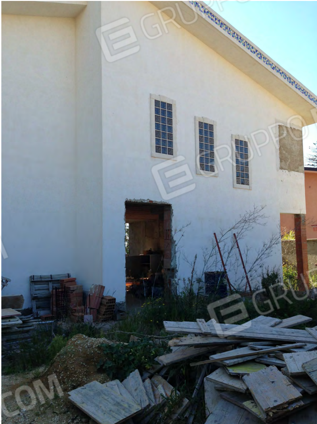
Particolare rifinitura prospetti (piano terra e primo) del fabbricato allo stato grezzo, lato via del Sole