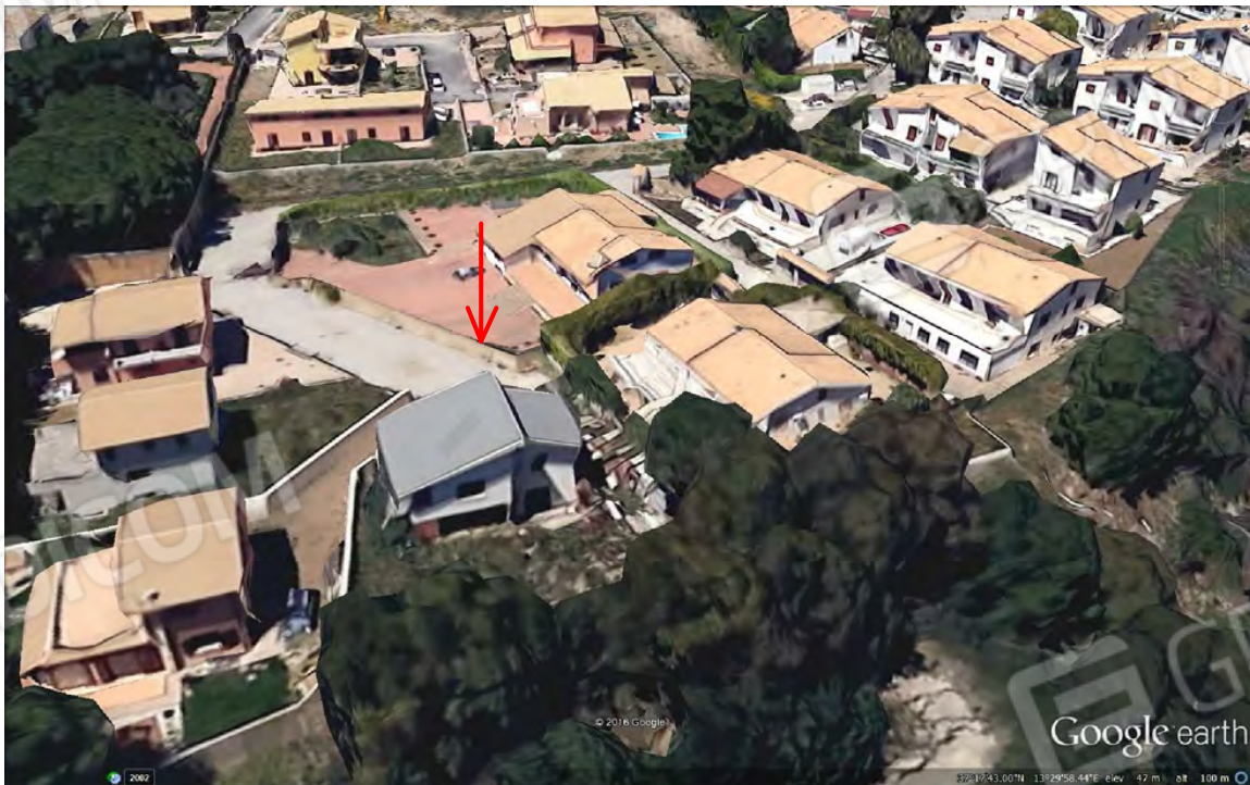
Vista dall'alto del fabbricato soggetto all'esecuzione immobiliare