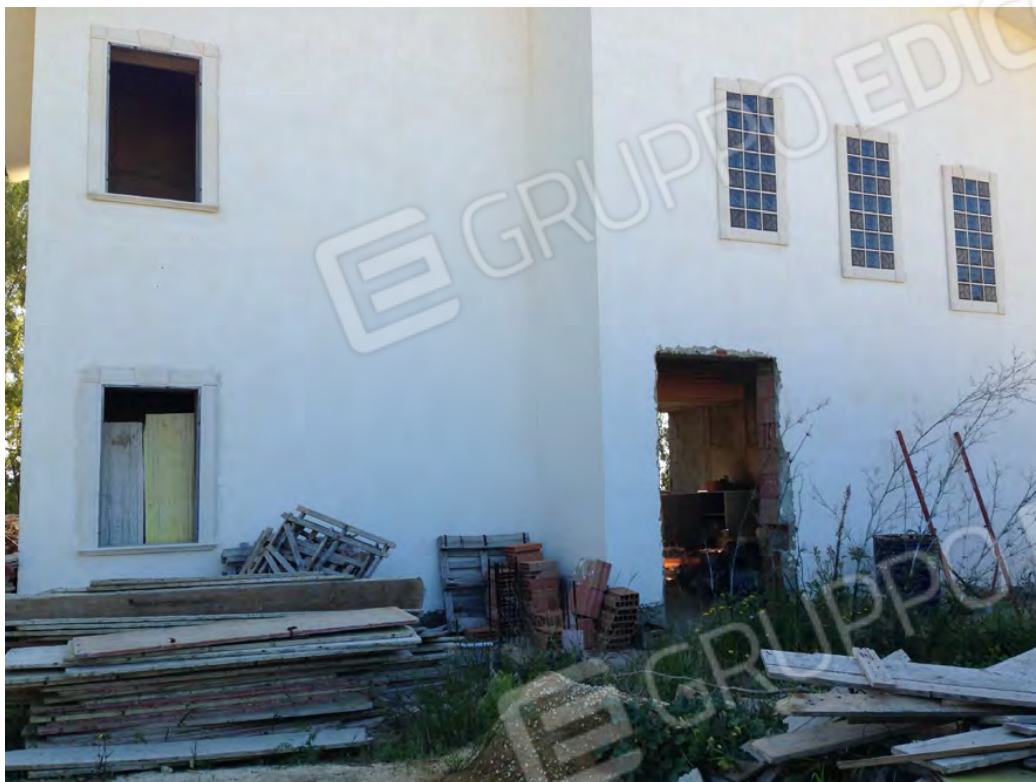
Particolare rifinitura prospetti (piano terra e primo) del fabbricato allo stato grezzo, lato via del Sole