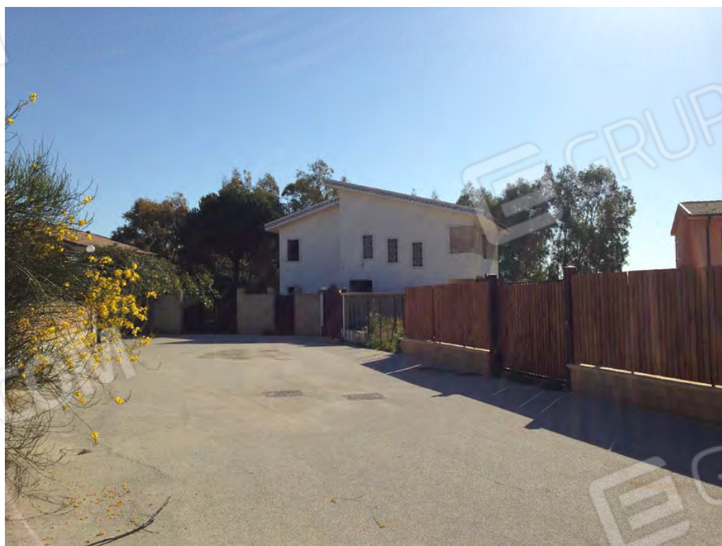
Prospetto lato via del Sole (piano terra e primo) senza civico e vialetto condominiale identificato al fg. 19 part. 1588