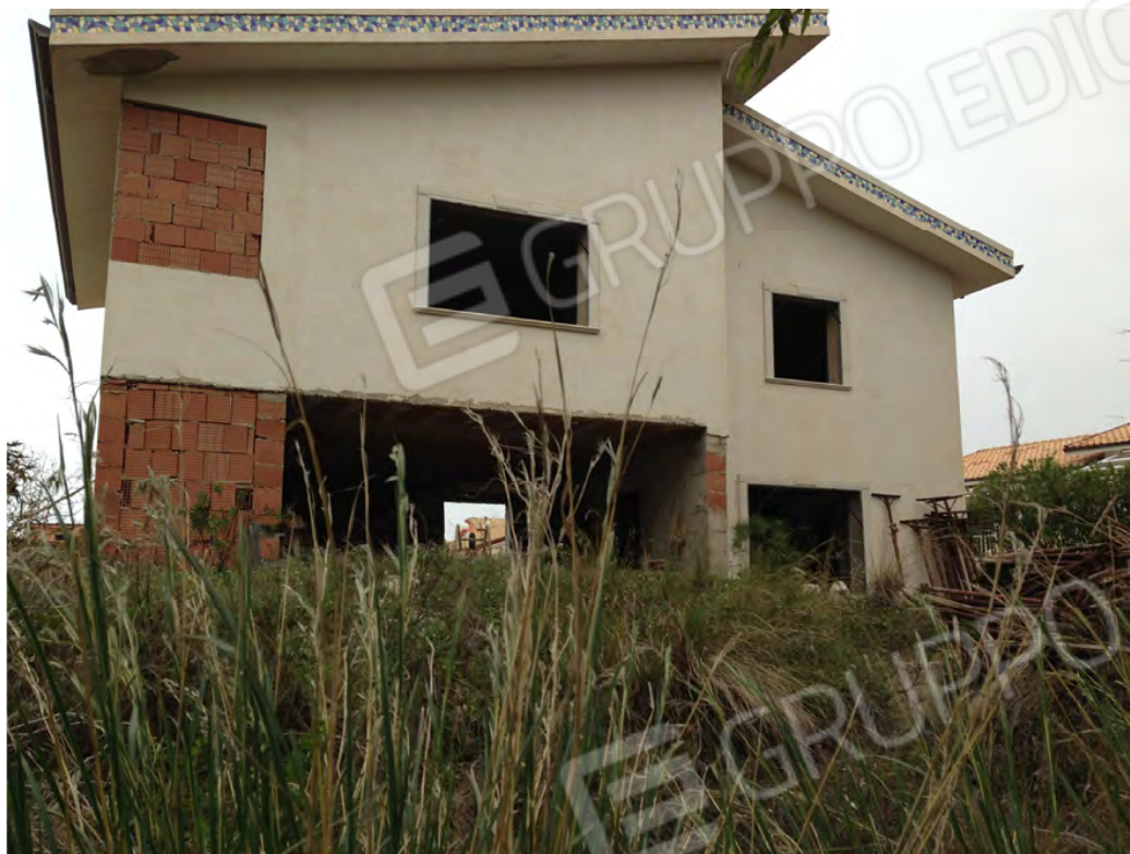
Prospetto lato posteriore (piano interrato, terra e primo) Ovest