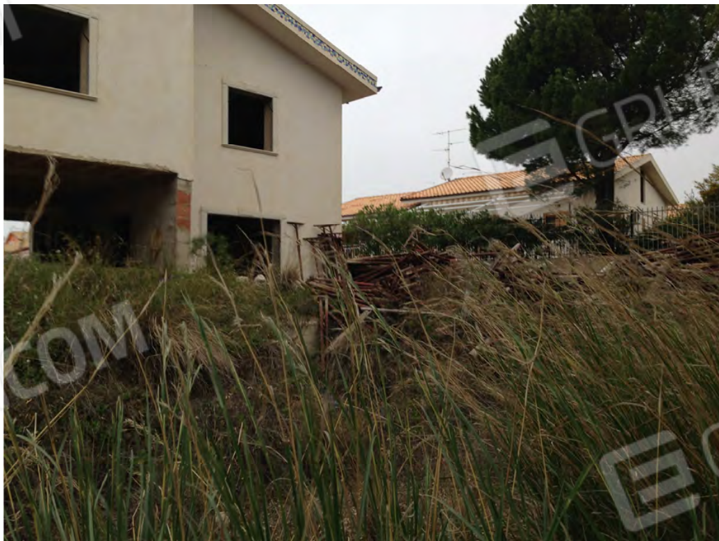
Corte del fabbricato costituito da terreno vegetale privo di piantumazione lato ovest