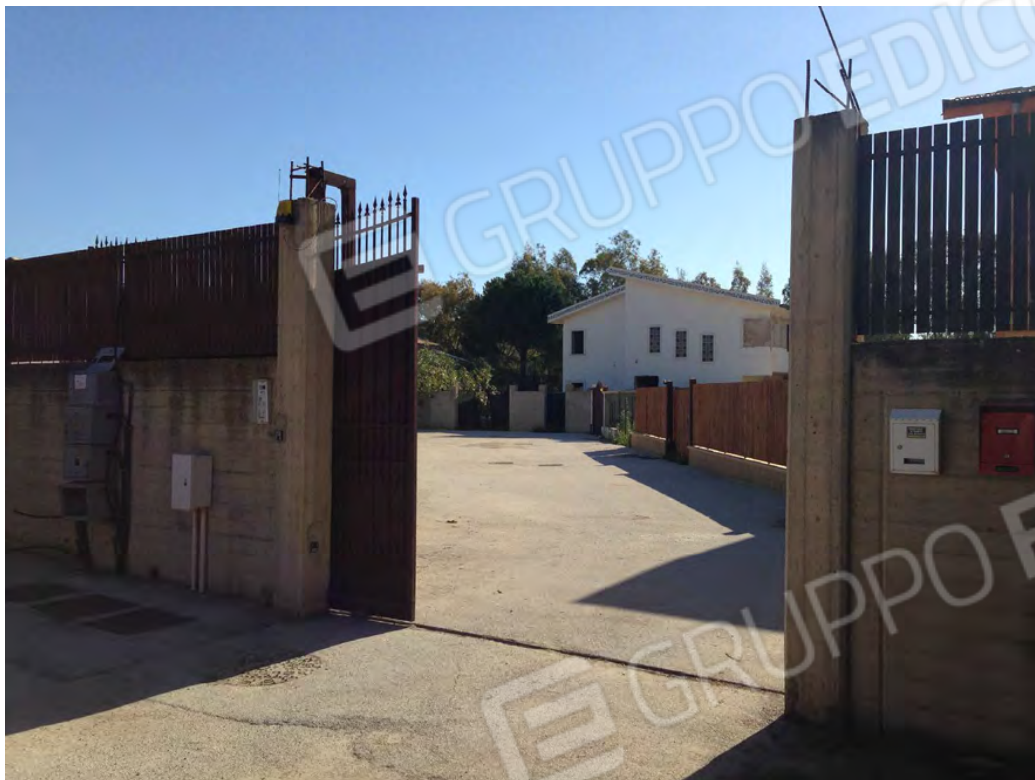
Prospetto lato via del Sole (piano terra e primo) senza civico e cancello condominiale su vialetto identificato al fg. 19 part. 1588