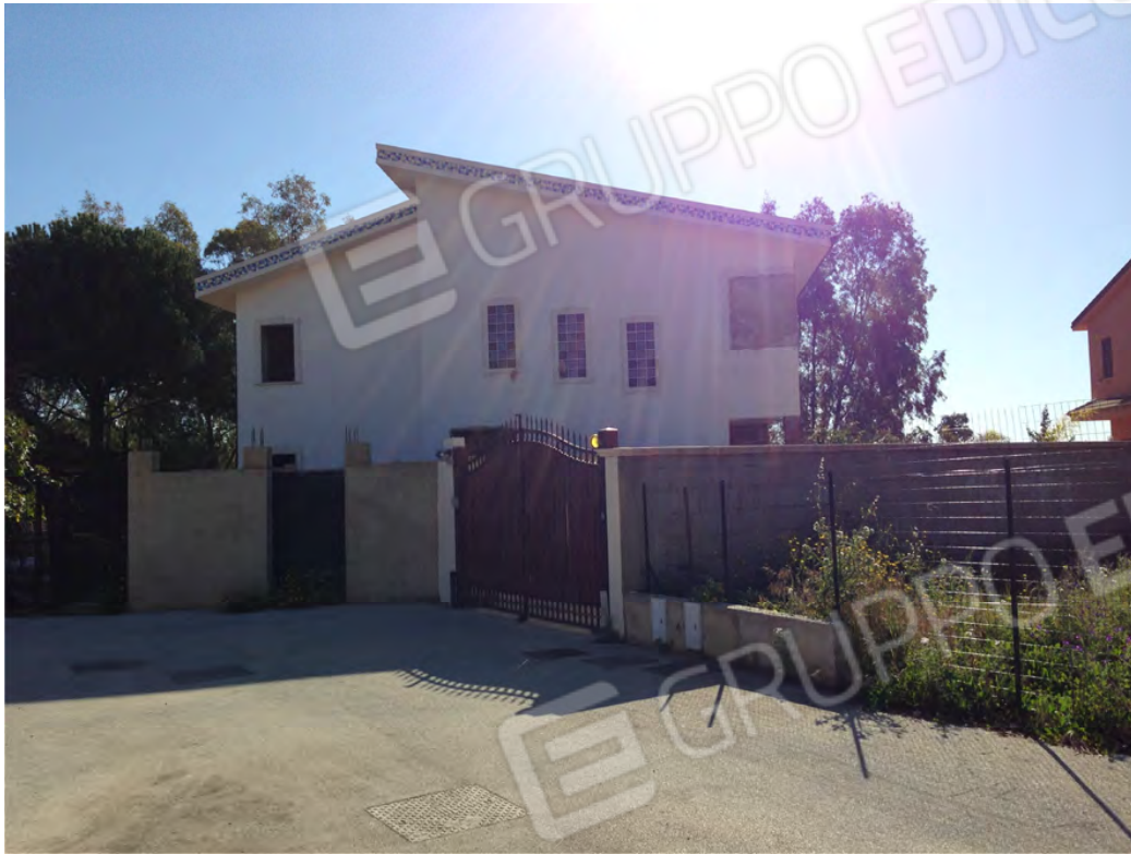
Prospetto lato via del Sole (piano terra e primo) su vialetto identificato al fg. 19 part. 1588