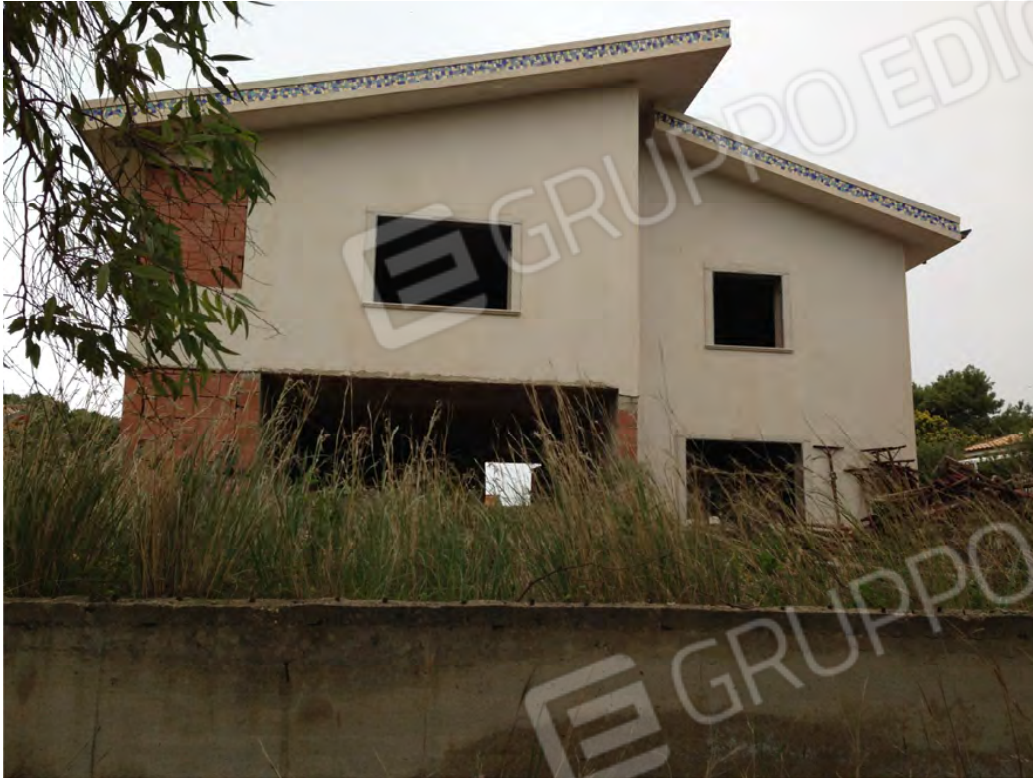
Prospetto lato posteriore (piano interrato, terra e primo) Ovest