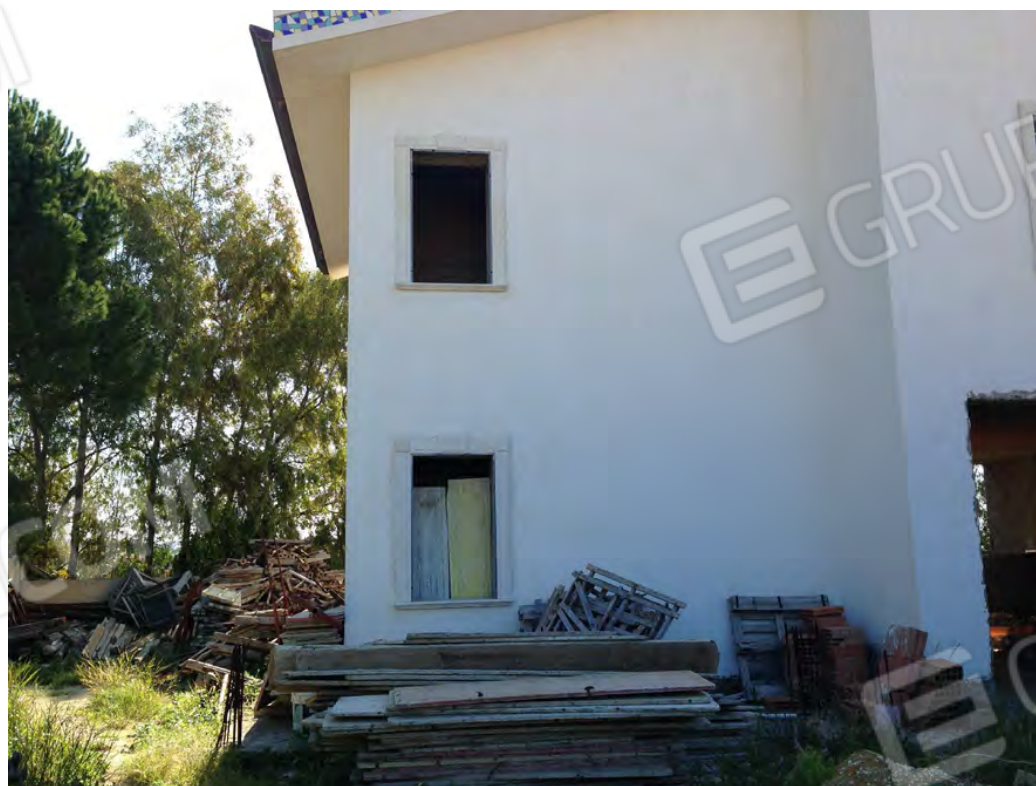
Particolare rifinitura prospetti (piano terra e primo) del fabbricato allo stato grezzo, lato via del Sole