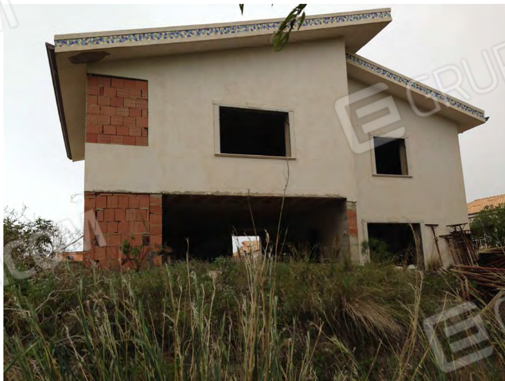
Prospetto lato posteriore (piano interrato, terra e primo) Ovest