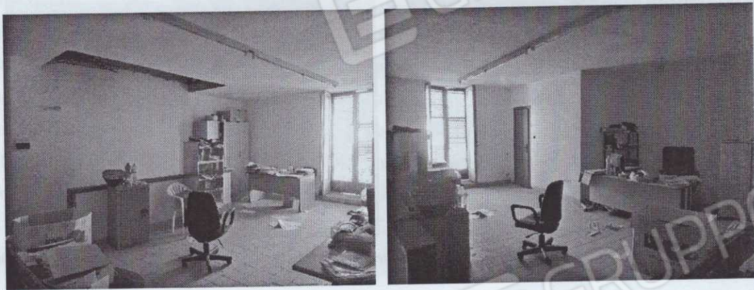
Figura 8 – vista interna piano primo