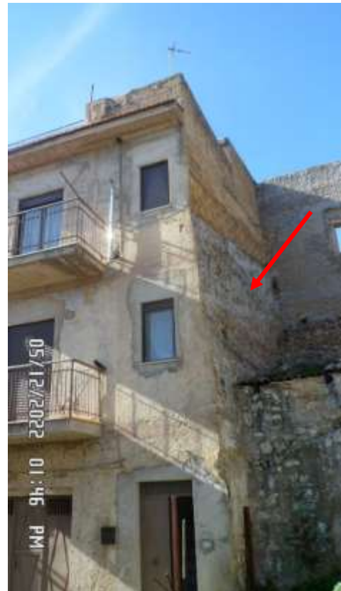
FOTO 4 - VEDUTA LATO NORD