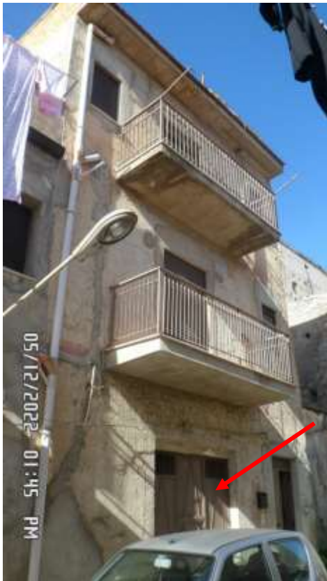
FOTO 3 - VEDUTA INGRESSO DEL MAGAZZINO