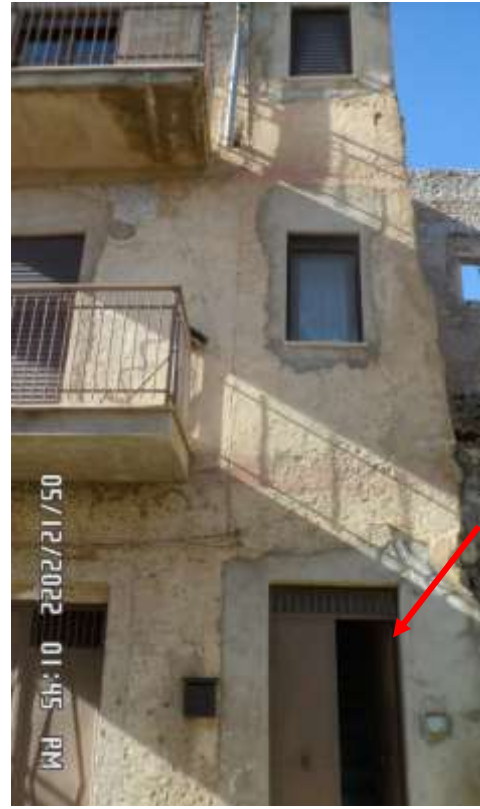
FOTO 2 - VEDUTA INGRESSO ABITAZIONE