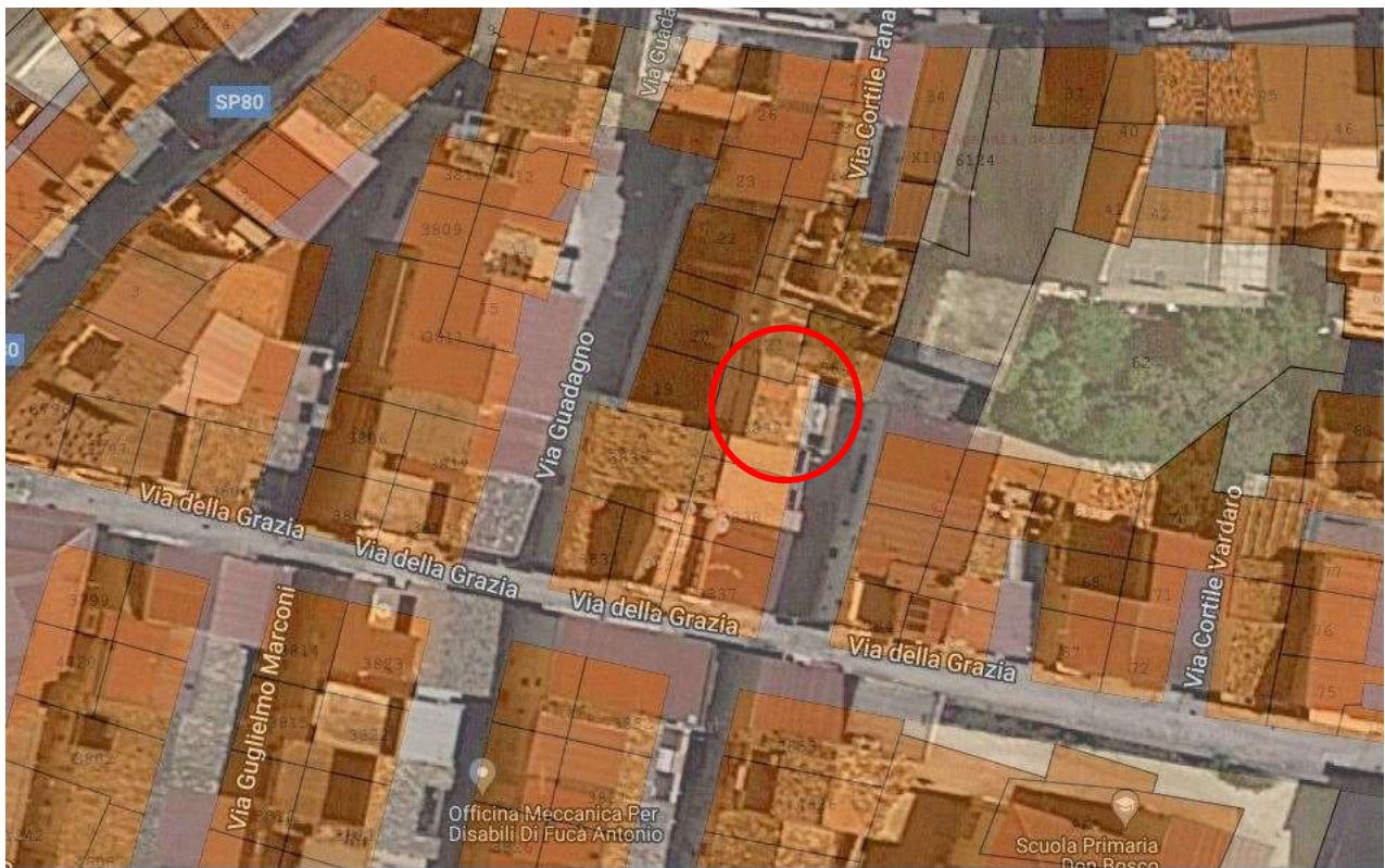
Figura 2 – Sovrapposizione di catastale su ortofoto.