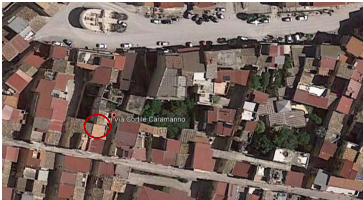
Figura 1 – Foto satellitare

ABITAZIONE DI TIPO ECONOMICO IN COMUNE DI FAVARA C/LE CARAMANNO N. 5 C. F. DI FAVARA FOGLIO 39, PART. 21 SUB 3, PART. 3838 SUB 4, PART. 3839 SUB 5, GRAFFATE; MAGAZZINO/DEPOSITO IN COMUNE DI FAVARA C/LE CARAMANNO N. 6 C. F. DI FAVARA FOGLIO 39 PART. 3838 SUB 5, PART. 3839 SUB 6 GRAFFATE