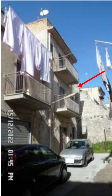
FOTO 1 - VEDUTA DAL C.LE CARAMANNO DELL'IMMOBILE