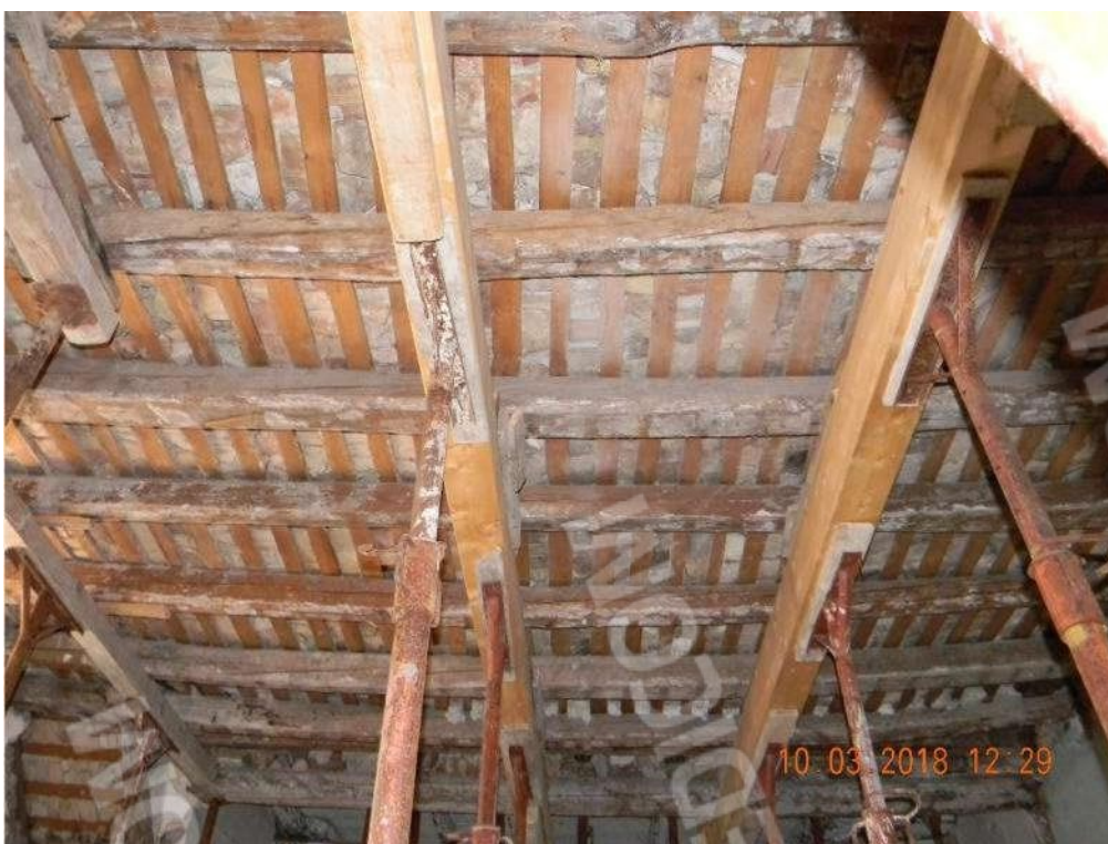
Foto 12 - Soffitto ligneo soprastante parte del vano