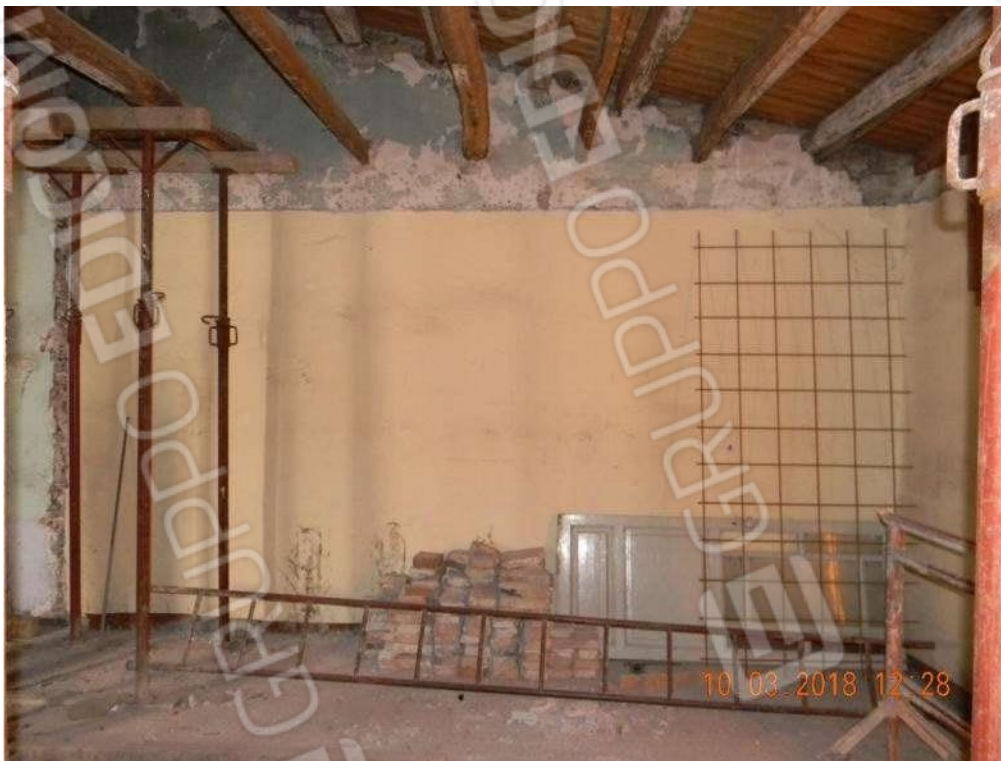
Foto 11 - Altro scorcio della parete ovest del vano n.2.