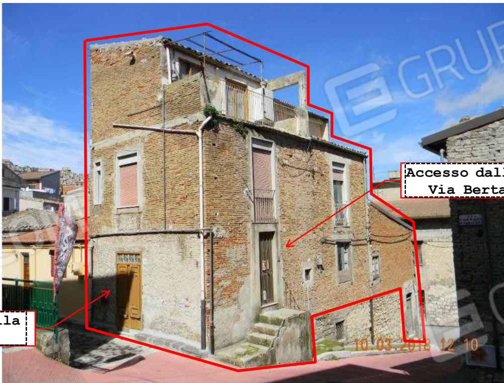
Foto 02 - Vista dall'incrocio tra Via Maddalena e Via Bertina