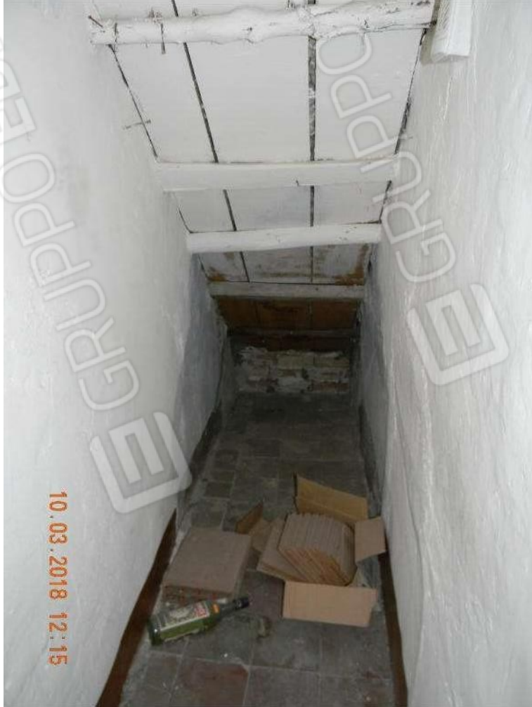
Foto 18 - Sottoscala.