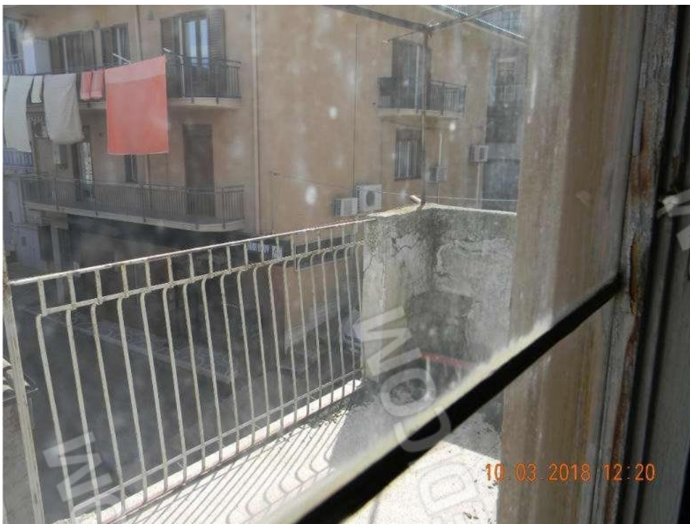
Foto 29 - Terrazzino.