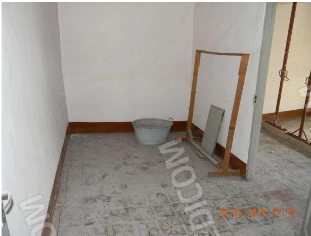
Foto 17 - Vano