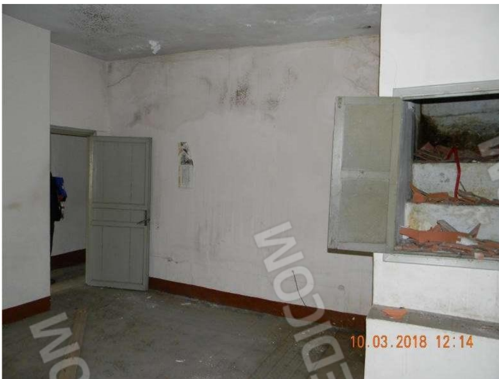
Foto 21 - Altro scorcio del vano n.5.