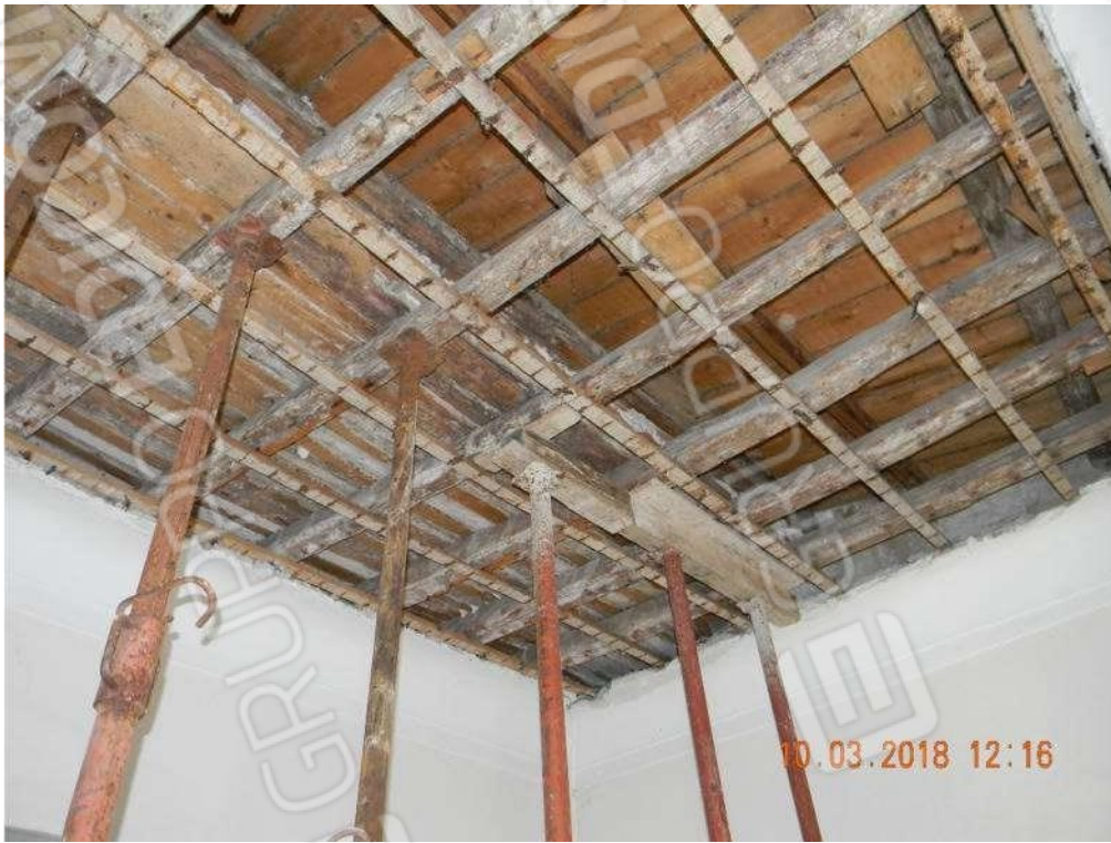
Foto 16 - Soffitto del vano n.3.