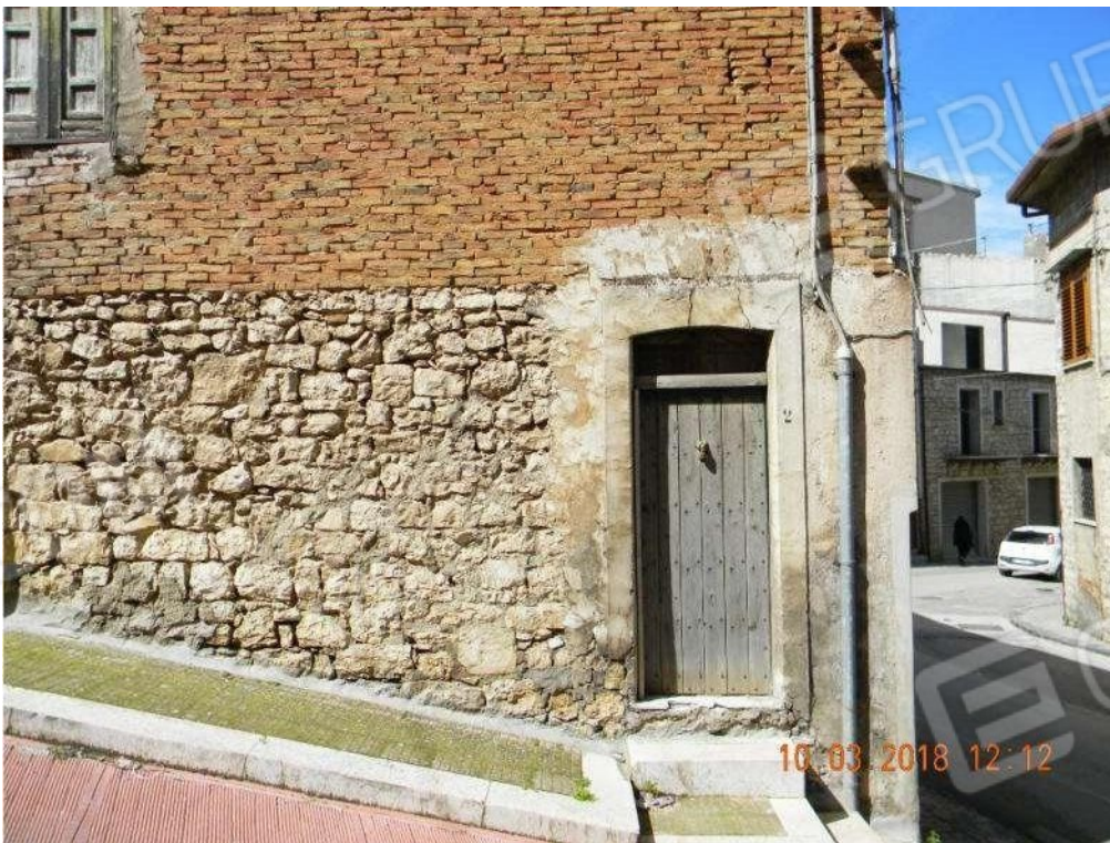
Foto 31 - Portone di ingresso al civ. n.2 della Via Berta. Essendo stata demolita la scala di accesso al piano soprastante a partire da tale ingresso, ad oggi tale apertura conduce soltanto ad un piccolo vano, pure incluso nella vendita, segnato in rosso nella planimetria catastale che segue, relativa al sub.14 della particella 1464 non oggetto, invece, della