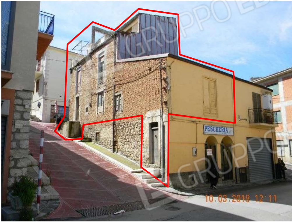
Foto 01 - Vista da Corso Umberto