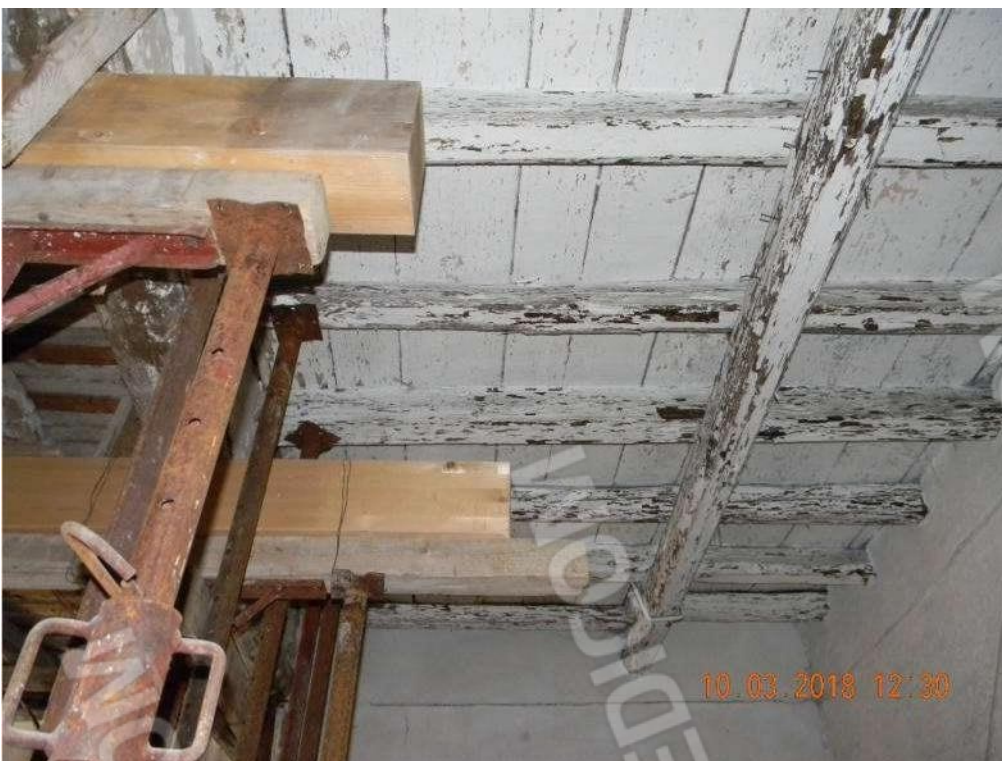
Foto 06 - Soffitto ligneo della zona di cui sopra.