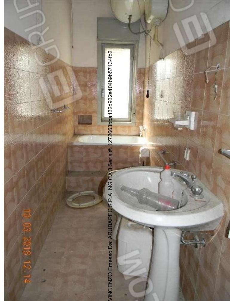
Foto 19 - Servizio