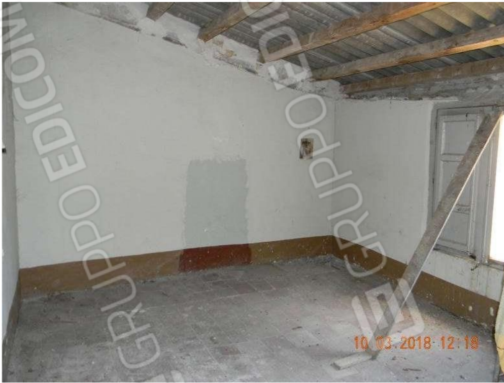
Foto 24 - Vano