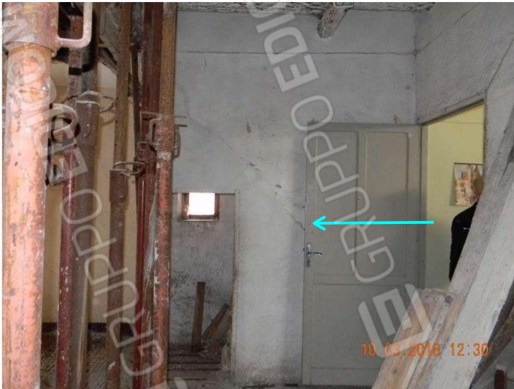
Foto 05 - Ingresso al vano n.2.