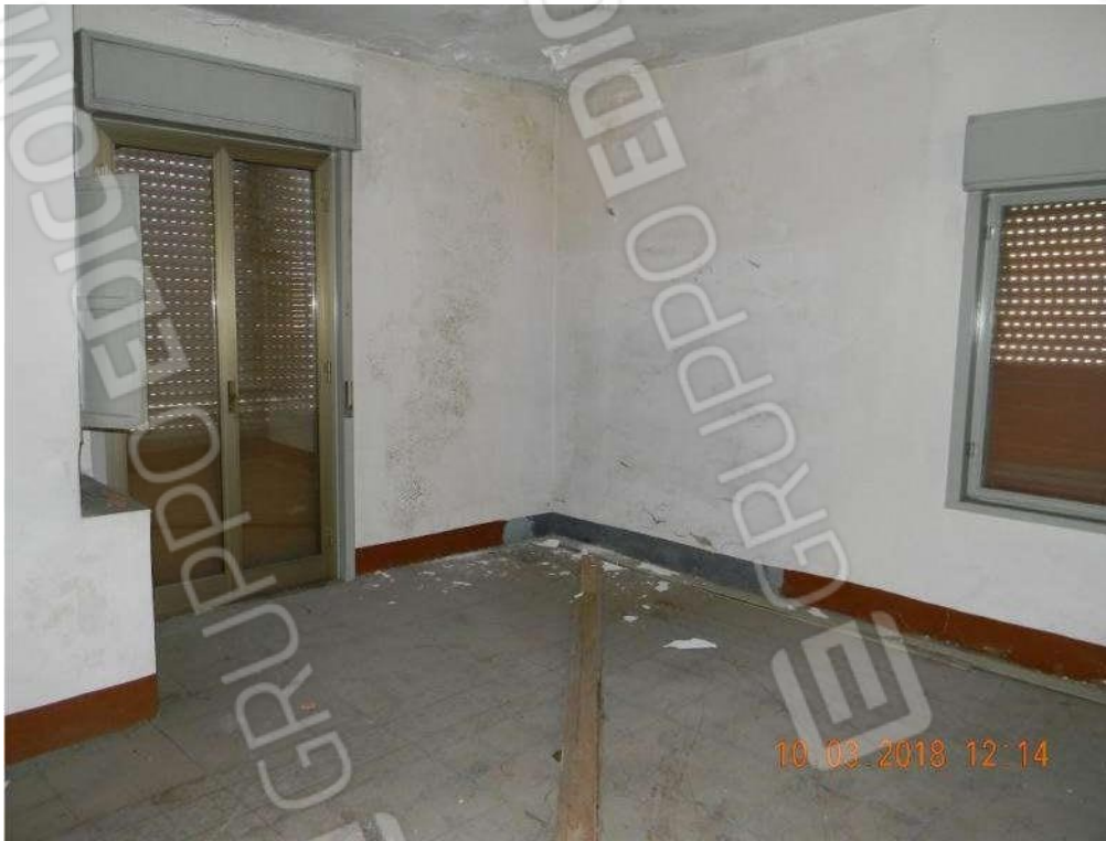
Foto 20 - Vano