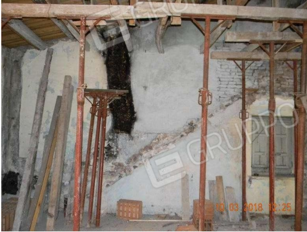
Foto 08 - Scorcio della parete est del vano