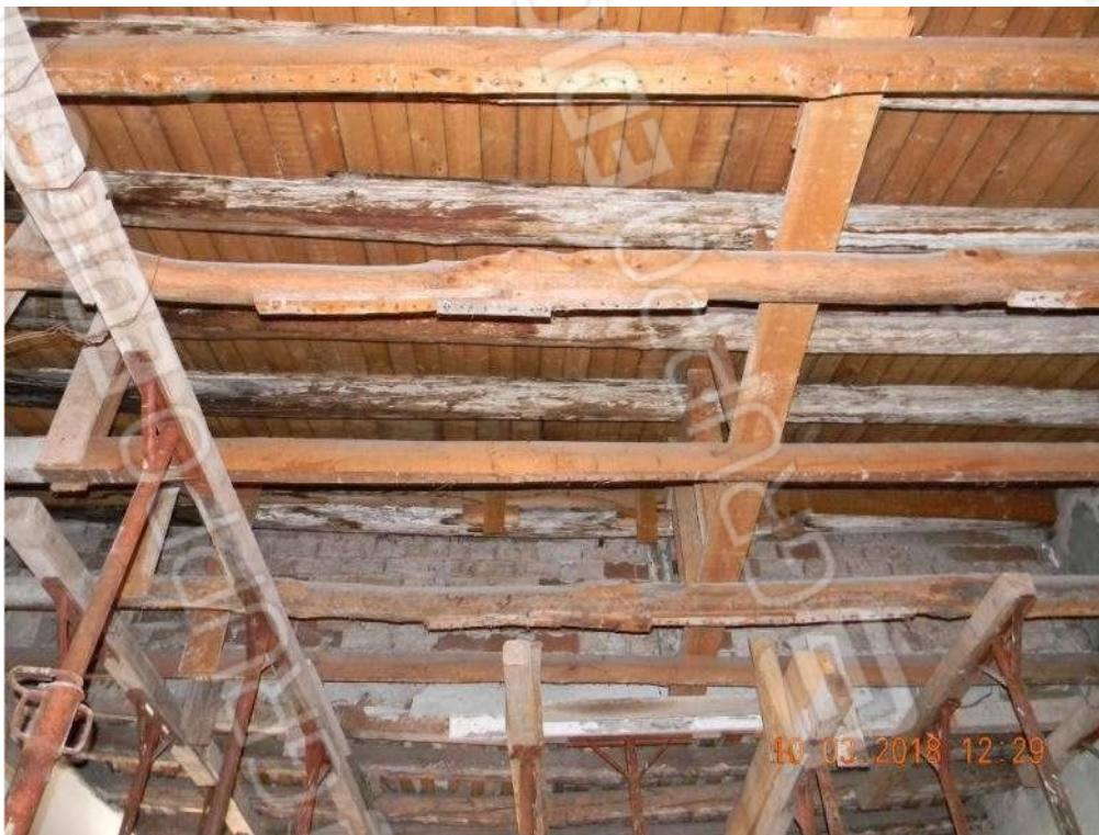
Foto 13 - Falda a struttura lignea soprastante la porzione del vano n.2 prospiciente C.so Umberto