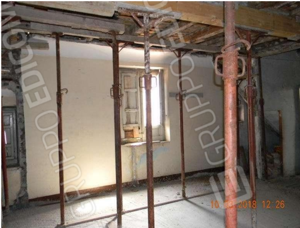
Foto 09 - Altro scorcio della parete est del vano n.2.