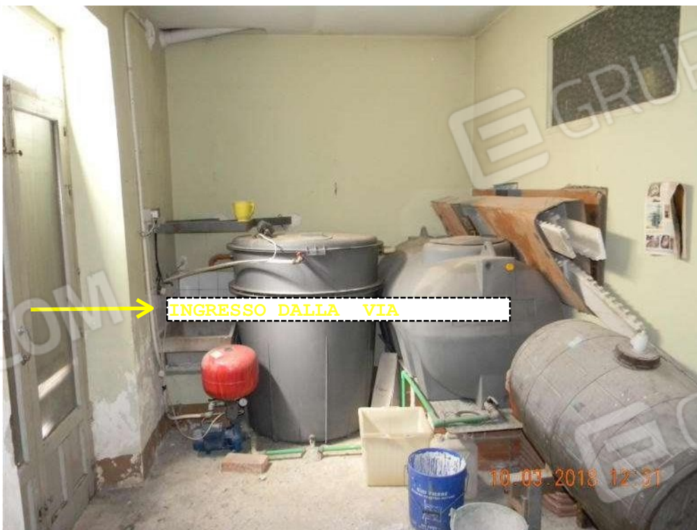
Foto 04 - Altro scorcio del vano n.1.