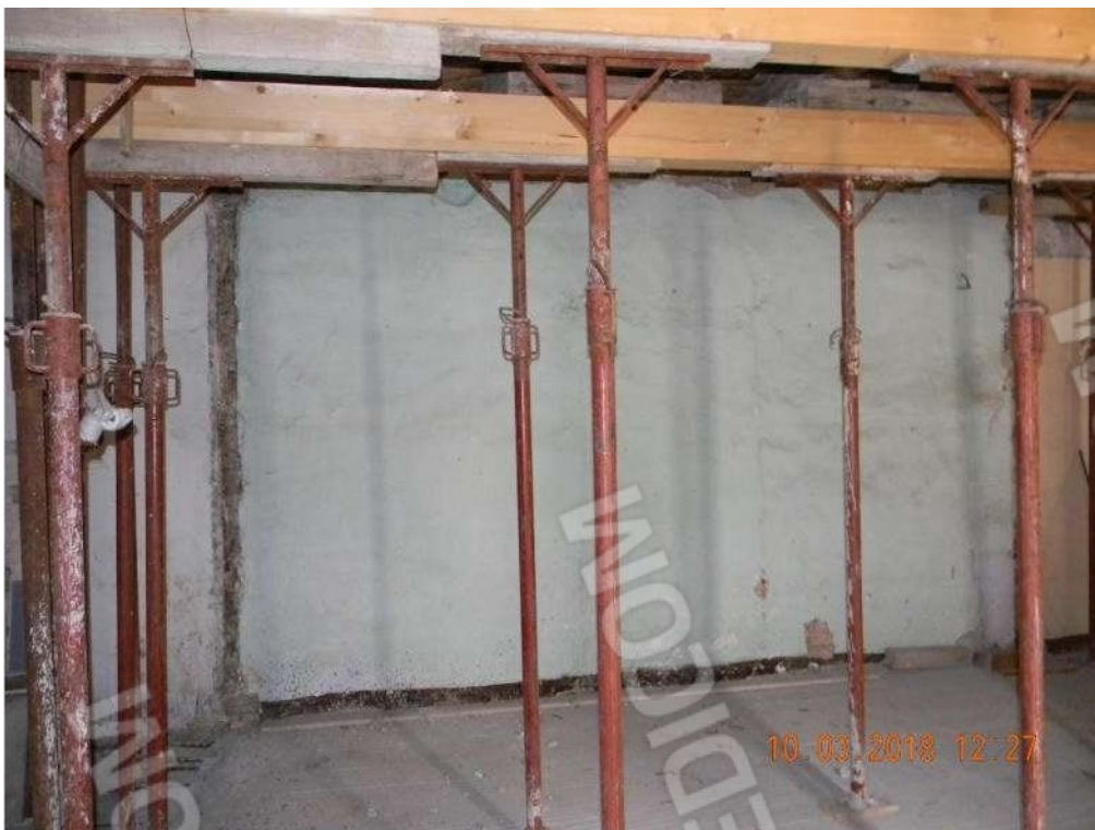
Foto 10 - Scorcio della parete ovest del vano