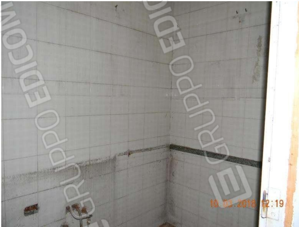
Foto 28 - Altro scorcio del cucinino.