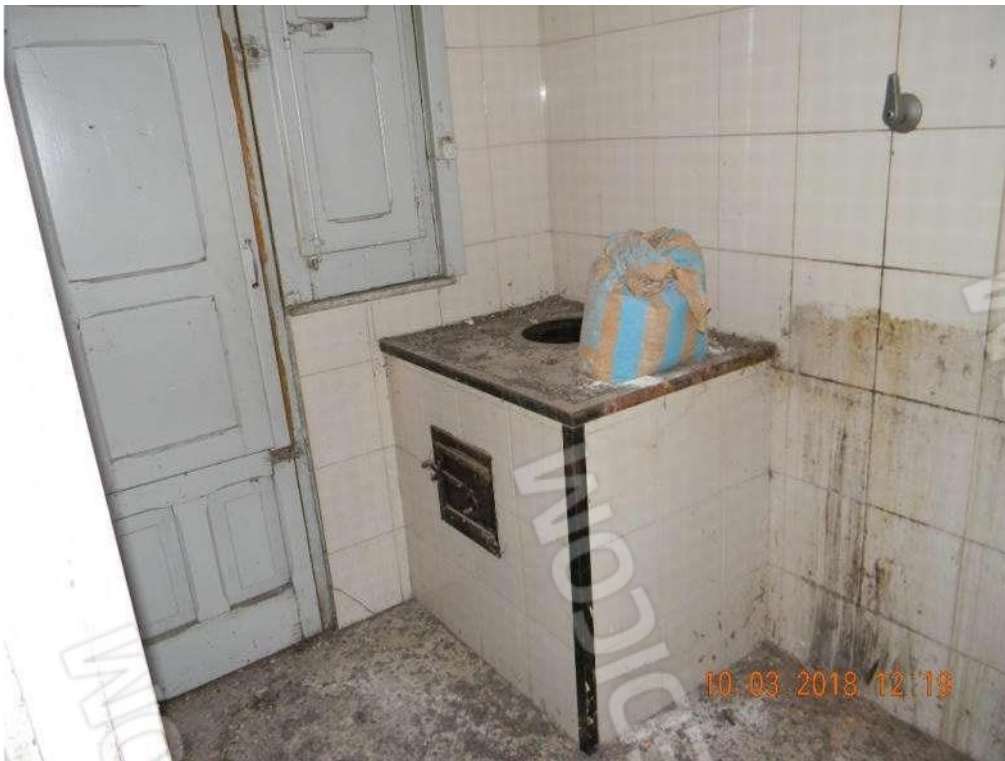
Foto 27 - Cucinino.