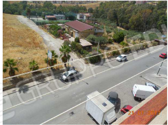
Figura 19. Vista su viale Sicilia da balcone camera da letto