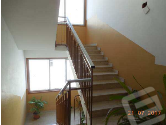
Figura 8. Vano scala condominiale