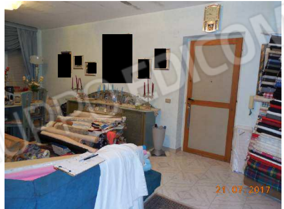
Figura 10. Ingresso e salotto