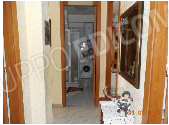
Figura 14. Zona corridoio. Notasi in fondo bagno di servizio