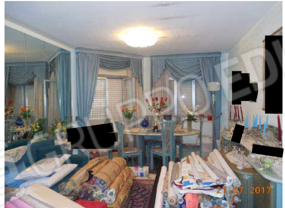
Figura 11. Salotto