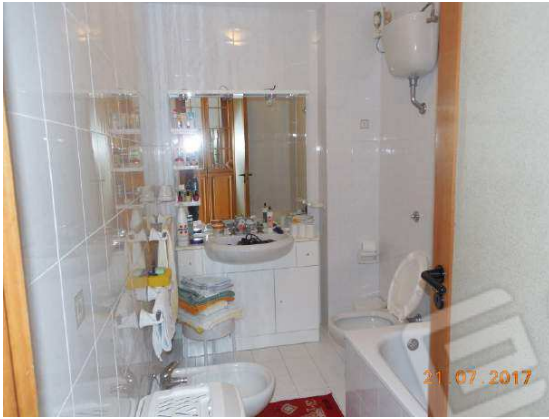
Figura 16. Bagno principale