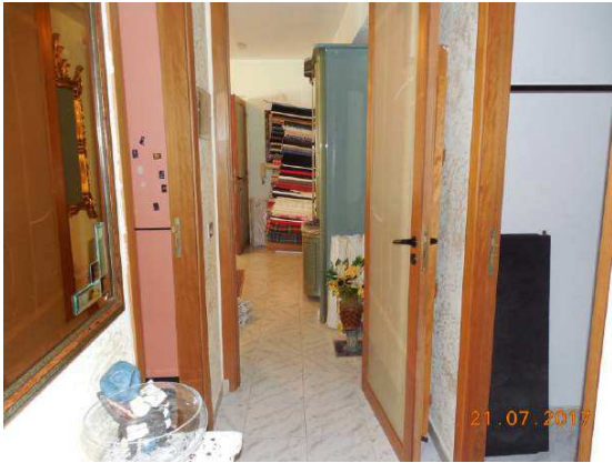
Figura 13. Zona corridoio. Notasi in fondo ingresso abitazione