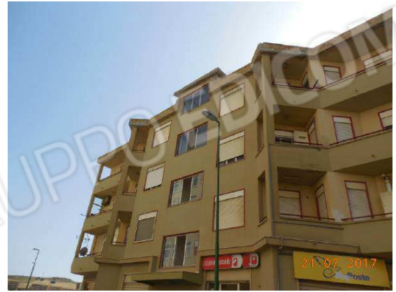
Figura 3. Vista prospettica facciata principale