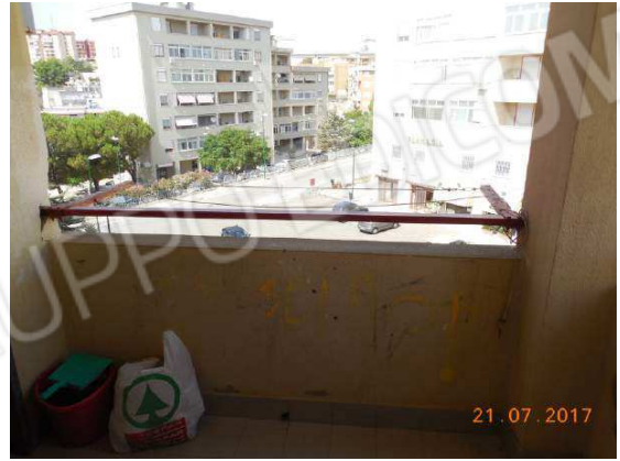
Figura 18. Vista su vie Barone Celsa e Butera da balcone salotto e cucina