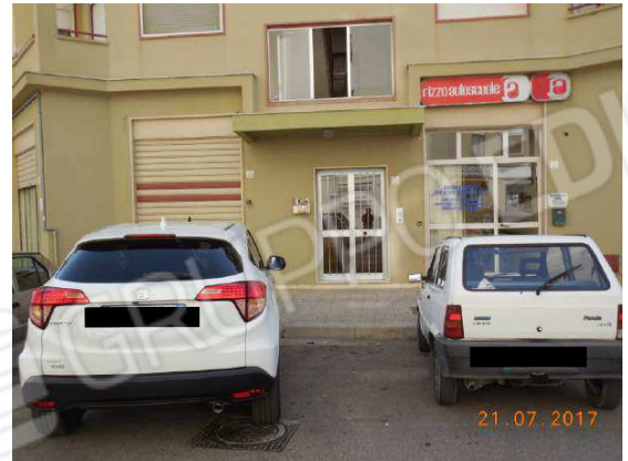
Figura 4. Particolare zona d'ingresso fabbricato