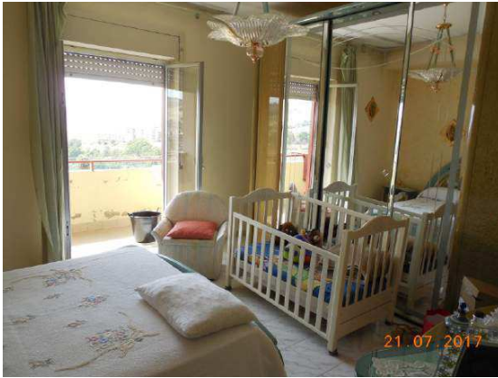
Figura 17. Camera da letto