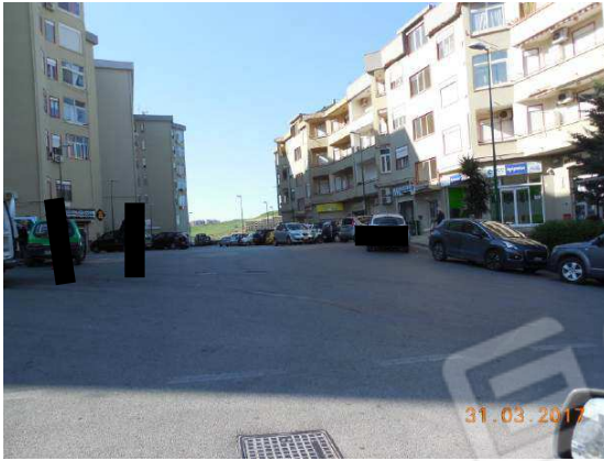
Figura 1. Zona d'accesso via Barone Celsa