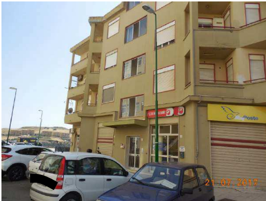
Figura 2. Vista prospettica facciata principale