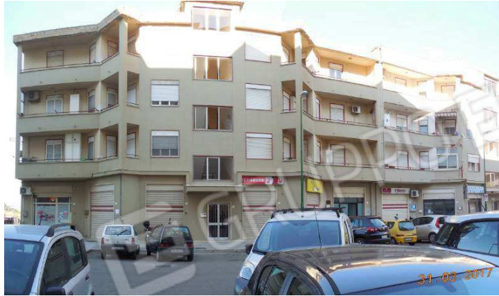
Figura 5. Veduta d'insieme complesso immobiliare