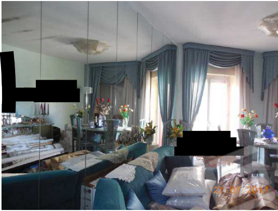
Figura 12. Particolare salotto