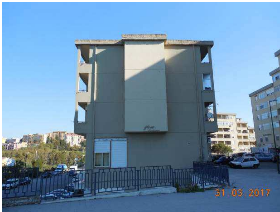
Figura 6. Prospetto sud

Firmato Da: CALAMITA ANGELO Emesso Da: ARUBAPEC S.P.A. NG CA 3 Serial#: 4a855500ae9d4b15e6c4ea77ec242ff