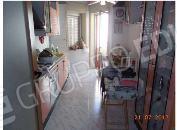
Figura 15. Cucina