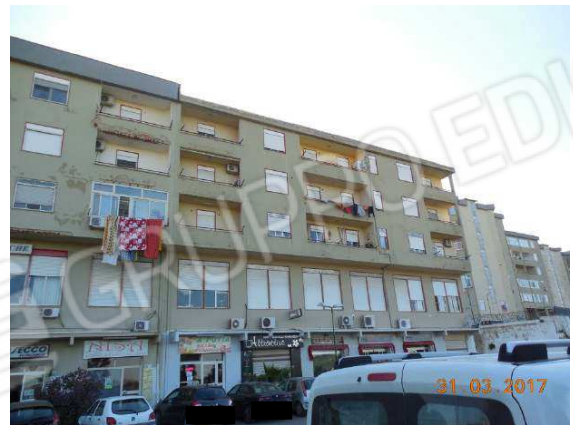
Figura 7. Prospetto ovest su viale Sicilia

Firmato Da: CALAMITA ANGELO Emesso Da: ARUBAPEC S.P.A. NG CA 3 Serial#: 4a855500ae9d4b15e6c4ea77ec242ff