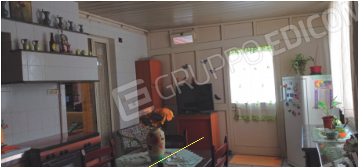
Cucina edificata sul terrazzo, non Sanabile da Demolire.