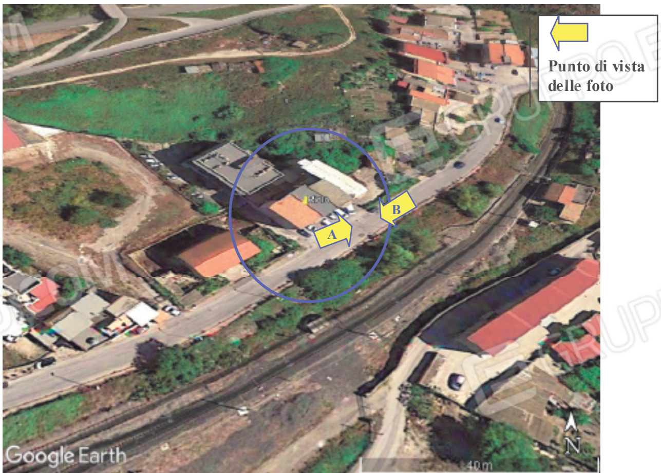
Contesto urbanistico nelle vicinanze dell'Appartamento di via Matarrella ad Agrigento