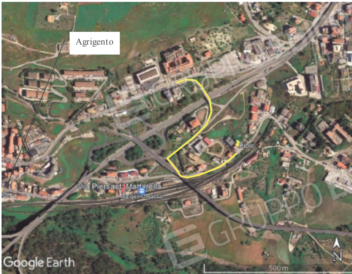
Percorso stradale per raggiungere l'Immobile di via Matarrella, n. 185 ad Agrigento