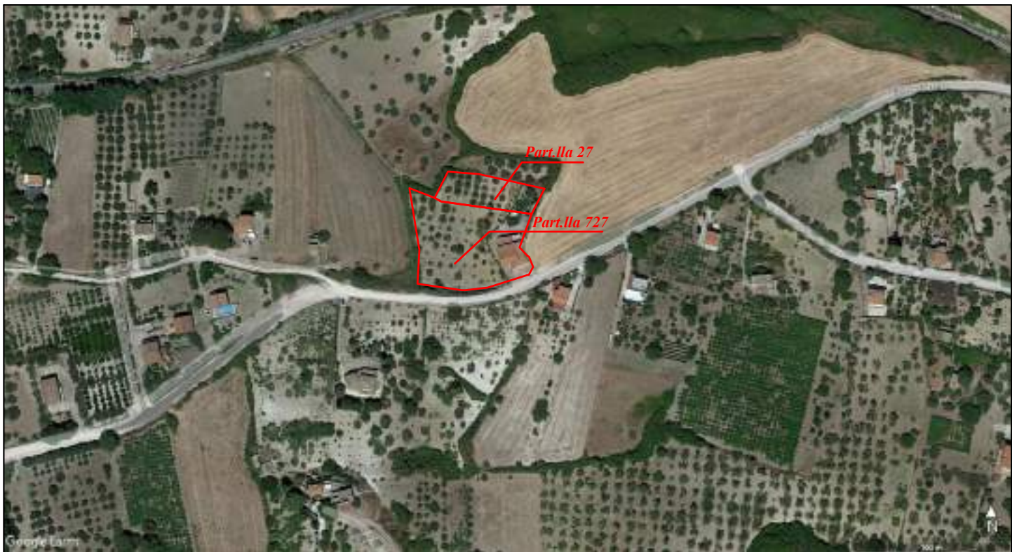
Estratto Mappa Catastale e Foto Aerea della zona Terreni ubicati a Racalmuto (AG) C.da Fico scn in Catasto Foglio 31 Part.lla 27 - 727;