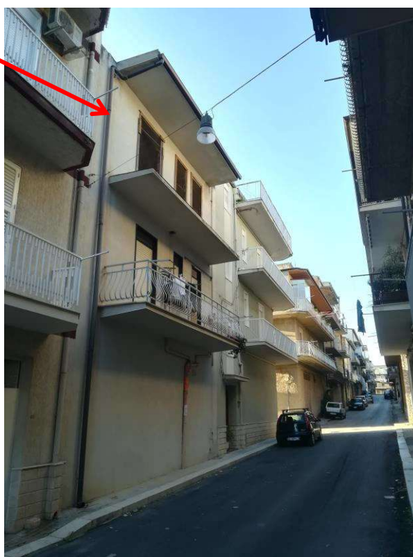
Lato via Como