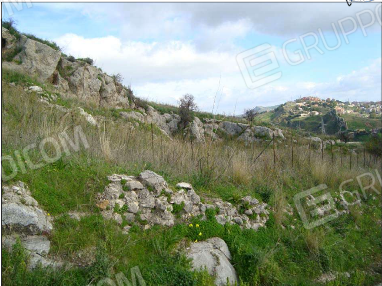
Terreno adibito a corte fg. 89 part. 46