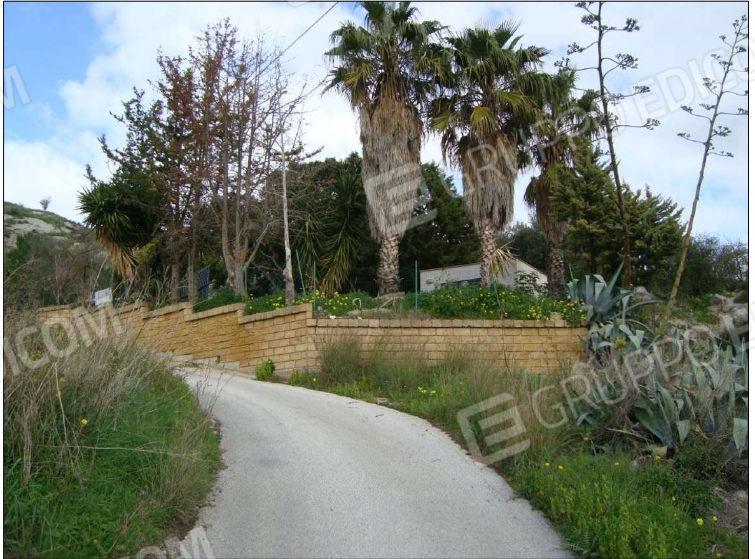
Recinzione della corte fg. 89 part. 556