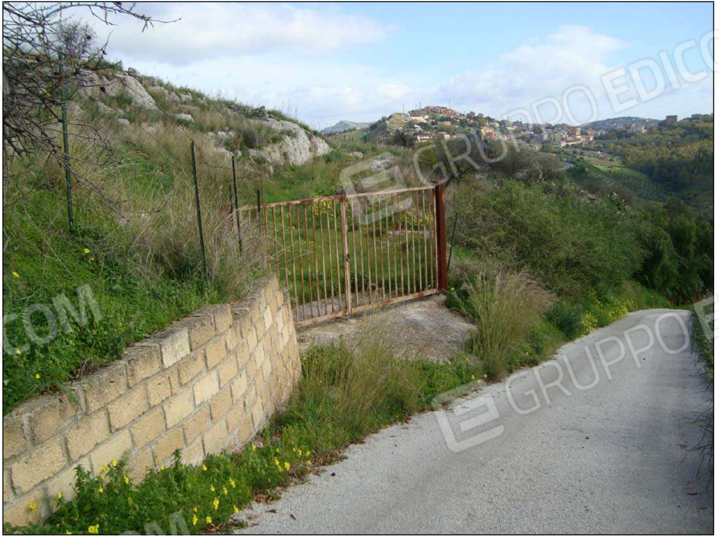
Cancello d'ingresso per il Terreno adibito a corte fg. 89 part. 46