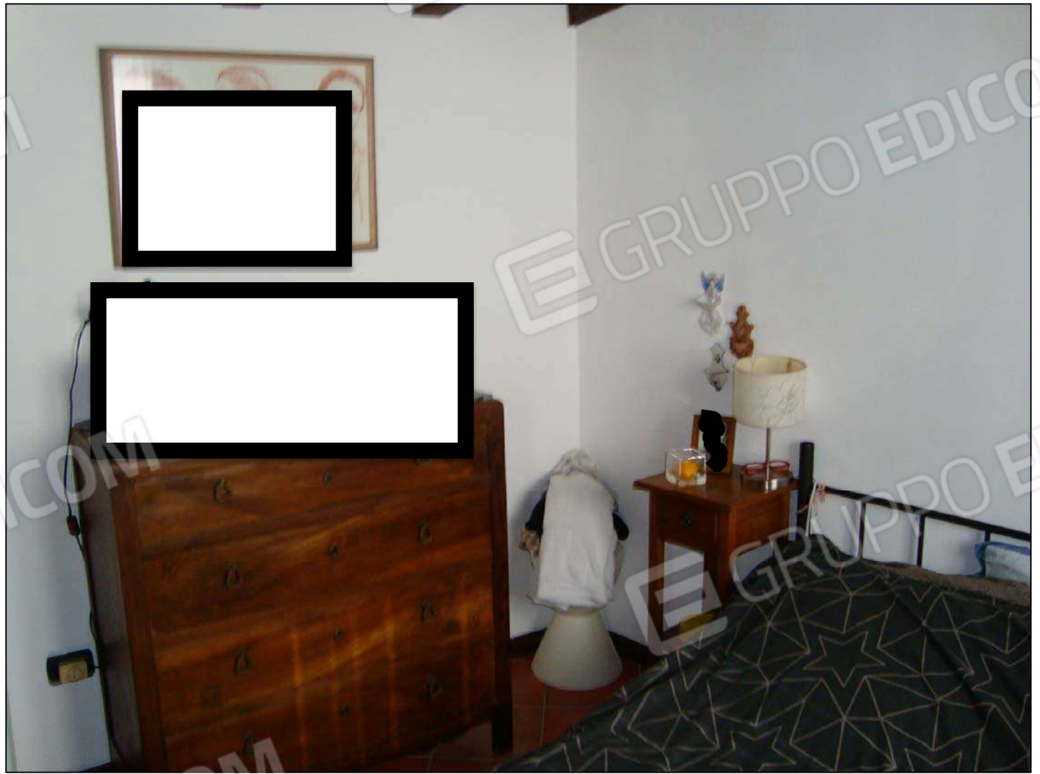
Camera da letto P.T.