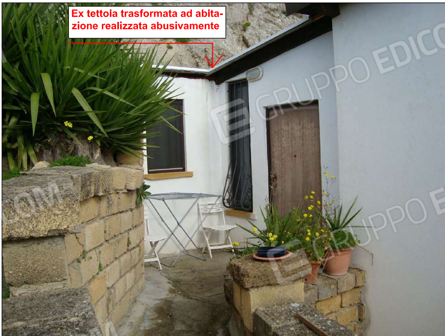
Tettoia trasformata ad abitazione realizzata abusivamente

Ex tettoia trasformata ad abitazione realizzata abusivamente