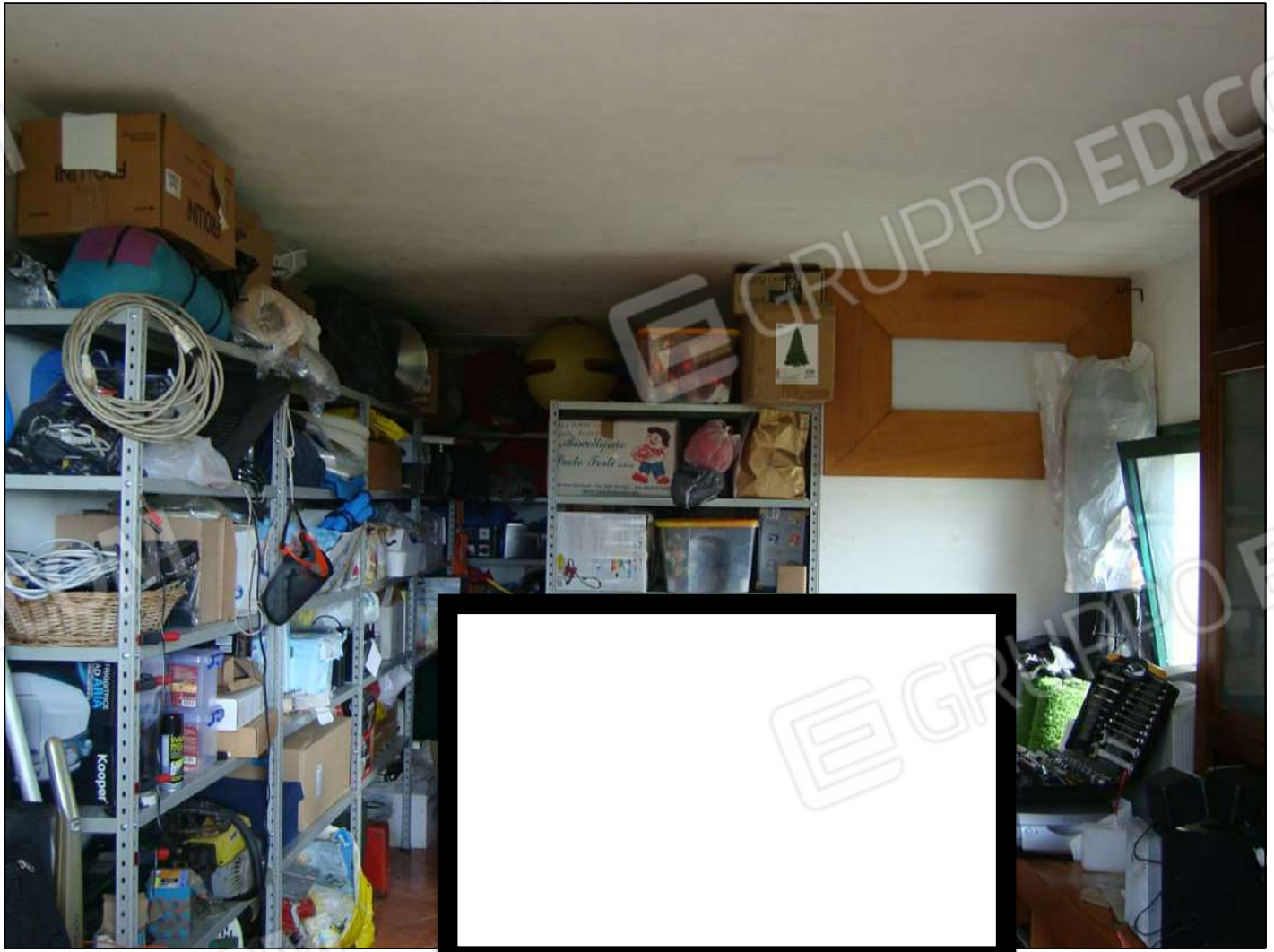
Vista interna magazzino