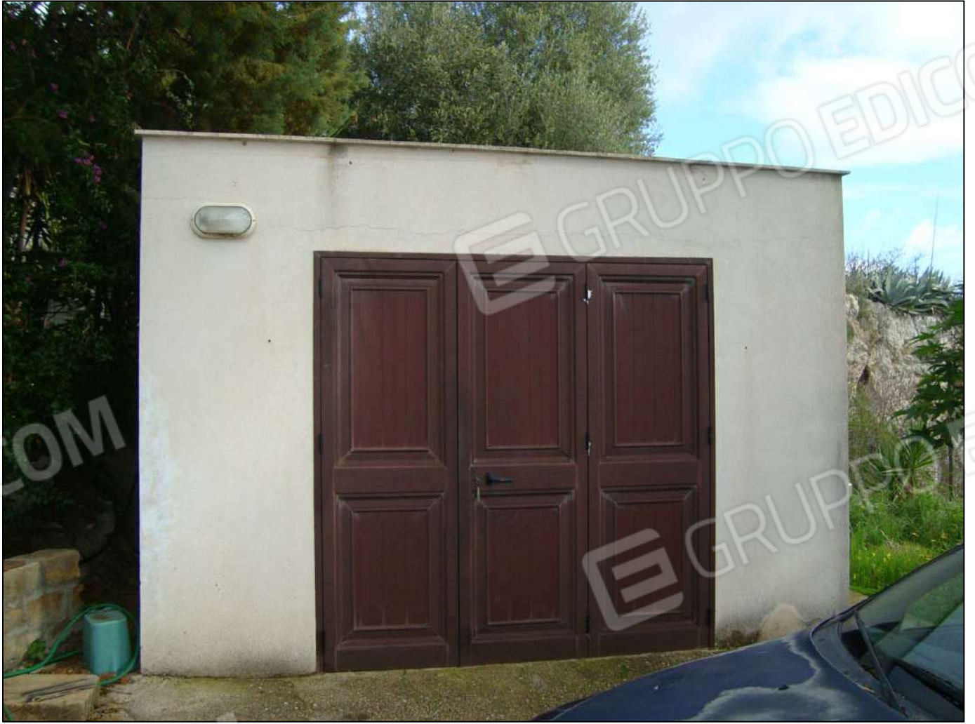
Prospetto magazzino principale s/o