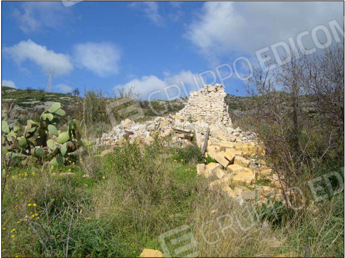
Rudere del ex F.R. fg. 89 part. 47