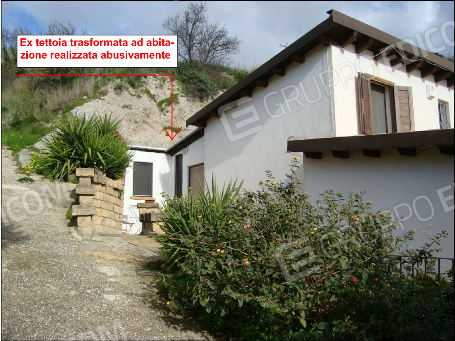
Prospetto lato EST

Stampa professionale: ALFONSO CAVALERI , PROVINCIA DI AGRIGENTO , N. 1943