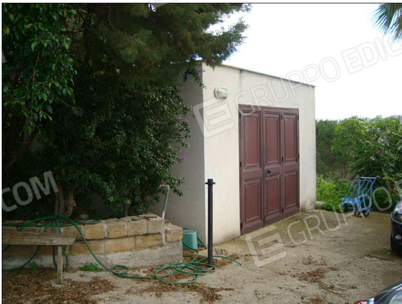
Prospetto magazzino principale s/o