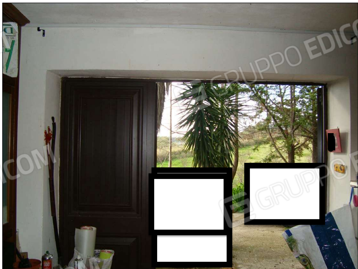
Vista interna magazzino