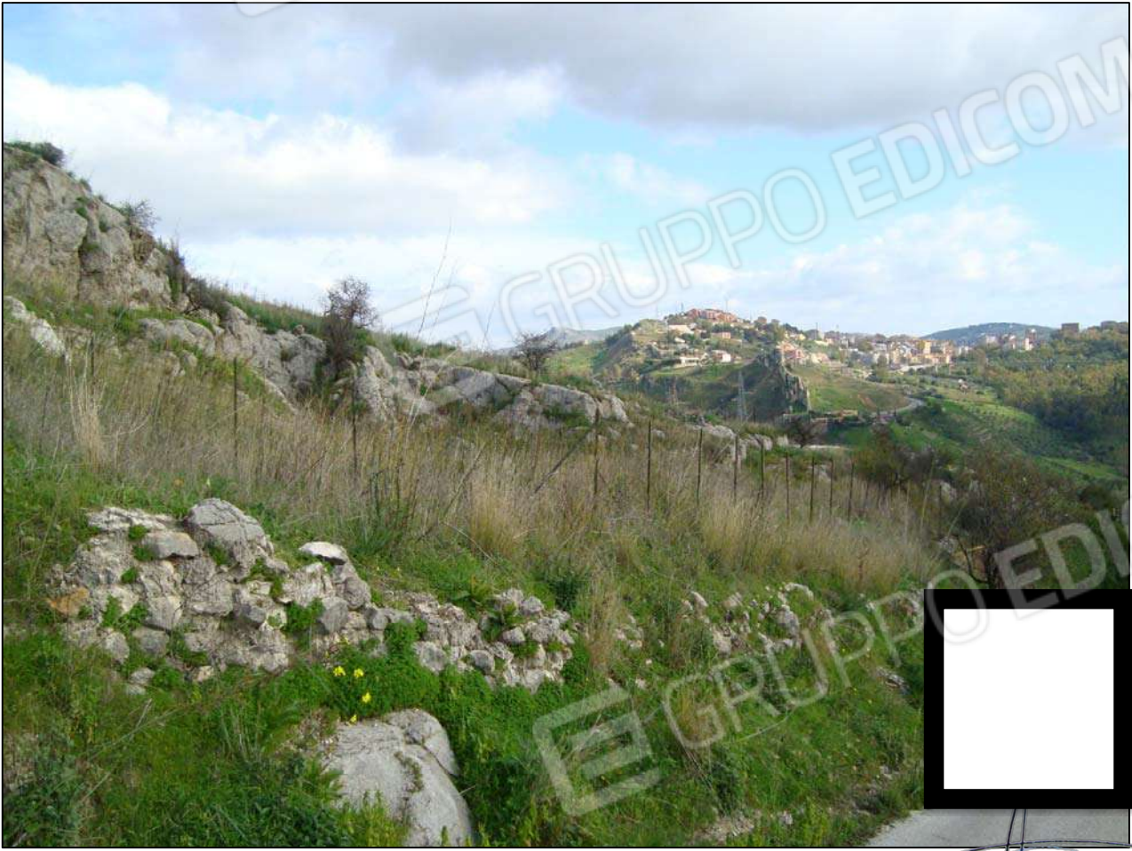
Terreno adibito a corte fg. 89 part. 46