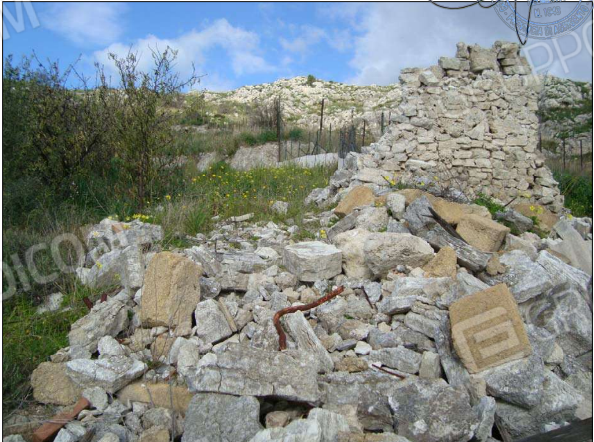
Rudere del ex F.R. fg. 89 part. 47