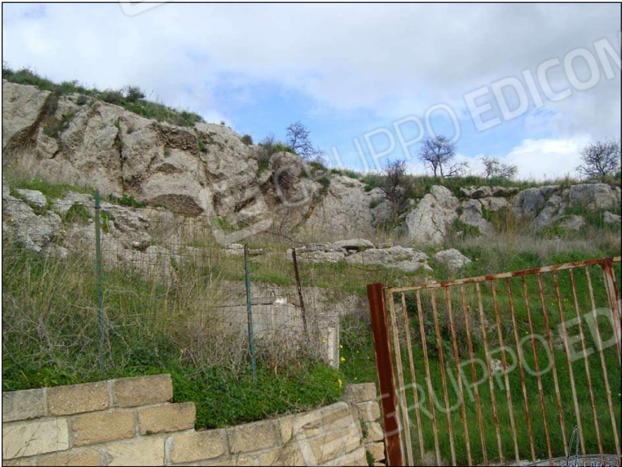
Terreno adibito a corte fg. 89 part. 46