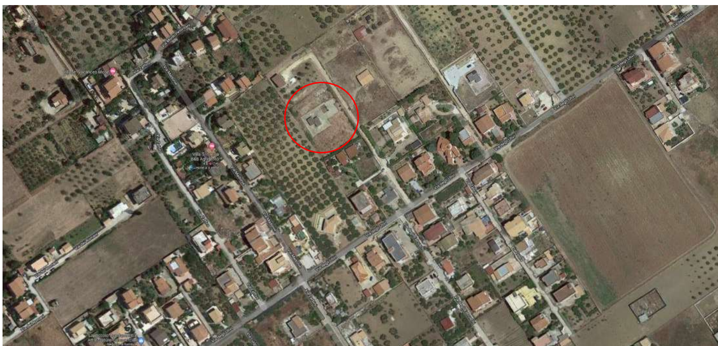
ORTOFOTO Lotto 1-2