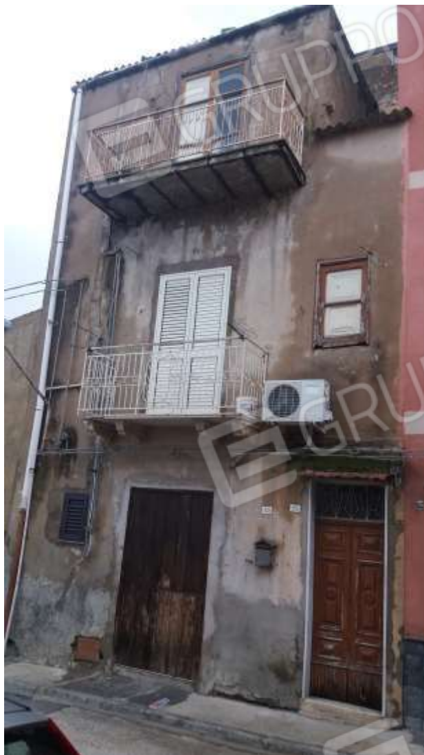
FOTO 1 - Veduta dell'unità immobiliare, sito in Via Cangiamila 53