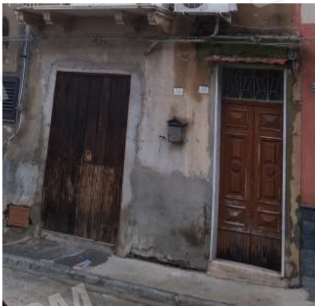
FOTO 2 - Veduta del portone d'ingresso