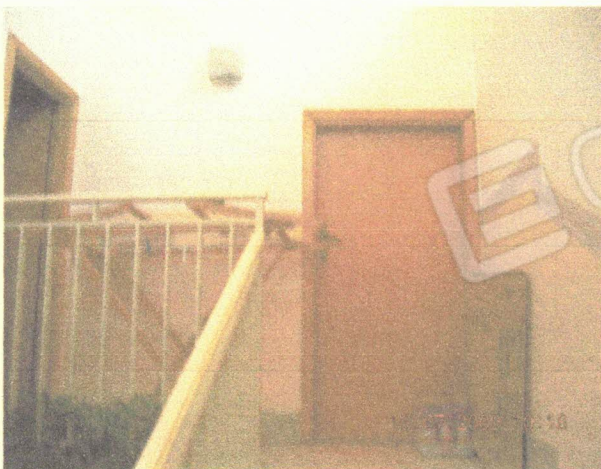
Foto 13 Portoncino d'ingresso.