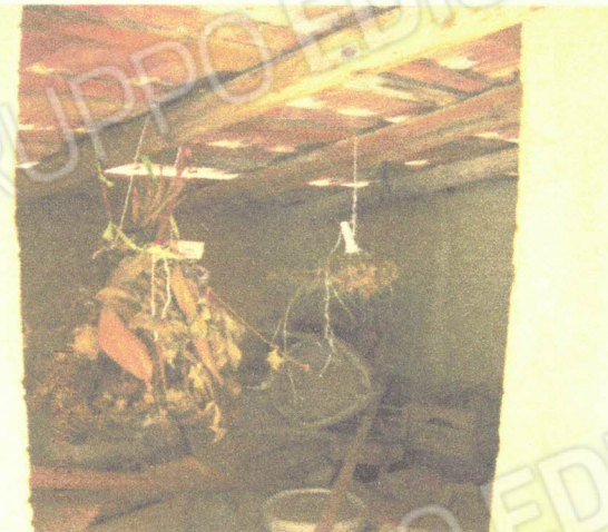
Foto 14 vano sottotetto