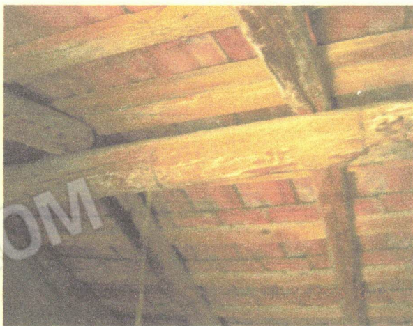
Foto 15 particolare copertura a falde del sottotetto