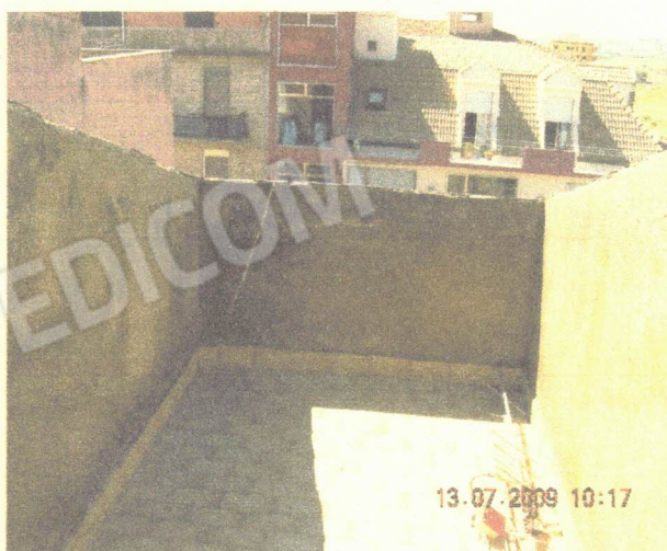
Foto 10 Particolare del terrazzino