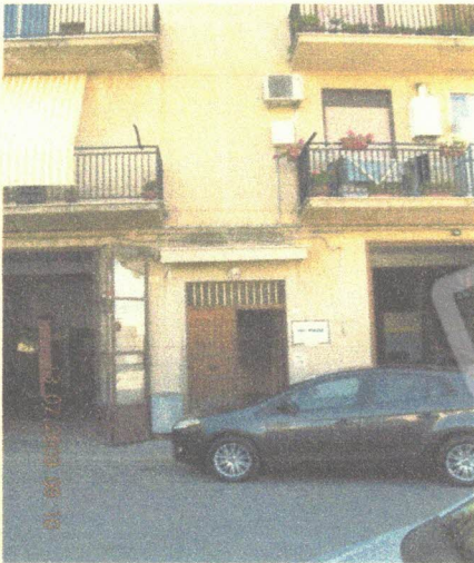
Foto 1 Prospetto ovest su Via Sergio Leone