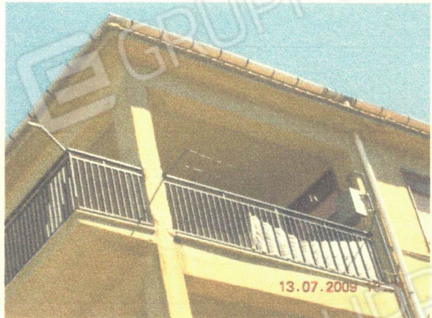
Foto 4 Particolare del terrazzo