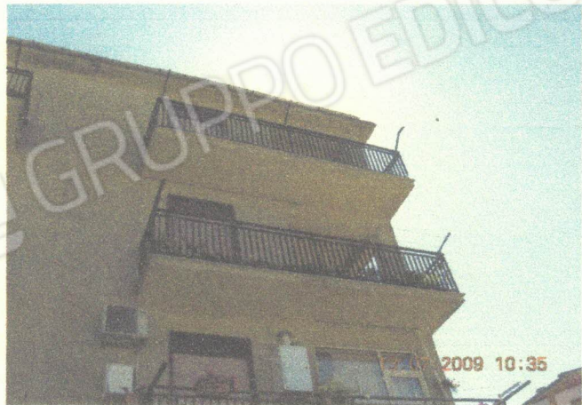
Foto 2 Prospetto angolo tra la Via S. Leone e la Via S. Vincenzo