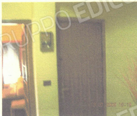
Foto 8 Portoncino d'ingresso.