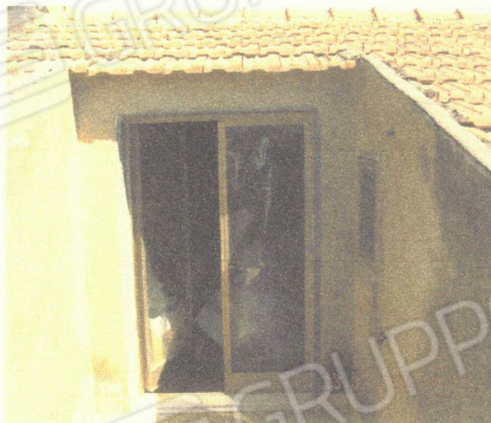
Foto 16 particolare infisso del vano sottotetto