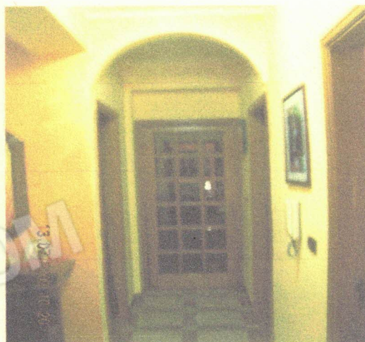
Foto 9 Particolare corridoio