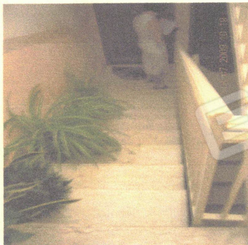
Foto 7 Particolare scale.