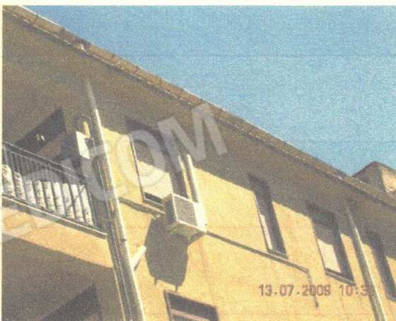
Foto 5 Prospetto sulla Via S. Vincenzo