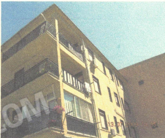
Foto 3 Particolare angolo sud- ovest