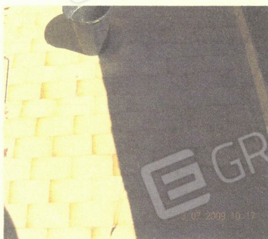
Foto 11 Piastrelle in ceramica