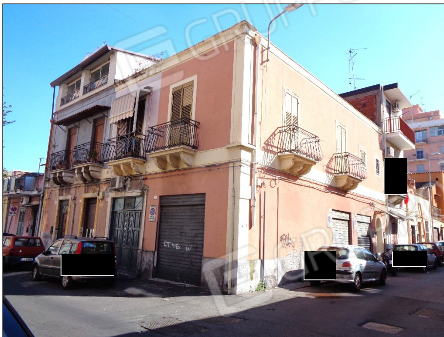
FOTO N° 1 – COMUNE DI CATANIA, VIA ACITREZZA ANGOLO VIA TIMOLEONE