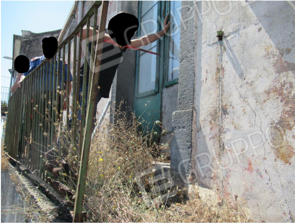
Foto n° 1 – Apertura dell'immobile ad opera del fabbro in presenza dei Carabinieri –