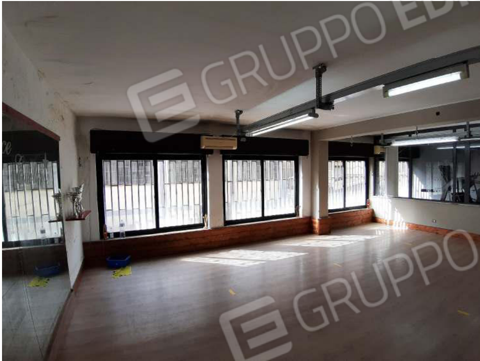
FOTO 26 - Sala da ballo 2