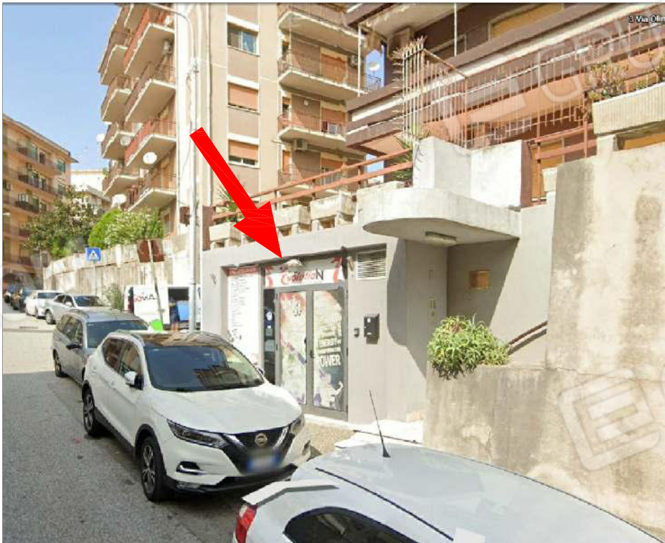
FOTO - Ingresso via Olimpia 4/a