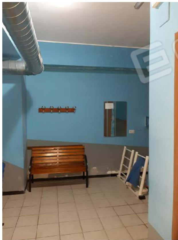
FOTO 23 - Spogliatoio 2