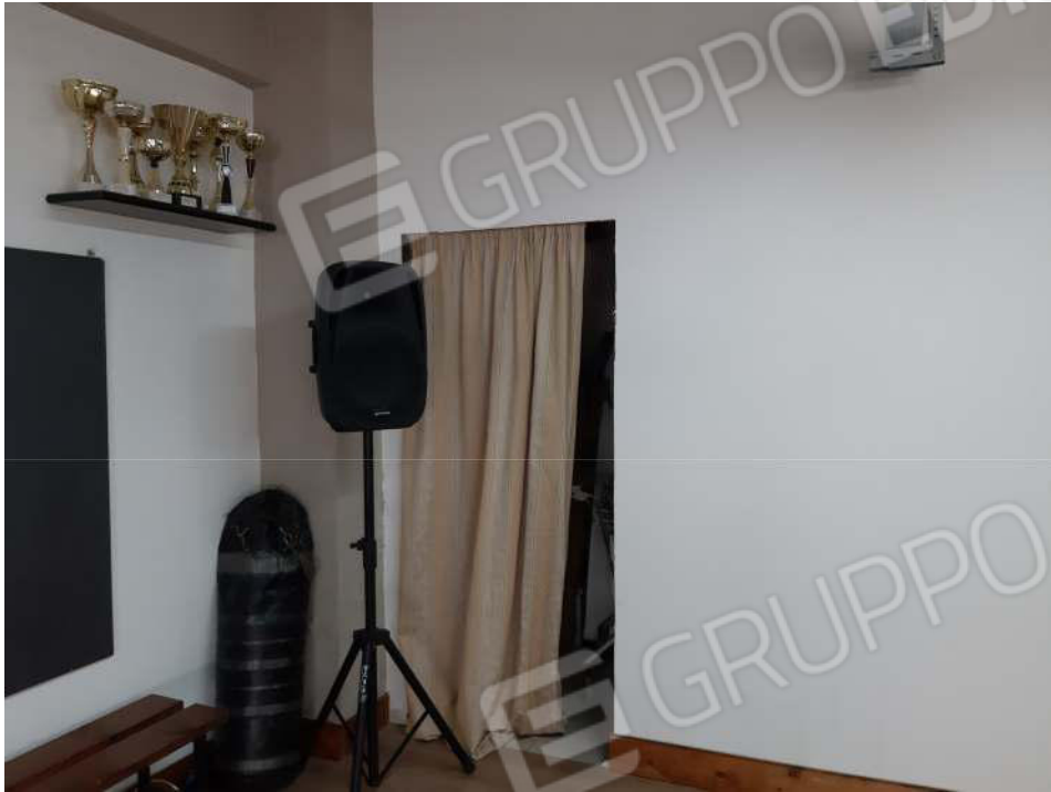
FOTO 32 - Ripostiglio