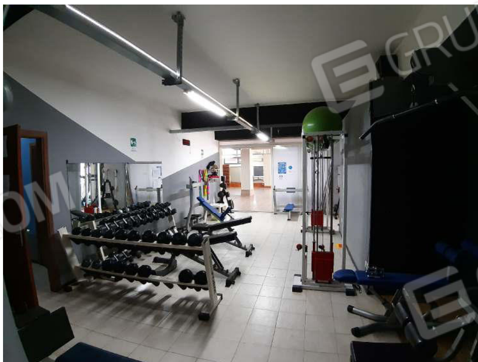
FOTO 15 - Sala attrezzi