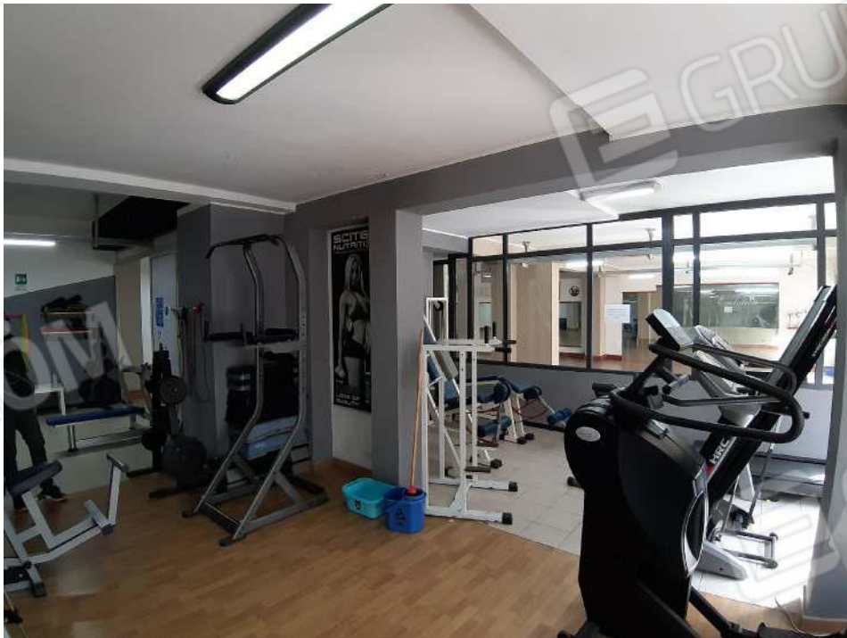
FOTO 21 - Sala attrezzi