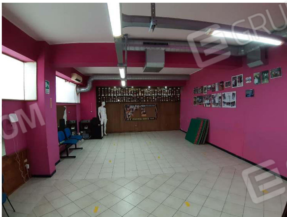
FOTO 13 - Sala da ballo 1