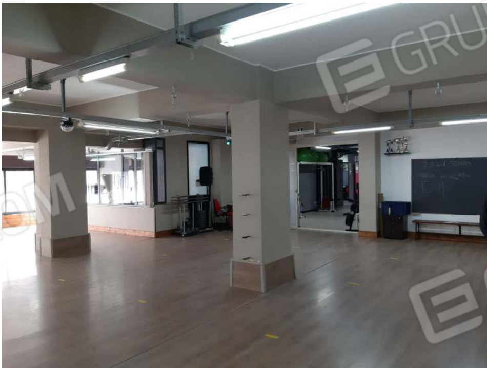
FOTO 29 - Sala da ballo 2