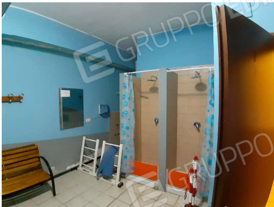
FOTO 24 - Docce spogliatoio 2