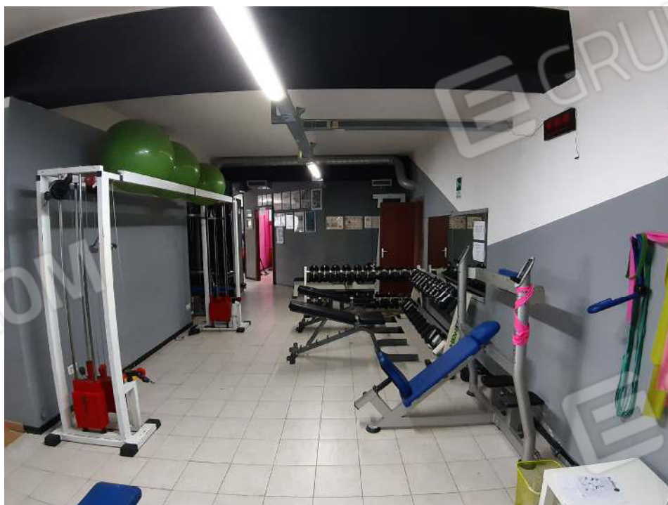
FOTO 17 - Sala attrezzi