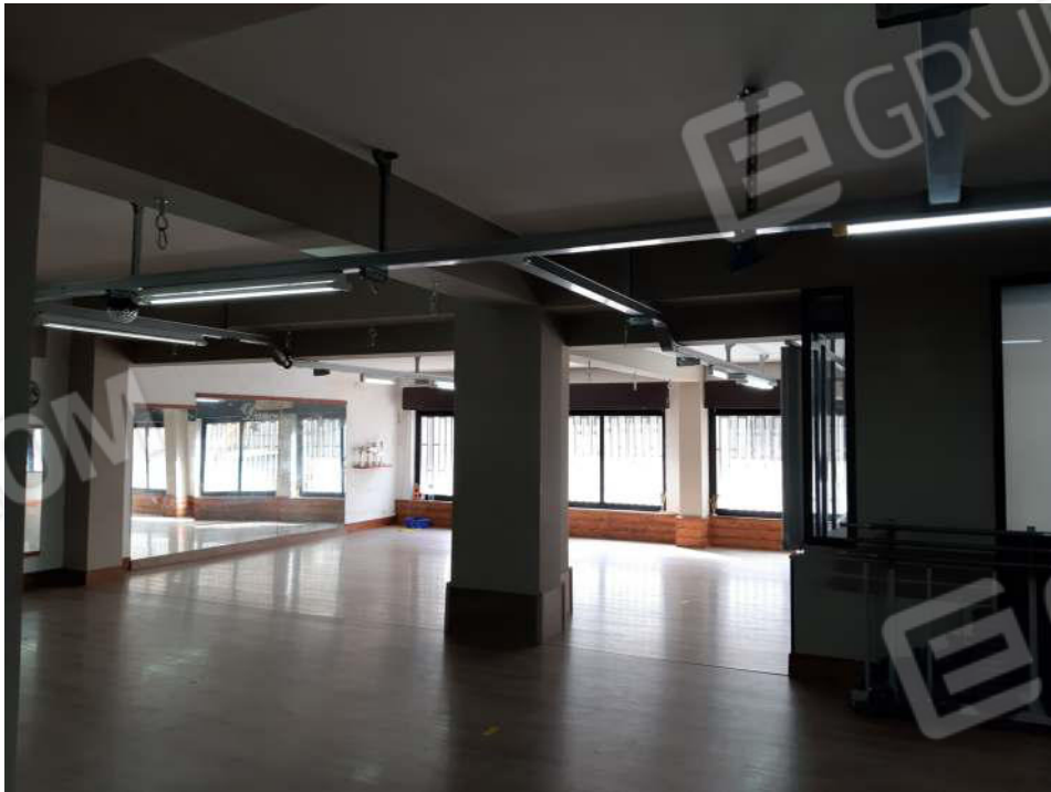
FOTO 31 - Sala da ballo 2