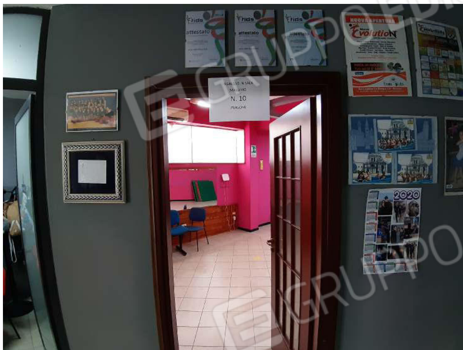
FOTO 12 - Sala da ballo 1