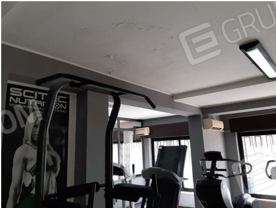
FOTO 19 - Sala attrezzi