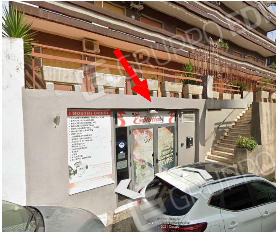
FOTO - Ingresso via Olimpica 4/a