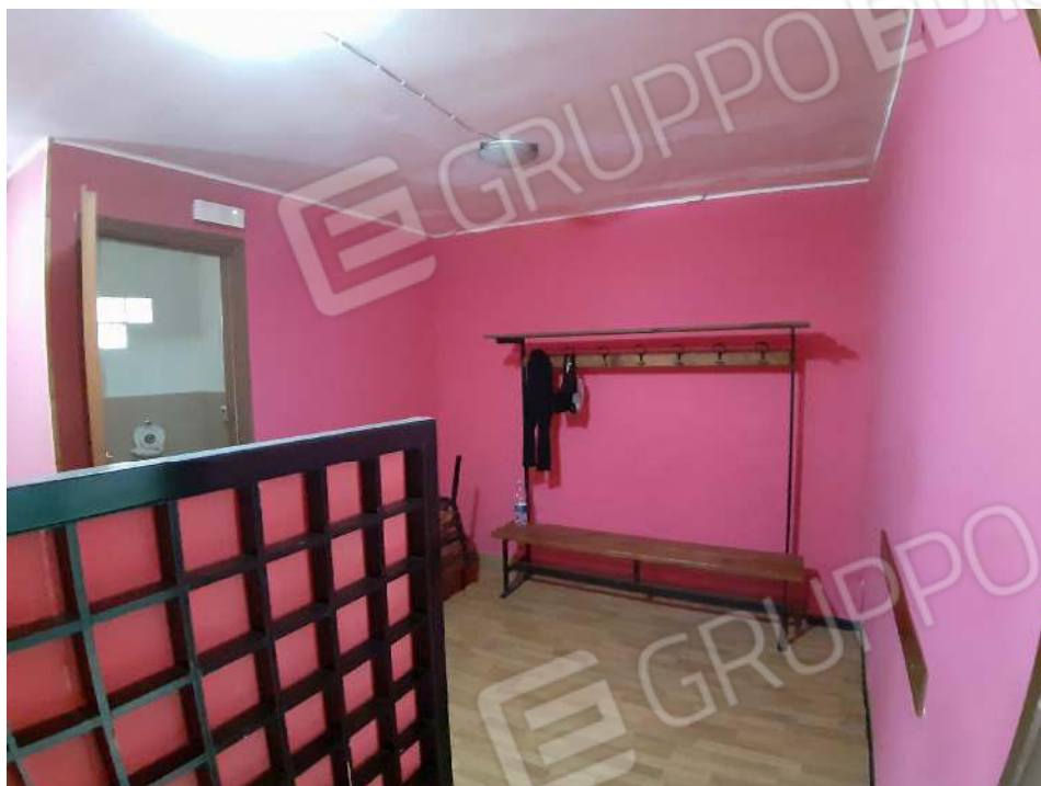
FOTO 7 - Spogliatoio 1