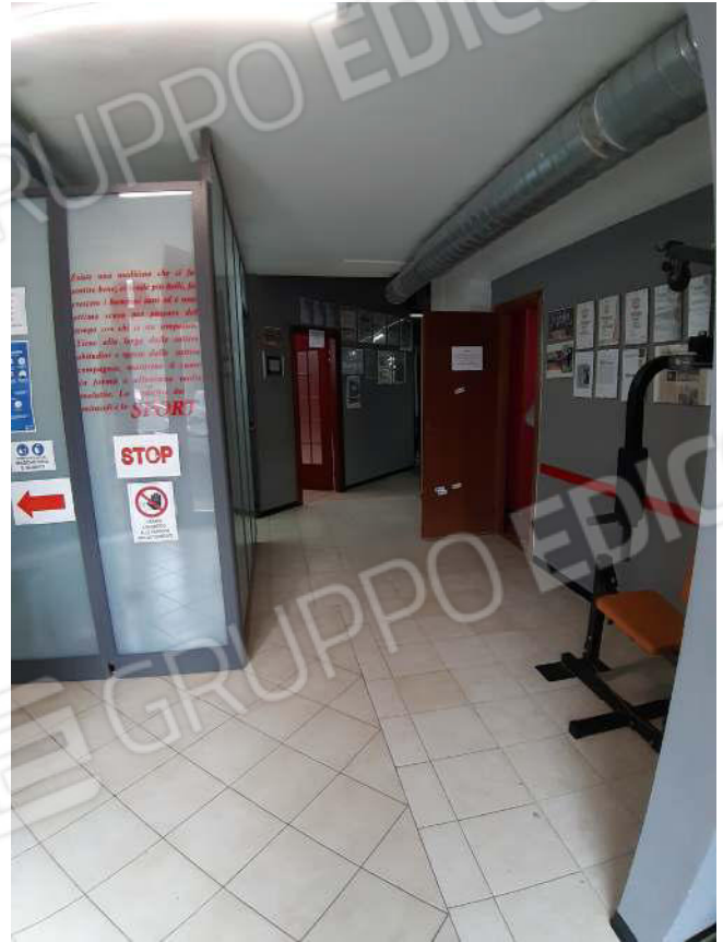
FOTO 3 - Ingresso