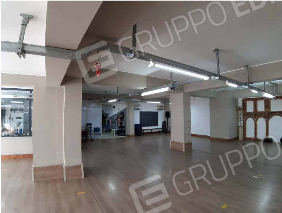
FOTO 28 - Sala da ballo 2