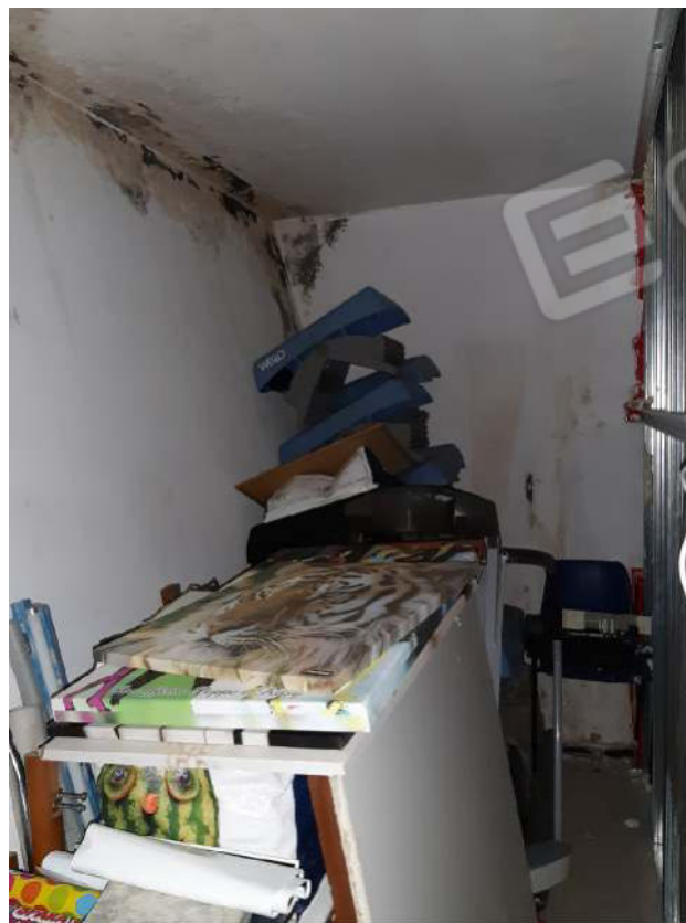
FOTO 33 - Ripostiglio