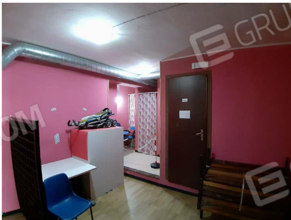
FOTO 8 - Spogliatoio 1