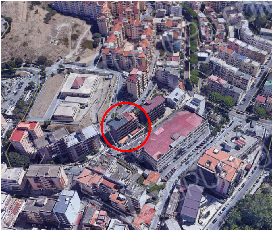
FOTO SATELLITARE Palazzina B - San Licandro Residence