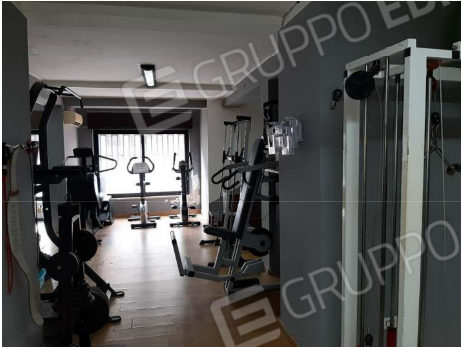
FOTO 18 - Sala attrezzi