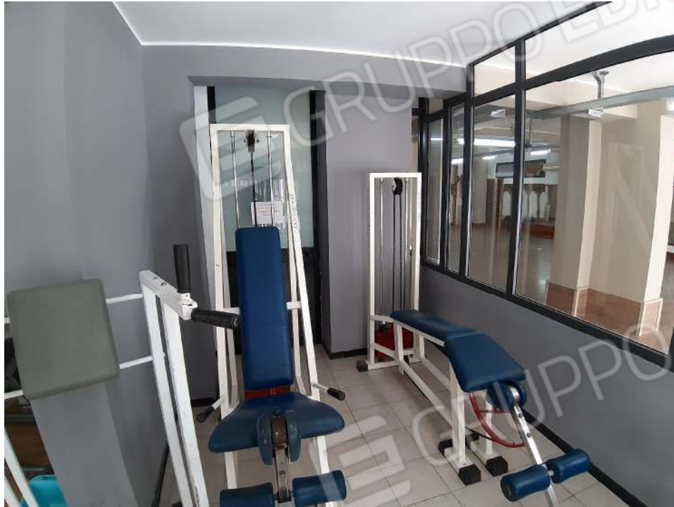
FOTO 22 - Sala attrezzi