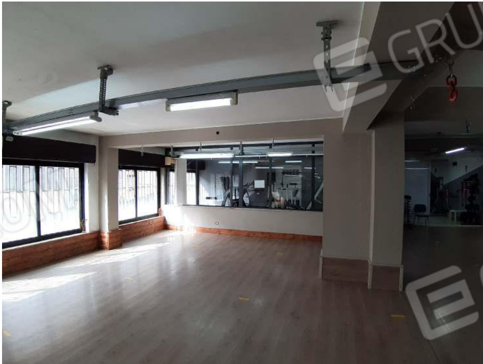
FOTO 27 - Sala da ballo 2