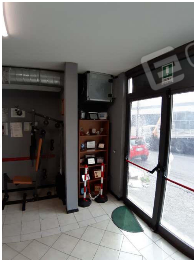
FOTO 1 - Ingresso A.s.d. New Evolution