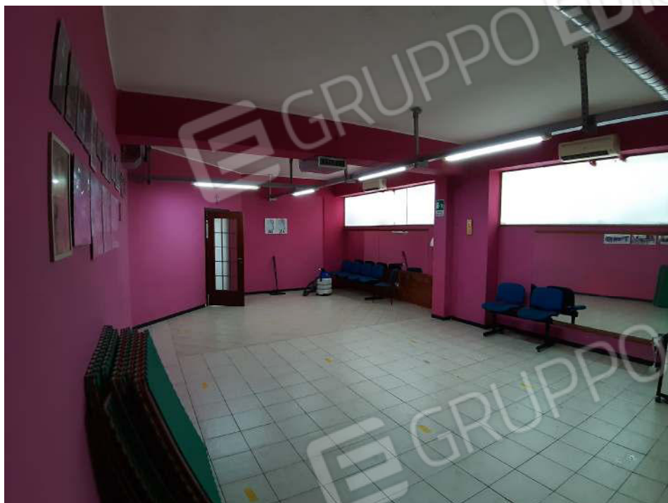
FOTO 14 - Sala da ballo 1