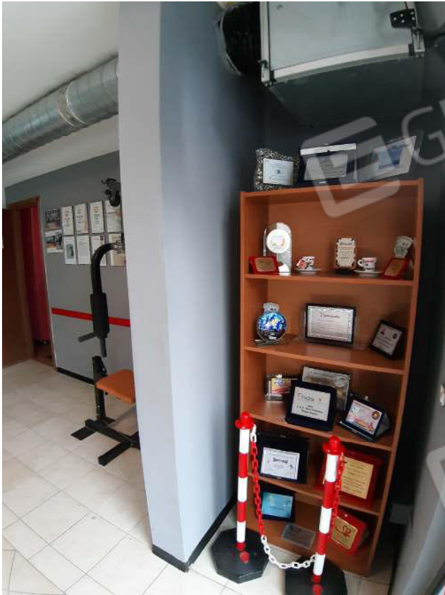
FOTO 2 - Ingresso