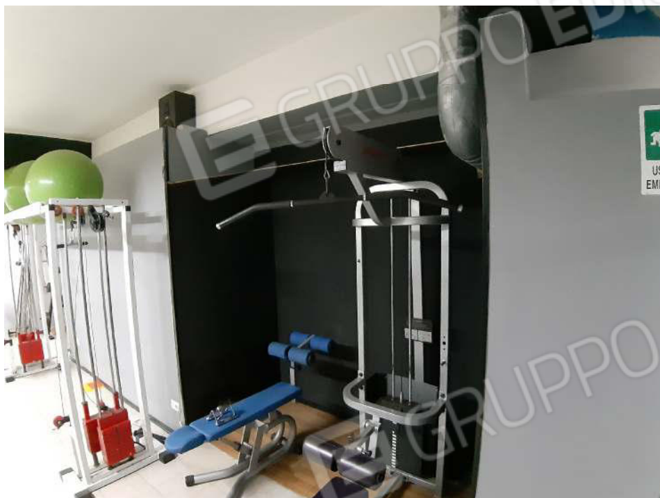
FOTO 16 - Sala attrezzi