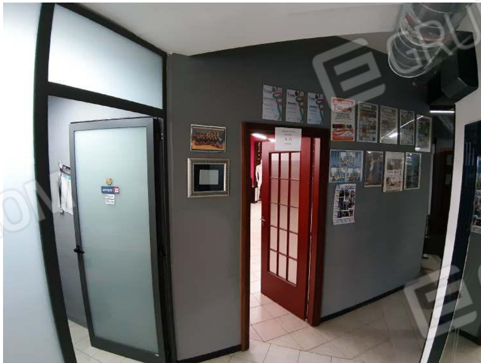
FOTO 6 - Disimpegno