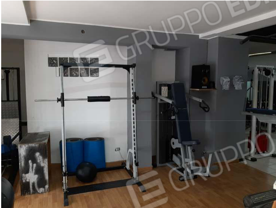
FOTO 20 - Sala attrezzi