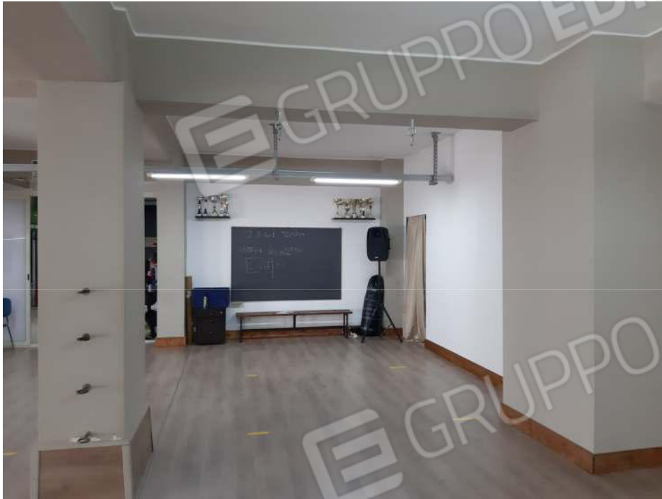
FOTO 30 - Sala da ballo 2