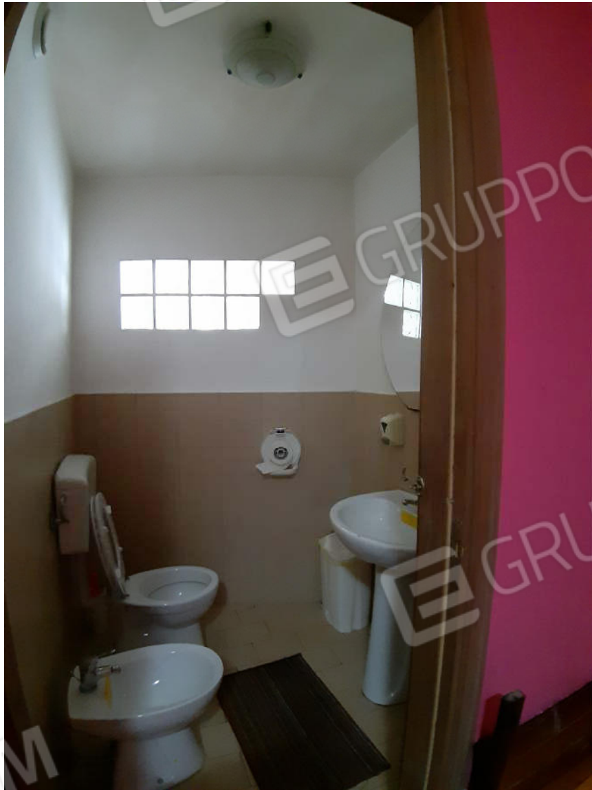
FOTO 11 - Wc spogliatoio 1