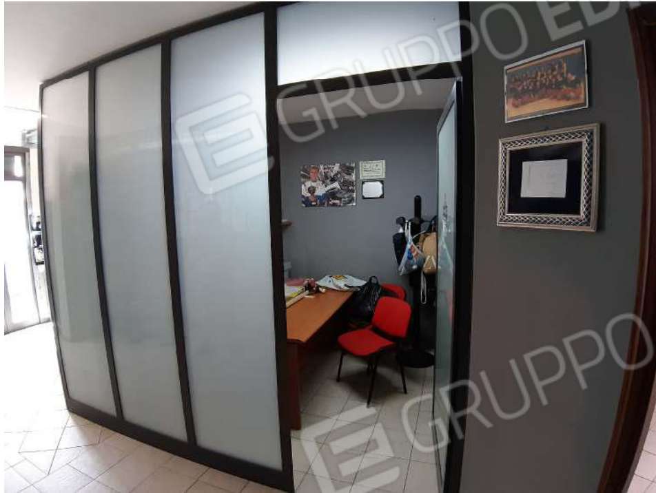
FOTO 5 - Ufficio