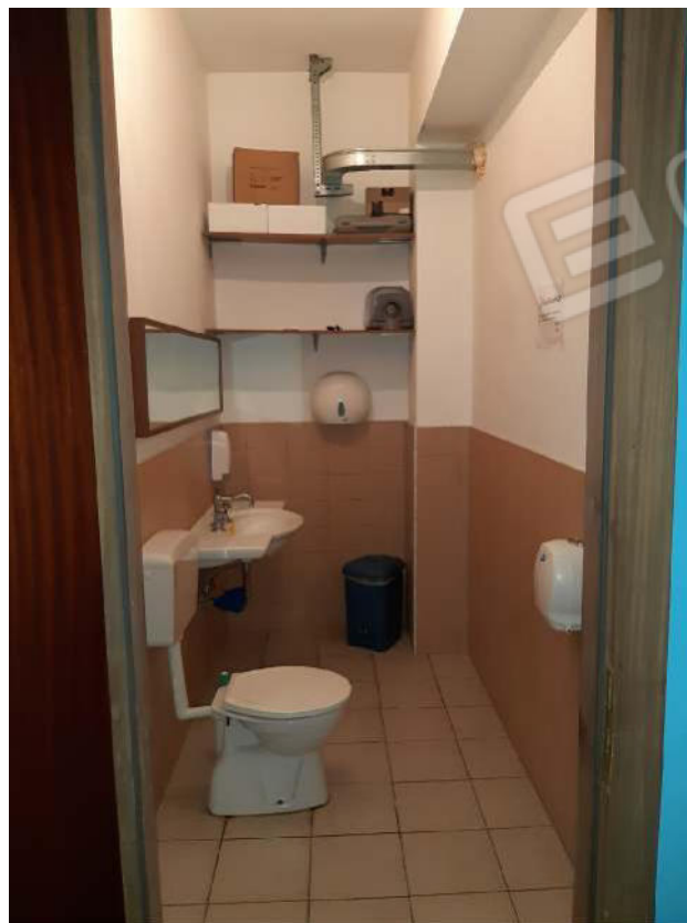
FOTO 25 - WC spogliatoio 2