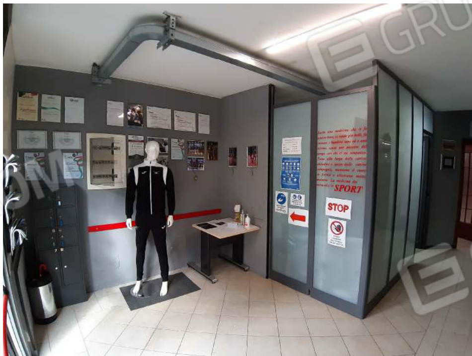
FOTO 4 - Ingresso